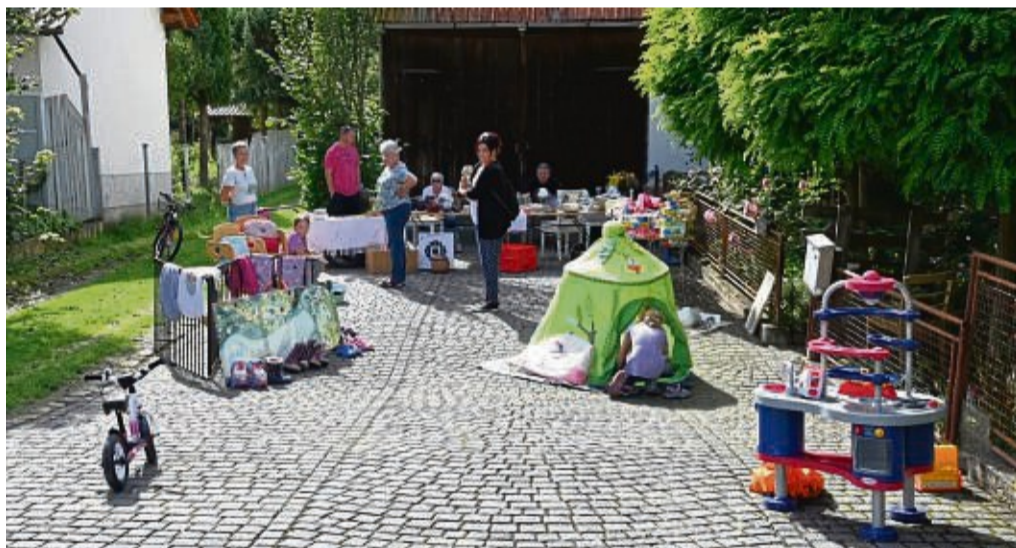
Große Auswahl: Über den ganzen Ort verteilt, nahmen knapp 30 Stände in Ostheim am ersten Dorfflohmmarkt teil.

Dort waren die Anbieter größtenteils begeistert: „Ich wollte so viel verkaufen, dass