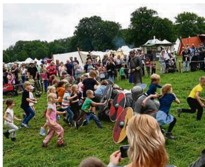
Ansturm der Kinder: Voller Eifer stürmten die Kinder auf die Ritterschar zu, um deren Schutzwall zu durchbrechen. Woran die Erwachsenen scheiterten, gelang selbstverständlich den Kindern.

Und so war es eine Pracht, an den zahlreichen Ständen vorbeizuflanieren, sich von Stockbrot und Waldmeisterbier verführen zu lassen, Blumenkränze, Kettenhemden und Umhänge anzuprobieren oder sich zum Beispiel beim Bogenschießen oder Hau-den-Lukas zu beweisen. Ritter demonstrierten ihr kämpferisches Können, stellten sich der „angreifenden“ Kinderschar und posierten