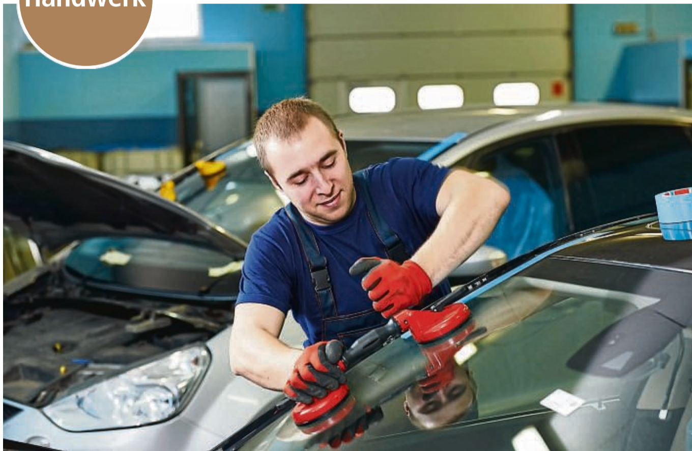
Das Handwerk steht für Vielfalt: Am 16. September wird das große Leistungsspektrum gezeigt.