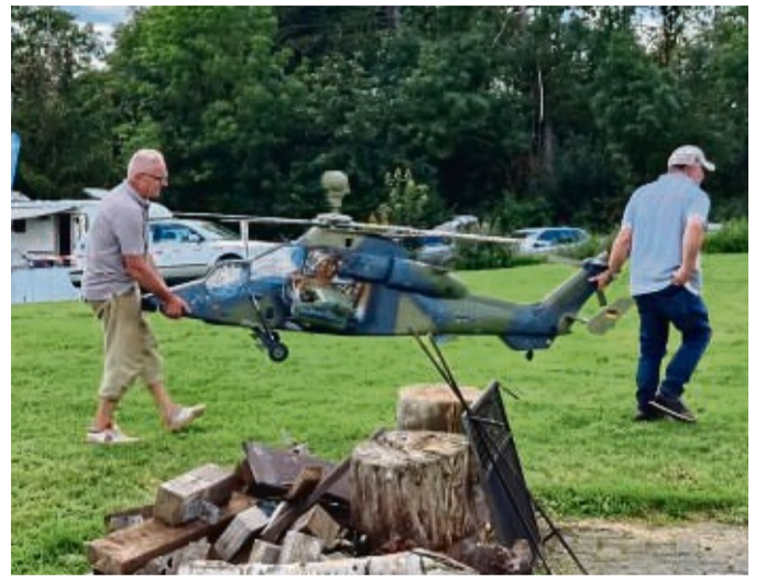
Kleine Raubkatze: Beim RC-Heli-Treffen sorgte ein Modell des Bundeswehr-Kampfhubschraubers Tiger, der in Fritzlar stationiert ist, für Aufsehen.