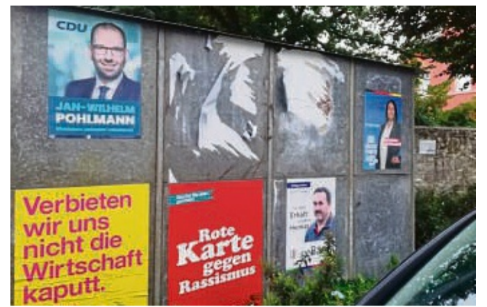
Zwei Wahlplakate abgerissen: SPD und Grüne haben Anzeige gegen Unbekannt wegen Sachbeschädigung erstattet.