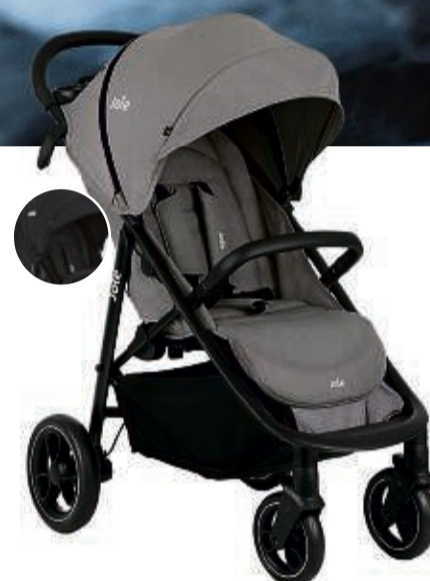
Joie Sportwagen „Litetrax“ auch in schwarz, für Kinder bis ca. 4/5 Jahre (max. 22 kg), Flex-Komfort-Sitz, gefederte EVA-Räder, ShoeSaver- Bremse, mit Einhand-Faltme- chanismus & automatischer Faltverriegelung (UVP 239,99*) 169,99