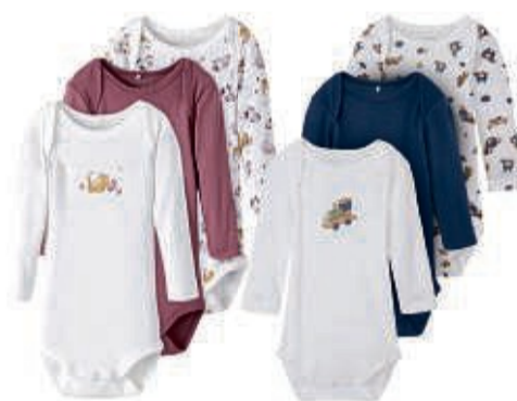
name it' Baby Bodies für Mädchen und Jungs, Gr. 50 – 86 (UVP 22,99*) (UVP 19,99*) 12,99