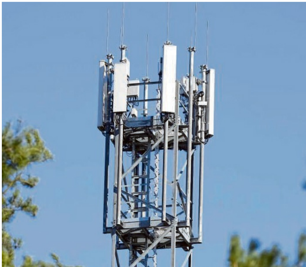
Mast mit Mobilfunk-Antennen: Mehr Daten zur Netzabdeckung im Landkreis sollen dabei helfen, Druck auf die Bundesnetzagentur aufzubauen.

„Meines Wissens konzentrieren sich diese Messungen aber nur auf die Landesstraßen. Wir werden allerdings durch all diejenigen, die da jetzt ein bisschen messen oder irgendwelche Karten online stellen, nie die reale Abdeckung bis in den letzten Winkel unseres Landkreises