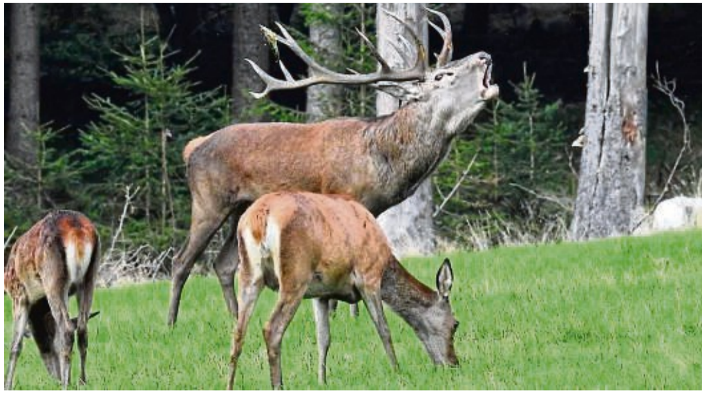
Hirsch röhrt: Der Herbst bietet jetzt in unseren Wäldern, aber auch in den Wildgehegen mit Rotwild wieder ein spektakuläres Naturereignis: die Hirschbrunft.

Daneben kann man das Naturspektakel der Hirschbrunft zum Beispiel in Wildgehegen wie im Wildpark am Edersee oberhalb der Sperrmauer, im Wildpark in Frankenberg am Goßberg, im Wildgehege bei Dodenau und im Wildgehege oberhalb von Willingen erleben.