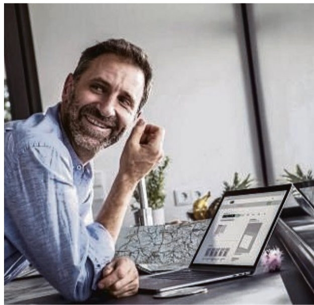
Ein Tausch der Fenster rechnet sich immer, wenn zu Hause Energie gespart werden soll.

Stattdessen sollten Immobilienbesitzer im ersten Schritt überprüfen, ob die Dämmung der Gebäudehülle nach den aktuellen Standards ausgeführt ist. Das reduziert die später benötigte Heizleistung beträchtlich. Empfehlenswert sind zuerst eine gute Dach- und Außenhautdämmung sowie ein Tausch der Fenster. Diese haben einen erheblichen Anteil an der Wärmeeinsparung. Hier spielt der sogenannte U-Wert der Profile