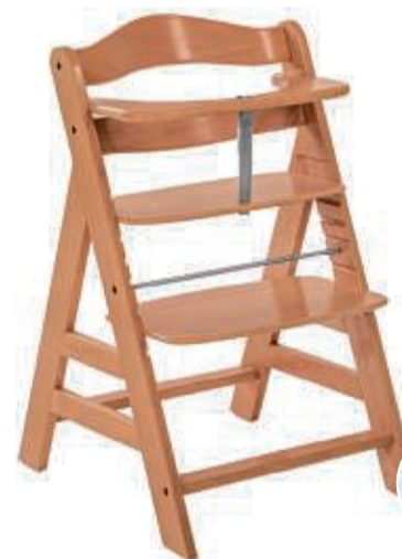
hauck Hochstuhl „Alpha+“ in 3 Farben, Buchenholz, ab ca. 6 Monaten bis 90 kg, inkl. 5-Punkt-Sicherheitsgurt, wächst mit der Größe des Kindes mit UVP 99,99 white grey