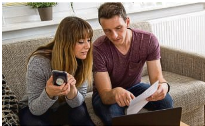
Es ist ratsam, eine Vertrauensperson zu benennen, die im Falle der eigenen Entscheidungsunfähigkeit handeln kann.

Dennoch raten die Experten, jeder Person ab 18 Jahren