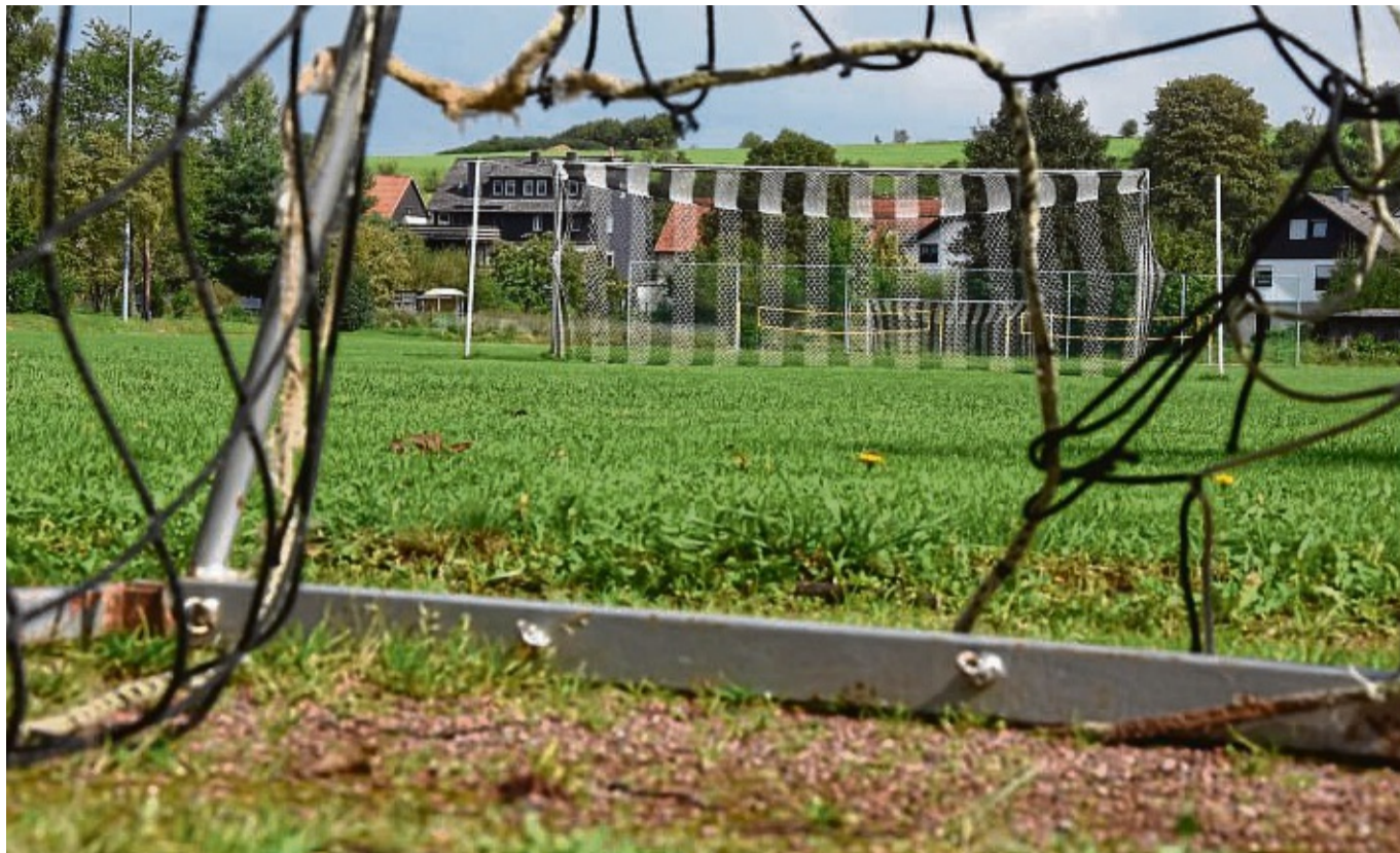
Die jahrzehntealte Sportanlage in Vöhl wird von verschiedenen Gruppen rege genutzt, ist aber aus der Sicht des Vereins und der Gemeinde in schlechtem Zustand. Der TSV will, dass sie aufwendig erneuert wird.

Die Enttäuschung darüber, dass die Gemeinde das Geld