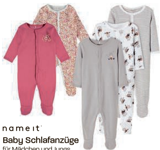
name it' Baby Schlafanzüge für Mädchen und Jungs, Gr. 50 – 86 (UVP 32,99*) (UVP 24,99*) 12,99