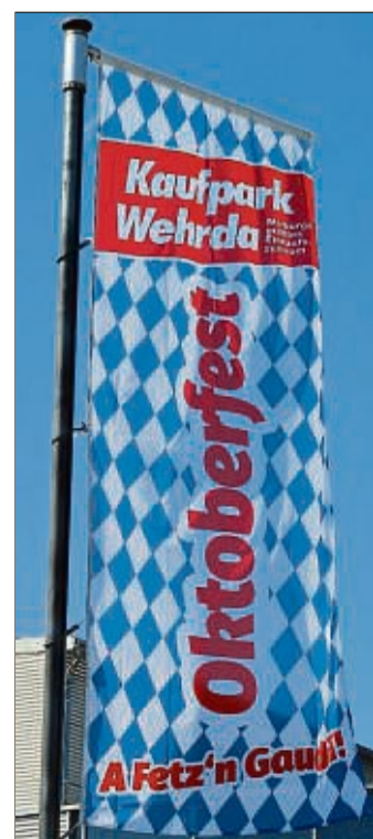
Der Werbekreis des Kaufparks Wehrda freut sich darauf, »A Fetz'n Gaudi!« mit den Besuchern feiern zu können.

Der Werbekreis Kaufpark Wehrda freut sich auf Ihren Besuch und wünscht viel Glück bei der Teilnahme!