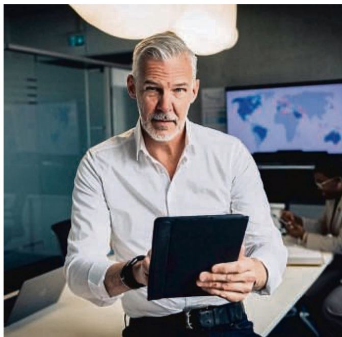
Intelligent, wortgewandt, selbstbewusst: Wann Menschen im Job charismatisch wirken, hängt immer auch vom Auge des Betrachters ab.

Mitunter reicht aus seiner Sicht auch das Zusammenreffen von zwei Komponenten, um als charismatisch zu gelten – etwa Macht und Wärme. Macht bedeutet in diesem Zusammenhang, dass je-