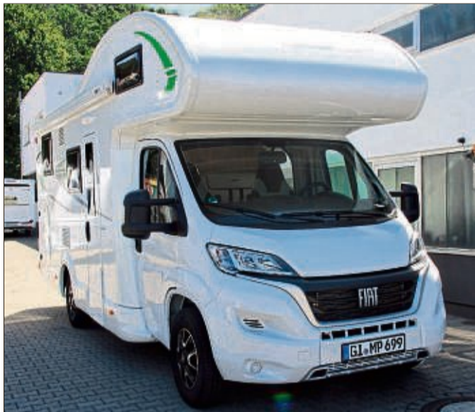
Bereit für ein Abenteuer? Mit einem Wohnmobil von MP Camping Marburg bietet sich jetzt DIE Gelegenheit, 10 Tage lang die mobile Reisefreiheit zu testen.

Ein Riesenvorteil des Kaufparks – auch gegenüber den innerstädtischen Angeboten in Marburg selbst – ist, dass alle Geschäfte zentral erreichbar sind und eine optimale Verkehrsanbindung durch die B3