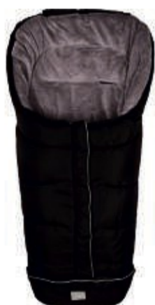
filikid Winter- Fußsack „K2“ Wind- und wasser- abweisendem Polyester, Innenseite aus beson- derem weichen Pongee Material, auch als Krabbel- decke verwendbar UVP 39,99