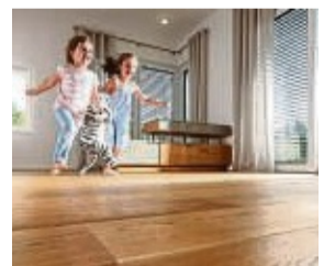
Mit einem geölten Parkettboden holt man sich die Natur ins Haus.

Kleine Beschädigungen lassen sich auf diese Weise leicht ausbessern, gleichzeitig werden die Farbnuancen und die Struktur des Holzes attraktiv hervorgehoben. Durch regelmäßiges Nachölen bleibt der Wert und die Nutzbarkeit des Parkettbodens über viele Jahre erhalten. Zusätzlich zu den pflegenden Eigenschaften erzielt das Produkt eine deutliche Reduktion des CO 2 -Ausstoßes um rund 60 Prozent im Vergleich zu bisherigen Produkten. Grund dafür ist neben dem regionalen Anbau die Herstellung des Hanföls. Dieses wird kaltgepresst und nicht aufwendig chemisch weiterverarbeitet. Wenn es um nachhaltige Pflege schöner Holzböden geht, sind Parkettprofibetriebe vor Ort die richtige Anlaufstelle. djd