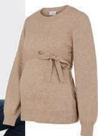
mama:licious Umstands-Pulli in grau und beige (UVP 34,99*) 25,99