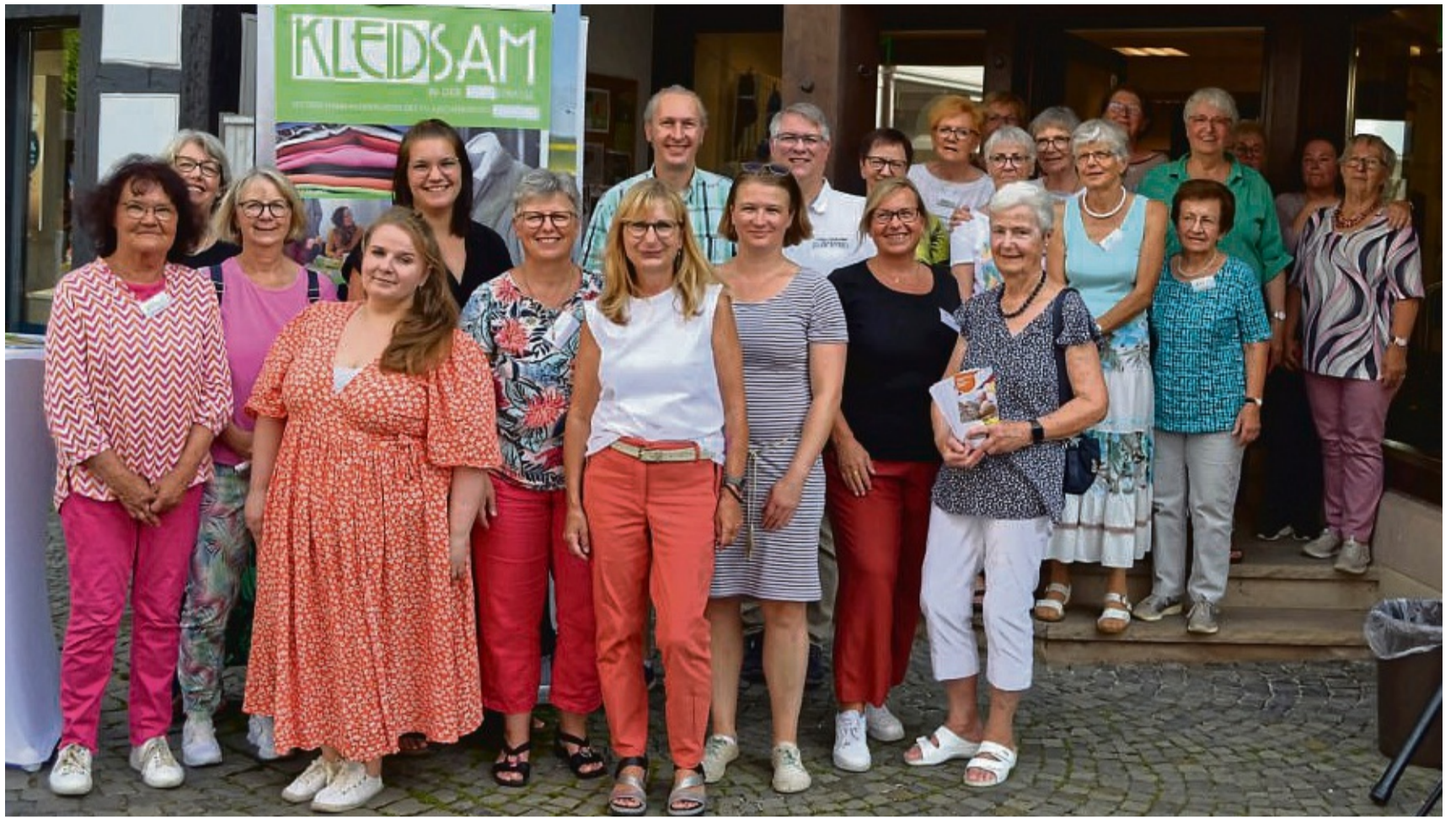
Zum zehnjährigen Bestehen: Das Ehrenamtliche des Kleidsam-Teams feierten mit Organisationen, an die ihre Spenden gingen.