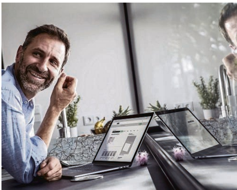
Ein Tausch der Fenster rechnet sich immer, wenn zu Hause Energie gespart werden soll.

Stattdessen sollten Immobilienbesitzer im ersten Schritt überprüfen, ob die Dämmung der Gebäudehülle nach den aktuellen Standards ausgeführt ist. Das reduziert die später benötigte Heizleistung beträchtlich. Empfehlenswert sind zuerst eine gute Dach- und Außenhautdämmung sowie ein Tausch der Fenster. Diese haben einen erheblichen Anteil an der Wärmeinsparung. Hier spielt der sogenannte U-Wert der Profile eine wichtige Rolle. Je kleiner er ist, desto weniger