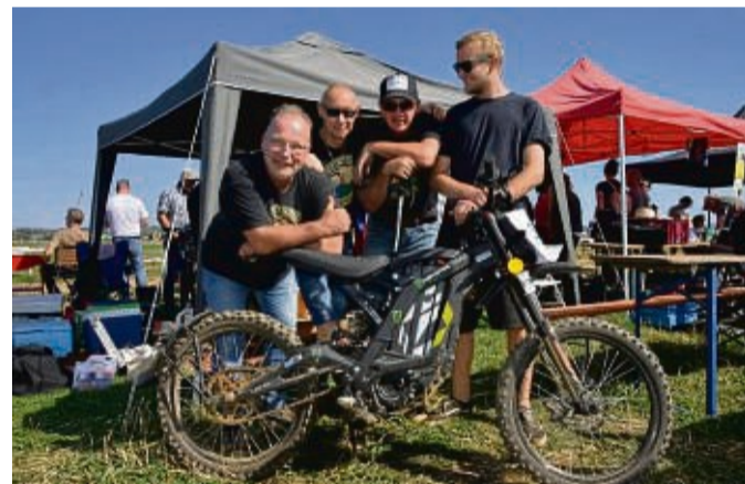
Das Team „Oldschool Hooligans“ ging mit einem Elektro-Moped an den Start.