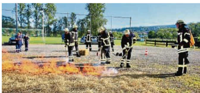
Im Team: Mit Wasser aus dem Waldbranddrucksack wurde beim Stadtfeuerwehrtag in Obermelsungen ein simulierter Flächen- und Waldbrand gelöscht.