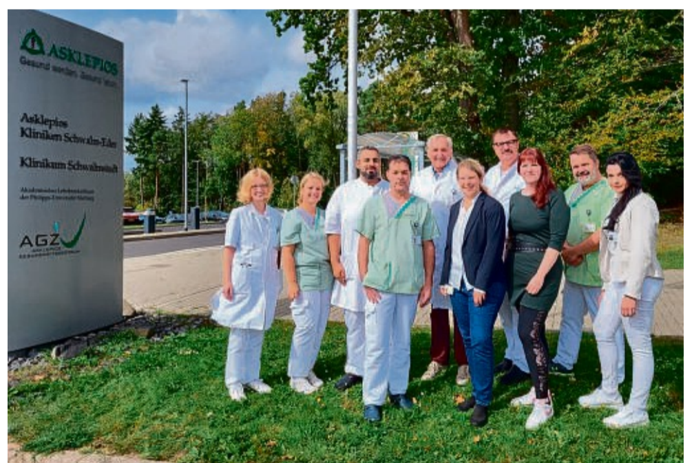
Das Team der Geriatrie und die Pflegedirektion freut sich, dass ab Oktober auch teilstationäre Patienten in einer geriatrischen Tagesklinik am Klinikum Schwalmstadt aufgenommen werden können.

Die neue Tagesklinik ist integraler Bestandteil des Fachbereichs für Altersmedizin. Die Räumlichkeiten der Geriatrie wurden zur Einrichtung der teilstationären Betreuungsplätze umstrukturiert und entsprechend umgebaut. Somit stehen auf der Station nun mehrere zusätzliche helle Räume für insgesamt 14 Patienten zur Verfügung. Wer Mittagsruhe halten möchte, kann in einem gemütlich eingerichteten Ruheraum