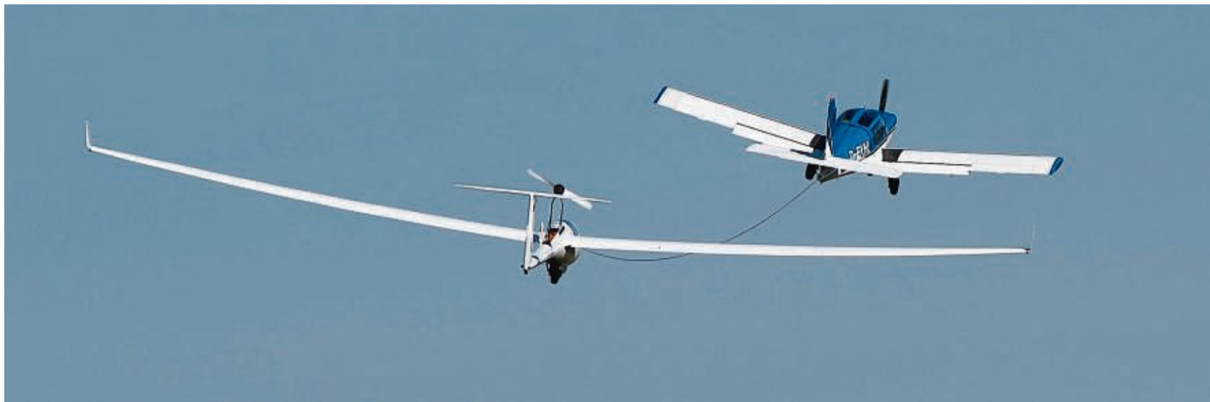
Ein Motorflugzeug zog am Samstag den zweiseitigen Segelflieger – selbst mit einem Elektroantrieb ausgestattet – in die Luft.

Wer einmal die Umgebung aus der Luft erleben wollte, hatte für Rundflüge die Qual der Wahl – zwischen Hub-schrauber, Tragschrauber, ei-