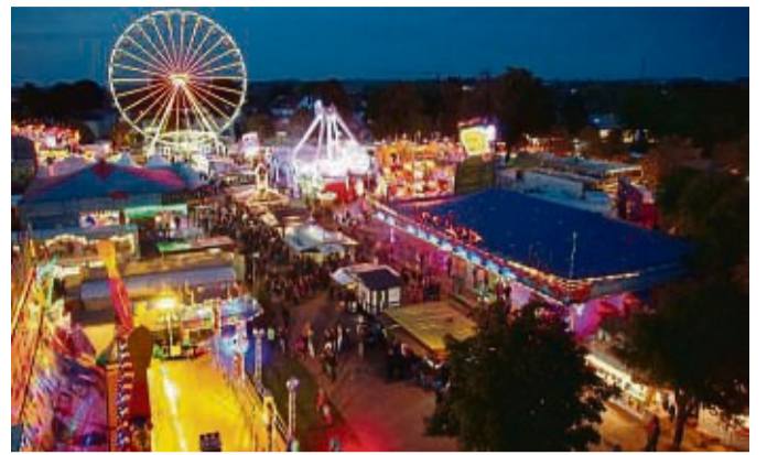
Bald wird in Warburg wieder gefeiert: Am 30. September beginnt die 74. Warburger Oktoberwoche.

Am Samstag, 30. September, werden die altherwürdigen Schätzchen mit ihren stolzen Besitzern in gemütlichem Tempo bei hoffentlich strahlendem Sonnenschein