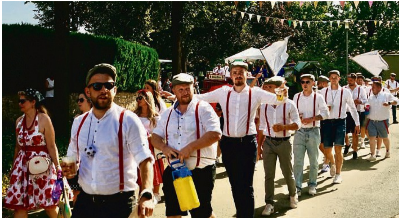
Zogen paarweise durch den Ort: die Frauen und Männer des Kirmesclubs in ihren Kostümen.