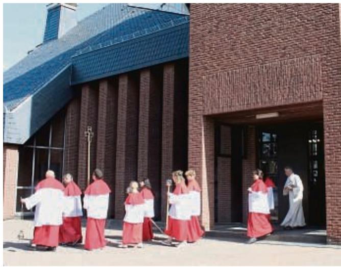
Kirchweihfest: Auszug der Würdenträger und Messdiener nach dem Festhochamt in der katholischen Kirche Zierenberg.