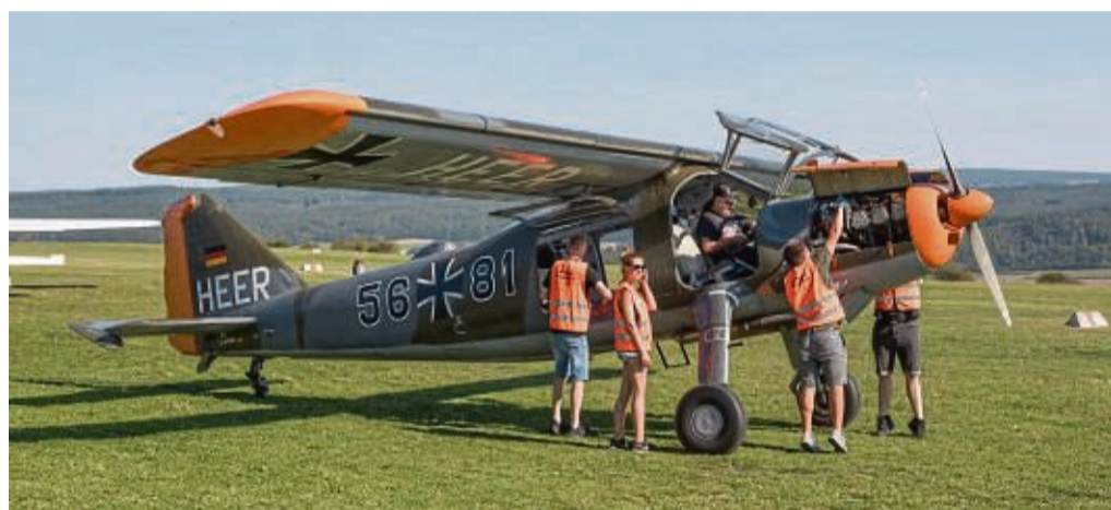
Rundflüge mit der DO 27 – früher in Diensten der Bundeswehr – waren auch in diesem Jahr wieder gefragt. Hier bereitet das Begleitteam die Maschine für einen Start vor.

nem zweiseitigen Segelflugzeug des Luftsportvereins Hofgeismar und natürlich den Maschinen der Hölleberg-Piloten vom Kiebitz über Ultraleichtflieger bis zur Cessna.