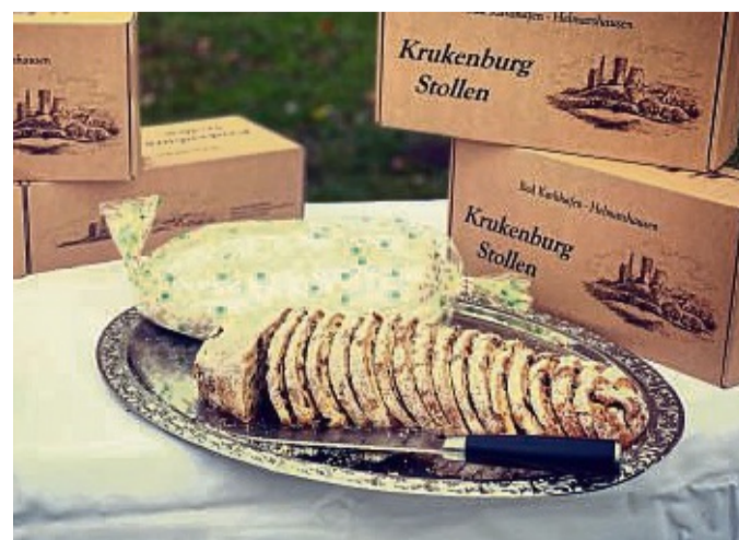
Krukenburg-Stollen kann wieder vorbestellt werden.

Der Krukenburg-Stollen kann über den Online-Shop auf www.bad-karlshafen-tourismus.de bestellt werden. Wer nicht im Internet unterwegs ist, kann den Stollen auch telefonisch unter der Rufnummer 05672/922 6140 in der Bad Karlshafener Tourist Information vorbestellen.