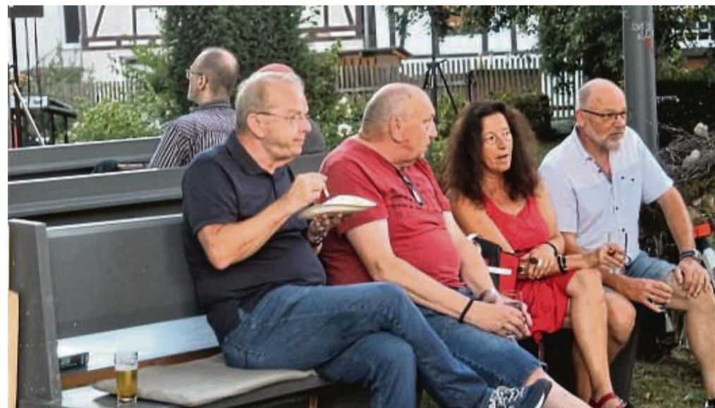
Bis zum Wechsel an die neuen Besitzer entspannten sich die Besucher auch auf den alten Kirchenbänken.