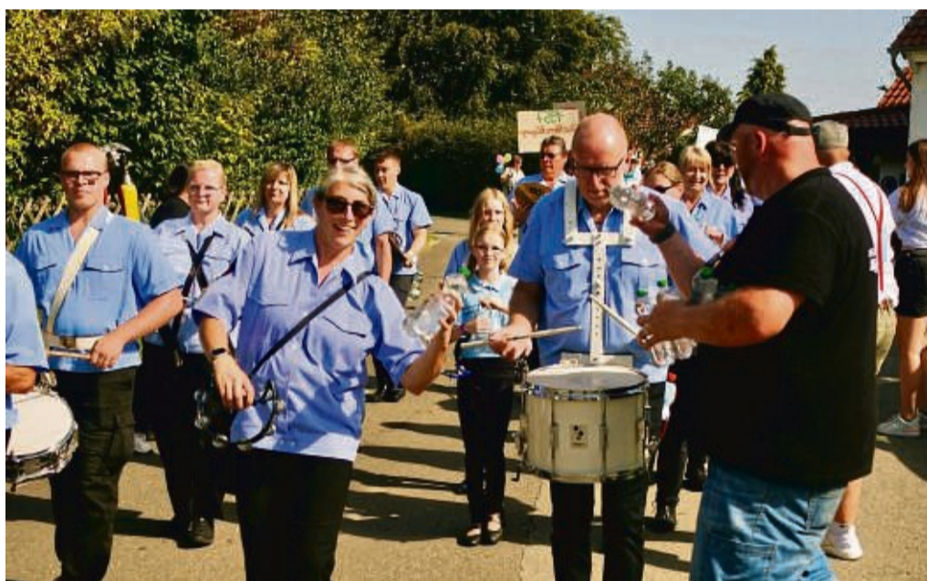
Abkühlung hatten auch die Musiker des Spielmannszugs der Feuerwehr aus Wolfhagen nötig.

Um dem Motto ausreichend Aufmerksamkeit zu geben, hatten sich auch die örtlichen Vereine angepasst. So betonte zum Beispiel der ortsansässige Landfrauenver-