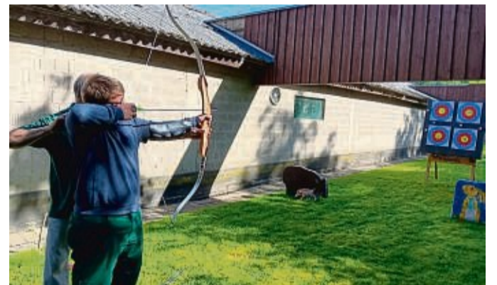
Spaß beim Bogenschießen: Die Turn- und Musikgemeinschaft Grebenstein veranstaltete ihr Vereinszeltlager mit sportlichen Aktivitäten.