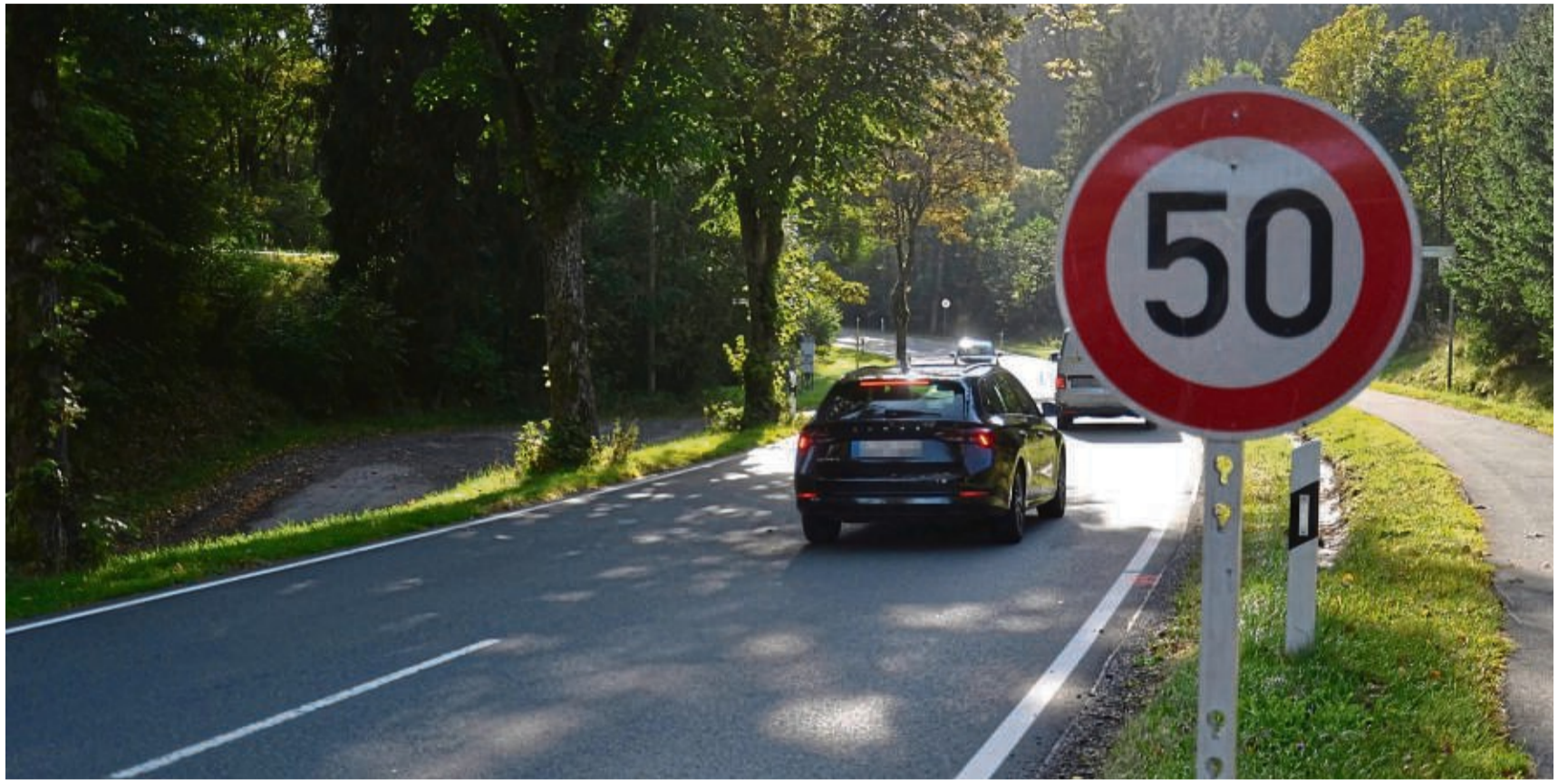
50 statt 100: Zwischen dem Wakenfeld und Usseln sorgt ein Tempolimit weiterhin für Unmut.