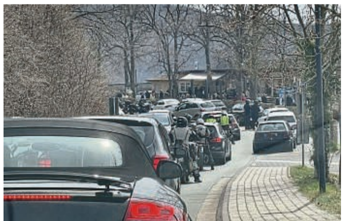
Ein Thema beim „Bürgerdialog“ ist die viel befahrene Randstraße am Edersee. Hier ein Stau an Ostern.

Der Fachdienst Bauen der Kreisverwaltung arbeitet mit verschiedenen Partnern an dem Verkehrskonzept. Die Touristiker haben in einer internen Runde bereits debattiert. Jetzt will die Kreisverwaltung auch andere Meinungen einholen: Alle Interessenten sollen beim „Bürgerdialog“ mitdiskutieren