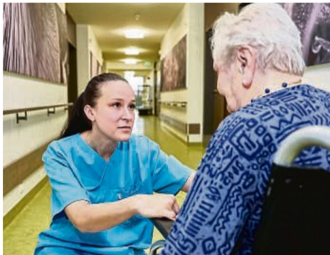
Pflegekräfte werden gebraucht: Wer mit einem ausländischen Abschluss in Deutschland arbeiten will, muss erst ein aufwendiges Verfahren durchlaufen.

Die Antragsteller erhalten dann einen sogenannten Defizitbescheid mit der Auflage, an einer Ausgleichsmaßnahme teilzunehmen, um die