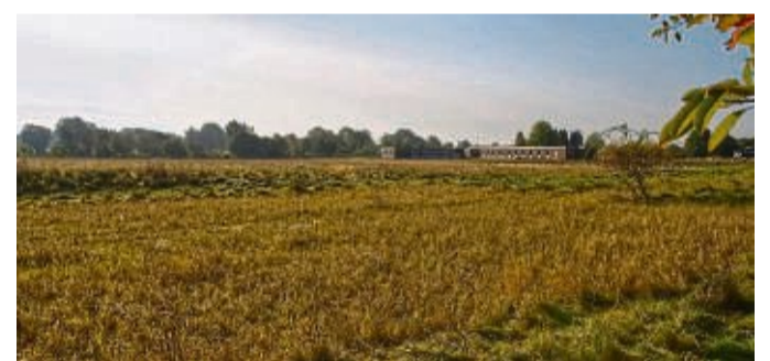
Die VEW plant eine große Freiflächen-Photovoltaikanlage auf einem Gelände nördlich der ehemaligen Belgischen Kasernen in Korbach.