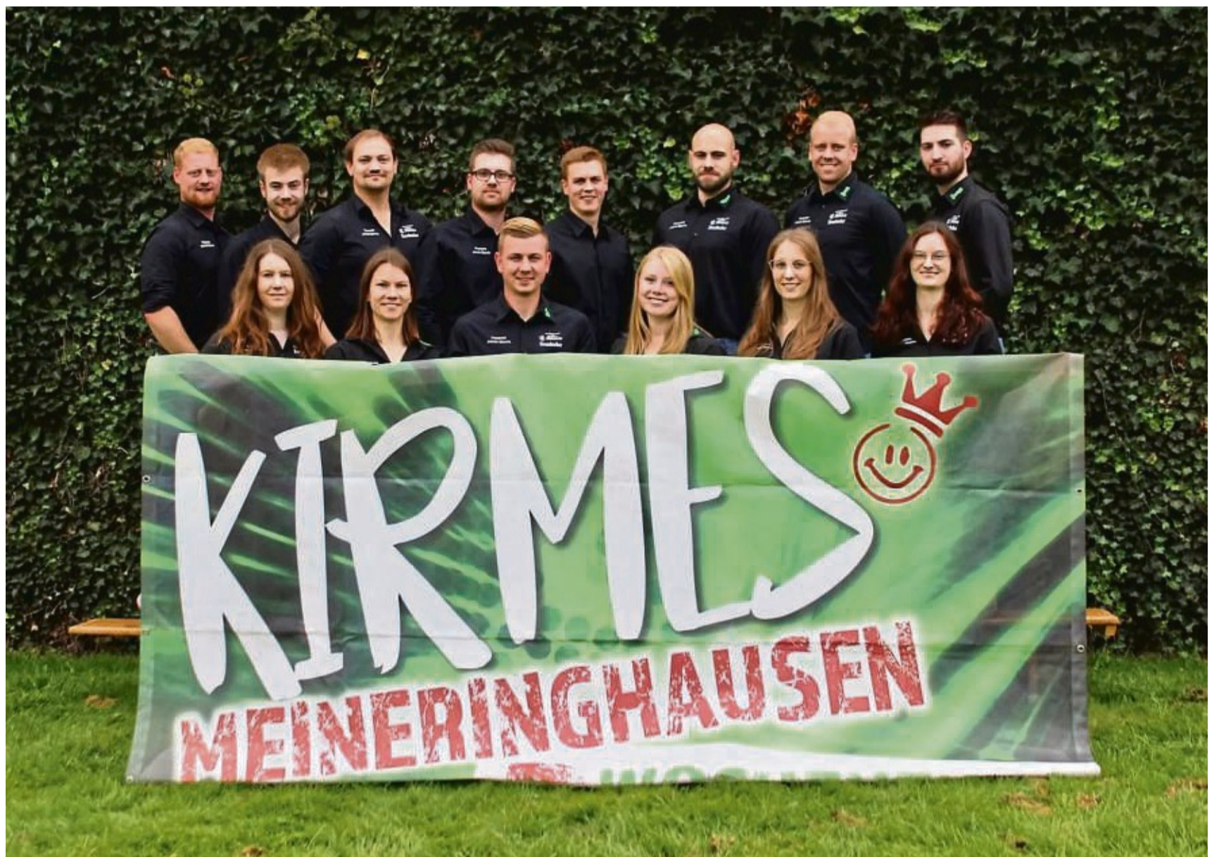
Die Kirmesburschen und -mädeln aus Meininghausen laden zu ihrer Kirmes ein.

Begleitet wird der Festzug vom Spielmanns- und Musikzug aus Adorf. Im Anschluss klingt der Sonntag bei Kaffee und Kuchen mit musikalischer Unterhaltung in der Walmehalle aus. Für die kleinen Gäste wird Kinderschminken angeboten. Am