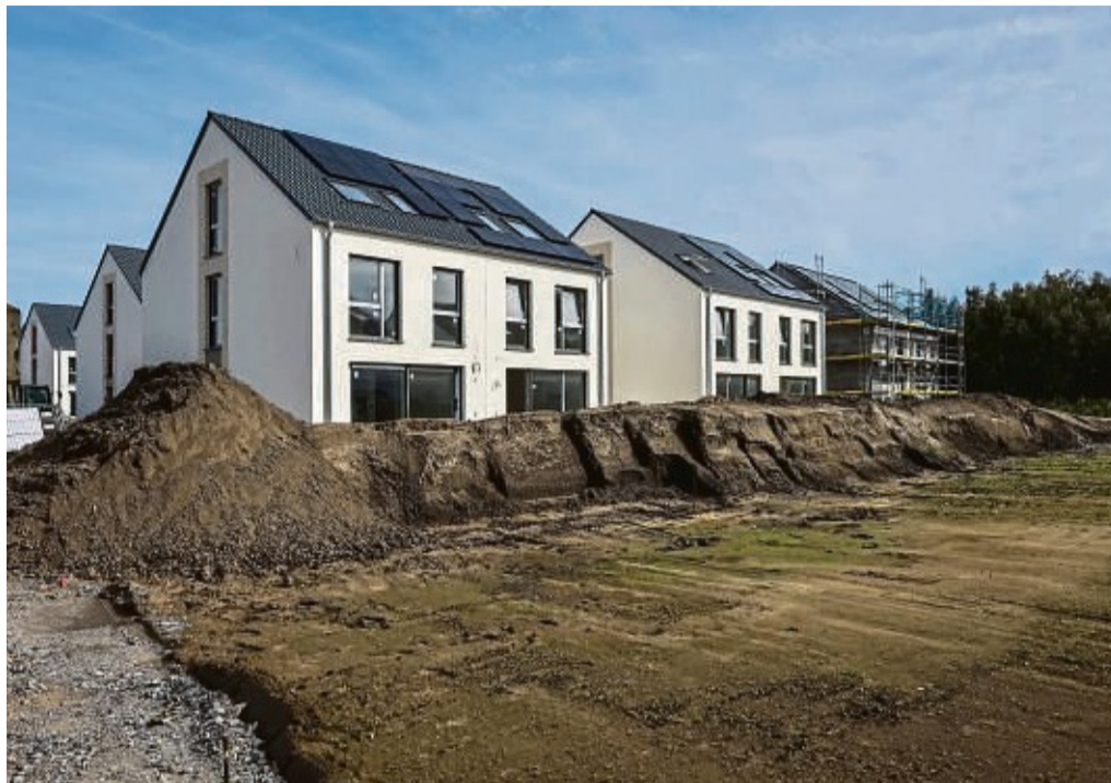
Bis zu 20 Prozent sind die Preise für Bauplätze in den Dörfern gestiegen.

Die Preise für Bauplätze hingegen sind laut den vorliegenden Zahlen im Vergleich zum Vorjahr gestiegen. In den dörflichen Regionen zeichnet sich für das Jahr 2023 eine Preissteigerung von etwa 20 Prozent ab. In der Nähe der Mittelzentren sind die Preise im Vergleich zum Jahr 2022 um bis zu zehn Prozent gestiegen. Ackerland verzeichnet derzeit ebenfalls steigende Bodenpreise, während die Preisentwicklung bei Grünland leicht rückläufig ist. „Diese