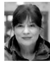
Ulla Meinecke Sängerin und Autorin

Waldeck-Frankenberg – Die Sängerin, Dichterin und Autorin Ulla Meinecke gastiert am Samstag, 21. Oktober, um 19.30 Uhr im Begegnungs- und Kulturzentrum Kloster Bredelar.