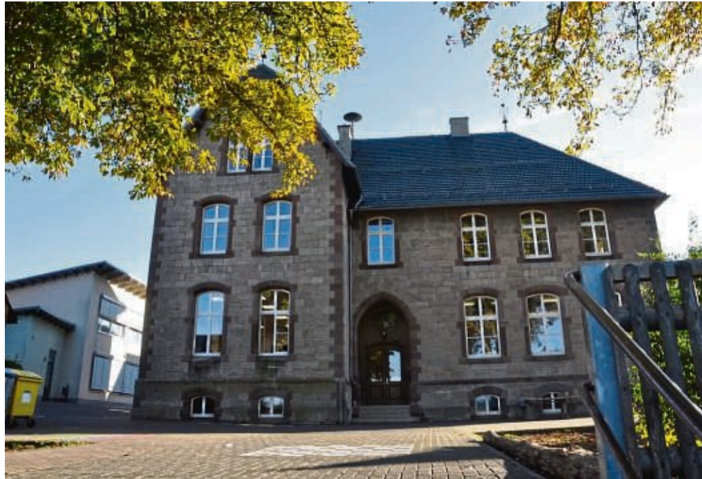
Die alte Grundschule in Goddelsheim könnte sich zu einem Gesundheitszentrum oder Mehrgenerationenhaus wandeln.

Der Landkreis Waldeck-Frankenberg werde die Entwicklung in seiner neuen