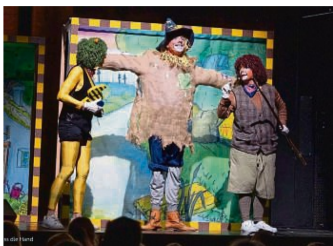
Das Kindermusical zum Kinofilm „Janosch – Oh wie schön ist Panama“ wird am Montag, 16. Oktober, um 16 Uhr in der Stadthalle in Korbach aufgeführt.

Dort finden sie tatsächlich die ersehnten Bananen – doch in Wirklichkeit sehnen sich die Abenteurer nach etwas anderem: ihrem Zuhause. Karten zum Preis von 10 bis 14 Euro gibt es in der Korbach-Information, Prof-Bier-Straße 15, oder online: korbach.reservix.de.