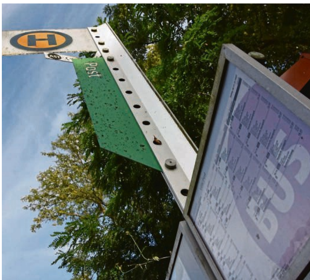
Ärgerlich: Busfahrten fallen aus, und es kommt zu Verspätungen.

Sofern die Information zu ausfallenden Fahrten rechtzeitig vorliegt, werde diese in die Fahrgastinformationssysteme eingepflegt und sei dann im Internet über nvv.de/fahrplanauskunft und auch über die NVV-App abruf-