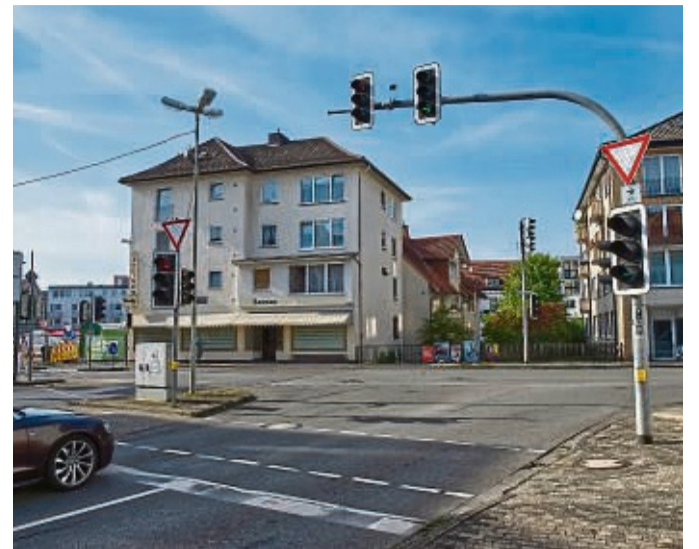
Die Kreuzung Heerstraße/Arolser Landstraße: Die Stadt prüft, ob die Einführung eines Grünen Pfeils an Ampeln in Korbach den Verkehrsfluss verbessern könnte.

Die Regel besagt, dass Autofahrer bei einem Grünen Pfeil ähnlich wie bei einem Stoppschild warten müssen. Nach zweimaligem Halten an der Haltelinie und der Sichtlinie dürfen sie nach rechts abbiegen, wenn die Straße frei ist. Wer den Grünen Pfeil wie eine grüne Ampel behandelt und ohne anzuhalten durchfährt, riskiert ein Bußgeld von bis zu 70 Euro und einen Punkt in Flensburg. Autofah-