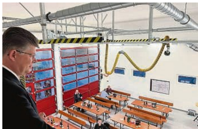
Blick in die Fahrzeughalle kurz vor der Eröffnung.