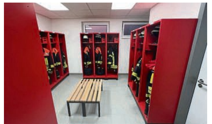
Blick in die Umkleidekabine der acht Feuerwehrfrauen. Insgesamt umfasst die Einsatzabteilung in Schmillinghausen 35 Feuerwehrleute.

Das neue Feuerwehrhaus am Schmillinghäuser Sportplatz ist feierlich seiner Bestimmung übergeben worden.