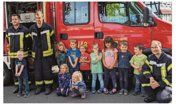
Hatten sichtlich Spaß: Die Kinder der Kita Rabennest hatten Besuch von der Feuerwehr.

Wir würden uns freuen, wenn wir mit dieser Mitteilung einen kleinen Beitrag zum Tierschutz leisten können und vielleicht einige Besitzer bereit sind, ihre Freigänger kastrieren zu lassen. Wir bedanken uns für Ihr Verständnis. red