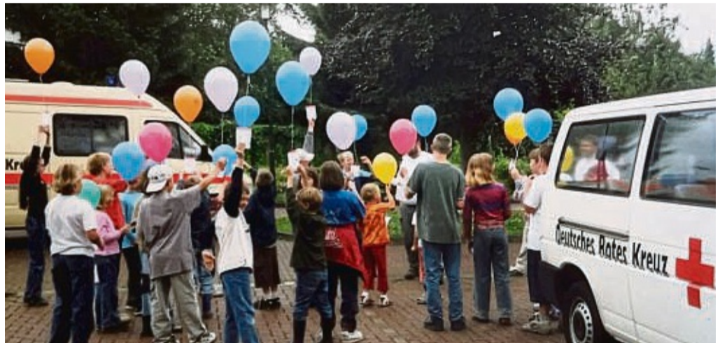
Das Jugendrotkreuz Reichensachsen feiert Jubiläum. Seit 50 Jahren werden hier Kinder und Jugendliche im Alter zwischen sechs und 27 Jahren ausgebildet.

Der Ortsverein Reichensachsen plant daher ein Fest anlässlich des Jubiläums und der Einweihung der Unterkunft. Am Sonntag, 1. Oktober, wird es ab 11 Uhr am Steinweg 84 in Reichensachsen ein vielfältiges Programm geben. Neben einer Praxisstation für Erste-Hilfe-Maßnahmen und der Ausstellung der Fahrzeuge wird es auch ein Mitmach-Angebot für Kinder geben, zum Beispiel Kinderschminken und eine Hüpf-