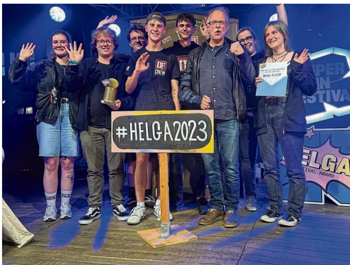
Sind überglücklich: Das Team des Open-Flair konnte zum dritten Mal in Hamburg den Preis für das „Beste Festival Deutschlands“ entgegennehmen.

Die Macher und Macherinnen hätten erneut bewiesen, dass sie das beste Festival sind und auch Festival-Fans waren sich demnach in allen Public Voting Runden einig, dass es den Award erneut erhalten soll, heißt es in einer Mitteilung des Helga-Festival-Awards. In den Vorjahren haben bereits Nature One, Haltern Pop und A Summer's Tale den die Publikumsabstimmung – und somit die Königsdisziplin – für das beste Festival des Jahres gewonnen. Alle anderen Kategorien werden von einer Fachjury ausge-