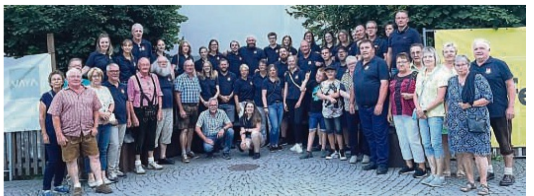
Der Fanfaren- und Musikzug Frankershausen unternahm eine Konzertfahrt ins Tiroler Pfunds.

Obwohl der Fanfaren- und Musikzug bereits seit 15 Jahren immer wieder Gast des Festes ist, war es wieder eine bereichernde Fahrt. Insbesondere die Teilnahme am Festumzug, der anschließende Auftritt im Festzelt, sowie ein Konzert im Biergarten des Posthotels, welches dem Fanfaren- und Musikzug als Unterkunft diente, stellten musikalische Highlights dar. Auch außerhalb des Musikali-