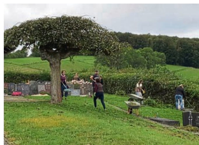
25 Freiwillige helfen mit: Unter anderem wurde der Friedhof von Wölfterode in Ordnung gebracht.