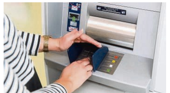
Wer die Zahlenkombination der PIN mit Geschichten und Bildern verknüpft, kann sie sich leichter merken.