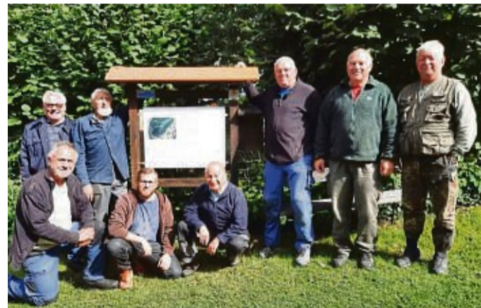
Freiwilligentag in Wichmannshausen: Überschaubare neun Freiwillige kamen zusammen.