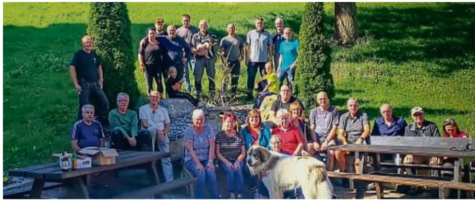
Schnitten Hecken und reparierten Bänke: In Weißenborn haben 31 Freiwillige einen Vormittag kräftig angepackt.