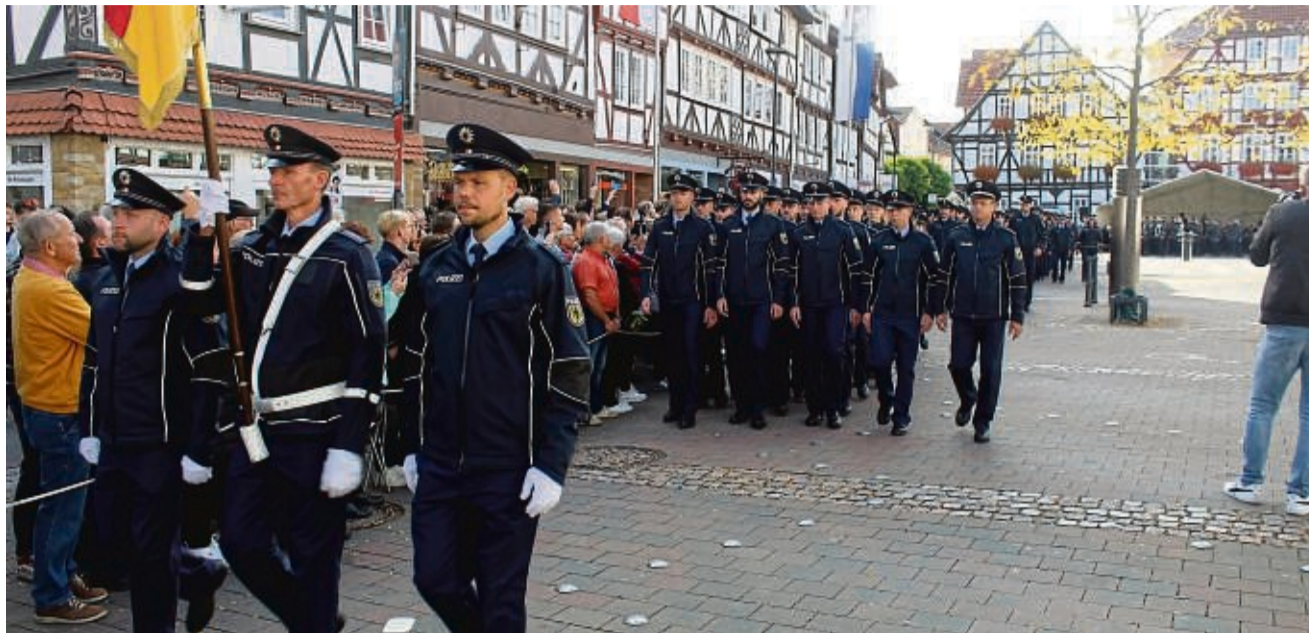
165 junge Frauen und Männer haben ihren Eid abgelegt: Nach der Zeremonie ging es für die neuen Anwärterinnen und Anwärter in die Stadthalle in Eschwege.