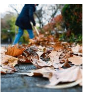
Weg mit den Blättern: Grenz ein Gehweg ans Grundstück, geht die Räumspflicht dort oft auf dessen Eigentümer über.