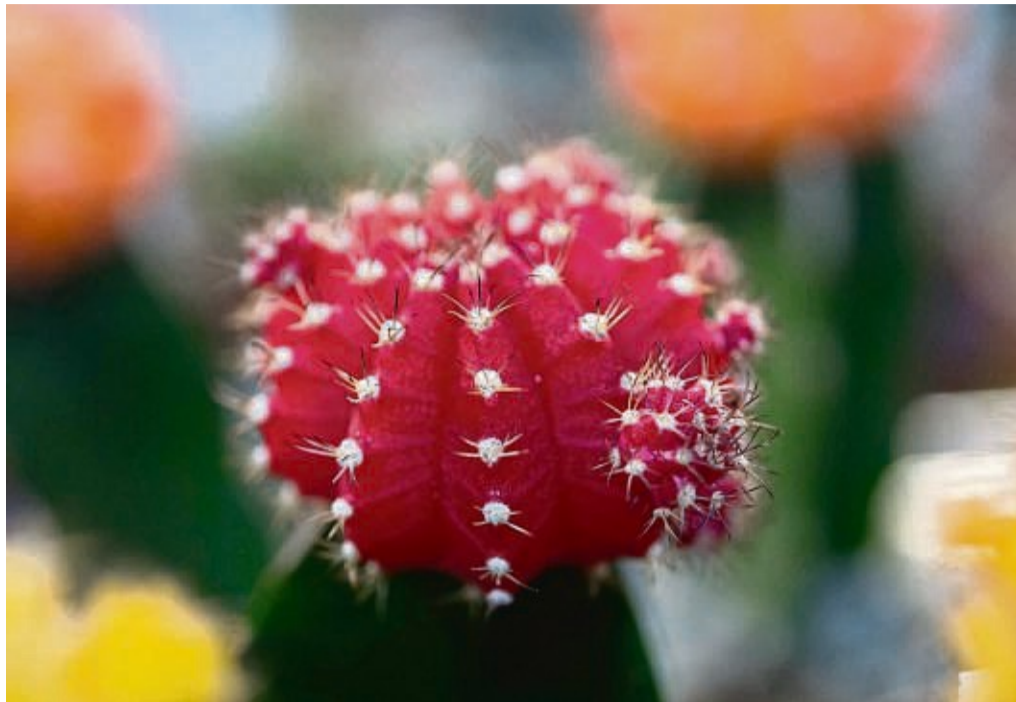
Kugel-Kombi: Erdbeerkaktus aus der Gattung Gymnocalycium mihanovichii . Diese Sorte, «Hibotan», ist japanischen Ursprungs. Auf Japanisch heißt Kaktus übrigens Kakutasu.

„Wenn solche Mutanten auftauchen, sind Sammler meist ganz scharf drauf. Denn es ist etwas Besonderes,