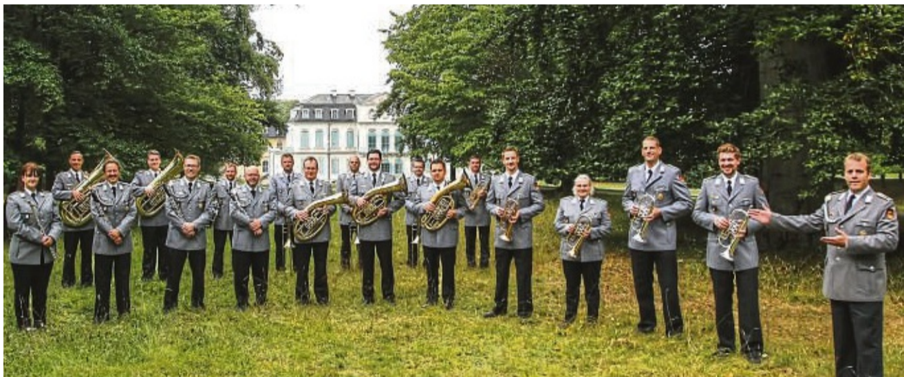
Findet wieder statt: Wohltätigkeitskonzert in Sontra mit dem Heeresmusikkorps Kassel auf dem Gelände des Schlosses Wilhelmsthal.

Gardziella Brillenhaus-Blankenbach 06627 8686