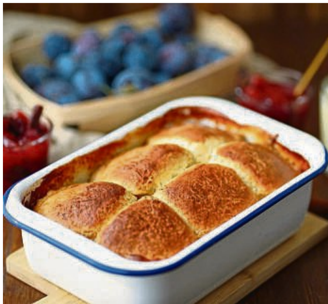
In jedem der sechs Buchteln ist ein Klecks Pflaumenmus versteckt.

Die Vanillesoße ist einfach nur eine gekaufte, die ich selbst angerührt habe. Denn die habe ich immer im Vorratsschrank, weil es super praktisch ist, wenn es mal schnell gehen soll. Selbstverständlich können Sie auch eine selbst gemachte Vanillesoße verwenden. Dazu noch eine schnelle Pflaumensoße