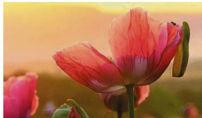
Das Gewinnerfoto des Mohnblüten-Fotowettbewerbs 2023: Ein kleines Insekt balanciert auf der rosafarbenen Mohnblüte.