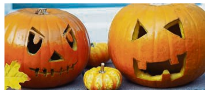
Jetzt noch ein Licht hineinstellen, fertig ist die gruselige Halloween-Fratze: In Germerode sind alle Kinder zum Kürbisschnitzen eingeladen.

Ab 17 Uhr am Samstagnachmittag werden die gemeinsam geschnitzten Kürbisse am Dorfanger in Germerode aufgestellt. Für den großen und den kleinen Hunger und Durst steht Rüp- pel's Waffeltrailer für alle Teilnehmer bereit. Und selbstverständlich wird in Germerode auch Halloween gefeiert – für Dienstag, 31. Oktober, lädt das Organisatoren-Team zur Abschlussveranstaltung