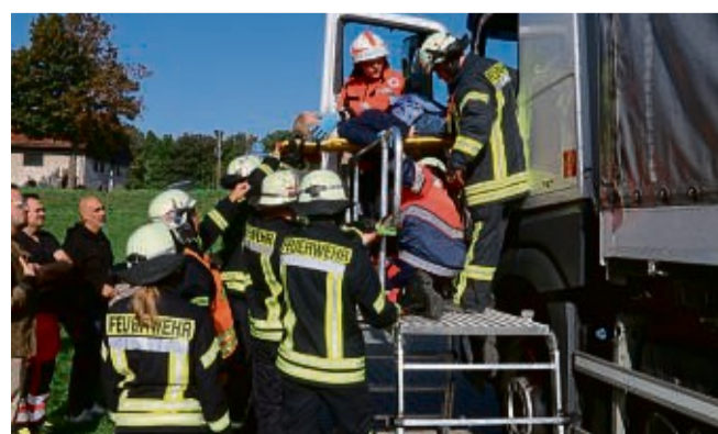
„Geschafft!“: Nach der schnellen Erstversorgung wird die Verletzte auf dem Spineboard aus dem Fahrerhaus bugsiert.