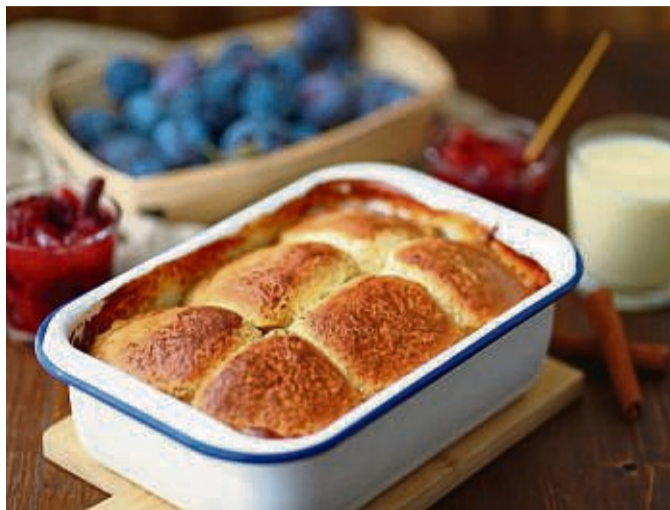
In jedem der sechs Buchteln ist ein Klecks Pflaumenmus versteckt.

Teig: 330 g Mehl Typ 550 1 Prise Salz 1 Ei 75 g Zucker 75 g Butter 125 ml Milch 20 g frische Hefe