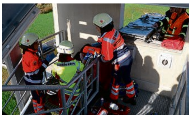
Einsatz im engen Treppenhaus: Die Notärztin und die beiden Mitarbeiterinnen des Rettungsdienstes müssen sich gleich um zwei Verletzte kümmern.

„Der Rahmen für diese Ausbildung ist vorgegeben, die Szenarien werden von uns darauf abgestimmt“, beschrieb der Seminarleiter das Konzept, „um letztendlich die Zulassung als Notarzt zu erhalten, müssen die Anwärter nach diesem erfolgreich absolvierten Kurs noch 50 Einsätze unter Anleitung eines verantwortlichen Notarztes auf einem Notarzteinsatzfahrzeug mitmachen“.