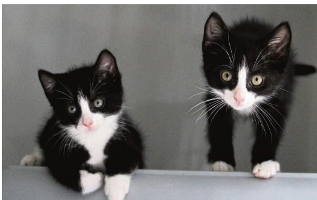
Tierheim Beuern vermittelt und versorgt Tiere, die kein Zuhause mehr haben.