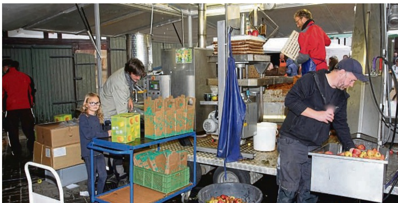
zot 2,8 Tonnen Äpfel wurden beim Appelfest gepresst.

Mit dem Ertrag werden vom Verein zur Heimat- und Brauchtumpfleger Melgershausen verschiedene Projekte im Ort und in der Umgebung gefördert.