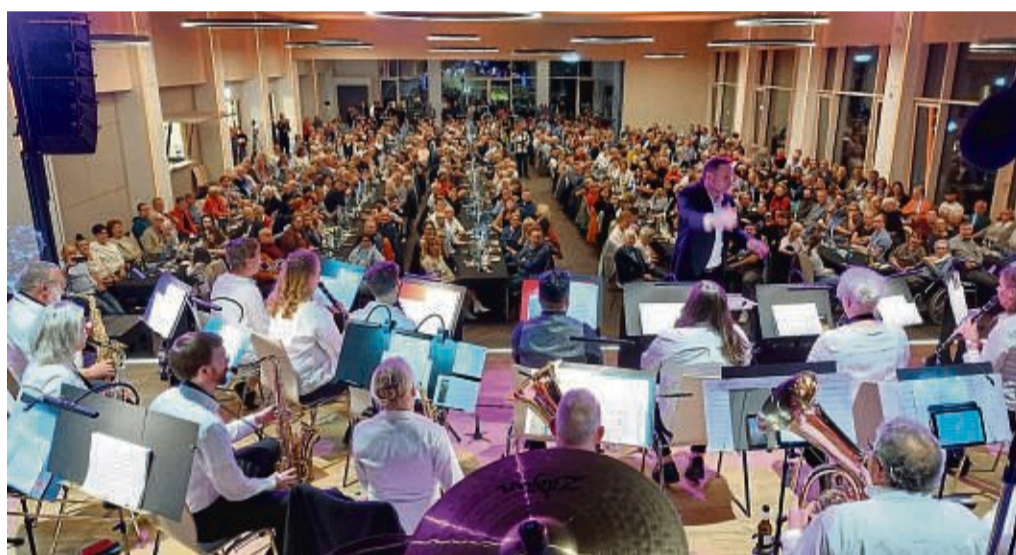
Stattliche Kulisse: Beim ersten Konzert in der sanierten Stadthalle in Fritzlar waren mehr als 450 Besucher. Der Katholische Bläserchor lud zum Konzert „Night of Rock“ ein.

Im weiteren Verlauf skizzierte das sinfonische Blasorchester mit einzigartigen,