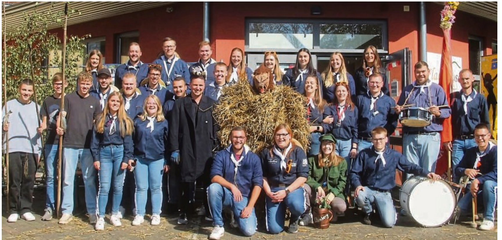
Ein erfolgreiches Team: Die 27 Elbenberger Kirmesmädchen und -burschen.

Etwas andere Töne gab es dann am Sonntag durch den örtlichen Posaunenchor beim Festgottesdienst. Anschließend konnten im Dorf die Küchen kalt bleiben, fand ein gemeinsames Mittagessen statt. Zubereitet in der Feldküche der örtlichen Feu-