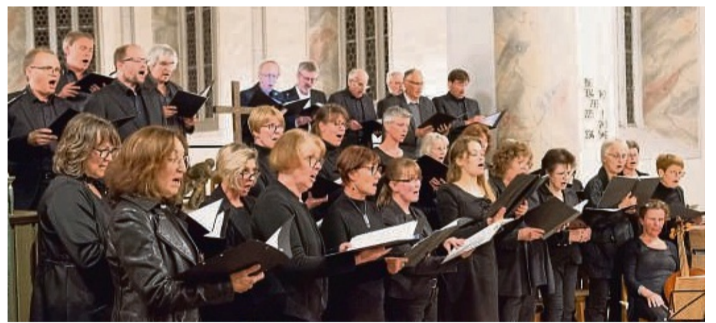
Sorgen für viele schöne Klangfarben: Der Chor conVoce und das Ensemble La Visione unter der Leitung von Kantorin Henrike Wischerhoff in der Neustädter Kirche.