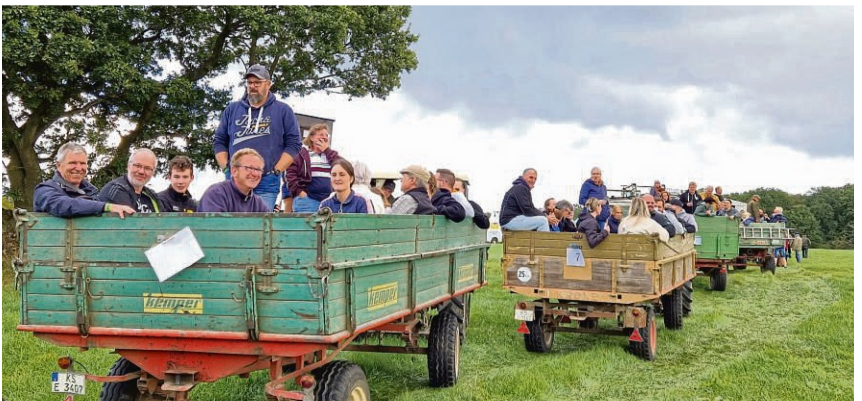
Rollend hinterher: Auf zwölf Wagen verfolgten 200 Gäste das Jagdgeschehen, das an der Hombresser Reithalle startete. Dass die Resonanz so hoch war, erfreute die Veranstalter sehr.