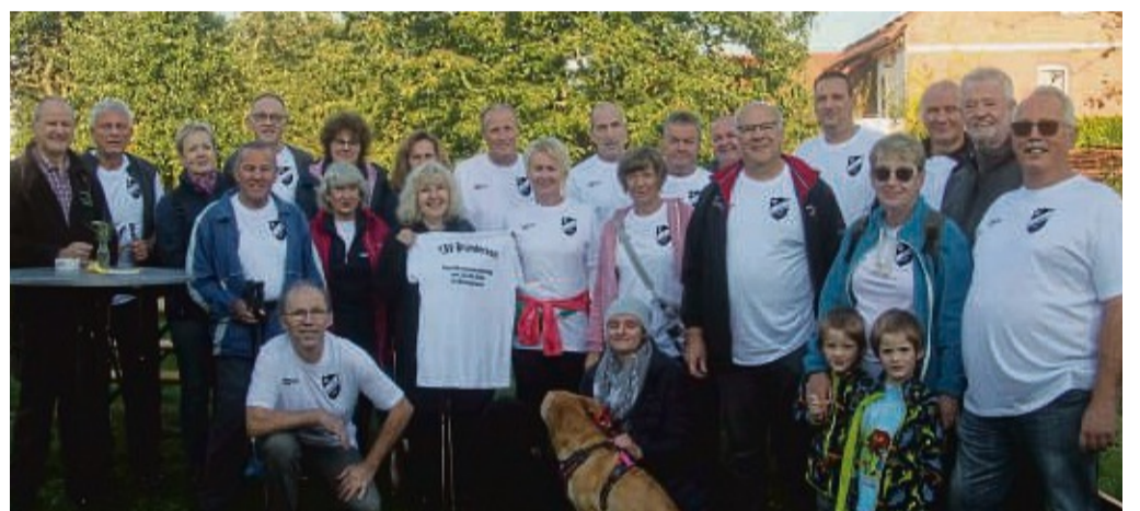
Nächster Gastgeber: Den 35. Sportkreiswandertag richtet am 22. September 2024 der TSV Bründersen aus.

Auch im kommenden Jahr werden sich die Wanderfreunde wieder treffen: Der 35. Sportkreiswandertag wird am 22. September 2024 vom TSV Bründersen im Festtagsreigen zur 950-Jahrfeier des Dorfes ausgerichtet. zih