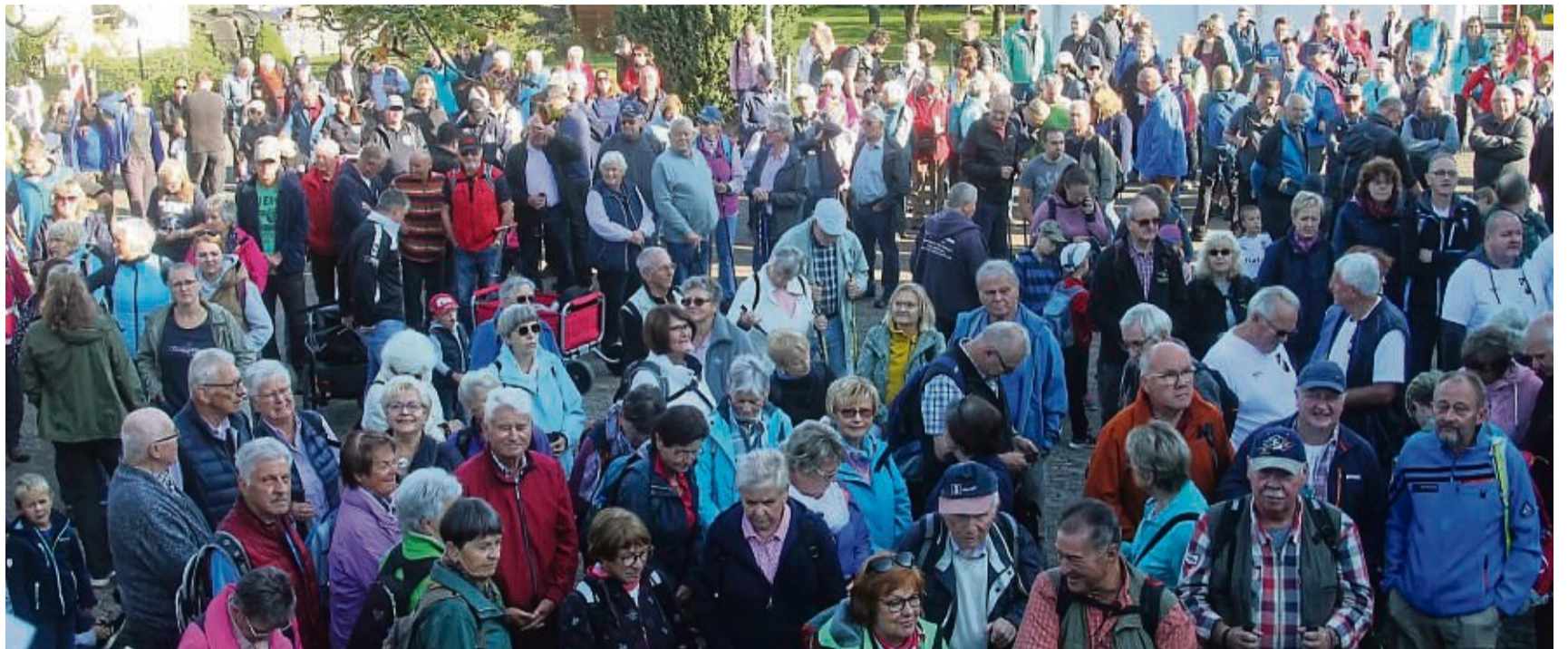
Rekordverdächtig: 413 Wanderfreunde gingen beim Sportkreiswandertag am Sonntag in Wenigenhasungen auf die drei angebotenen Strecken.