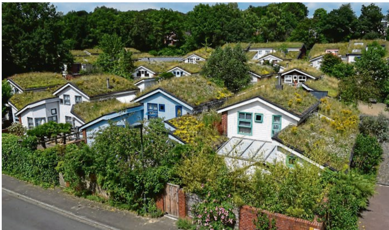
Mit bepflanzten Dächern können auch Gebäude ein Biotop sein.

„Mit einer Dachbegrünung kommt nicht nur natürliche Abwechslung in die Innenstädte, sondern sie wirkt dem Aufheizen des Klimas in den Sommermonaten entgegen“, erklärt Annika Dobbers, Referentin des Projekts „Mehr Grün am Haus“ der Verbraucherschutzzentrale NRW. Während ein übliches Garagendach bei sonnigem Sommerwetter gut 80 Grad Celsius heiß werden kann, sind es mit Begrünung 30 Grad. Mit der niedrigeren Temperatur verringert sich die Gefahr von Hitzeschäden an der Dachkonstruktion - und das Klima innerhalb und außerhalb des Gebäudes verbessert sich. Zudem kühlt nachts die Umgebungsluft schneller ab.