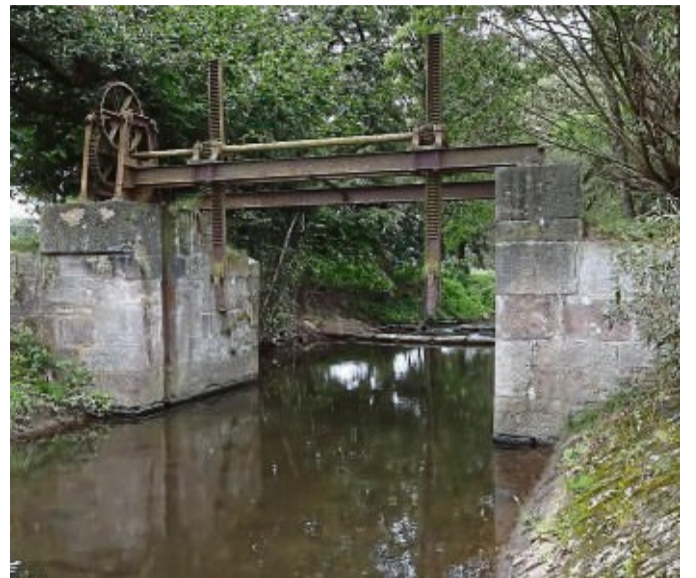
Die Schwelle am Wehr ist ebenso verschwunden wie der Absturz und das Tosbecken dahinter.