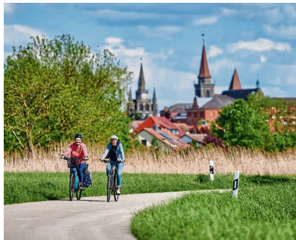
Zahlreiche Fern- und Themenradwege kreuzen sich in Ansbach.

auf den Spuren des Stadtgründers Gumbertus. Die Urlauber sollten sich Zeit nehmen, um das Markgräfliche Schloss, den Hofgarten und die verwinkelte Altstadt zu erkunden. Unter tourismus-ansbach.de sind Rad- und Wanderwege sowie Prospekte zu finden. djd-k