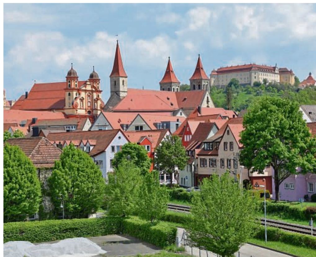
Die Kleinstadtperle liegt inmitten der idyllischen Landschaften der Schwäbischen Ostalb.

Unter www.ellwangen-tourismus.de gibt es alle Infos sowie die Faltkarte „Kleinstadtperlen in Baden-Württemberg“ zum Bestellen. Die Karte stellt alle 18 Städte vor, bietet Infos für Reisemobilisten und enthält ein Gewinnspiel für besonders Reiselustige. djd-k