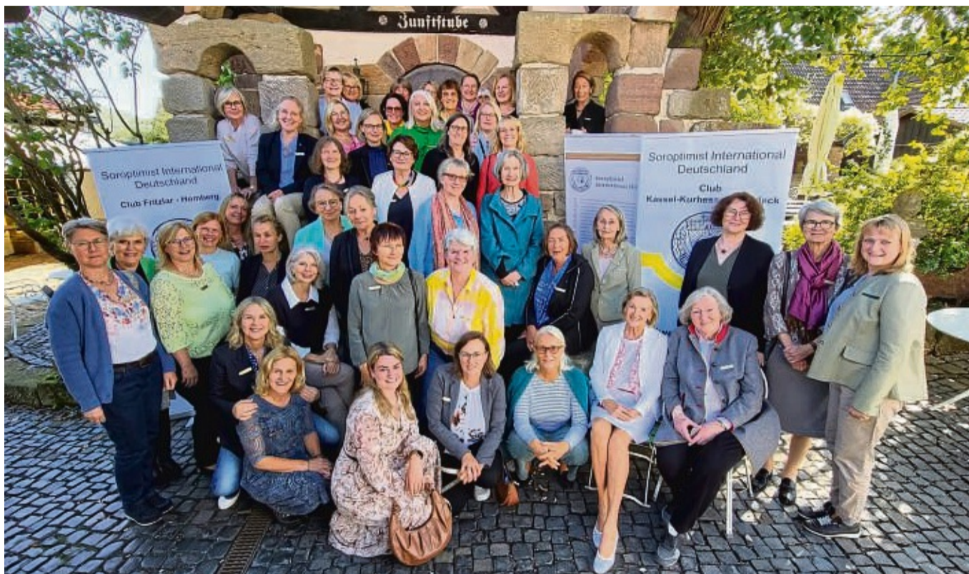
Zeit für den persönlichen Austausch: Mitglieder der sieben Netzwerkclubs „Nordhessen Plus“.

Neben dem aus Fritzlar-Homburg, sind das die SI-Clubs Bad Wildungen, Kassel-Bad Wilhelmshöhe, Kassel-Kurhessen Waldeck, Kassel-Elisabeth Selbert, Korbach und aus Mittelhessen die Marburger. Deshalb haben sich die Frauen auch dafür entschieden, ihren Zusammenschluss mit „Nordhessen