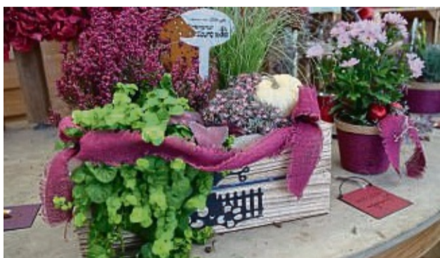
Kreativ und inspirierend: Im Gartencenter Meckelburg entdecken Kunden eine Vielzahl von herbstlichen Dekorationen für drinnen und draußen.