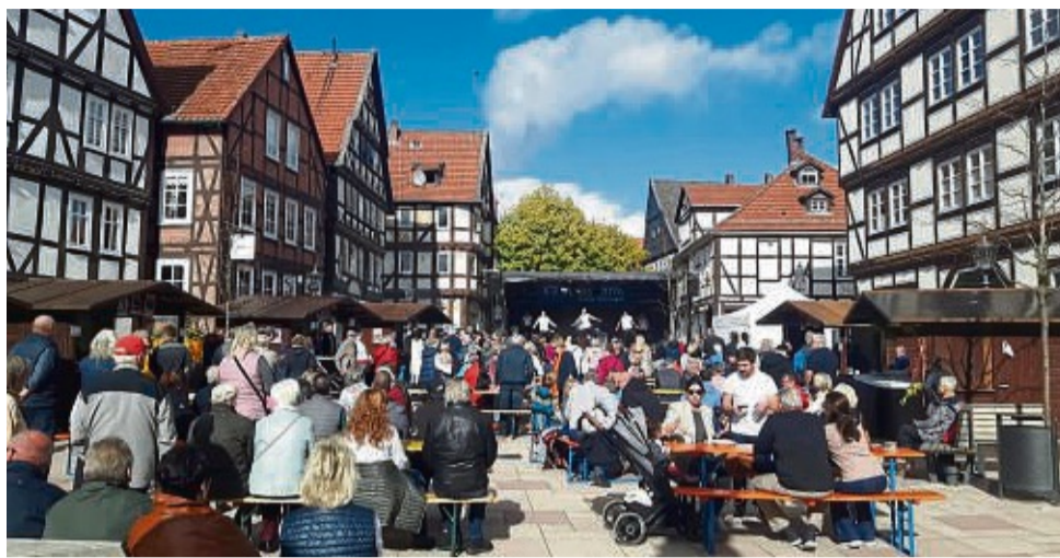
Musik und mehr auf dem Marktplatz: Am Wochenende lädt das Kulturforum Hofgeismar zum Herbstfestival ein.

Deshalb geht es auch gleich am Sonntag weiter: Nach dem Gospel-Gottesdienst um 11 Uhr können die Besucher die Fertigkei-