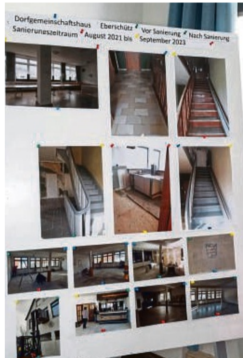
Vorher - Nachher: Eine Bilderwand dokumentiert, wie gut die Renovierung des Gemeinschaftshauses gelang und wieviel Arbeit es war.