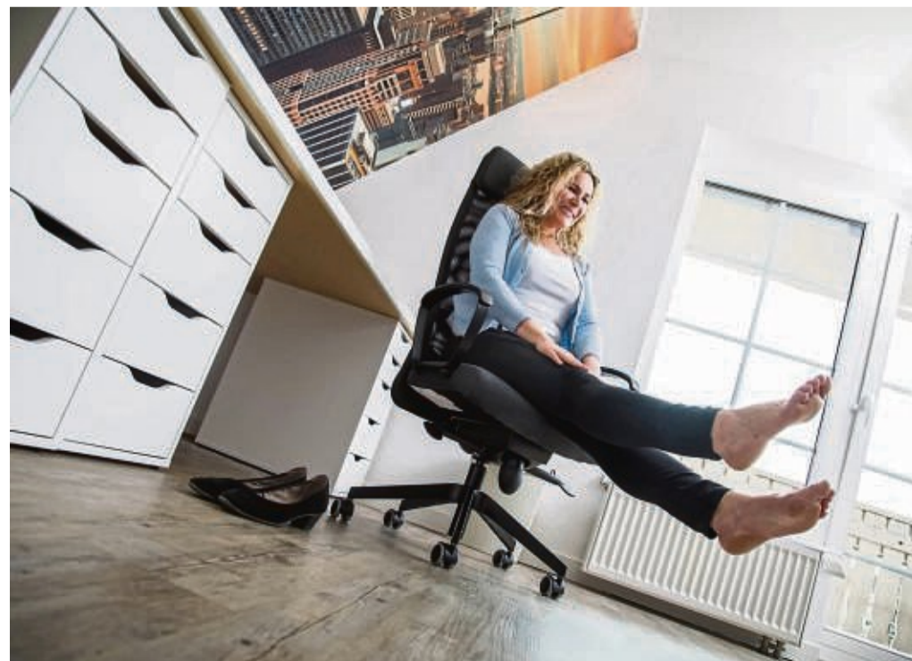
Bugt Verspannungen vor: Haltungswechsel und kurze Übungen während des Arbeitstages.

Um den Körper aus der starren Sitzhaltung zu bringen, kann zudem ein höhenverstellbarer Sitz-Steh-Arbeitsplatz sinnvoll sein. Die richtige Höhe fürs Arbeiten im Stehen finden Sie dem TÜV-Verband zufolge, wenn Sie sich gerade hinstellen, die Oberarme lockerlassen und mit den Unterarmen einen möglichst rechten Winkel bilden, so dass sie auf Höhe der Tischplatte sind. tmn