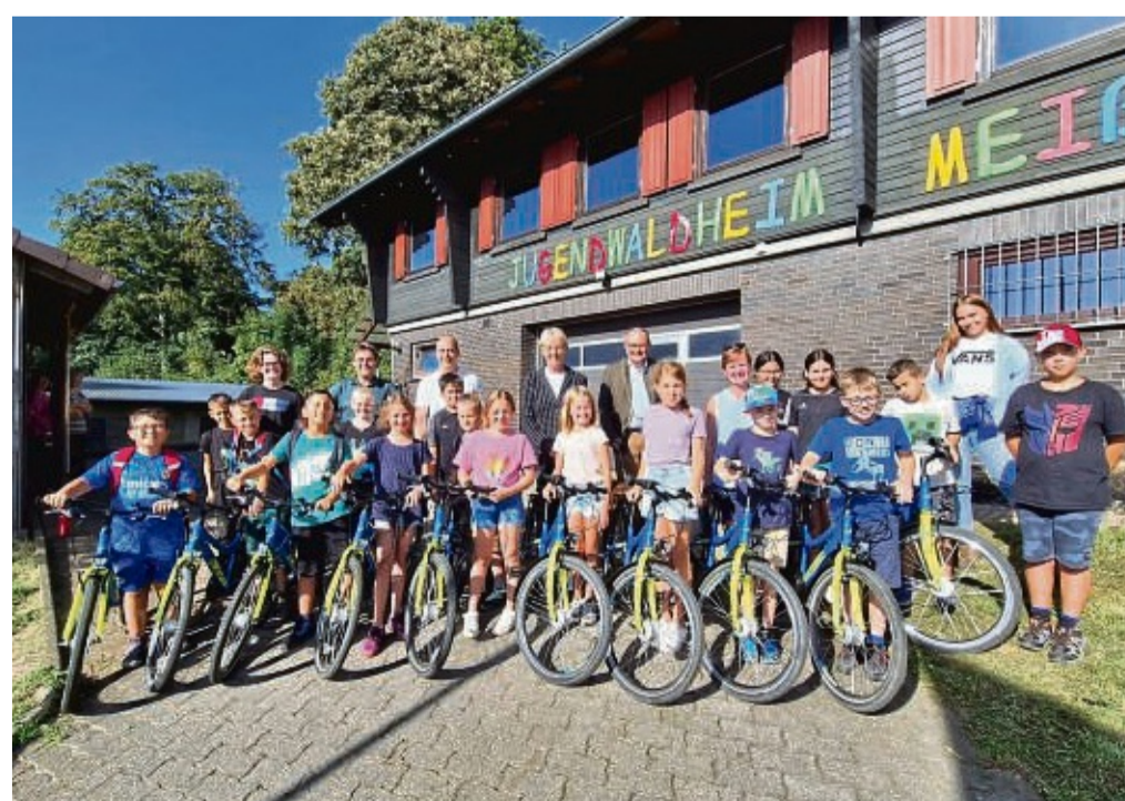
Radeln fürs Klima: Die Sparkassen-Stiftung hat Fahrräder für das Jugendwaldheim Meißner gesponsert.