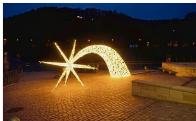
Der Lichterzauber als Teil des Weihnachtsmarkts lockte im Jahr 2022 die Besucher.