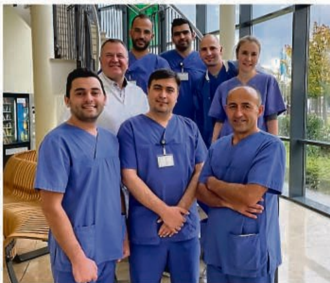
Das Ärzteteam der Urologie freut sich über die volle Weiterbildungsbefugnis für die gesamte Facharztausbildung.

Mit einem breiten Spektrum an diagnostischen und therapeutischen Möglichkeiten bietet die urologische Akutklinik ihren Ärzten eine optimale Lernumgebung, in der sie ihr Fachwissen vertiefen und praktische Erfahrungen sammeln können. „Die volle Weiterbildungsbefugnis ist ein wichtiger Schritt für unsere Abteilung, um weiterhin qualifizierte Uro-