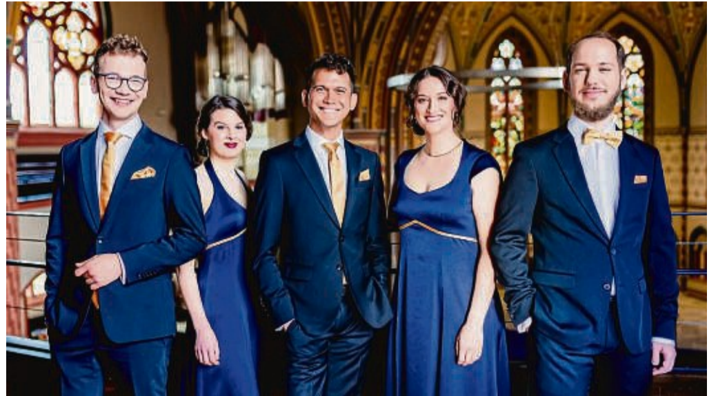
Das Leipziger Calmus-Ensemble ist auf Einladung des Volksbildungsringes am 10. Dezember mit seinem Programm „Weihnacht a capella“ zu Gast in Bad Arolsen.