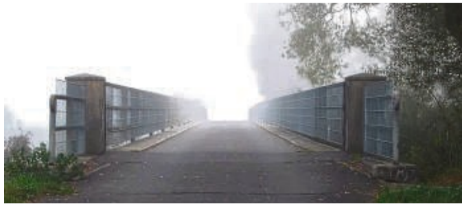
Vorübergehend gesperrt: Die Ederbrücke in Anraff wird instand gesetzt.

Verein „LOGOS“ unterstützt Familien in Rumänien