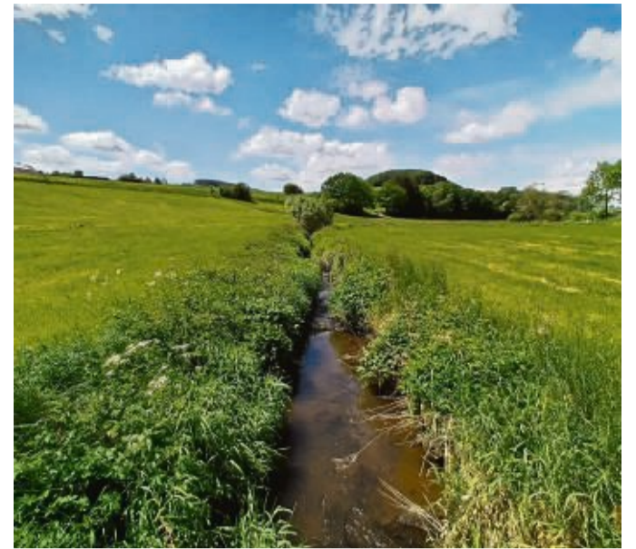
Gerade Schneise durchs Tal: Der Aarbach soll sich durch die Renaturierung wieder einen naturnahen Verlauf suchen.