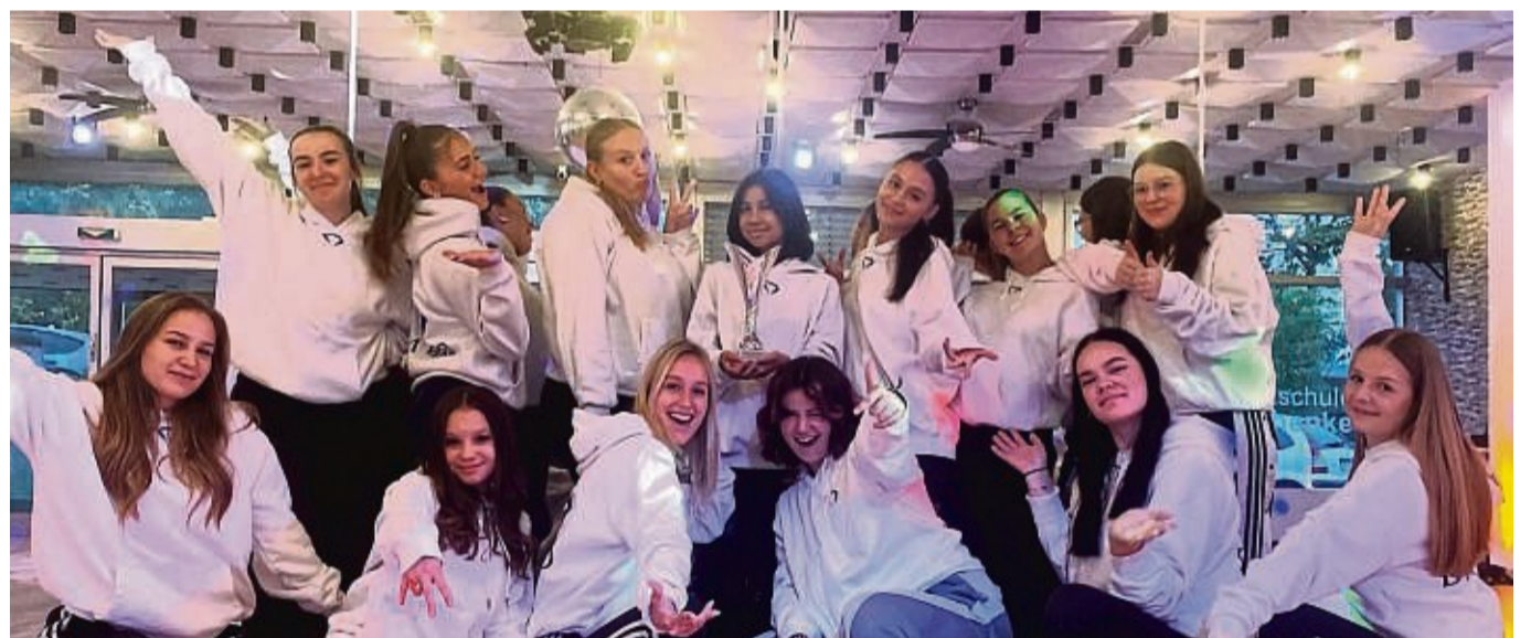
Erfolgreich: die Wildunger Hip-Hop-Tänzerinnen von „DamAD“.