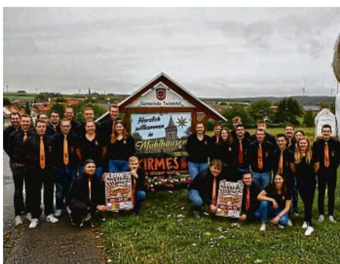
Zum Abschluss der Kirmeszeit im Waldecker Land laden die Kirmesburschen und Kirmesmädels in Mühlhausen zum zweitägigen Fest ein.

Um 20 Uhr geht es los. Versorgt werden die Gäste von der Festbewirtung Eberle mit kühlen Getränken und allem was noch dazu gehört. „Da