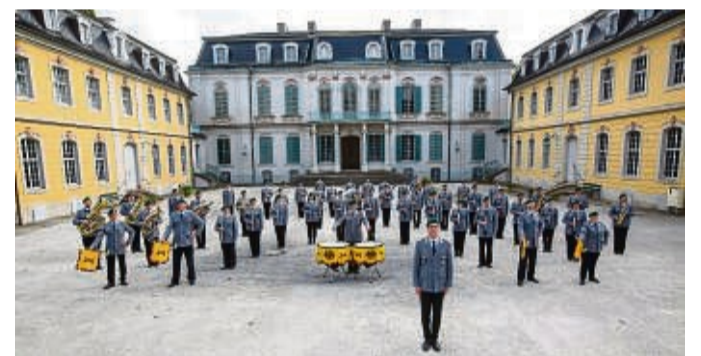
Bringt die Stadthalle zum Klingen: Das Heeresmusikkorps Kassel gibt am 7. November ein Benefizkonzert.

Das Repertoire der 56 Musiker in Uniform umfasst Marschmusik, Solokonzerte und moderne Spezialarrangements. Schwungvolle Unterhaltungsmusik mit Jazzelementen und zahlreiche Solisten bereichern das Programm. Für das von der Aktion für behinderte Menschen und der Stadt Waldeck organisierte Konzert können Karten für eine Eintrittsspende in Höhe von 12 Euro im Vorverkauf im Rathaus in Sachsenhausen und im Bürger- und Tourismusbüro in Waldeck erworben werden. Kartenreservierung bei freier