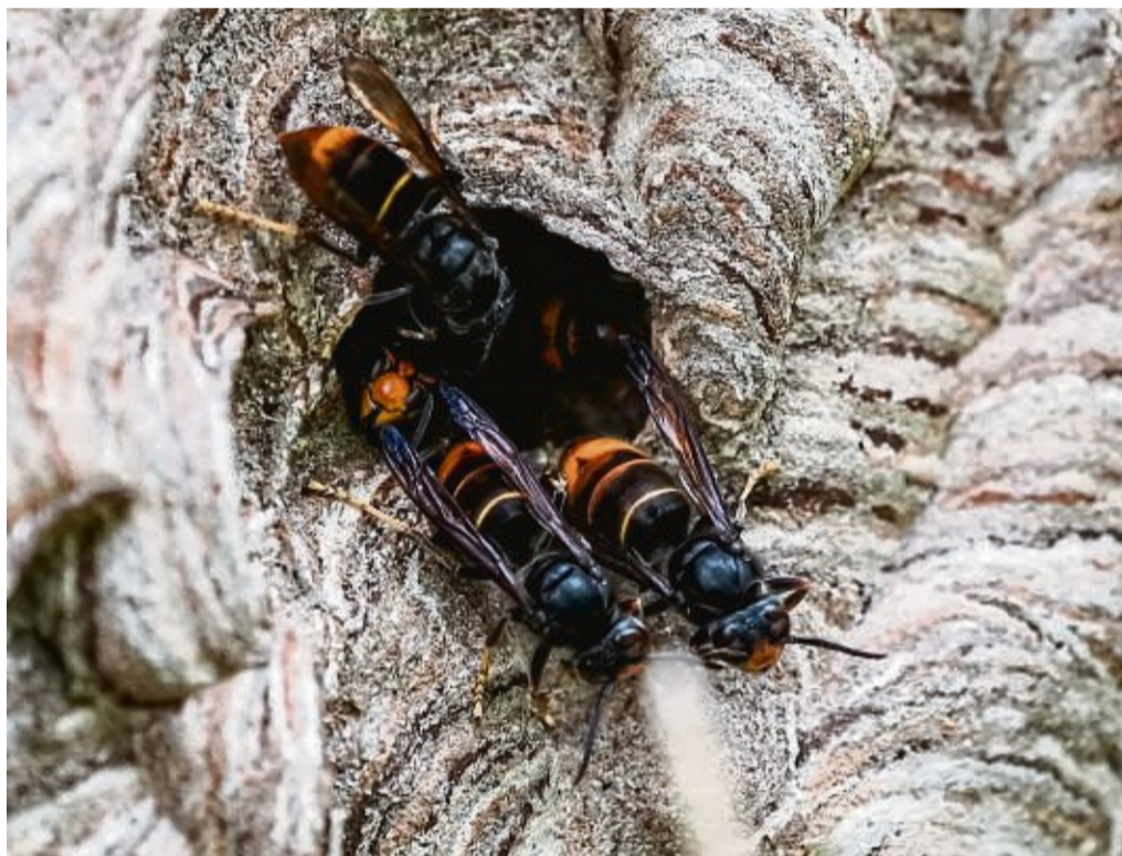
Dunkle Färbung, gelbe Beine, orangefarbener Streifen: Die Asiatische Hornisse ist gut zu erkennen.

Waldeck-Frankenberg – Eine erste einzelne Sichtung der Asiatische Hornisse in Waldeck-Frankenberg hat das Hessische Landesamt für Naturschutz bestätigt. In Frankenu ist sie aufgefallen. Bislang gab es aus dem Lahndill-Kreis einzelne Meldungen, ansonsten liegt der Verbreitungsschwerpunkt innerhalb Hessens im Kreis Bergstraße. Vor allem entlang der warmen Rheinebene verbreitet sie sich Richtung Norden. In Nordrhein-Westfalen gab es Sichtungen nahe Lüdenscheid und Osnabrück. Der Weiterverbreitung stehe im Zuge des Klimawandels theoretisch nichts entgegen, so das Landesamt.