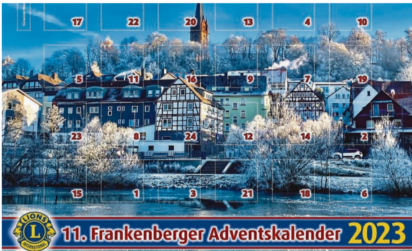
Lions-Adventskalender: Der Lions-Club Frankenberg startet wieder den Verkauf für den guten Zweck.

Für einen Preis von sechs Euro kann der Kalender in den im Kästchen genannten Verkaufsstellen erworben werden, der wieder in einer Auflage von 5000 Exemplaren erscheint. Insgesamt werden 260 Gewinne im Gesamtwert von mehr als 15 000 Euro ausgespielt, was laut Lions einen neuen Höchstwert darstellt. Hinter jedem Kalender-Türchen warten vom 1. bis