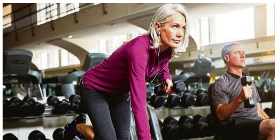
Training mit Gewichten stärkt die gelenkumgebende Muskulatur und kommt daher auch Arthrosepatienten zugute.