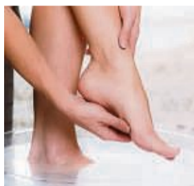
Basische Fußbäder sind sehr wohltuend.

O hne sie geht es buchstäblich nicht: Wandern, Joggen, Spaziergehen, Sightseeing beim Städtetrip oder einfach ein ausgedehnter Shoppingbummel – für viele Aktivitäten brauchen wir unsere Füße. Sie tragen uns durchs Leben und halten uns im Gleichgewicht. Doch trotz starker Belastungen werden sie oft vernachlässigt. Und so sind Fußprobleme weit verbreitet. Beschwerden wie Fußschweiß, Pilzbefall, kal-