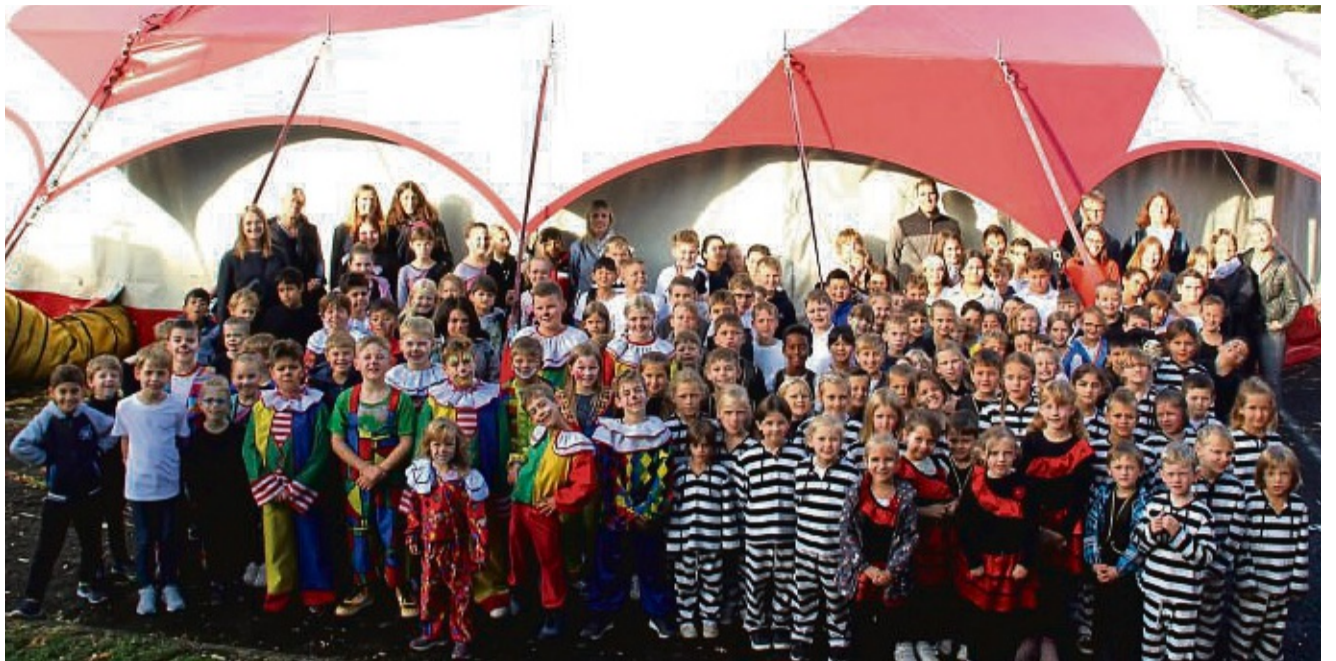
Viel Spaß bei der Circus-Projektwoche hatten alle Kinder der Heiligenbergschule Gensungen: Unser Bild zeigt eine der insgesamt vier Teilnehmergruppen vor dem Phantasia-Zelt. Das Projekt soll fortgesetzt werden, kündigte die Schulleitung an.