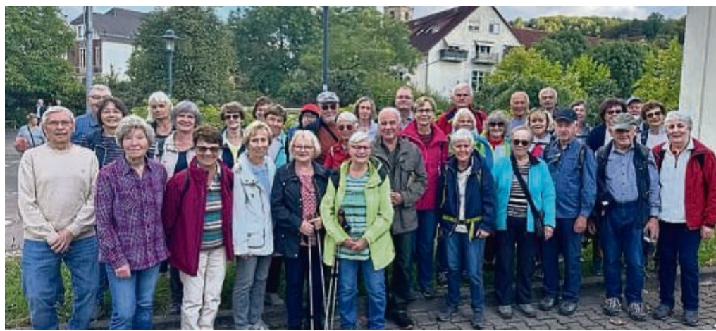
Gruppenfoto während der Partnerschaftswanderung: die Wandergruppe mit den Türmen der Stadtkirche St. Georg im Hintergrund.

Melsungen – Schmalkalden war das Ziel der Partnerschaftswanderung der Wandergruppen aus Melsungen und Bad Liebenstein. Schon seit 1995 gehört eine jährliche Wanderung zu den Höhepunkten der 33-jährigen Partnerschaft beider Städte, heißt es in einer Mitteilung. Nur in den Corona-Jahren 2020 und 2021 fiel die Veranstaltung aus. Bei schönem Herbstwetter empfingen die Bad Liebensteiner die 28 Wanderer aus Melsungen mit einem Frühstück an dem Industriedenkmal Neue Hütte. Nach Besichtigung der Ausstellung zur Stahlwarenproduktion vom 8. Jahrhundert bis 1990 in Schmalkalden, zu Roheisenerzeugung in der Hochofenanlage seit 1935 und zur Metallindustrie der Region nach 1990 begann die Wanderung. Von einem Panoramaweg oberhalb von Schmalkalden gab es Ausblicke auf die Höhen des Thüringer Waldes. Unterwegs erläuterte ein Wanderführer geschicht-