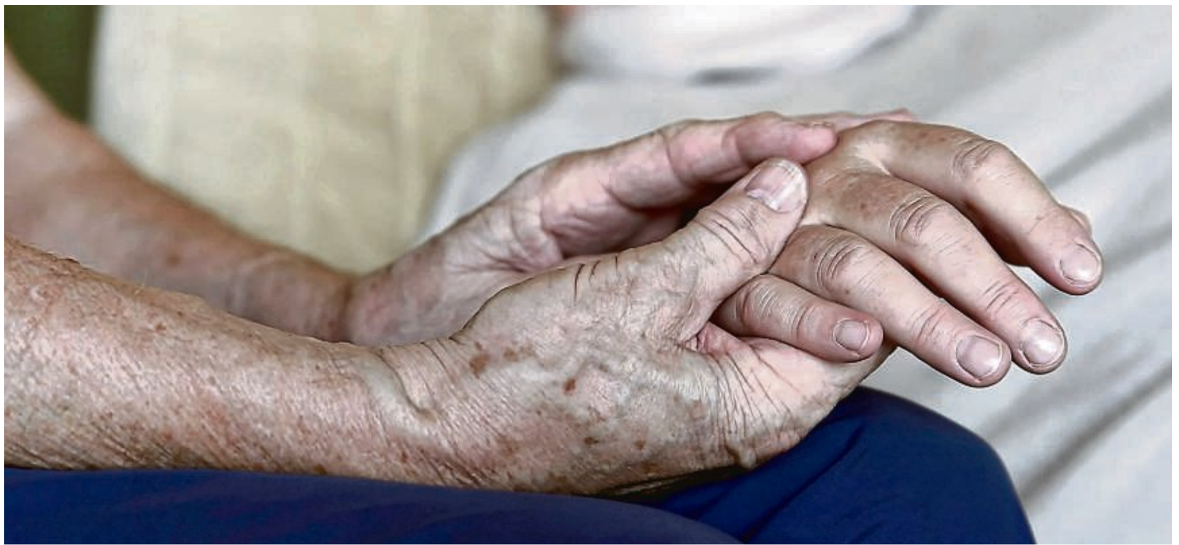
Ein letztes Mal die Hand halten: Nach dem Tod eines geliebten Menschen haben einige Angehörige das Bedürfnis danach, für andere ist das unvorstellbar.