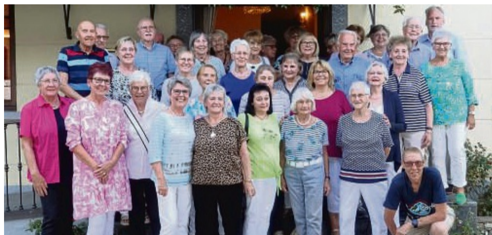
Eine Reise an den Lago Maggiore unternahm der Kneipp-Verein Münden und sein befreundeter Kneipp-Verein Eschwege mit insgesamt 40 Personen.

Die Reisenden machten auch einen Busausflug zur