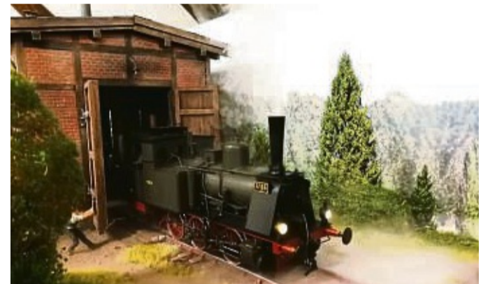
Die „Preußische T 3 auf Spur 1“ ist in der Schau auch zu sehen.