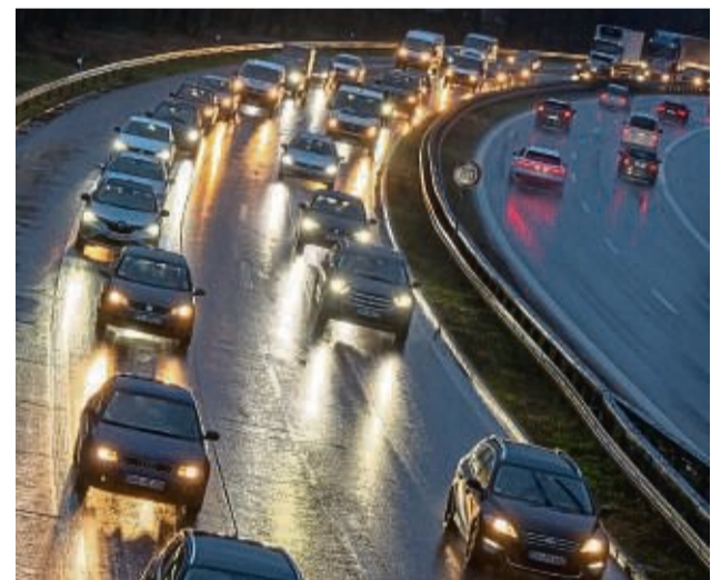
Modernes LED-Licht hat im Vergleich zur alten Halogen-technik den Vorteil, dass die weiße Lichtfarbe für eine bessere Umfeldwahrnehmung sorgt.

Wichtig: Nach Montage ist die besagte Bauartgenehmigung im Internet abzurufen und auszudrucken. Sie muss immer im Auto mitgeführt werden. Der entsprechende Link sei üblicherweise als QR-Code auf der Verpackung zu finden. Auch rät die GTÜ, die Leuchteinstellung nach dem Wechsel prüfen zu lassen, um gute Lichtverhältnisse zu garantieren. tmn