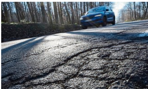
Glätteis kann selbst bei Plusgraden in Waldgebieten auftreten, wenn Regen auf kalte Oberflächen trifft.