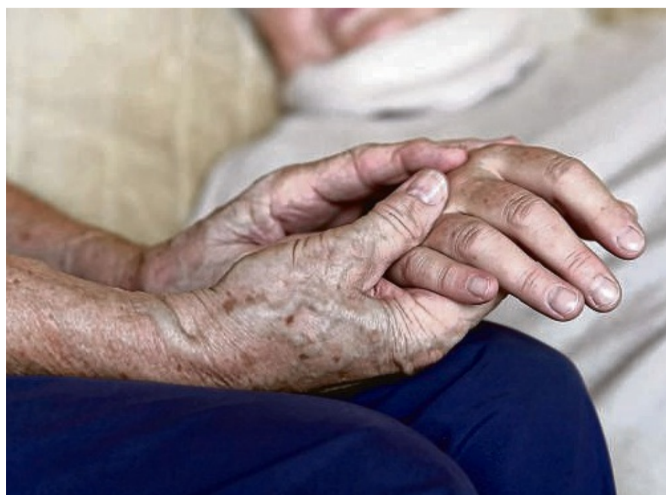
Ein letztes Mal die Hand halten: Nach dem Tod eines geliebten Menschen haben einige Angehörige das Bedürfnis danach.

Manche Angehörigen bekommen das Zittern oder ihr Blutdruck sinkt oder sie werden unruhig – das ist ganz individuell. Stirbt jemand nicht zu Hause, sondern in einem Heim oder Hospiz, ist jemand da, der sich auskennt und helfen kann.