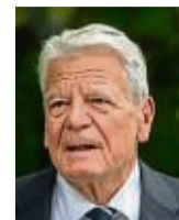
Joachim Gauck

Der Eintritt zu der Veranstaltung ist frei. In dem Vortrag wird es um die aktuellen Erschütterungen gehen, denen unsere Demokratie von außen wie von innen ausgesetzt ist (Ukrainekrieg, Rechtsextremismus, autoritäre Sehnsüchte und so weiter). Wie kann es gelingen, auch in Zukunft unsere Freiheiten