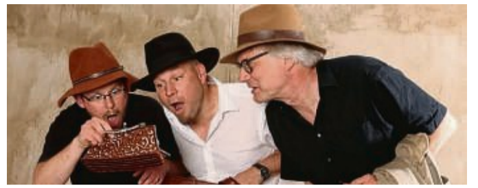
Das ImproKS-Theater aus Kassel spielt ohne Kostüme oder Requisiten. Es ist am 4. November im BAC-Theater Bad Arolsen zu sehen.

Bad Arolsen - Das BAC-Theater lädt am Samstag, 4. November, ab 19.30 Uhr zu einem „Abend voller Überraschungen“ ein. Das „ImproKS-Theater“ ist im BAC zu Gast und nimmt die Zuhörer auf einen Abend voller kleiner und großer, lustiger und ernster, verrückter und alltäglicher Geschichten mit, die jedes Mal eine Premiere und eine Abschlussvorstellung sind. Das ImproKS-Theater aus Kassel spielt ohne Kostüme und ohne Requisiten und bastelt Szenen und manchmal ganze Theaterstücke aus den Zuru-