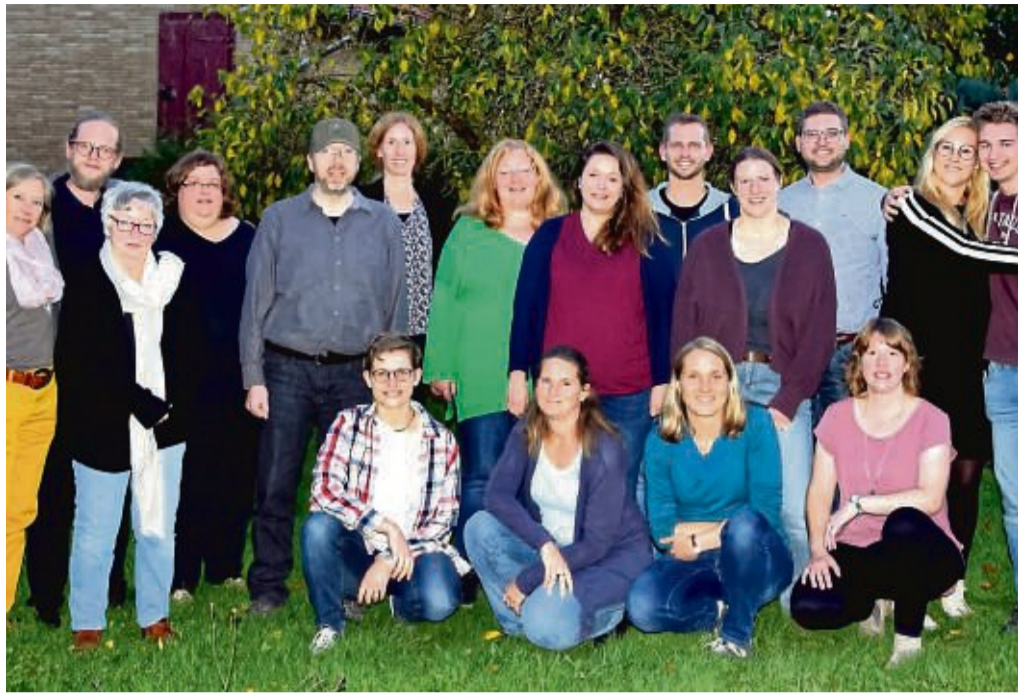
Freude bei gemeinsamen Proben: Die Ensembles Da Capo Frankenberg und d'aChor Korbach planen erstmals ein gemeinsames Konzert in der Pfarrkirche St. Marien.