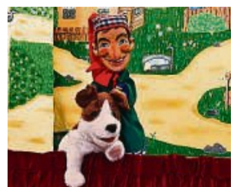
Kasper und Hund: Das Staufenger Puppentheater führt das Stück „Der Räuberwald“ auf.

Zum Inhalt: Ein aufregender Tag für Kasper. Nicht nur sein Hund verschwindet spurlos, sondern auch der Räuber aus seiner Gefängnis-