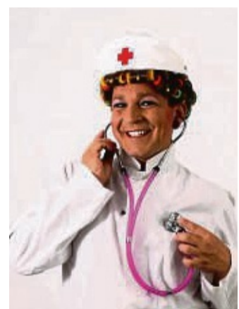
Lachen gibt es auf Rezept: Das verspricht die Kunstfigur „Schwester Lilli“.

Als Absolvent der legendären Köln Comedy Schule dreht das Multitalent schonungslos auf – Lillis Markenzeichen, die Lockenwickler-