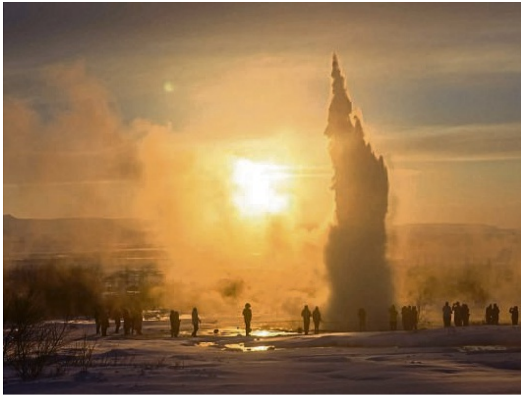
3D-Fotograf Stephan Schulz hat Island und Grönland zu allen Jahreszeiten besucht. Hier im Bild ein Geysir im Winter.