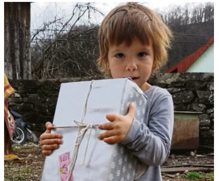
Die Asklepios Kliniken Nordhessen unterstützen die Weihnachtspäckchenaktion der Stiftung „Kinderzukunft“. Das Bild zeigt eine Geschenkübergabe in Rumänien.