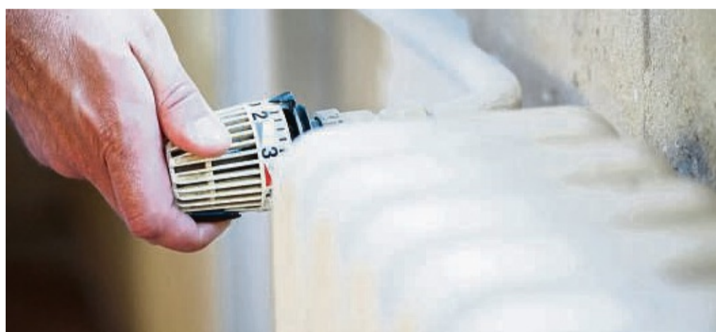
Die Stufen eins bis fünf auf dem Heizkörper-Thermostat entsprechen der Zieltemperatur im Raum, nicht der Aufwärmgeschwindigkeit.

Wer Heizkosten sparen möchte, sollte nicht mehr heizen als nötig. Dabei ist vor