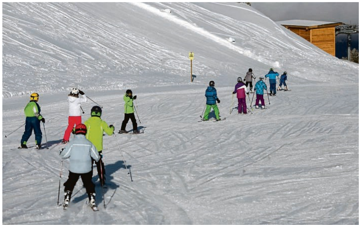
Bekanntes Bild aus den Skigebieten: Skischüler fahren in Reih und Glied die Piste ab.

Die Lernerfolge in den Skischulen sind meist sehr groß. Ausnahmen bestätigen allerdings die Regel - wenn es zu