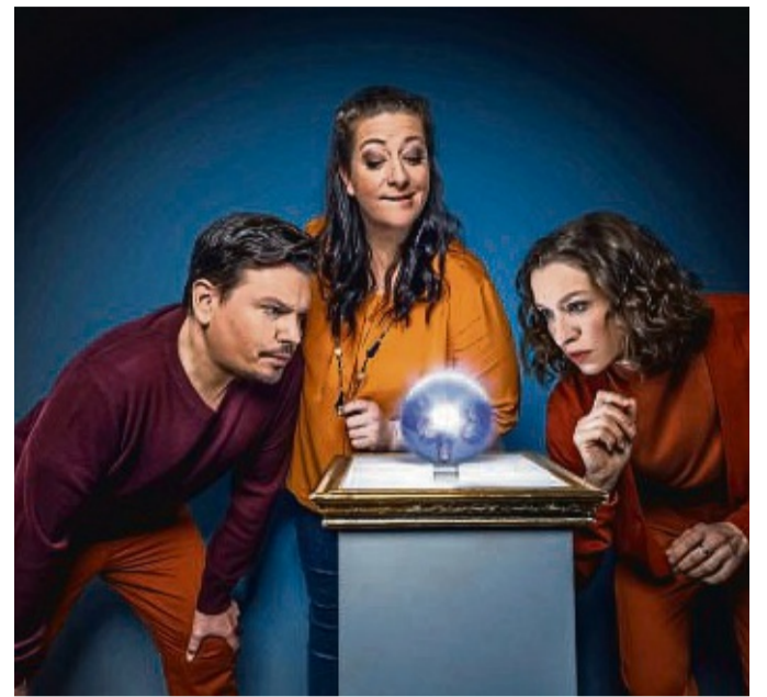
Das Kabarett Theater Distel mit seinem Programm „Wahres ist Rares“ kommt ins Bürgerhaus nach Gudensberg.

■ 8. November: 19.30 Uhr, Bürgerhaus, Kabarett Theater Distel – Wahres ist Rares. Ein gefühltes Chaos und ständige Überforderung. Immer beschwört ein anderes Thema die Apokalypse: erst das Klima, dann die Pandemie, jetzt der Krieg. Dazu fordert der Job Nerven, Familie Zuneigung, soziale Medien ständige Aufmerksamkeit. Mitten drin wir. Hilflos. Denn unser Gehirn reagiert automatisch mit Fluchtinstinkt und schaltet verzweifelt auf Wellnessalarm: offline, Auszeit, digital Detox. Mit diesen Zeilen beginnt die Pressemitteilung