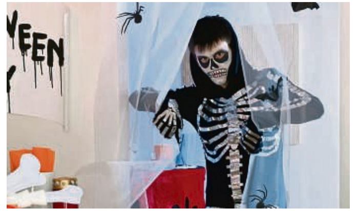
Mit schwarzer Hose plus Shirt , Alu-Tape (und der passenden Schminke) kann man ein Kostüm selbst machen, ohne furchterregend viel Geld dafür auszugeben.

Achtung: Topinambur hat viele Ballaststoffe, daher kann er bei manchen Menschen blähend wirken. Gerade dieser Ballaststoff Inulin ist aber wiederum für Diabetiker sehr gut, weil er den Blutzucker nicht so schnell ansteigen lässt. Ansonsten liefert das Gemüse zum Beispiel B-Vitamine, Kalium, Kalzium und Magnesium. tmm