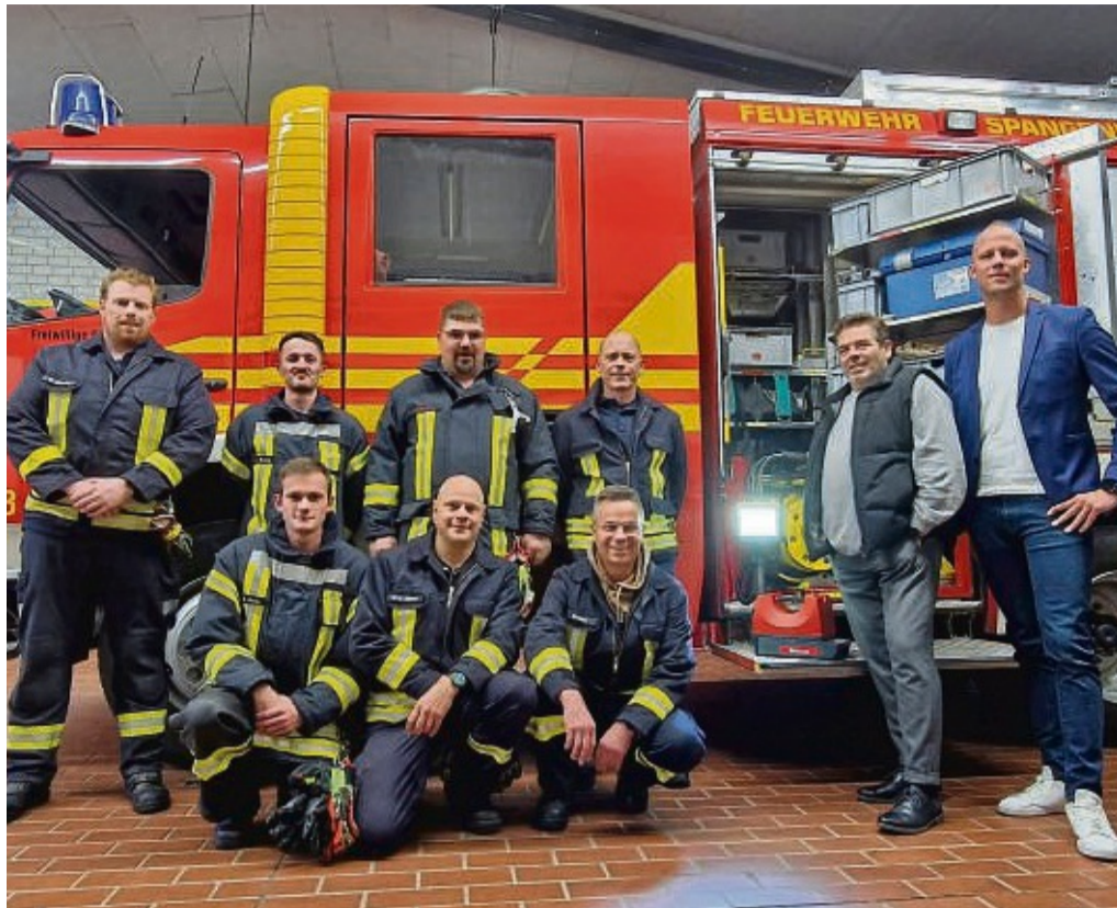
Tragbare Beleuchtung: Die SV Sparkassen-Versicherung spendete mobilen LED-Scheinwerfer an die Spangenberg Feuerwehr.