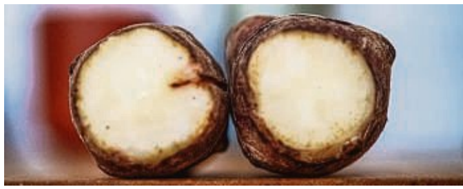
Topinambur , auch Erdartischocke oder Rosskartoffel genannt, schmeckt leicht süßlich bis nussig.

Im Kühlschrank zu Hause hält sich Topinambur in einem geschlossenen Behälter bis zu vier Wochen. Er schmeckt leicht süßlich bis nussig und passt in viele Gerichte. Entweder kann man