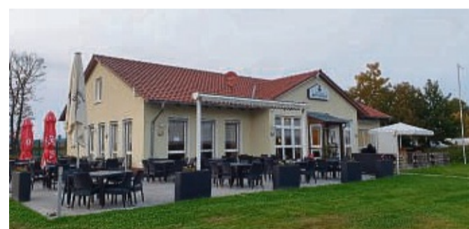
Das Restaurant Haus am See wurde von „Hessen à la Carte“ ausgezeichnet.

Schildes am Restaurant. Das Haus am See hat einen Landeslöwen erhalten. Es zeichnete sich durch die frische, saisonale und einfache Küche aus und den Blick auf den Neuenhainer See. Das Parkhotel zum Stern hat drei Löwen bekommen. Dort gibt es eine wechselnde Saisonkarte und bei den Märchenmenüs orientiert sich das Küchenteam an den Brüdern Grimm. red