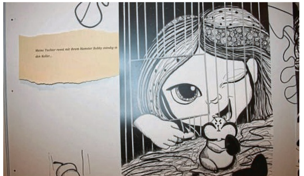
Ausstellung Stadtkirche Home - Behind Zeichnung von Olena Yushchenko „Children of War“.

ist täglich bis 24. November zwischen 9 und 18 Uhr in der Melsunger Stadtkirche zu sehen.