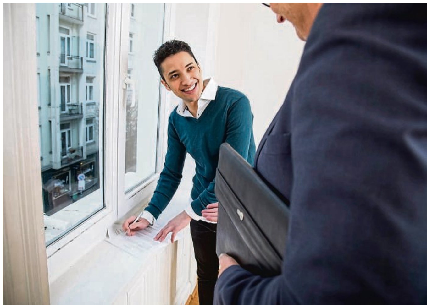
Bleiben Ihnen bis zur Rente nur noch wenige Jahre? Dann ist es trotzdem nicht zu spät, um noch fürs Alter vorzusorgen.