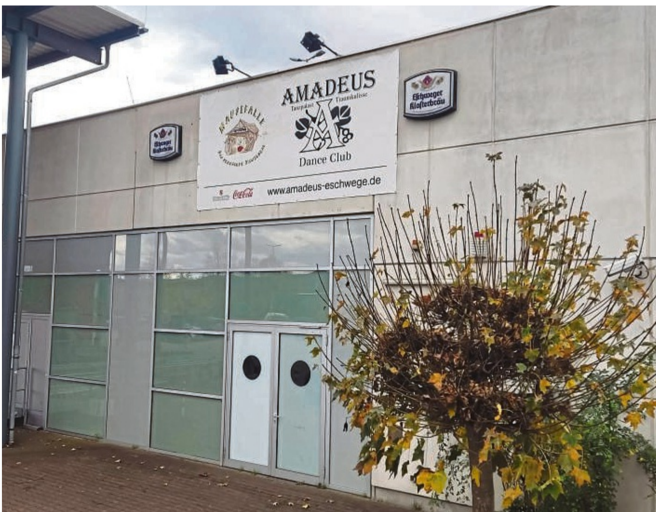
Bleibt bis auf Weiteres geschlossen: Hinter der Eingangstür von Amadeus und Mausefalle sollen Ausstattung und Technik noch vorhanden sein, sodass schnell wiedereröffnet werden könnte.

Bereits im Frühjahr hatten sich Wirsing und Kleinhenz um die Wiedereröffnung der einst so beliebten Disco auf dem Kaufland-Gelände bemüht. Der Eigentümer der Immobilie, die ILG in München, sollte sich um die aktuellen Brandschutzauflagen kümmern, damit hier wieder eine Disco einziehen kann. „Die Lüftungsanlage erfüllt die aktuellen Anforderungen nicht“, berichtet der Sprecher des Werra-Meißner-Kreises, Jörg Klinge. Schon seit 2018 wurde dem Eigentümer nahegelegt, hier nachzubessern. Aufgrund des bis dato problemfreien Betriebes wurde der Weiterbetrieb durch die Bauaufsicht geduldet. Gleichzeitig wurde aber ein Bauantrag gefordert. „Da der Bauantrag bis heute noch immer nicht vorliegt, wird die Duldung aufgehoben“, heißt es vonseiten der Bauaufsicht gegenüber unserer Zeitung. Grundsätzlich stehen keine bauaufsichtlichen Gründe einer Wiedereröffnung entgegen, wenn die brandschutztechnischen Maßnahmen abgearbeitet sind. Vor einigen