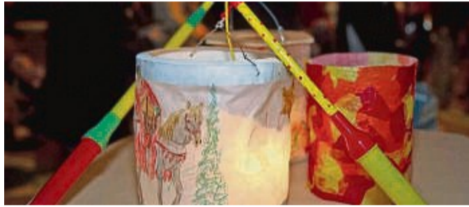
Gemeinsamer Laternenumzug: Im Anschluss gibt es warme Getränke und Speisen.

Auf Euer Kommen freut sich das Team vom Kindergarten Rabennest in Berneburg. red