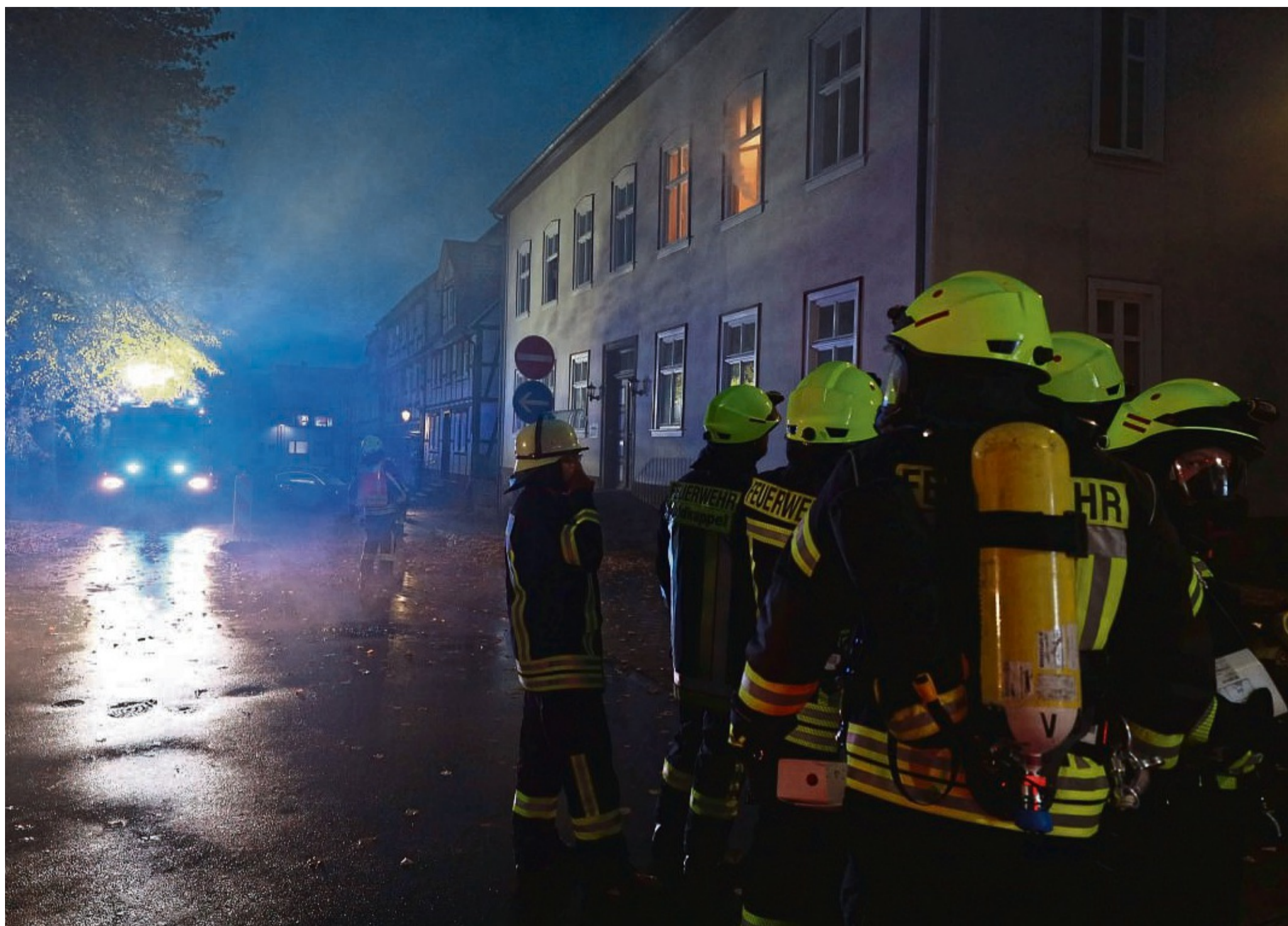
Für den Ernstfall geprobt: Die Freiwillige Feuerwehr Waldkappel-Kernstadt musste sechs Personen (drei Menschen, drei lebensgroße Puppen) aus einem simulierten Wohnungsbrand retten.