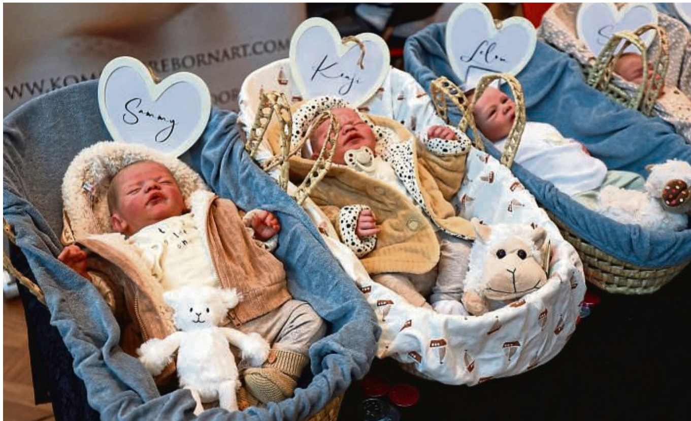
Lebensecht: Die Reborn-Babys sind Neugeborenen nachempfunden. Für sie gibt es bei den Puppenfesttagen viel Zubehör wie Schnuller, Windeln und Kleidung.

Schon vor Betreten der Halle war klar: Die Puppen-Fans sind auch dieses Jahr wieder zahlreich angereist; vor der Stadthalle bildete sich eine lange Schlange für den Einlass. Die Besucherinnen und Besucher waren gekommen, um sich neue Modelle anzuschauen oder für ihre Puppe Zubehör zu kaufen. Dabei blieb kaum ein Wunsch unerfüllt: Es gab Puppen aus allerlei verschiedenen Werkstoffen; wer auf der Suche nach neuer Puppenkleidung war, wurde auch schnell fündig. Aber auch Kissen oder ganze Liegen und Betten für die Puppen gab es dieses Jahr im Angebot.