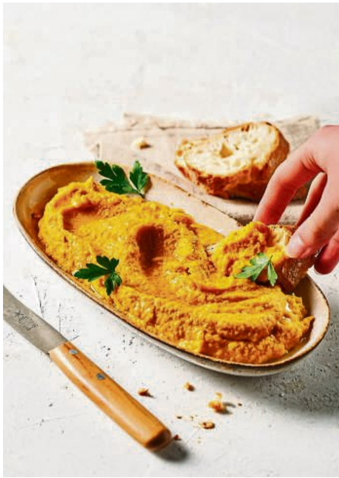
Der Karotten-Kichererbsen-Aufstrich lässt sich schon zwei Tage vor dem Festessen zubereiten.

Und bloß nicht beim Weihnachtsmenü experimentieren: „Wenn es daneben geht, führt das nur zu Frust“, sagt