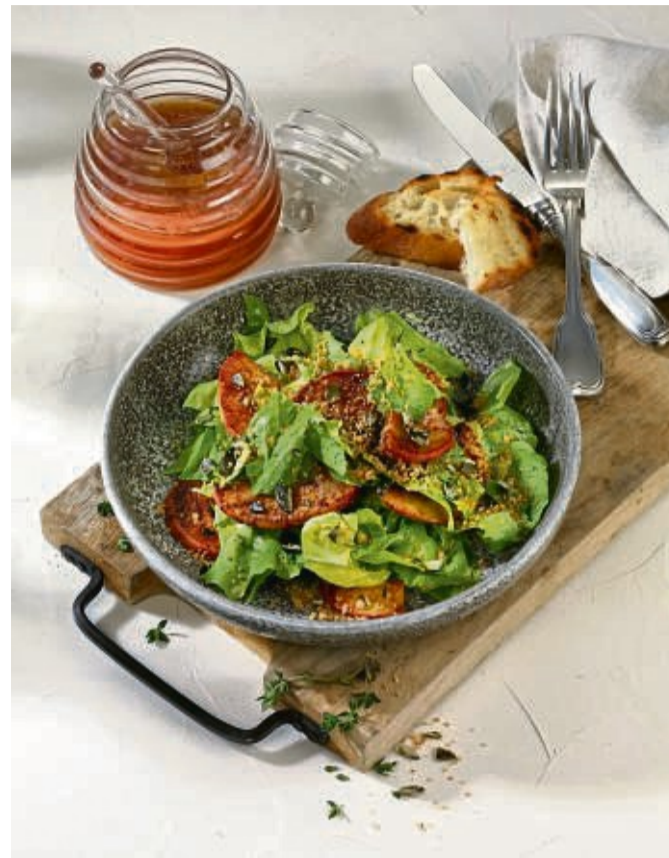
Endiviensalat mit Bratpfelscheiben ist als 2. Gang geplant: Dafür lässt sich der Salat bereits 1-2 Tage im Voraus vorschneiden und auch das Dressing mischen. Lediglich Bratpfelscheiben und Kürbiskernbrösel müssen noch frisch zubereitet werden.

Soll es einen frischen Salat geben, kann er schon zwei Tage im Vorfeld geschnitten und gewaschen werden. Das Dressing zum Salat lässt sich ebenfalls schon fertigmachen: „Danach das Dressing