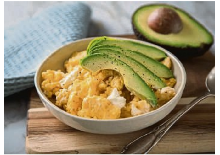
Grundlage einer gesunden Ernährungsweise bei Gicht bilden purinarme Lebensmittel, wie Eier, Milchprodukte sowie reichlich Obst und Gemüse.