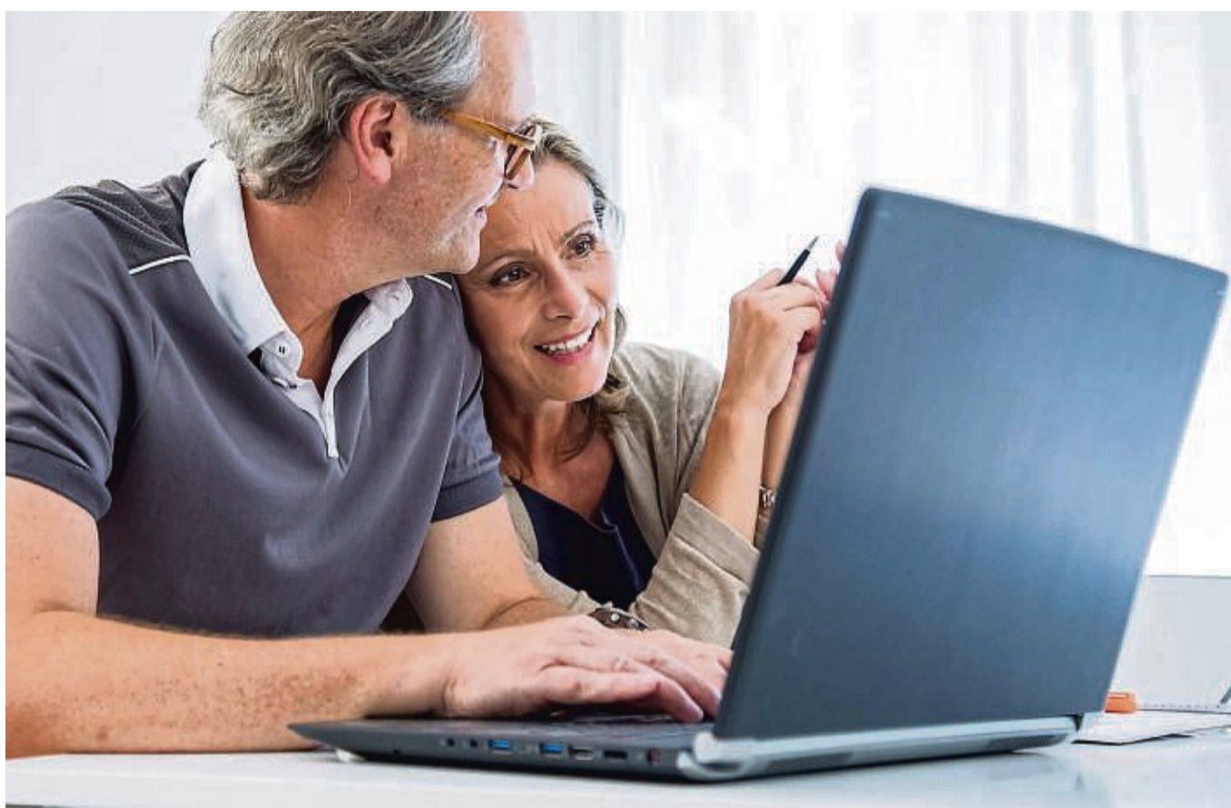
Bleiben Ihnen bis zur Rente nur noch wenige Jahre? Dann ist es trotzdem nicht zu spät, um noch fürs Alter vorzusorgen.

Die Vorteile: Die Einzahlungen sind steuerlich zu 100 Prozent absetzbar, der Wert der Rentenpunkte garantiert.