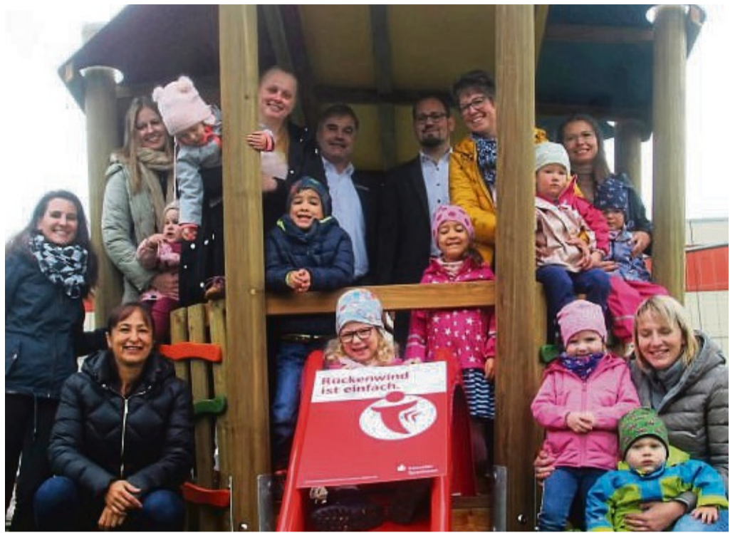
Grund zur Freude: Für die Erweiterung mit Spielgeräten und die Neugestaltung im Außenbereich der evangelischen Kindertagesstätte Dörnberg im Gesamtvolumen von 35 000 Euro hat der Kita-Förderverein 30 000 Euro an Spenden gesammelt. 5000 Euro davon kamen von der Kasseler Sparkasse.

Das Geld reichte auch für einen neuen Kinderwagen-Abstellplatz. Und schließlich passten auch noch zwei „Hexenhäuschen“ als jeweils überdachte Sandkasten-Außenspielstätte ins Budget, die aber in Kürze erst noch aufgebaut werden müssen.