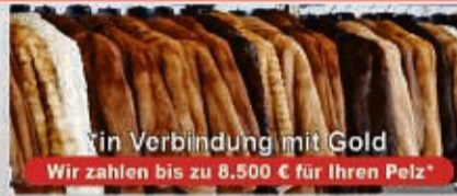
*in Verbindung mit Gold Wir zahlen bis zu 8.500 € für Ihren Pelz*