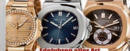
Edeluhren aller Art

Ihre Vorteile: ✓ kostenlose Beratung ✓ kostenlose Wertschätzung ✓ transparente Abwicklung ✓ Bargeld sofort