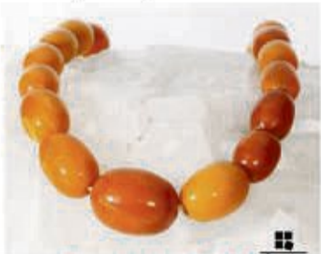
Bernstein aller Art