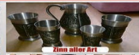
Zinn aller Art