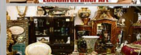
Antikes aller Art

Wir zahlen zur Zeit bis zu 64,50 Euro pro Gramm SOFORT BARGELD