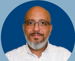
Töpfermarkt 6 34369 Hofgeismar