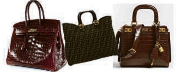
Wir kaufen auch hochwertige Markentaschen an

Die Experten sind für Sie da 6 Tage Aktion