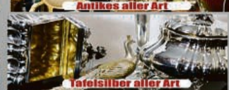
Tafelsilber aller Art