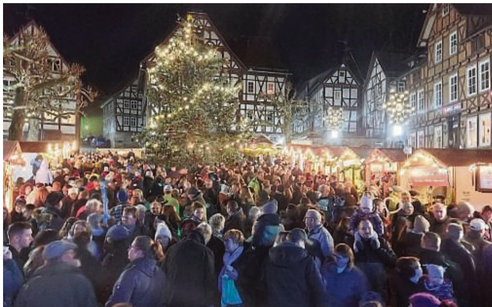
Viele Besucherinnen und Besucher waren im vergangenen Jahr auf den Kupferstädter Adventsmarkt gekommen, um sich am ersten Adventswochenende auf die Vorweihnachtszeit einzustimmen.

Feurig wird es dann um 20 Uhr bei der Feuershow „Spiral Fire“. Hier wird die Bühne mit faszinierenden Perfor-