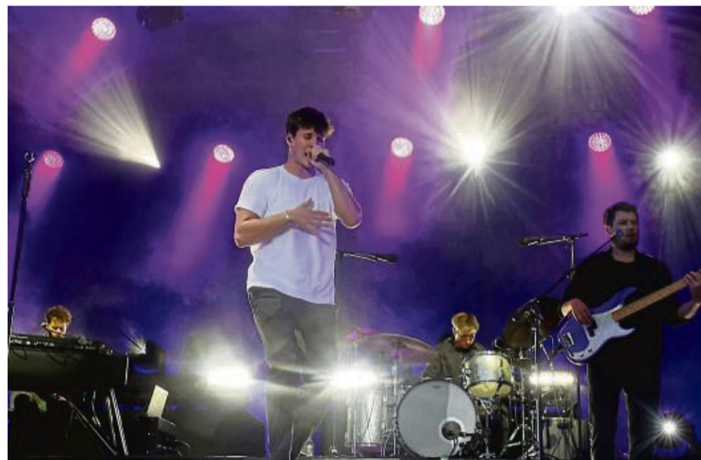
Weiß sein Publikum zu begeistern: Wincent Weiss wird im Sommer erneut in Bad Sooden-Allendorf auftreten.