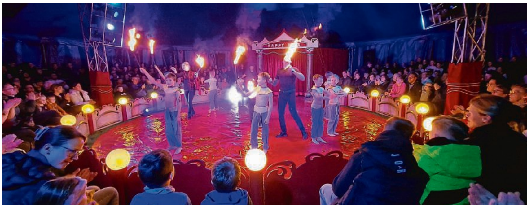
Feurige Show: Die jungen Fakire scheuten nicht davor zurück, mit bloßer Hand Feuer anzufassen oder über Nagelbretter zu gehen.

Begeistert folgte das Publikum der artistischen Reise um den Globus – angefeuert und beklatscht von Eltern, Freunden und Angehörigen, die das Zirkuszelt bis auf den letzten Platz belegt hatten. Mit Begeisterung tanzten die Kinder als bunte Urwaldvögel des brasilianischen Dschungels im Schwarzlicht, saßen als Fakire auf Nagelbrettern, zeigten sich als Feuerspucker und erstaunliche Akrobatinnen und Tänzer auf dem Seil. Die jeweils mitreißende Musik aus den Ländern hob Stimmung und Aufregung zusätzlich. Aufgeregt und dennoch mit großen Ernst bei der Sache absolvierten die Kinder der Klassenstufen eins bis vier ein professionelles Pro-