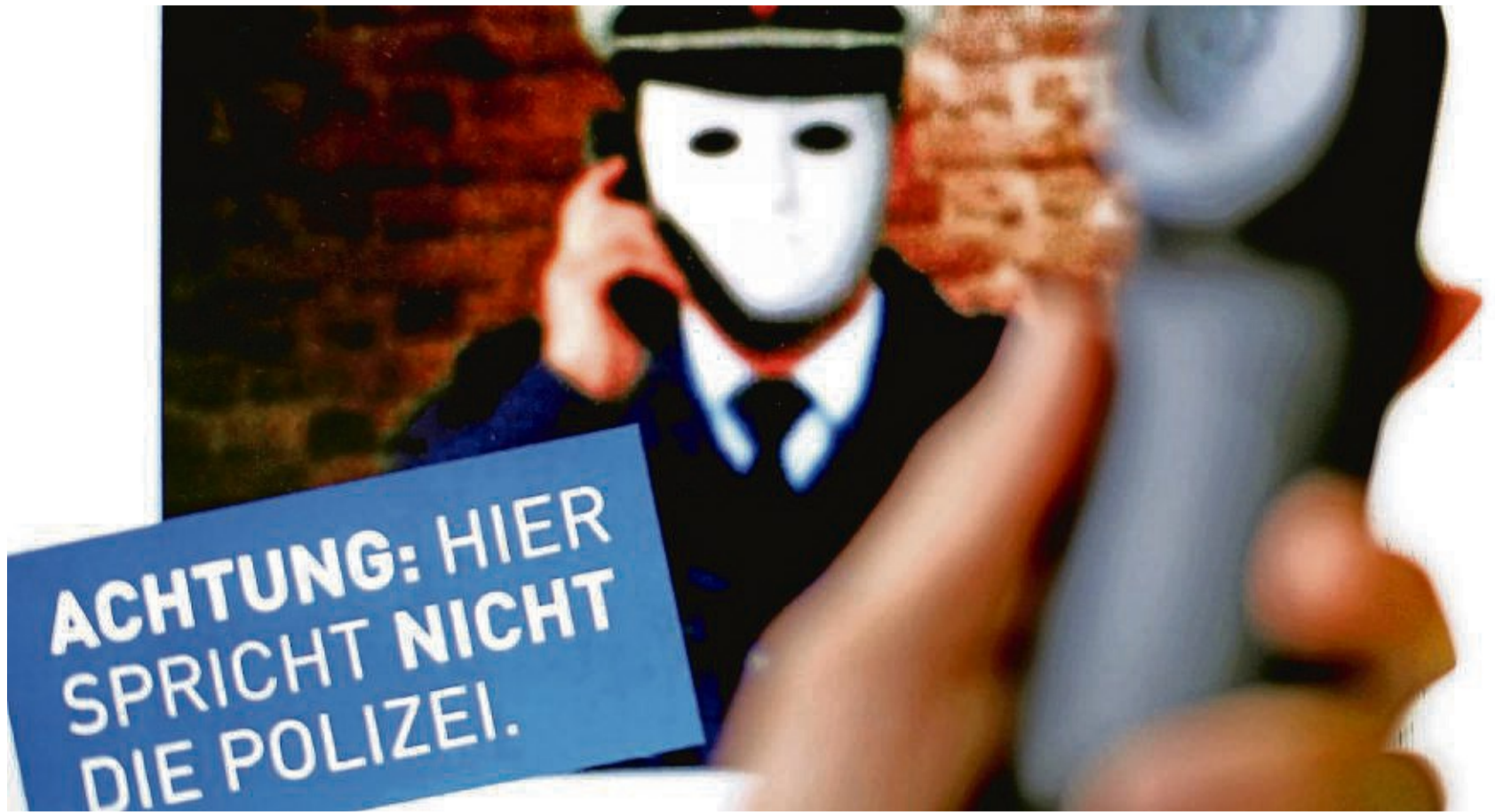
Versucht die Bevölkerung zunehmend aufzuklären: Die Polizei warnt vor Betrugsmaschinen.

Nachdem der Senior im Hintergrund des Anrufers weitere Stimmen ausmachte, bei der es sich angeblich um die Stimme seines Sohnes handeln sollte, erkannte er