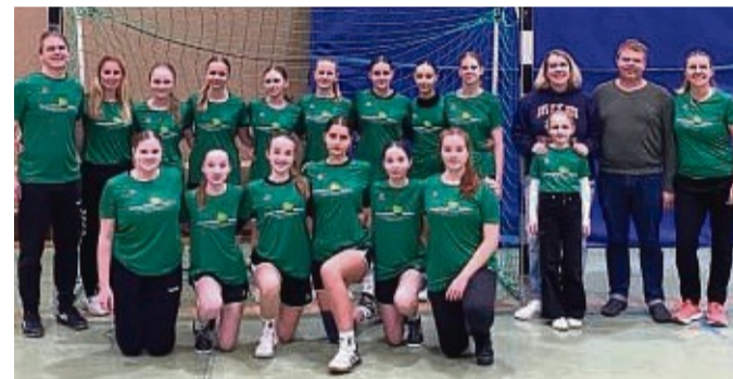
Stolzes Team: Die Mädels der Handballspielgemeinschaft nach ihrem Heimsieg.