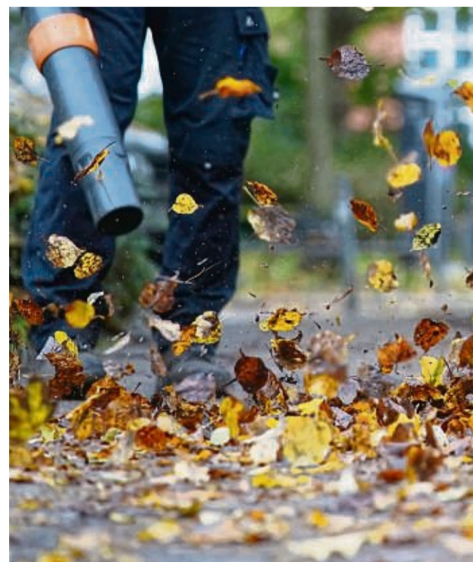
Kampf gegen das Herbstlaub: Laubbläser sind praktische Helfer - aber nur, wenn sie sachgemäß und sicher bedient werden.

Tipp für Laubbläser: Wählen Sie Geräte mit Überhitzungsschutz und einer Drehzahlsperrung, um eine konstante Leistung zu gewährleisten. Die Leistung des Gebläses sollte der Art des Laubs angepasst sein. tmn