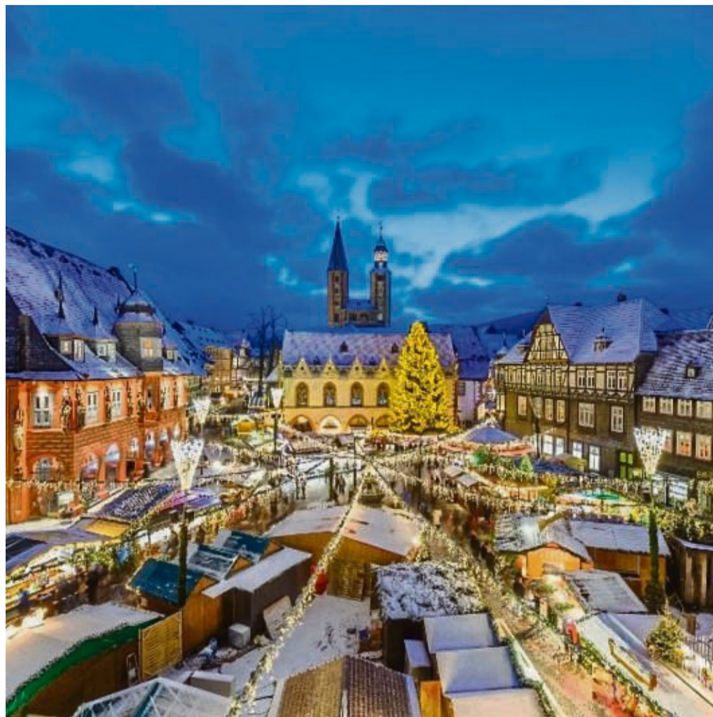
Besonders stimmungsvoll: Goslar ist für seinen Weihnachtsmarkt weit über die Grenzen des Harzes hinaus bekannt.

Der Bus hält auf jeden Fall in Witzhausen, Sontra und Eschwege. Je nach Anmeldungen aus anderen Or-