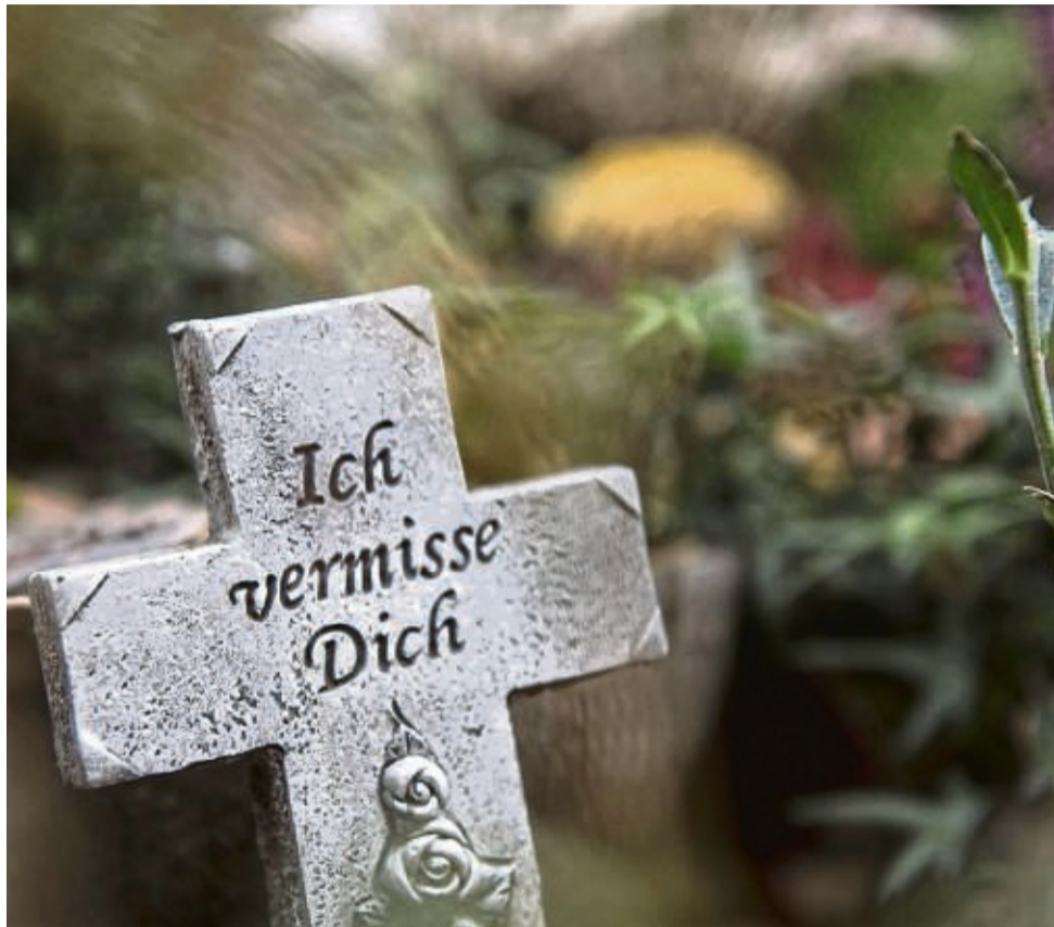
Die Vorweihnachtszeit ist für Trauernde oft auch die einsamste Zeit des Jahres.

Gerade die bevorstehenden Feiertage sind für viele Menschen in einer persönlichen Trauersituation schwer, belastend und mit Tränen verbunden. Psychologen wissen um den psychischen Stress, den Trauernde in den letzten Wochen des Jahres durchleben müssen. Um der Melancholie der dunklen Tage tröstende Akzente entgegenzusetzen, sind viele Pflanzen da. Diese sorgen für Farbe auf den Gräbern und für die ein oder andere schöne Erinnerung.