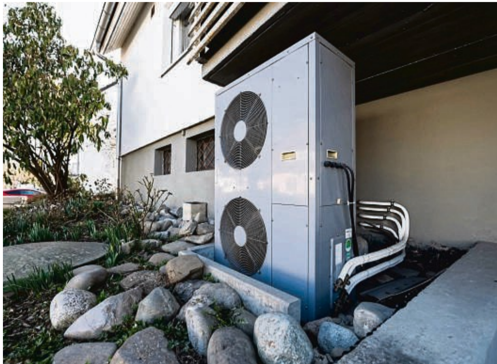
Eine moderne Wärmepumpe kann auch der Wohnungseigentümergeinschaft helfen, langfristig fossile Brennstoffe zu sparen und Betriebskosten zu reduzieren.

Das lässt sich pauschal nicht sagen, denn außer von der Art der Pumpe hängt die Dimension von der Heizlast und dem Zustand des Gebäudes ab. „Je besser gedämmt die Hülle des Gebäudes ist, desto kleiner muss die Technik werden und desto günstiger wird es“, so Titz. Eine schlanke und effiziente Lösung setzt also voraus, dass keine Wärme durch fehlende