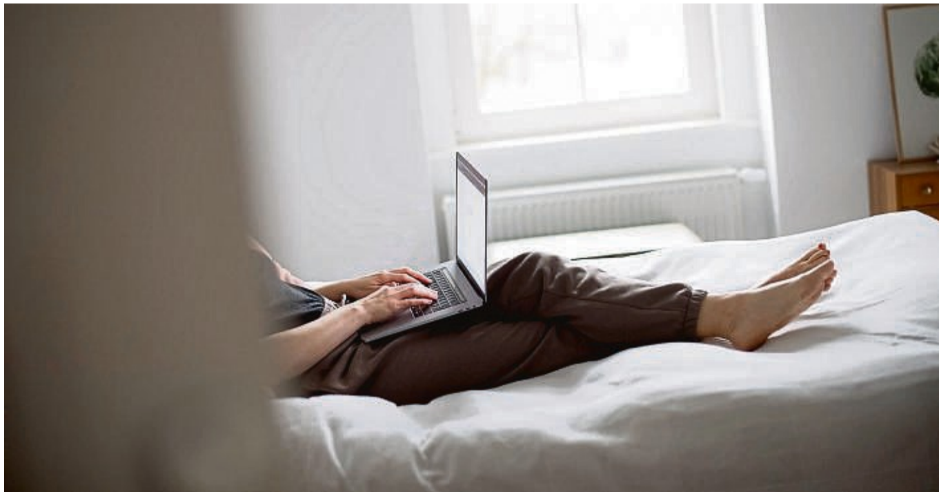
Die Jeans ist auf dem Bett tabu, die Zuhause-Jogginghose darf: So lautet die Regel bei einigen zu Hause.