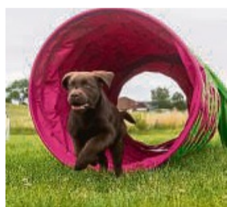
Eine Variante des normalen Agility ist das Hooper Agility.

Dieses Training hält die Hundetrainerin für deutlich sinnvoller als das Werfen von Bällen. „Mit diesem stupiden Hetzen heizen sich die Hunde immer nur weiter auf.“