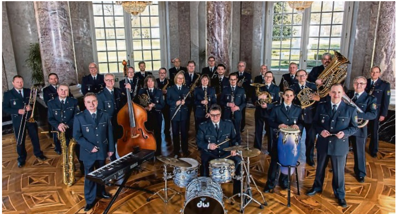
Vom Big-Band-Sound bis zu aktueller Rockmusik: Die Profimusiker des Landespolizeiorchesters haben ein breites Repertoire. Am 21. November gibt das Landespolizei Orchester ein Konzert in Battenfeld.