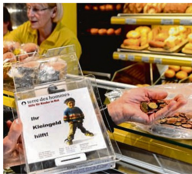
Mit Kleingeld helfen: Alljährlich sammelt Terre des hommes Frankenberg auf Ladentheken mit solchen Spendenbrettern vierstellige Euro-Beträge ein.