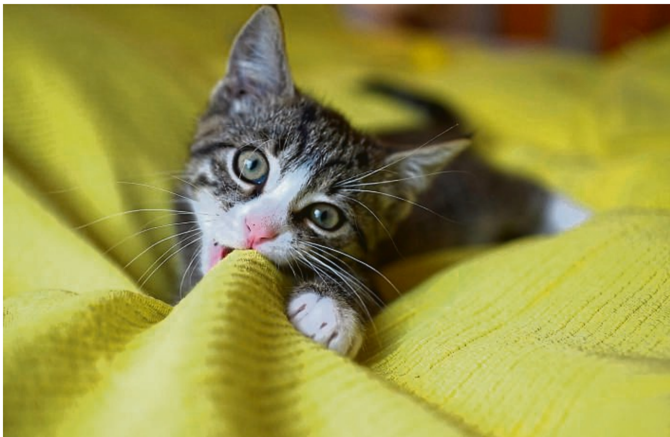
„Spiel mit mir!“. Auch Katzen wollen unterhalten werden.

Um Ihre Katze besser zu verstehen, ist es essenziell, auf ihre Körpersprache und Laute zu achten. Eine angespannte Katze könnte beispielsweise schlecht auf Berührungen reagieren, besonders wenn sie aufgeregt ist, wie etwa beim Beobachten einer anderen Katze. „Wenn man sie in einer solchen Situation anspricht, kann es sein, dass sie den Menschen