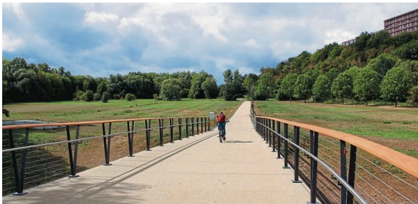
Die Brücke über die Eder zwischen den beiden Wehrweiden in Frankenberg wurde im Frühjahr 2022 installiert.