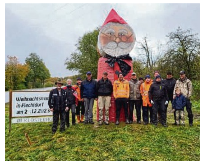
Die Flechtdorfer laden am Samstag, 2. Dezember, ins Kloster zum Weihnachtsmarkt ein.

Der Winterspielplatz öffnet das nächste am 29. November. Danach geht es nach dem Jahreswechsel am 17., 24., 31. Januar sowie am 7. Februar weiter.