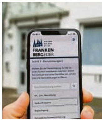
Bei der Stadt Frankenberg kann man online Termin für Bürgerbüro, Standesamt oder Gewerbeamt buchen.

Aus einer Liste kann online die gewünschte Dienstleistung ausgewählt werden. Über die Online-Maske bekommen Nutzer alle verfügbaren Termine angezeigt und können den Wunschtermin auswählen. Das System zeigt sogar an, wie lange der Termin voraussichtlich dauert und schickt eine Terminerinnerung per E-Mail. Wer möchte, kann den Termin in den eigenen digitalen Terminkalender übernehmen. Direkt nach der Online-Ter-