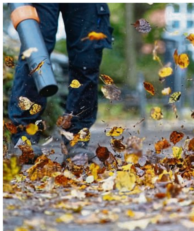
Kampf gegen das Herbstlaub: Laubbläser sind praktische Helfer - aber nur, wenn sie sachgemäß und sicher bedient werden.

Tipp für Laubbläser: Wählen Sie Geräte mit Überhitzungsschutz und einer Drehzahlsperrung, um eine konstante Leistung zu gewährleisten. Die Leistung des Gebläses sollte der Art des Laubs angepasst sein. tmn