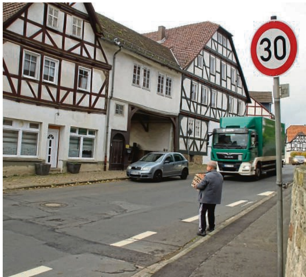
Tempo 30 gilt nur für den Bereich der ehemaligen Landesstraße in Felsberg zwischen Sparkassenkreisel und Obertor.