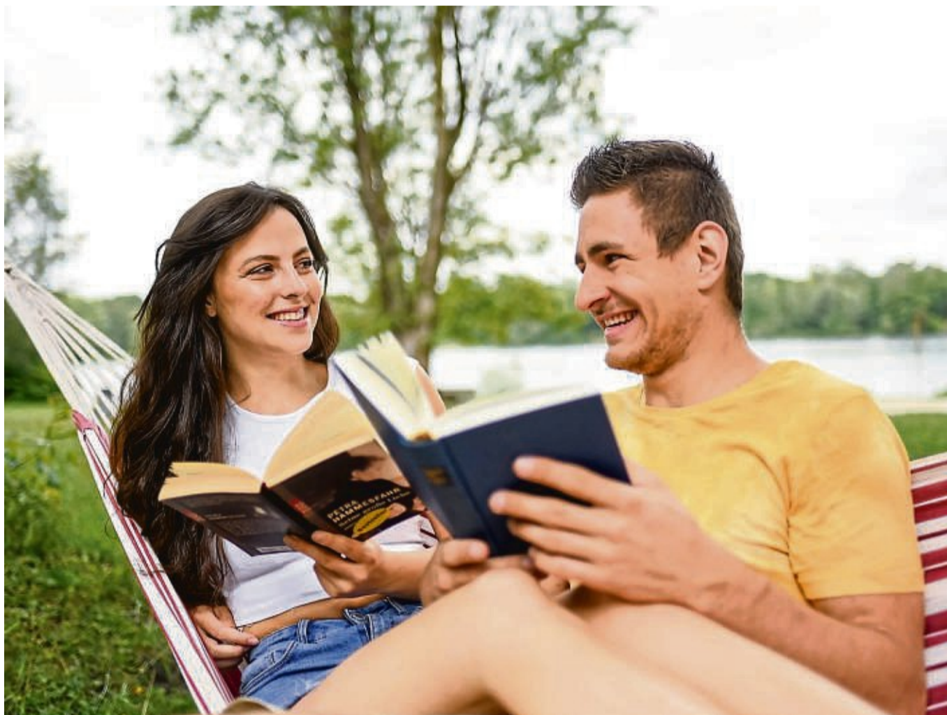
Mehr freie Zeit am Stück: Das klappt, wenn man Urlaubstage rund um Feiertage legt.

Hinzu kommt: Urlaub an Brückentagen ist natürlich für viele Beschäftigte attraktiv. Oft ist es jedoch nicht möglich, dass die gesamte Belegschaft Urlaub nimmt - schließlich muss der Betrieb in vielen Unternehmen weiterlaufen. Manchmal kann