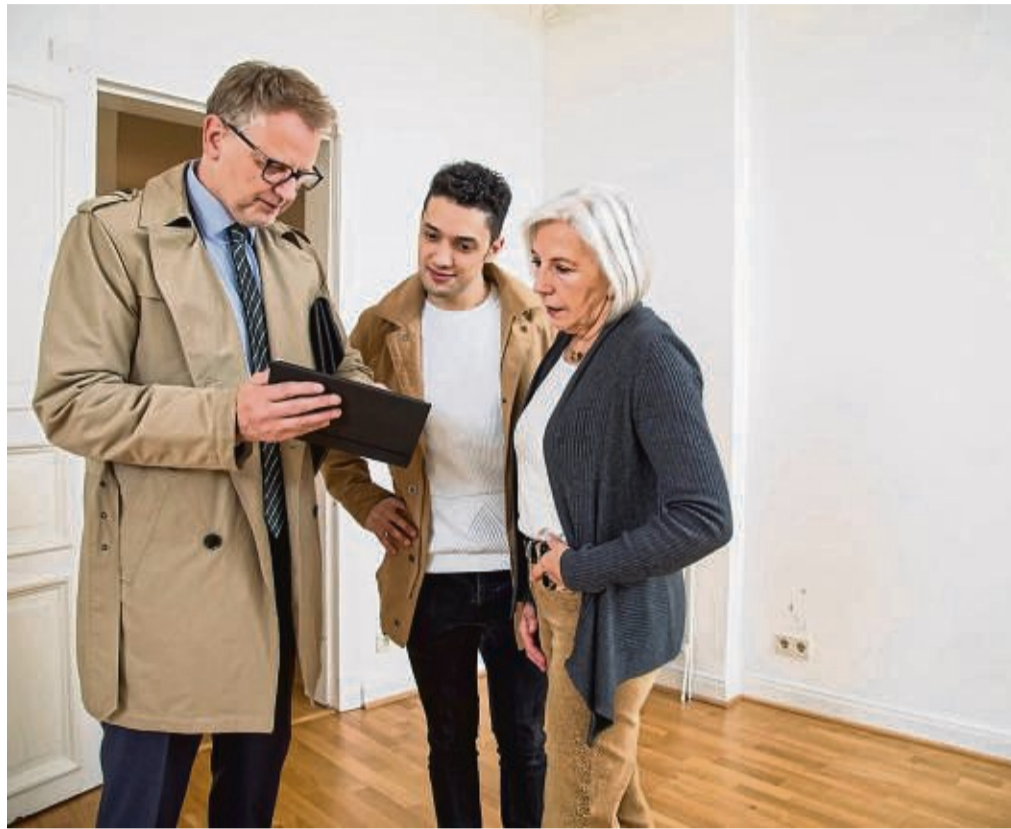
oft sind es Eltern, die für ihre Kinder einstehen: Wer eine Wohnung sucht, tut sich mit einer Bürgschaft mitunter leichter.