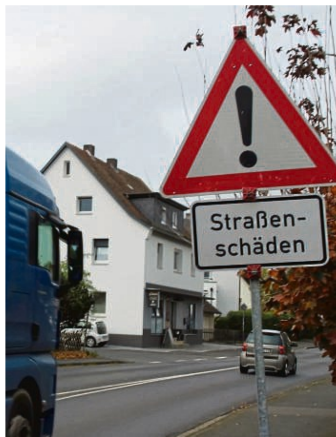
Trotz Ausbesserungsarbeiten: Auf der Landesstraße Steinweg warnen Schilder vor Straßenschäden.