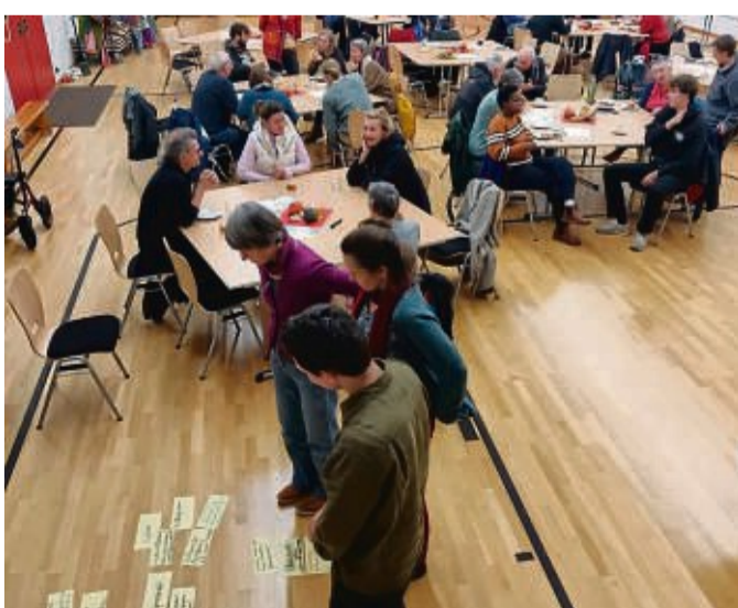
Rund 80 Teilnehmer kamen zum Treffen an der Turnhalle in der Südbahnstraße.