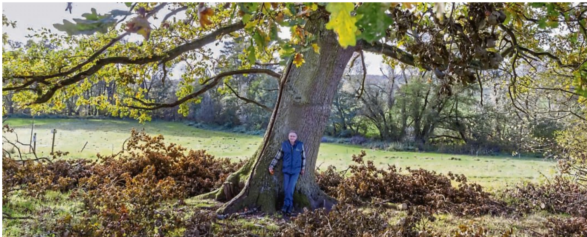
Die Traubeneiche kann bis zu 40 Meter hoch werden. Dieses Exemplar hat seine Kraft dazu genutzt, die Krone in die Breite zu treiben, statt die 40 Meter zu erreichen. Ein breiter Spannungsriss reicht bis hinauf zur Krone, berichtet Hans-Joachim Haberstock.