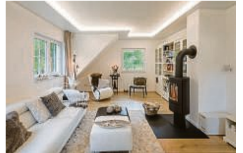
Mit Licht dein Wohnzimmer verzaubern

LED-Beleuchtung: Die Decken sind so vielseitig, dass du sie harmonisch jedem Wohnstil anpassen kannst. Wohn-, Schlaf- und Esszimmer sowie Küche, Flur und Bad erhalten damit schnell ein neues Gesicht. Montiert werden sie einfach unterhalb