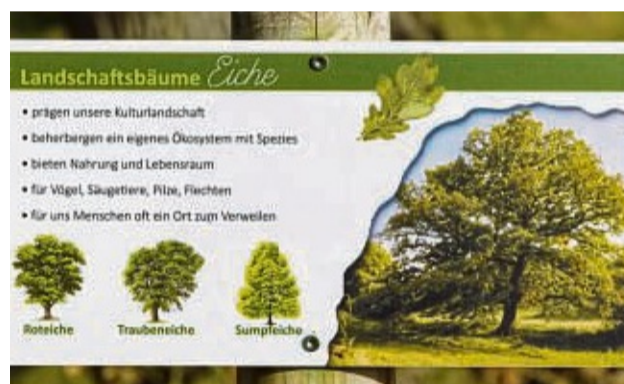
Kleine Schautafel mit Informationen zu den Landschaftsbäumen

„Für die Unterstützung vom Landkreis bin ich auch