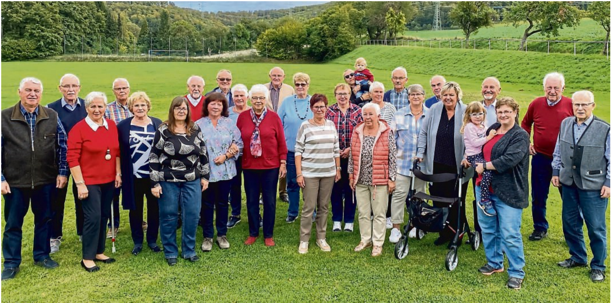
Nehmen Abschied: die Sängerinnen und Sänger des Sport- und Gesangvereins Lippoldshausen.