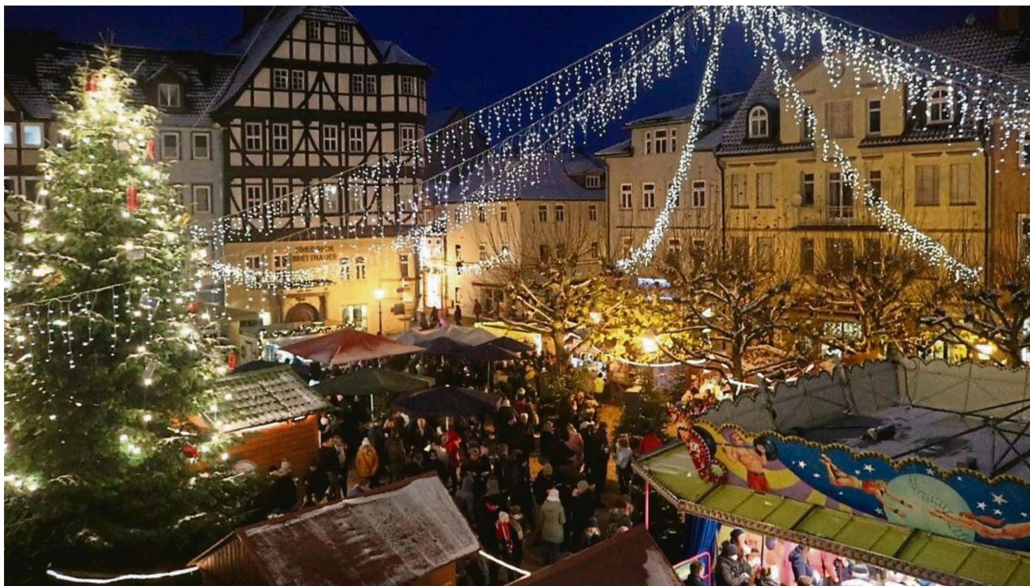
So hat er jüngst noch ausgesehen: Während der Bauarbeiten auf dem Marktplatz musste der Weihnachtsmarkt ausweichen. Jetzt ist er wieder an seinem angestammten Platz zurück.