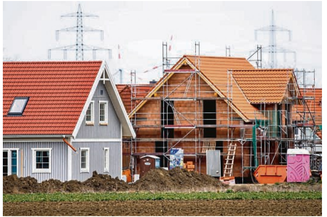
Es lohnt sich, verschiedene Kreditangebote miteinander zu vergleichen. Mit einem günstigeren Zinssatz können Bauwillige so Zinskosten in Höhe von mehreren Zehntausend Euro sparen.