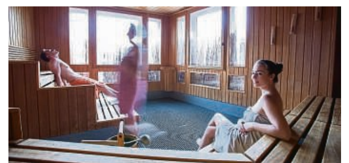
In der Sauna trägt man am besten Tageslinsen, die im Anschluss entsorgt werden.

Mit einer kleinen Maßnahme lässt sich dieses Risiko beim Saunieren senken. Wer Kontaktlinsen trägt, schließt im Wasserbecken, beim kalten Guss oder unter der Dusche am besten die Augen. Weiterer Vorteil: So gehen die Kontaktlinsen nicht verloren, weil man sie versehentlich ausspült. Übrigens: Damit Keime keine Chance haben, trägt man in der Sauna am besten Tageslinsen, die im Anschluss entsorgt werden.