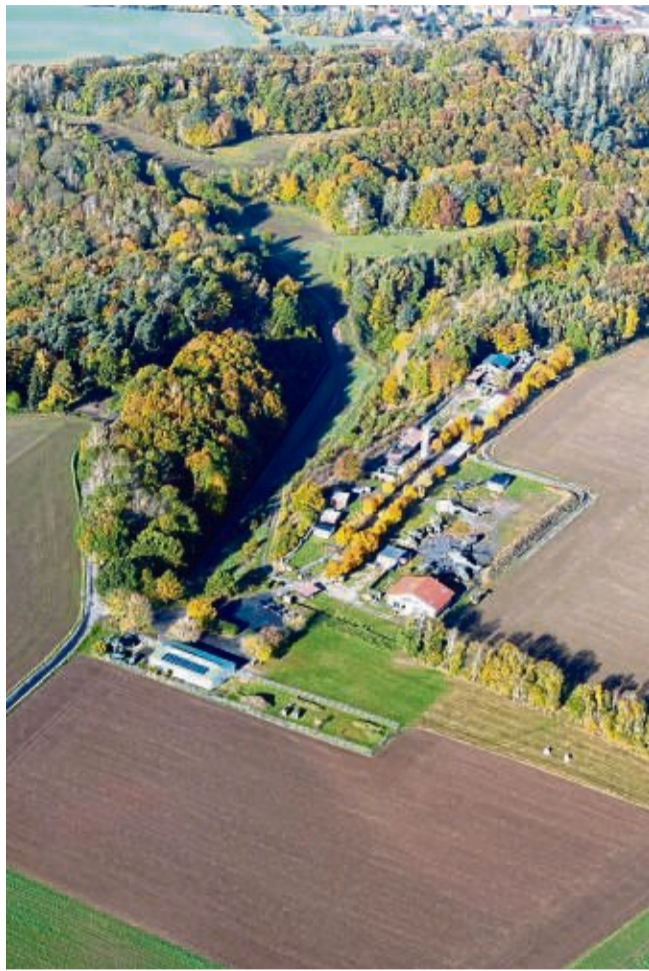
Das Grenzmuseum Schiffersgrund (links) erhält vom Land Hessen eine Förderung in Höhe von 67 000 Euro, die Jugendbildungsstätte Burg Ludwigstein wird mit 24 000 Euro gefördert.