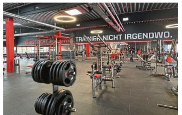
Das Motto von Ai Fitness motiviert auch beim Trainieren in der sog. Eisenschmiede.

ningsgeräten von Matrix und Gym80. Jeder wird bei Ai Fitness individuell an die Hand genommen, sodass alle ihr Ziel erreichen. Besteht Interesse an einer Mitgliedschaft,