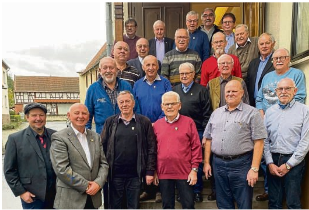
Die Jubilare der Eisenbahn- und Verkehrsgewerkschaft (EVG).