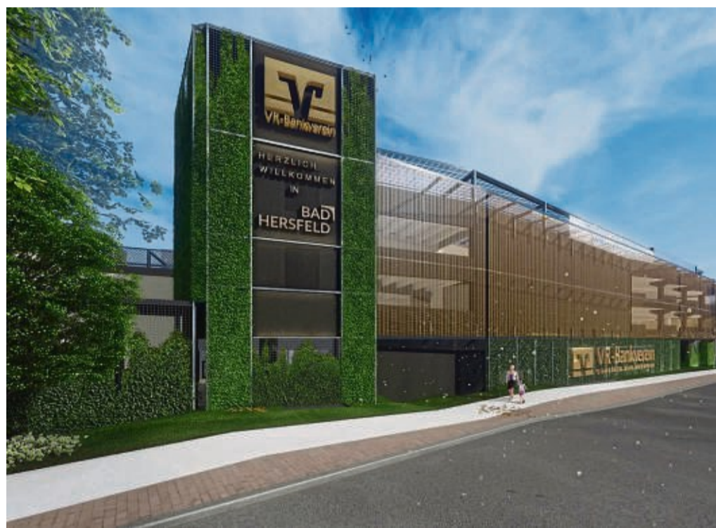
Nach Abschluss der Sanierungsarbeiten erhält das VR-Bankverein-Quartier an der Antonien-gasse in Bad Hersfeld optisch und funktionell ein neues Gesicht.

Die Rohbaumaßnahmen sind inzwischen fertiggestellt und die Gewerbeflächen im Erdgeschoss werden derzeit vorbereitet. „Wir verstehen unsere Sanierung als Initialzündung für die nachhaltige Wiederbelebung des Quartiers und als Impuls für die gesamte Innenstadt Bad Hersfelds“, sagt Hartmut Apel, Vorstandsmitglied des VR-