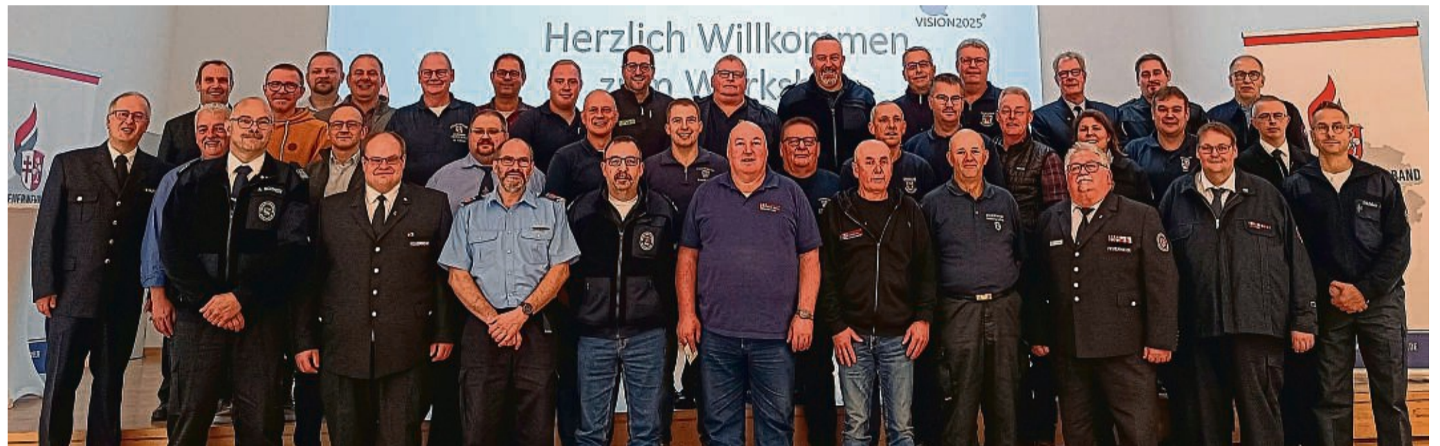
Das Ergebnis der Anfang des Jahres durch den Feuerwehrverband initiierte Imagekampagne ist in Friedewald einem Kreis von 50 Feuerwehrfrauen und Männern präsentiert worden.