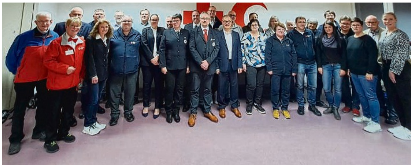
Ein großes Team: Der Beitritt der DRK-Ortsvereine des früheren Kreisverbandes Rotenburg zum Kreisverband Hersfeld-Rotenburg wurde kürzlich mit einer kleinen Feierstunde gewürdigt.

Katastrophenschutz in Hersfeld-Rotenburg mit vier Zügen unter einer Regie