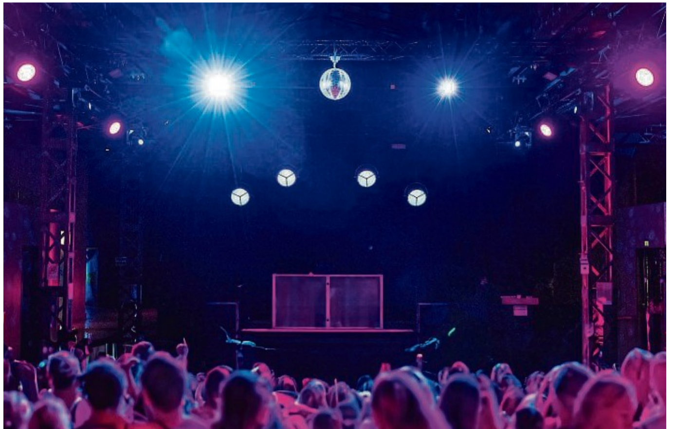
Durch die Nacht tanzen kann man weiterhin und in noch größerer Vielfalt regelmäßig in der Schilde-Halle Bad Hersfeld. Der nächste Dance-Club-Abend findet am Samstag, 2. Dezember, statt.