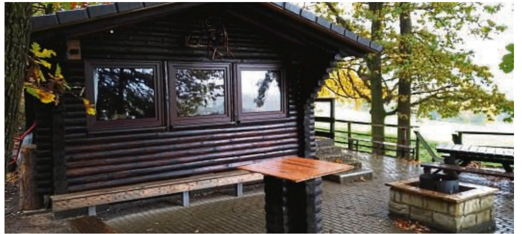
Der Heimat- und Kulturverein Friedigerode hat dank Spenden und viel Eigenleistung die Schutzhütte vor dem Eisenberg renoviert.