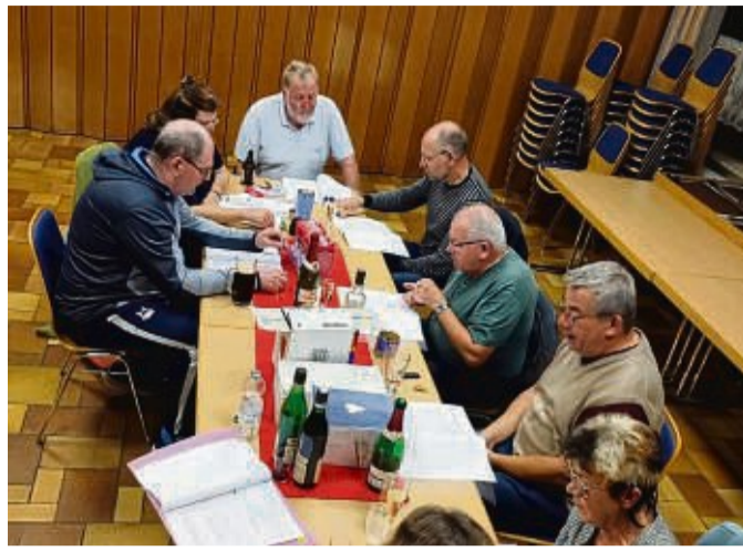
Jetzt wird gebüffelt: die Oberellenbacher Bühne bei einer Leseprobe für die Kreuzfahrt-Komödie „Einmal Bali und zurück“ im Jugend- und Freizeitheim. Nun muss sich jeder in seine Rolle finden.

Zum Inhalt: Für Ludwig von Ballheimer, Kapitän der M. S. Luxor, ist Kreuzfahrfeeling Routine – auch wenn es bei seiner Vorliebe für hü-