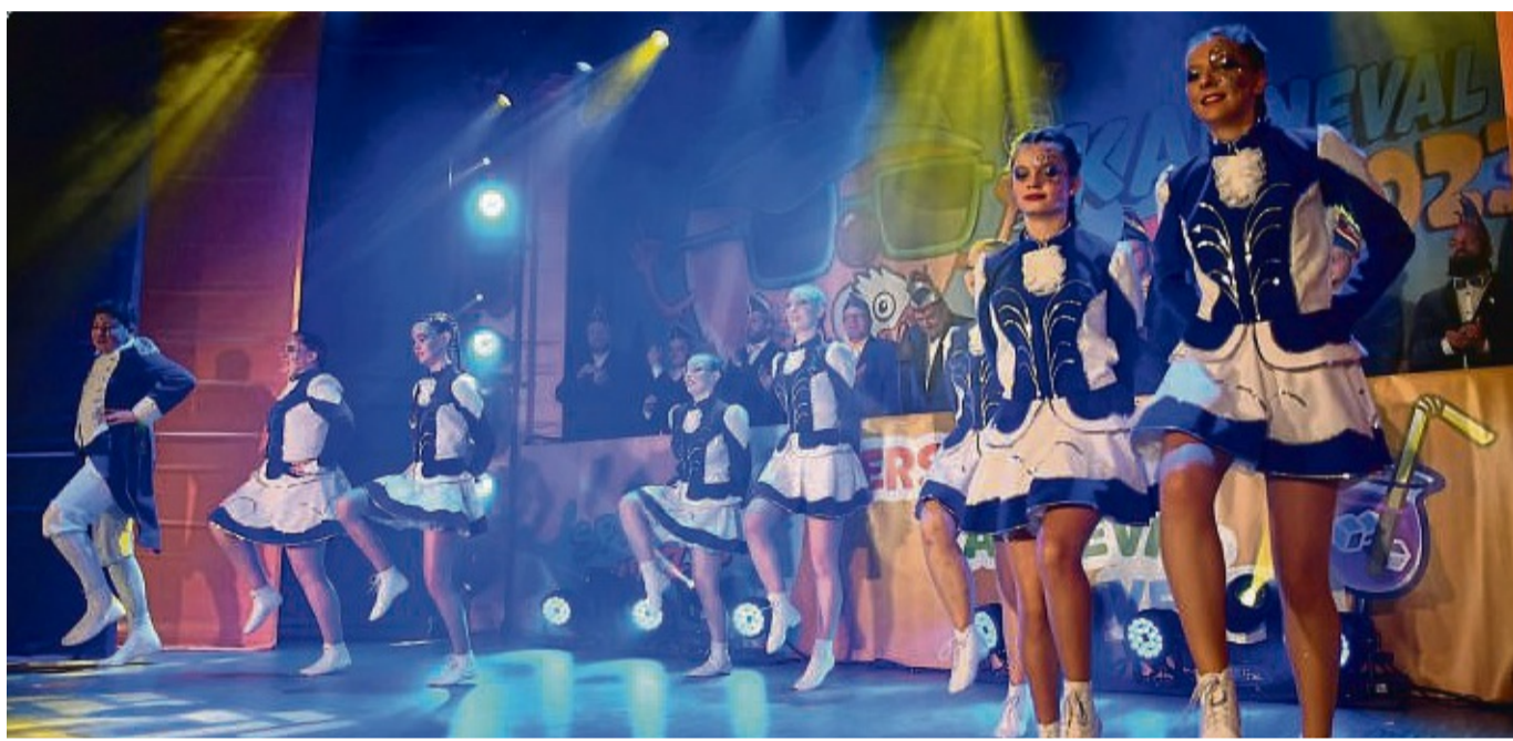
Mehr als 1000 Gäste werden auch diese Karnevalsaison in Wildeck-Obersuhl erwartet. Dort wird im Januar auch wieder getanzt.