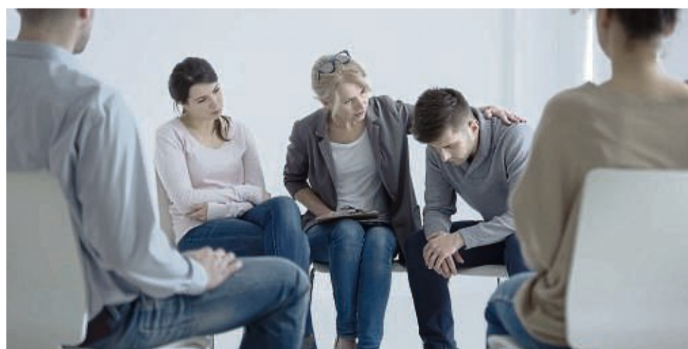
In Gesprächen mit anderen Menschen kann die Trauer oft am besten verarbeitet werden, doch ist auch dieser Prozess individuell.

Untere Frauenstraße 30 • 36251 Bad Hersfeld