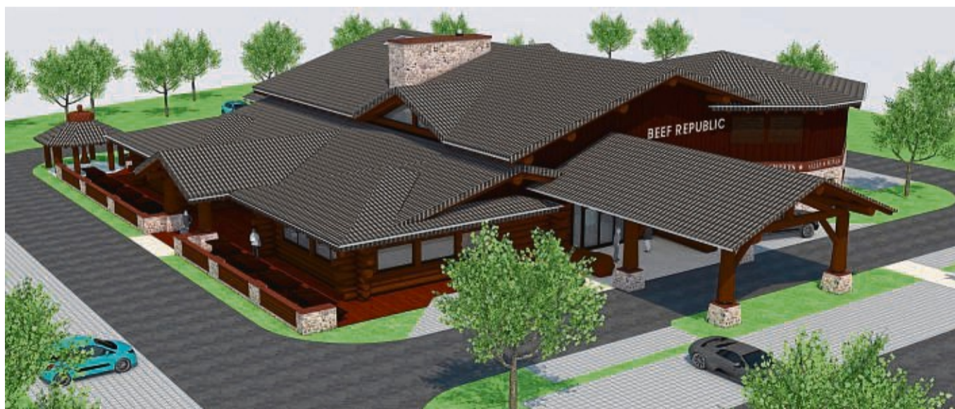
Auf dem Gelände der ehemaligen Ford-Zentrale an der Hochbrücke in Bad Hersfeld baut der VR-Bankverein ein Timberjacks BBQ Restaurant.