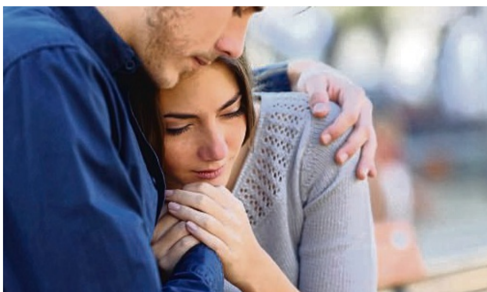
In Zeiten der Trauer ist der enge Kontakt zu anderen Trauerenden wichtig, um gemeinsam Antworten auf Fragen zu finden.

Ein emotionaler Schockzustand ist oft die erste Reaktion auf den Tod eines geliebten Menschen. Dieser