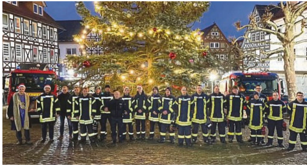
Alljährlich trifft sich die Feuerwehr auf dem Marktplatz, um anschließend die Nikolausgeschenke bei den Kindern vorbei zu bringen.

Am Freitag, 24. November, werden in Sontra-Hornel ab 16 Uhr durch die Freiwillige Feuerwehr die Unterflurhydranten gespült und winterfest gemacht. Dabei kann es jedoch zeitweise zur Trübung oder Braunfärbung des Trinkwassers bzw. zu Druckabfall kommen. Nach Abschluss der Arbeiten wird sich das Ganze wieder normalisieren. Wir bitten um Verständnis.