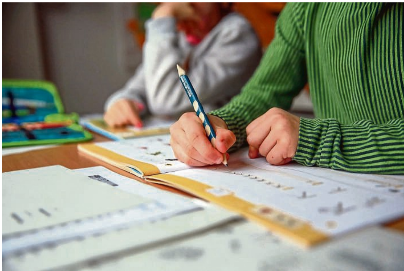
Wenn beim Schreiben des Kindes immer wieder verschiedene Fehler in ein- und demselben Wort auftauchen, könnte das ein Zeichen für eine Rechtschreibstörung sein.