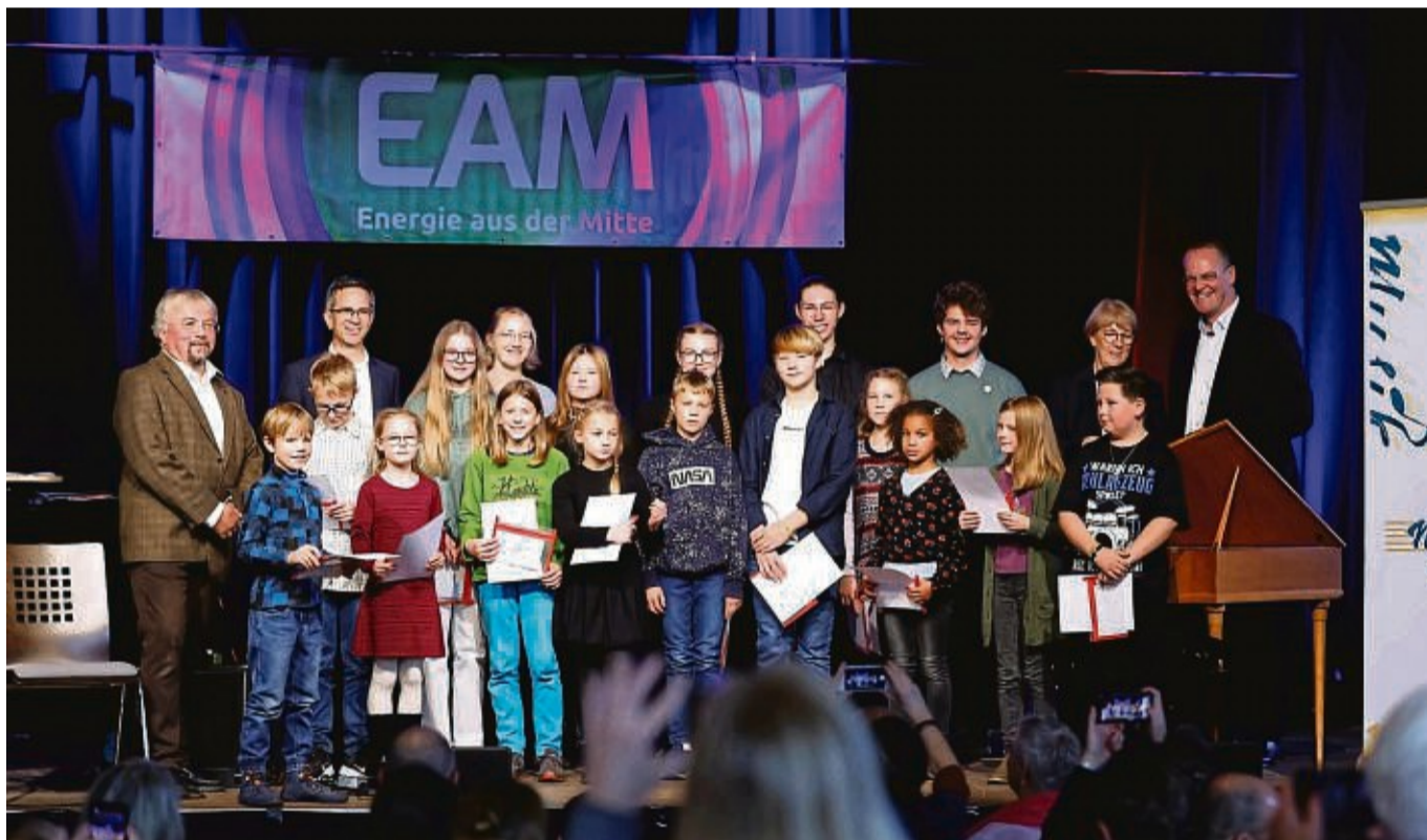
Zeigten ihr Können vor Publikum: Die Preisträger des Wettbewerbs der Musikschule Werra-Meißner, des Fördervereins und der Musik- und Kulturstiftung Werra-Meißner.

Die Preisträger wurden in vier Altersgruppen eingeteilt, wobei die Vielfalt der Instrumente und Genres beeindruckend war.