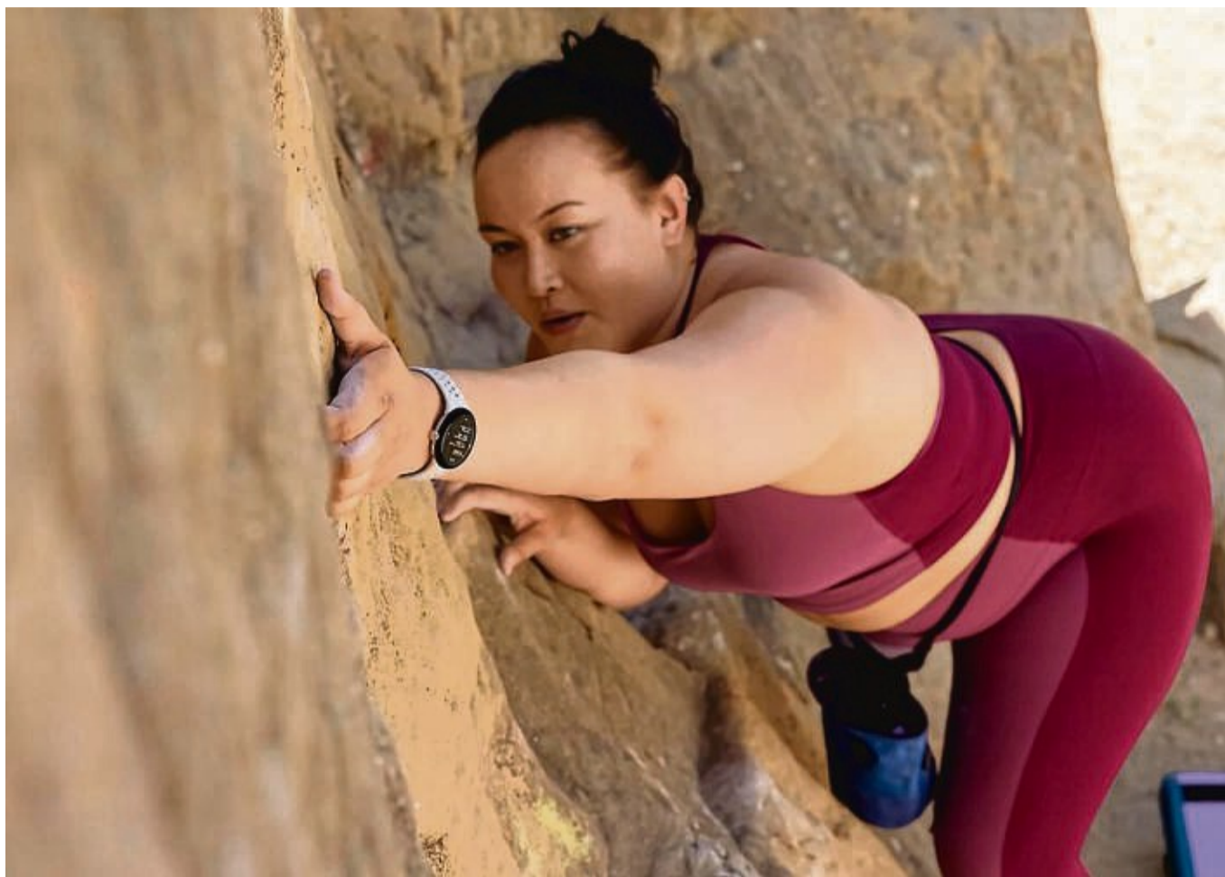
Ein Fitnessdatenfest für Sportlerinnen und Sportler: Mit ihren 13 Sensoren misst die Pixel Watch 2 alles nur Erdenkliche.