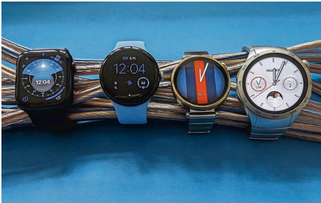
Smartwatches im Vergleich (von links): Apple Watch Series 9, Google Pixel Watch 2, Huawei GT 4 (41mm) und Huawei GT 4 (46mm).