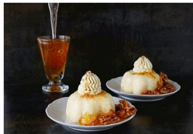
Mit einer Sahnehaube wird der Pudding mit Orangensauce zum Türmchen.