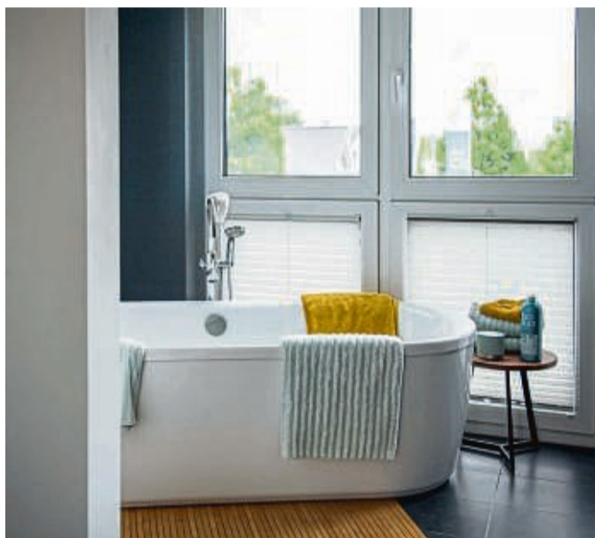
Das Bad ist für viele Menschen ein Wohlfühlort. Eine regelmäßige Erneuerung steigert bei einem möglichen Verkauf die Chancen.

Zum anderen spielt der Zustand des Hauses eine Rolle. Es hat wenig Zweck, die Fassade zu dämmen, ohne die luftigen Fenster auszuwechseln oder umgekehrt. Auch