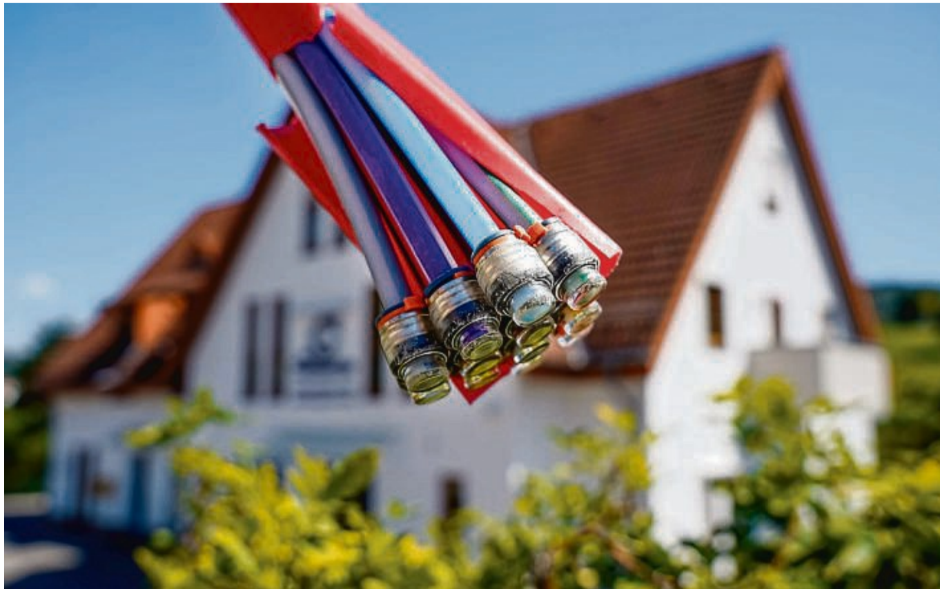
Ein Glasfaseranschluss wird in Zukunft immer wichtiger. Wer sich diesen in sein Wohnhaus einbauen lässt, hat bei einem möglichen Verkauf bessere Argumente.