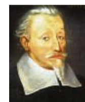
Heinrich Schütz 350. Todestag

Weiterhin sind die Beschaffung eines Gewächshauses sowie neuer Waffeisen geplant. wi