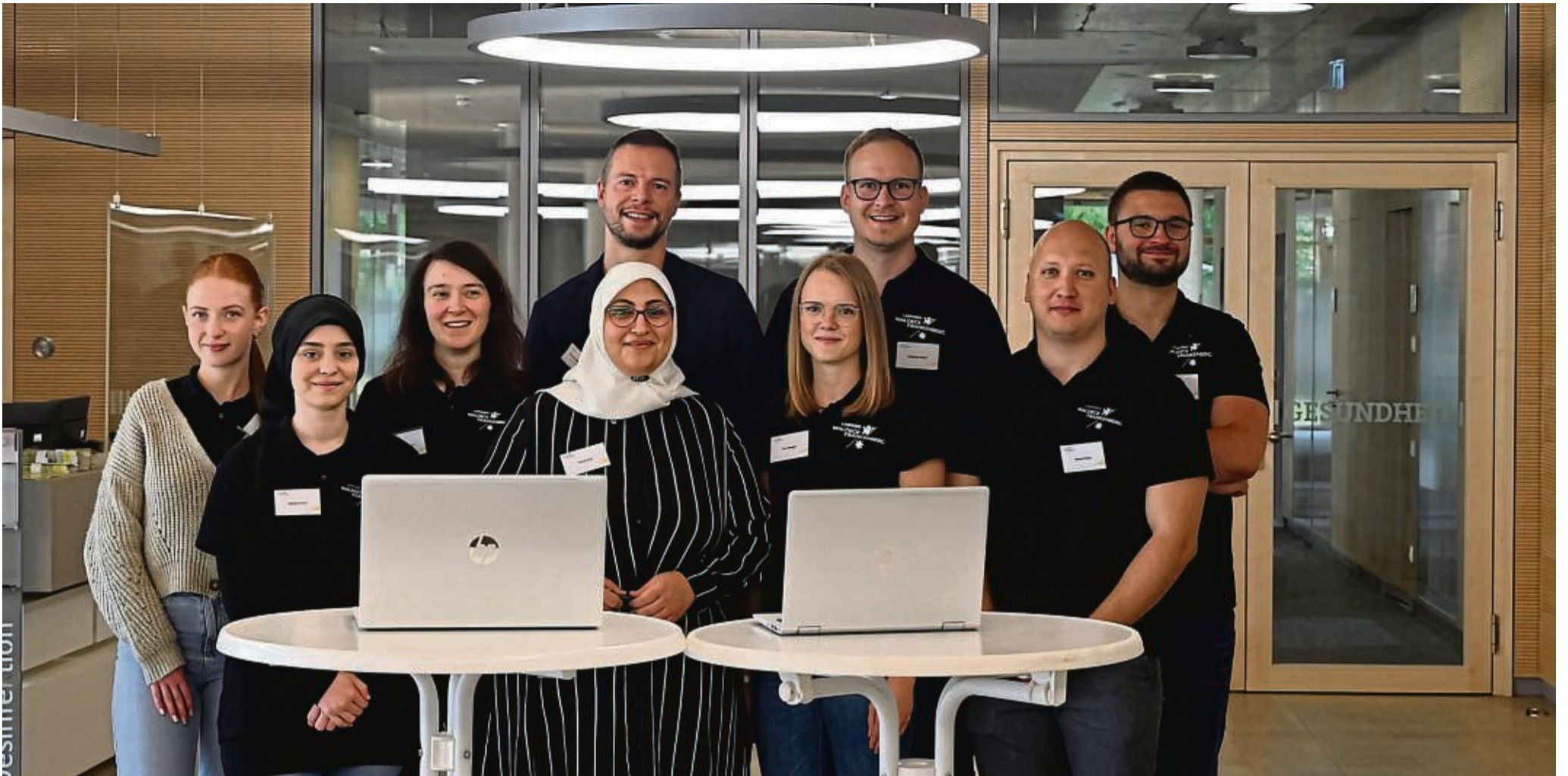
Erfahrungen im Kreishaus mitteilen: Junge Nachwuchskräfte aus der Kreisverwaltung führen Interviews mit Kunden, die Abläufe und Dienstleistungen in der Verwaltung beurteilen.