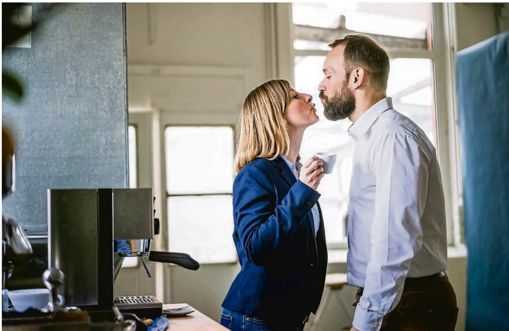
Kann schön sein, birgt aber auch Risiken: sich am Arbeitsplatz verlieben.

Leider kommt danach meist die Phase drei - und damit der entscheidende Einwand gegen die Kombination