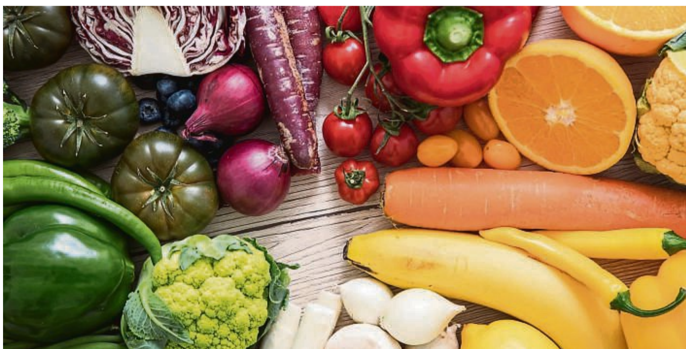
Auch beim Gemüsekauf sollte man nicht nur danach gehen, dass die Produkte regional, saisonal und nachhaltig sind, sondern auch, ob sie daheim gerade gebraucht werden.