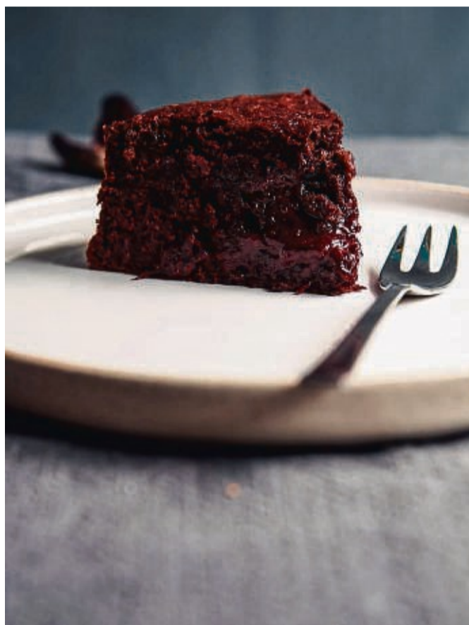
Ein Schokokuchen kann ganz ohne Eier und andere tierische Zutaten auskommen, wenn sie durch pürierte weiße Bohnen ersetzt werden. Das macht ihn schön saftig.