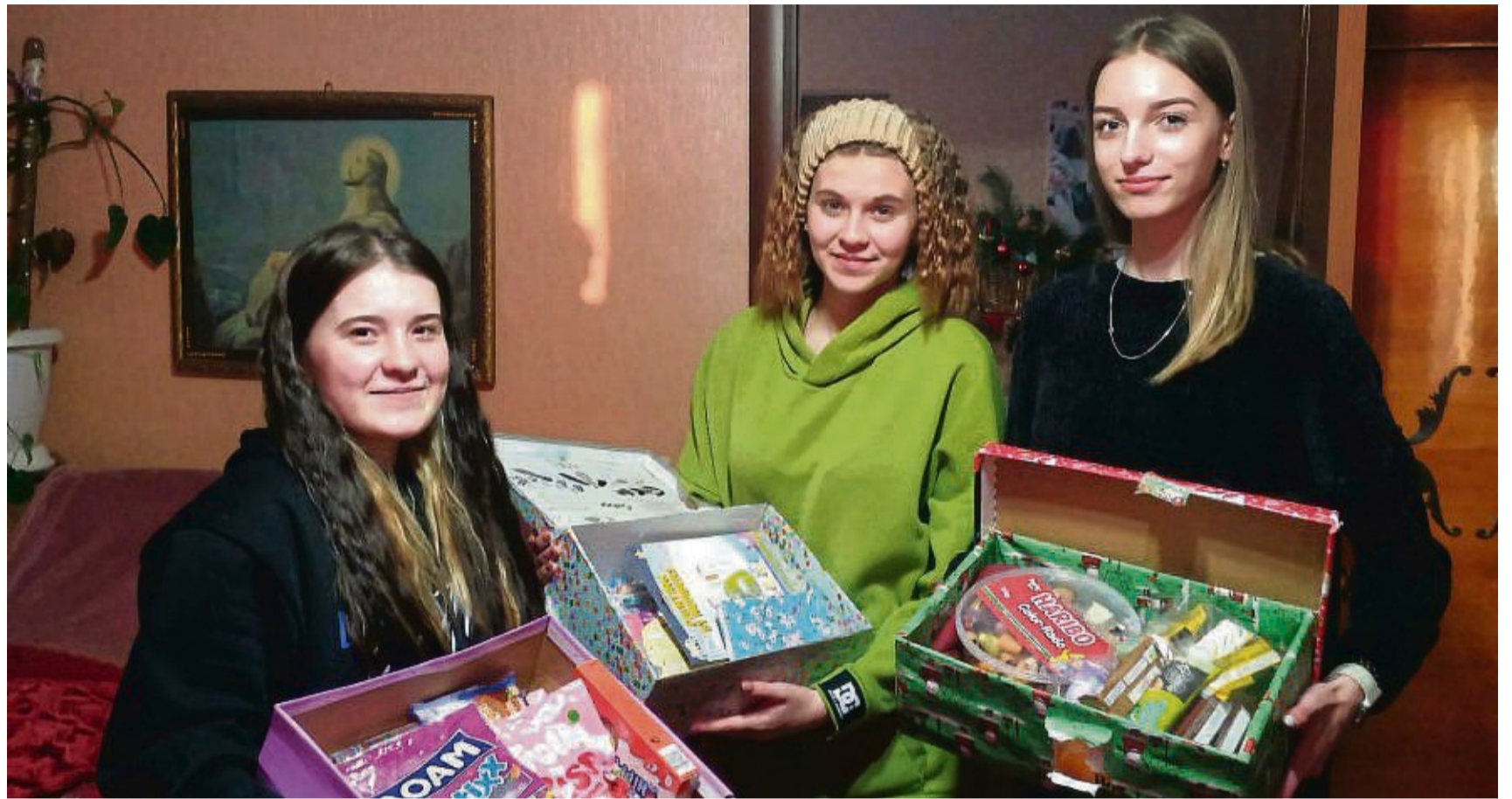
Drei Mädchen aus der Ukraine erhielten neben zahlreichen anderen Kindern und Jugendlichen Weihnachtspakete über das Kinderhilfswerk Global Care.

In dem ukrainischen Ort Kachaly unterstützt Global Care den Wiederaufbau von Wohnhäusern. Die Frauen und Kinder sind häufig auf sich gestellt, weil die Väter im Krieg sind, und können sich zum Beispiel die Reparatur eines Fensters nicht leisten.