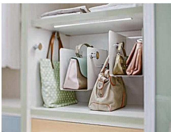
Praktisch: Einsätze für Schränke, die Accessoires wie Handtaschen gut präsentieren.