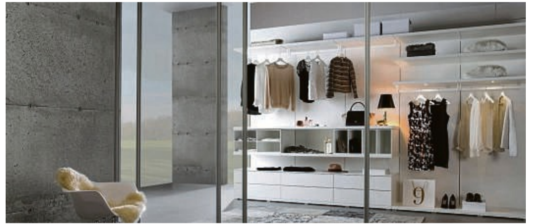
High End: So ein gläserner, begehbarer Kleiderschrank wie von Noteborn wirkt elegant.