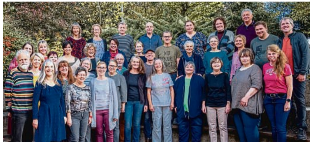
„Die Ohrwürmer“ aus Gudensberg.

Aber nicht nur weihnachtliche Chorsätze werden zum Besten gegeben. Etwa das klassische Volkslied „Wenn ich ein Vöglein wär“ mit in der Fassung von Johann Gottfried Herder, das allerdings auch in anderen musikalischen Varianten beispielsweise