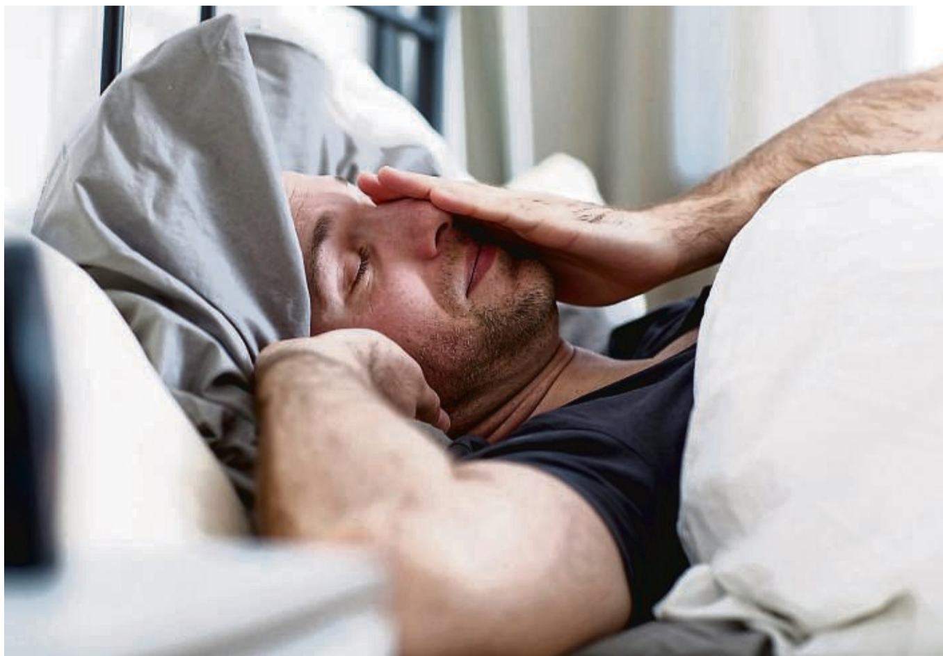
Müde, platt - fast schon verkatert: So macht sich ein Jetlag bemerkbar.

KNEGINJA RICHTER: Das hängt wesentlich vom Chronotypen des Menschen ab. Für Spätaufsteher, die nachts aktiv sind - die sogenannten Eulen - ist der Flug nach Westen ein bisschen leichter zu verkraften als der Flug nach Osten. Für morgens aktive Frühaufsteher - die Lerchen - ist der Flug nach Osten wieder