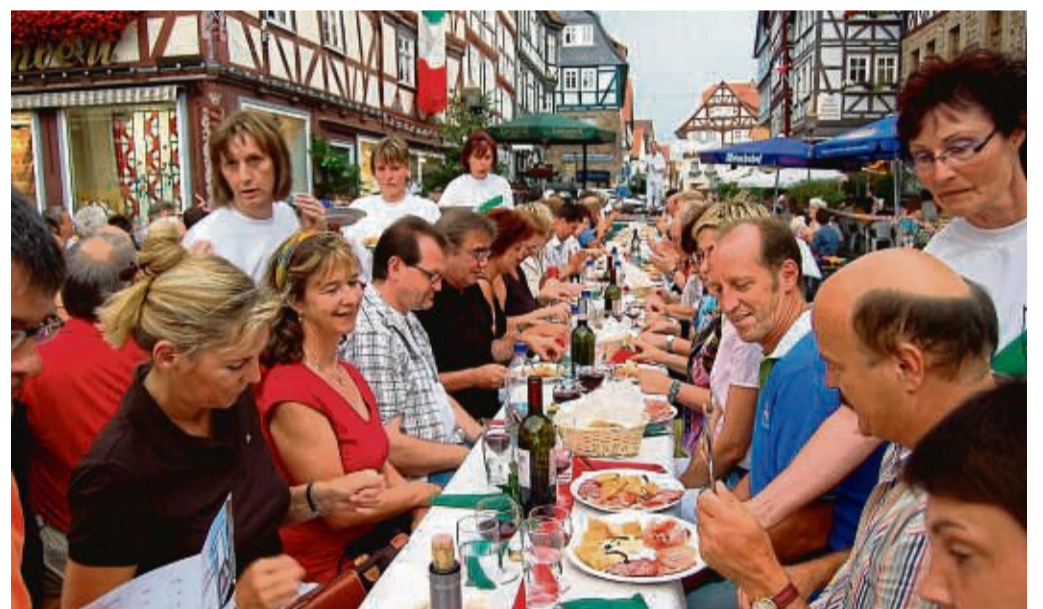
Schöne Erinnerung: 2006 waren die Gäste aus Casina an der Organisation eines italienischen Marktes in Fritzlar beteiligt.

Ahle Worscht und Parmaschinken, Landbier und Lambrusco sollen dabei auch künftig nicht gegeneinander antreten, sondern jeweils für sich stehen. „Wir planen jetzt mit viel Enthusiasmus in die Zukunft“, sagt Löffel und freut sich auf Aktionen nicht nur zu Großereignissen wie