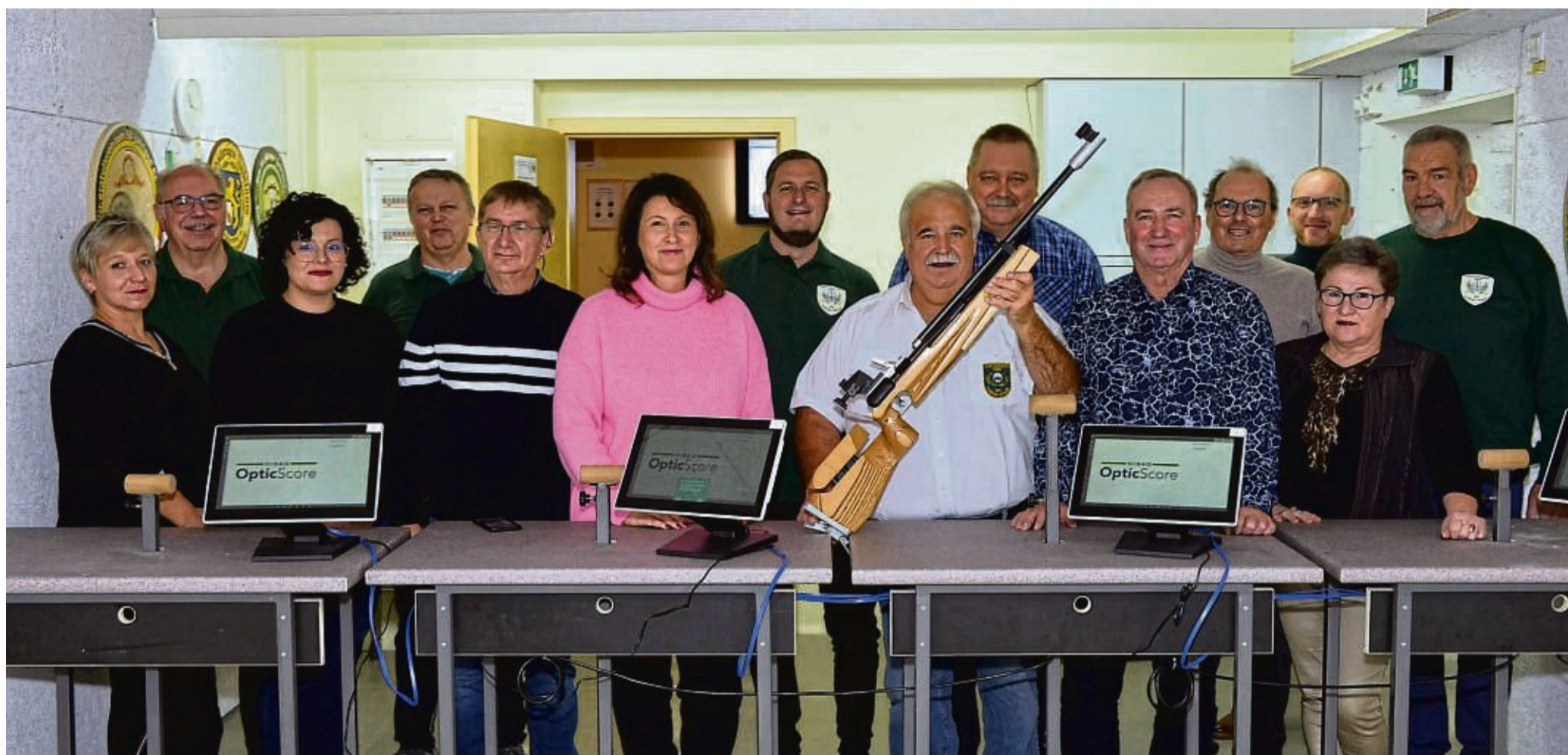
Ist jetzt digital unterwegs: Der Schützenverein Elnrode-Strang bei der Schussbildkontrolle. Schon während des Schießens kann der Schütze sein Schussbild auf dem Monitor sehen.