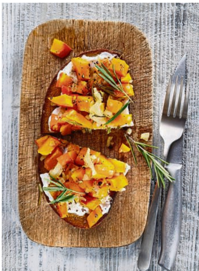
Statt Leberwurstbrot gibt es eine herzhaftere Alternative: Röstbrot mit Ofen Kürbis.