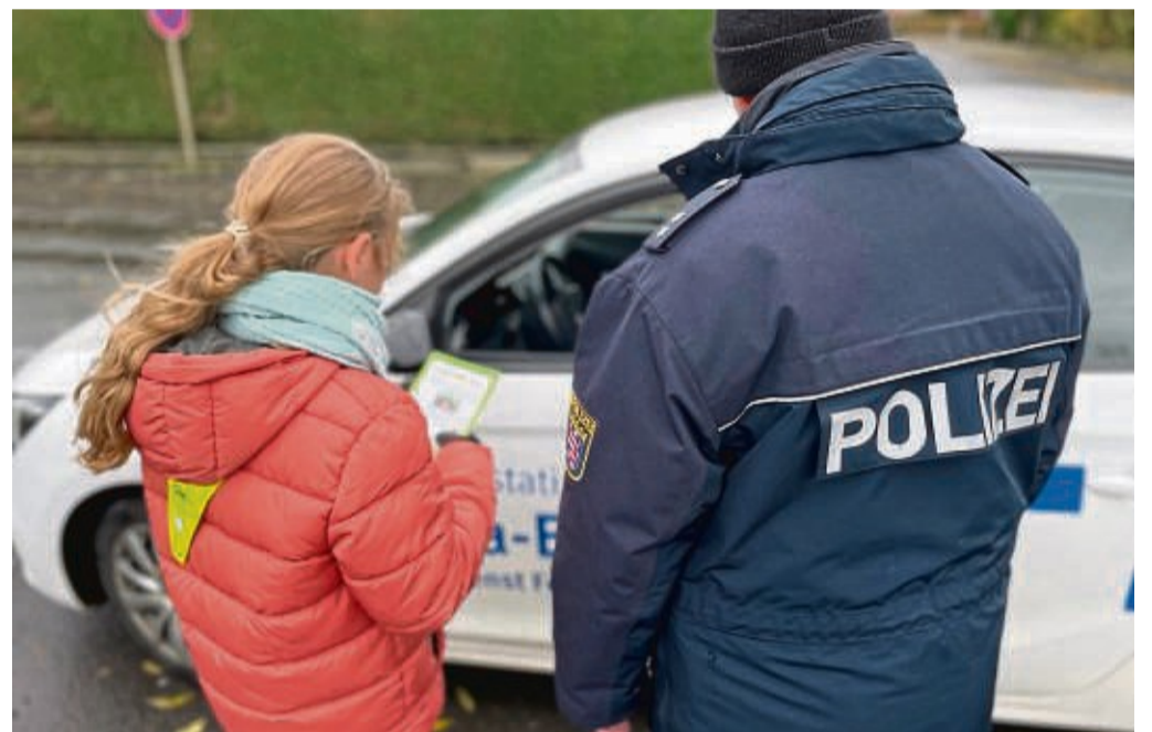
Blitz for Kids: Schüler der Grundschule am Kirschberg nahmen an Polizeiaktion teil.

Die Aktion von Schule und Polizei Hessen ist Teil der Verkehrsprävention im ganzen Bundesland. red