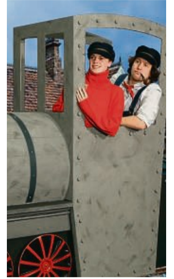
Für Jim und Lukas beginnt ein Reise mit spannenden Abenteuern.

Frankenberg - Jeder kennt Michael Endes spannende Geschichte von Jim Knopf und Lukas dem Lokomotivführer sowie den sympathischen Bewohnern der Insel Lummerland, die von König Alfons dem Viertel-vor-Zwölften regiert wird. Die „Augsburger Puppenkiste“ verhalf dem Kinderbuchklassiker mit ihrer Inszenierung zur Unsterblichkeit.