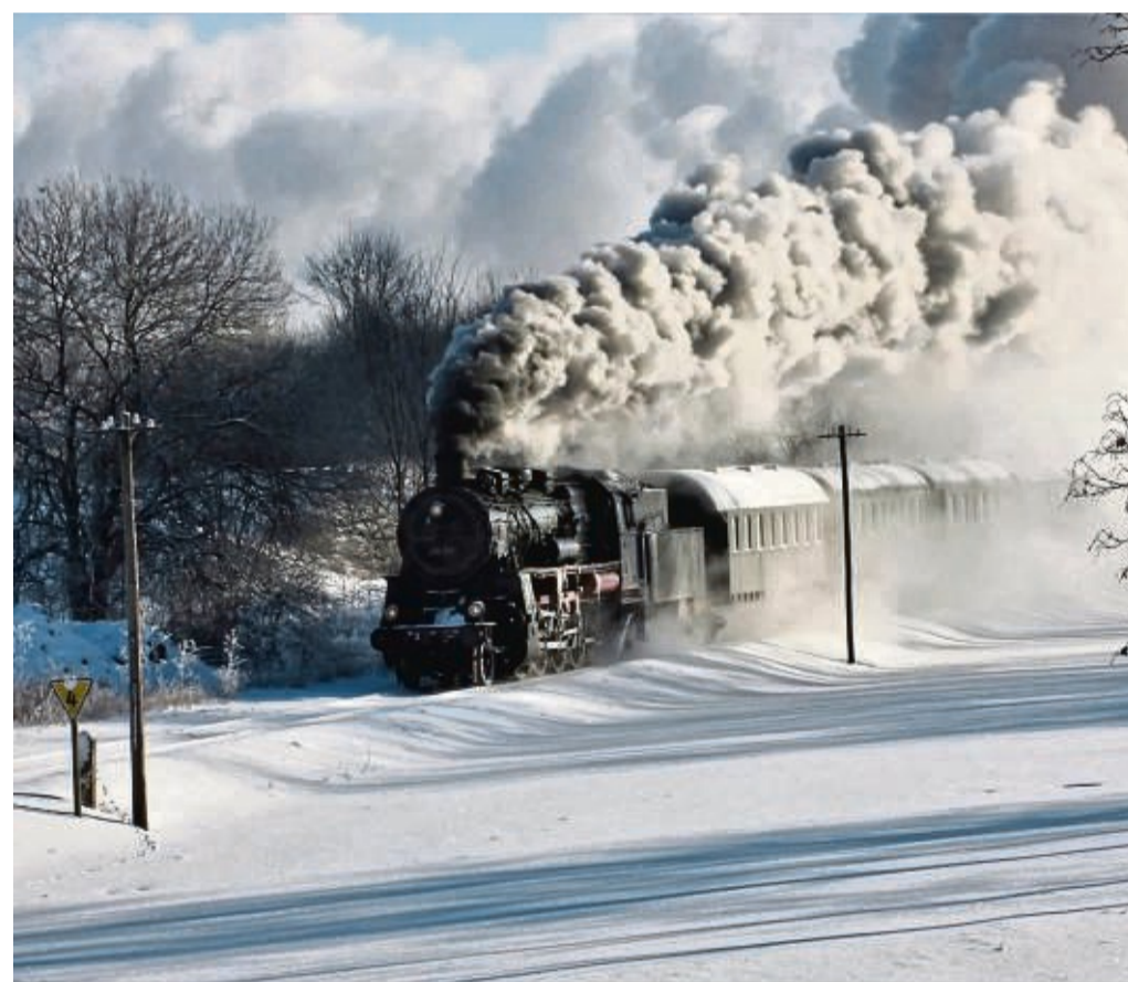
Die Dampflokomotive 35 1097 mit dem Spitznamen „Julchen“ macht die Fahrt zum Erfurter Weihnachtsmarkt zur Dampfs Sonderfahrt.

Der Eder-Diemel Tipp verlost zusammen mit den Eisenbahnfreunden Treysa zwei Freikarten für die Fahrt nach Erfurt. Senden Sie uns das Stichwort „Nikolaussonderfahrt“ bis zum 5. Dezember per E-Mail an edt@wjlz-online.de . Bitte Namen, Anschrift und Telefonnummer nicht vergessen. Die Gewinner werden benachrichtigt. Der Rechtsweg ist ausgeschlossen.