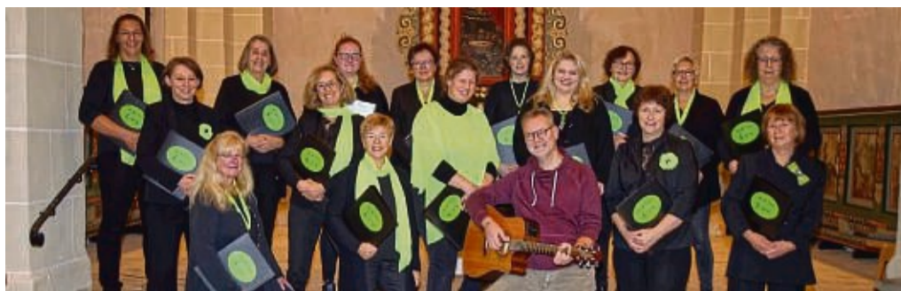
Der Chor „Sing & Praise“ aus Diemelsee feiert 25-jähriges Bestehen mit einem Konzert.

Diemelsee-Adorf - Es begann am 29. November 1998 mit einem Adventskonzert in der Adorfer Kirche, bei dem eine Handvoll Sängerinnen aufgeregt ihrem ersten Auftritt entgegenfeierte. 25 Jahre später blicken die Sängerinnen von „Sing & Praise“ auf eine abwechslungsreiche Geschichte des Chores zurück.