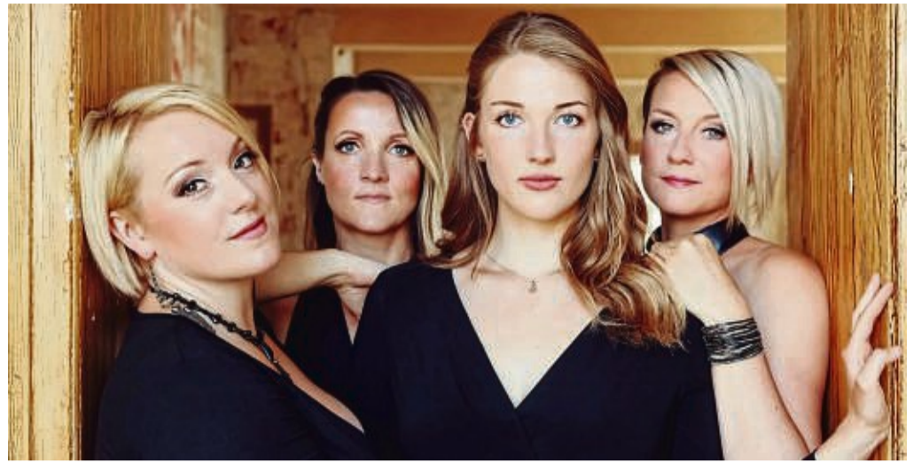
Die Medlz , eine weibliche A-Capella-Gruppe, kommen nächstes Jahr in den Wolfhager Kulturladen.