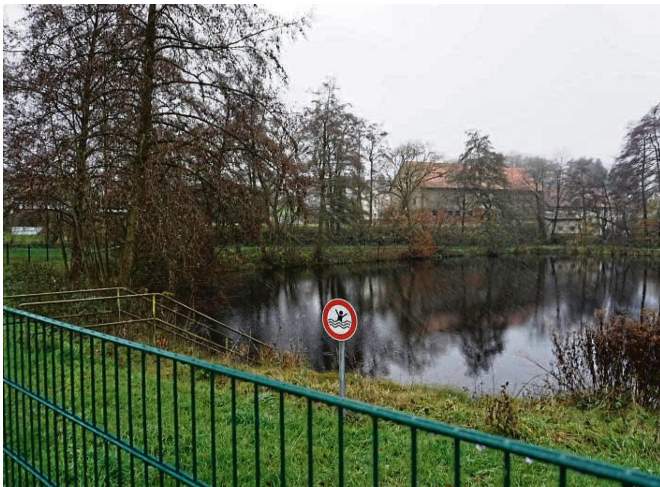
Blick über den später aufgestellten Zaun auf den Seigertshäuser Teich: Im Frühsommer 2016 ertranken dort die drei Geschwister.

Nach Abschluss der Ermittlungen wurde gegen Olbrich Anklage wegen fahrlässiger Tötung erhoben. Die Verhandlung vor dem Amtsgericht in Schwalmstadt im Januar 2020 dauerte fünf Tage. Insbesondere die Spitzen von kommunalen Verwaltungen verfolgten das Verfahren landauf, landab, ging es doch übergeordnet um die Frage,