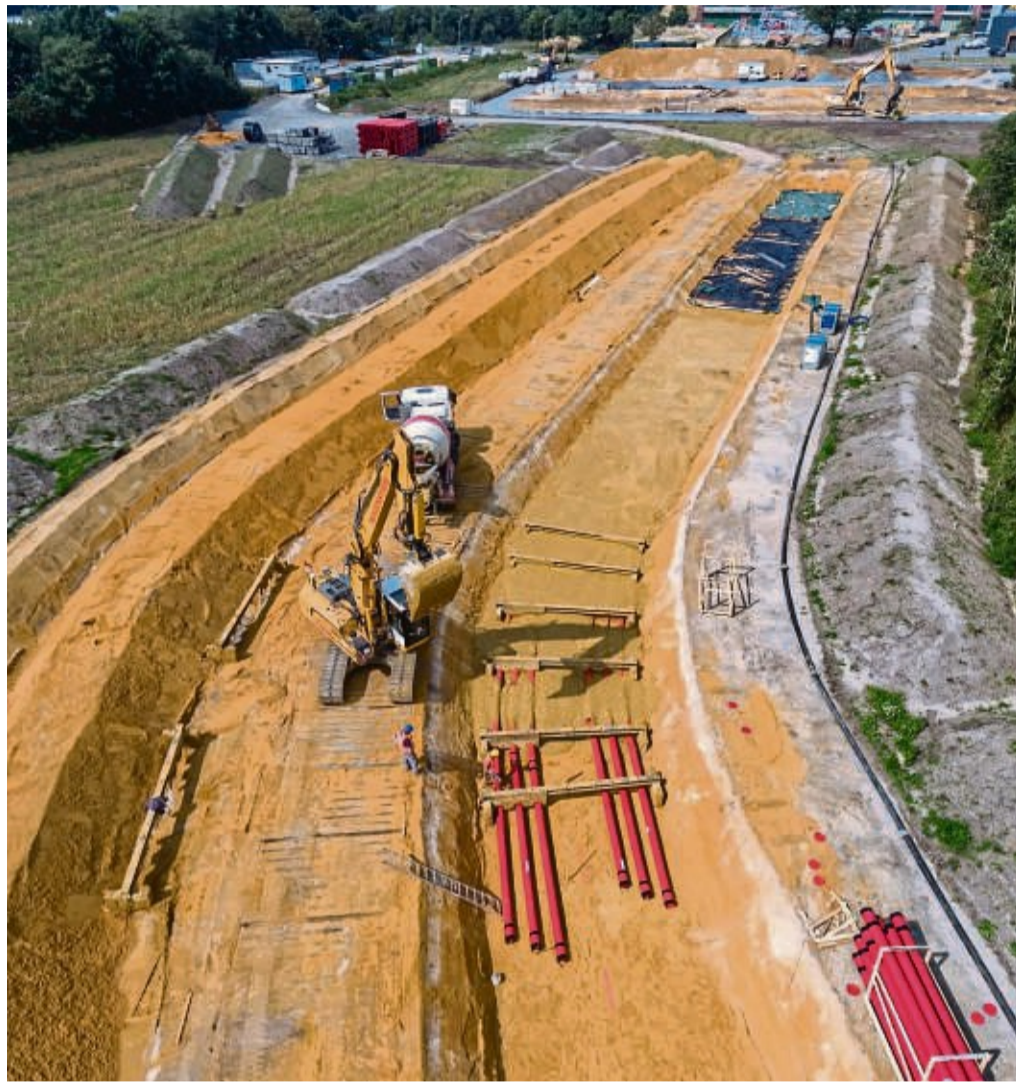
Die Erdkabel-Verlegung (hier bei Borken im Münsterland): Dort wird derzeit eine Wechselstromleitung mit zwölf Erdkabeln verlegt, sechs pro Kabelgraben. Der geplante Rhein-Main-Link hat auch zwölf Erdkabelstränge, aber nur drei Erdkabel pro Strang in einem Graben.

Die Verbindung ist in den Netzentwicklungsplan bis 2035 aufgenommen. Die Bundesnetzagentur hat sie im Januar 2022 bestätigt, der Bundestag hat sie im Juli 2022 gesetzlich verankert. Sie zählt demnach zum „vordringlichen Bedarf“. Der Antrag für den Planfeststellungsbeschluss soll schon im Juni 2024 gestellt werden. Baubeginn soll im ersten Halbjahr 2028 sein. 2033 soll die erste von vier Verbindungen in Be-