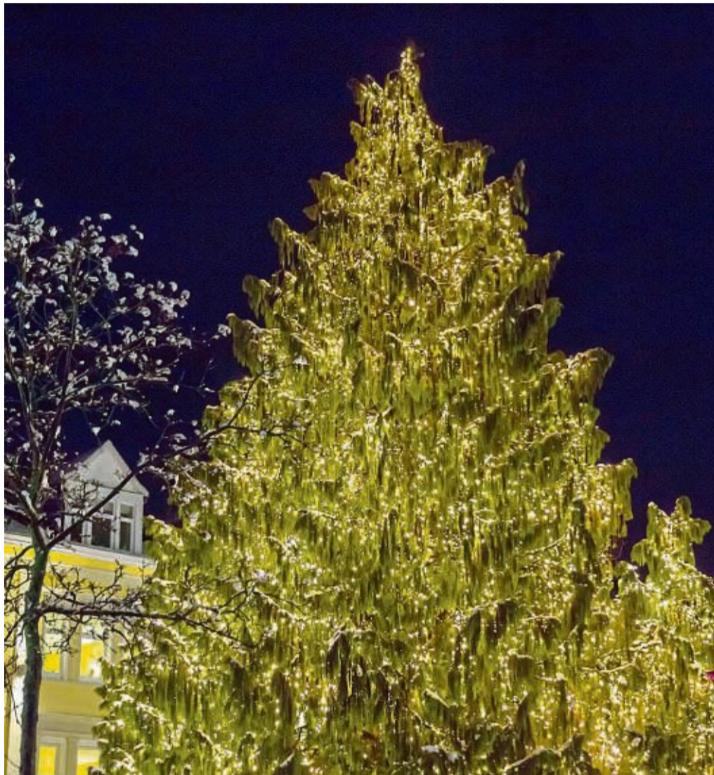
Wie gemalt: Die Zypresse in in der Brunnenallee erstrahlt zum letzten Mal im Glanz von über 100 000 Lichtern.

„Schweren Herzens werden wir in diesem Zuge auch den Wunschbaummarkt nicht mehr stattfinden lassen. Ohne Lichterbaum macht der Wunschbaummarkt für uns keinen Sinn mehr“, sagt Wicker-Carciola. Auch mit Blick auf die Ener-