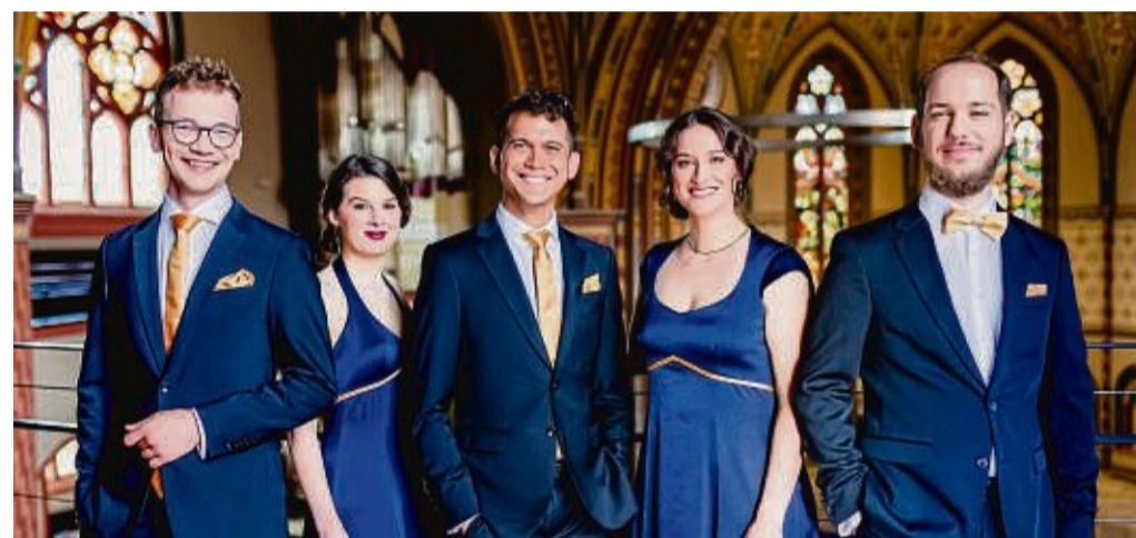
Touristik-Service Bad Arolsen im Bürgerhaus und in der Buchhandlung Kirstein. Die Veranstaltung ist im Abonnement des Volksbildungsringes enthalten.

Karten gibt es online auf www.reservix.de als print@home-Ticket, beim