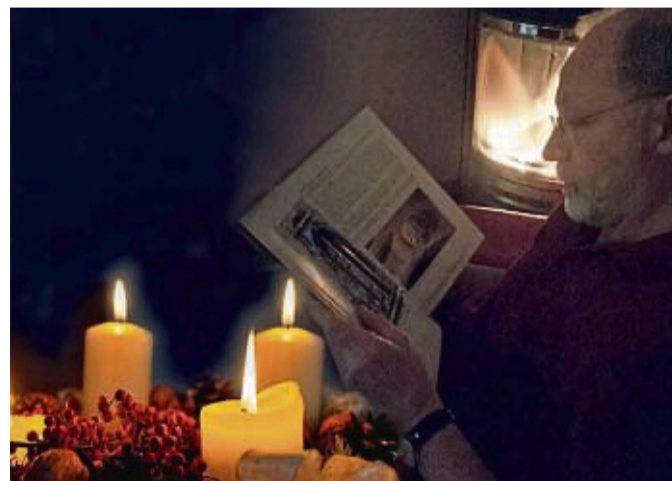
Das Statt-Theater Mengeringhausen stimmt am zweiten Adventswochenende mit einer Lesung auf die weihnachtliche Zeit ein.

Die Lesung findet im Theaterladen Mengeringhausen, Ritterort 1, statt. Der Eintritt ist frei.