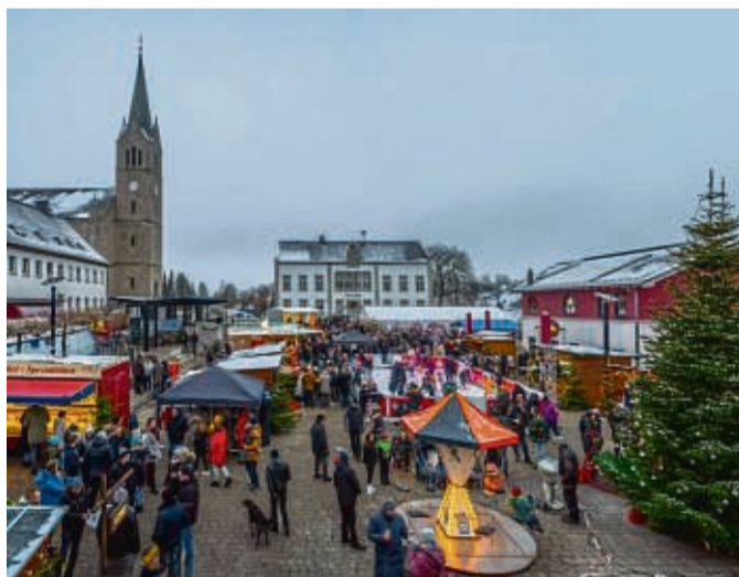
Liebevoll geschmückte Holzhütten laden zum Bummeln und Verweilen ein.

Ein buntes Bühnenprogramm mit Live-Musik und Vorführungen sorgt an beiden Tagen für beste Unterhaltung. Kinderaugen strahlen, wenn am Sonntag der Nikolaus den Weihnachtsmarkt besucht und Überraschungen an die Kinder verteilt. Auf der Marktplatzbüh-