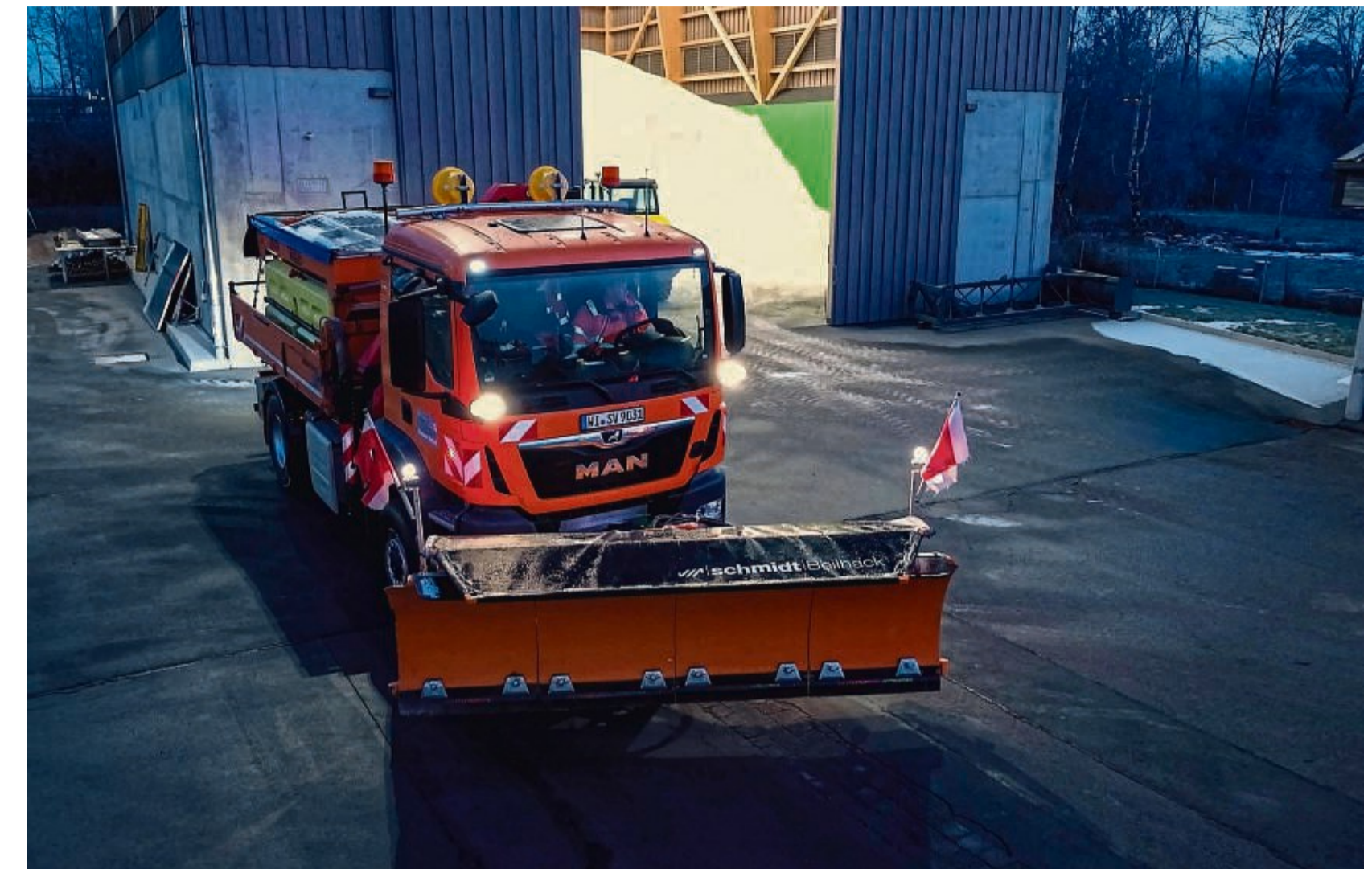
Fast rund um die Uhr im Einsatz: Die Mitarbeiter im Winterdienst in den elf nordhessischen Straßenmeistereien halten die rund 3300 Kilometer Bundes-, Landes- und Kreisstraßen frei von Eis und Schnee.

Um möglichst wenig Salz zu verbrauchen, nutzt Hessen Mobil computergesteuerte Streutechnik sowie hochwirksames Feuchtsalz, das sich gleichmäßig verteilt, sehr gut haftet und schon bei kleiner Menge große Tauwirkung erzielt. Pro Quadratmeter genügt ein Teelöffel. Das Salz, das gestreut wird, könnte man übrigens problemlos aufs Frühstücksei streuen,