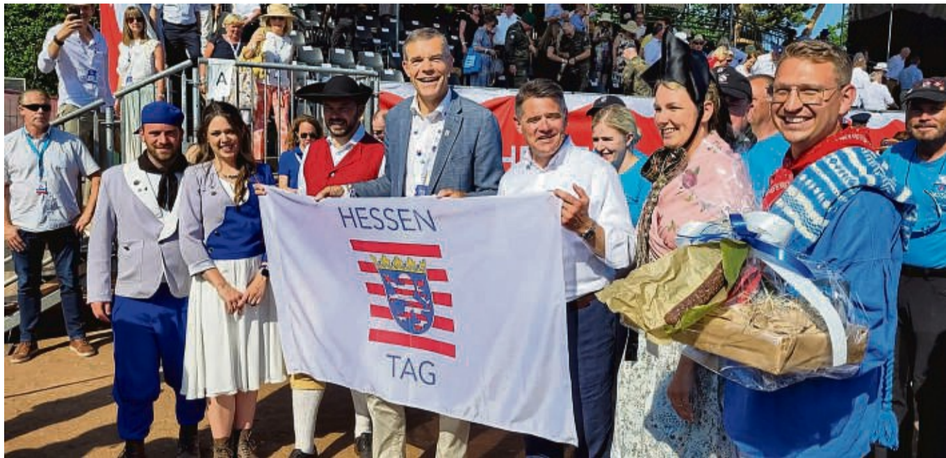
Übergabe der Hessentags-Fahne in Pfungstadt: Noch gibt es keine endgültige Bilanz, aber die Kosten für das Landesfest waren auch in Südhessen deutlich gestiegen.

Während die Freien Wähler Hessen eine grundsätzliche Reform zur Kosteneinsparung beim Hessentag forderten, hat man in Fritzlar die Ausgaben bereits fest im Blick. Dort soll der Hessentag Ende Mai 2024 stattfinden.