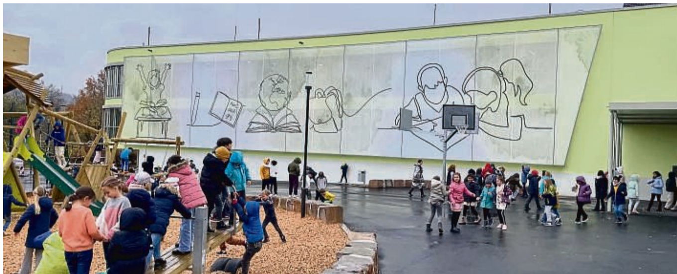
Auf dem Schulhof gibt es viel Platz zum Spielen und Austoben.

Gestiegene Schülerzahl findet nun genügend Raum