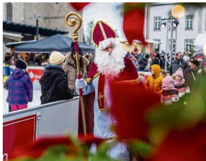
Am Sonntag besucht der Nikolaus den Weihnachtsmarkt und verteilt Überraschungen an die Kinder.