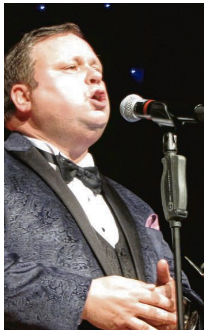
Ein Weltstar auf der Bühne: Der britische Tenor Paul Potts gastiert in der Korbacher Stadthalle.