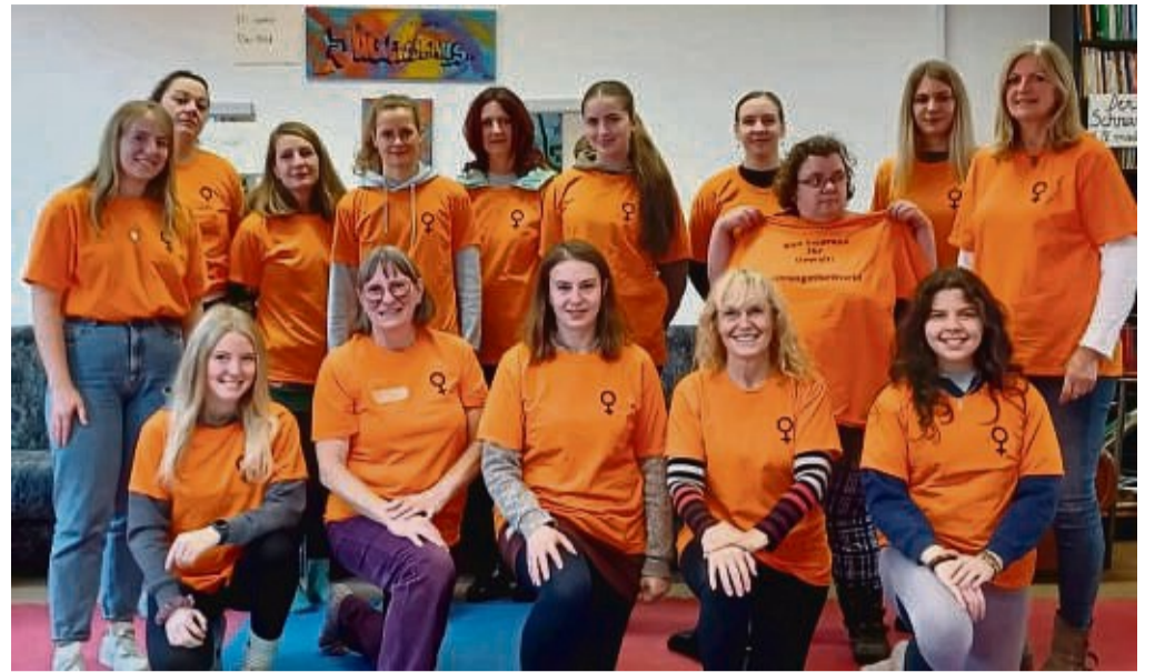
Gefühl von Machtlosigkeit zu überwinden: Der Landkreis bietet Selbstverteidigungskurse für Frauen an. Zwei Kurse fanden bereits am Wochenende statt.

„Zum Orange Day 2023 bieten wir dieses Jahr die Selbstverteidigungskurse an, da wir möglichst vielen Frauen und Mädchen unterstützen möchten, sich in gefährlichen Situa-