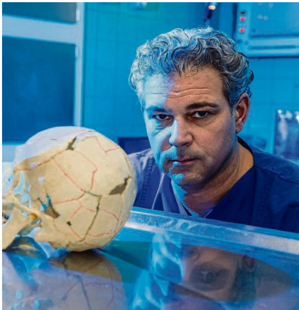
Bestsellerautor und Rechtsmediziner Prof. Dr. Michael Tsokos im Schmirgelwerk.