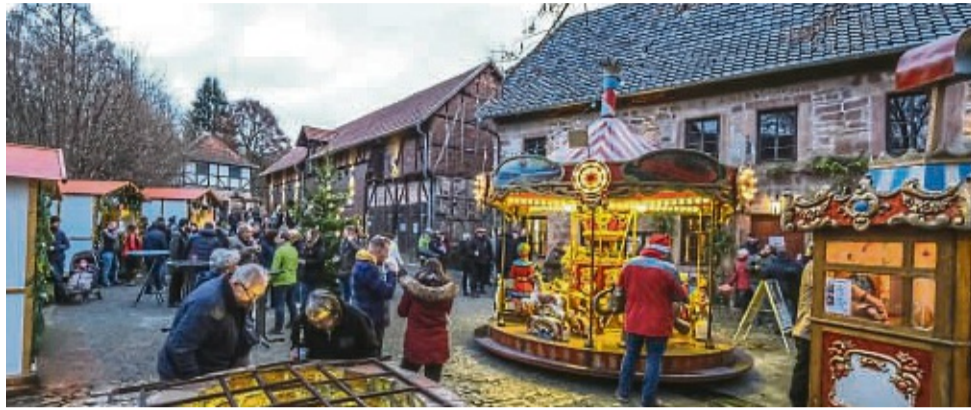
16. Weihnachtsmarkt im „Dollen Dorf“ Wichmannshausen auf dem Schlosshof

Auf dem Schlosshof, eingrahmt zwischen dem alten Boyneburger Schloß und dem Museum, quasi vor spätmittelalterlicher Kulisse, warten dann die von der Vereins-