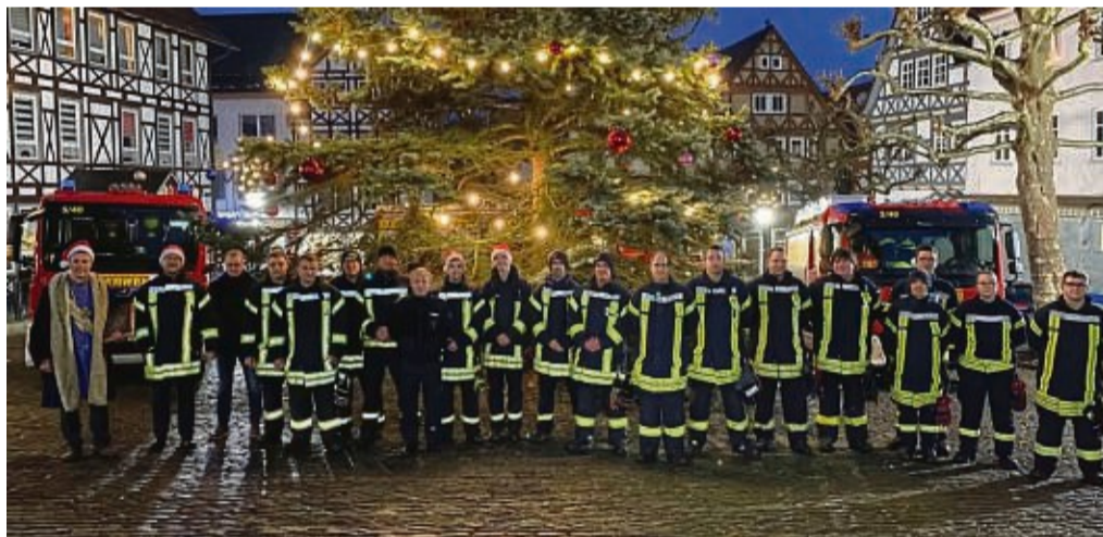
Alljährlich trifft sich die Feuerwehr auf dem Marktplatz, um anschließend die Nikolausgeschenke bei den Kindern vorbei zu bringen.

Wer ein Nikolaus-Geschenk erhalten möchte, malt bitte