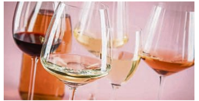
Um feine Unterschiede zu schmecken, sollten die Weine aus identischen Gläsern verkostet werden.

Vor dem Trinken wird das Glas geschwenkt, so vergrößert sich die Oberfläche des Weines. Je größer sie ist, desto mehr Aromenpartikel gelangen in die Luft und dadurch riechen und schmecken wir intensiver. Doch bevor man trinkt, sollte man mehrmals schnüffeln. Denn ohne intensives Riechen gehen viele Geschmackseindrücke verloren. Die Zunge kennt beim Wein ja nur süß, salzig, sauer und bitter. Aber es ist die Nase, die uns die Weinvielfalt eröffnet. Denn das, was wir zu schmecken glauben, riechen wir eigentlich.