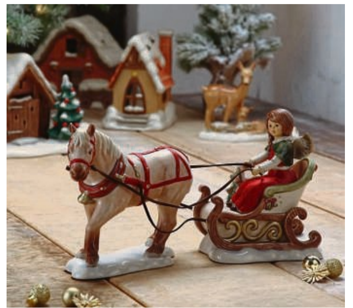
Klassisch idyllisch wirkt diese Deko von Goebel im Stile der Hummel-Figuren.