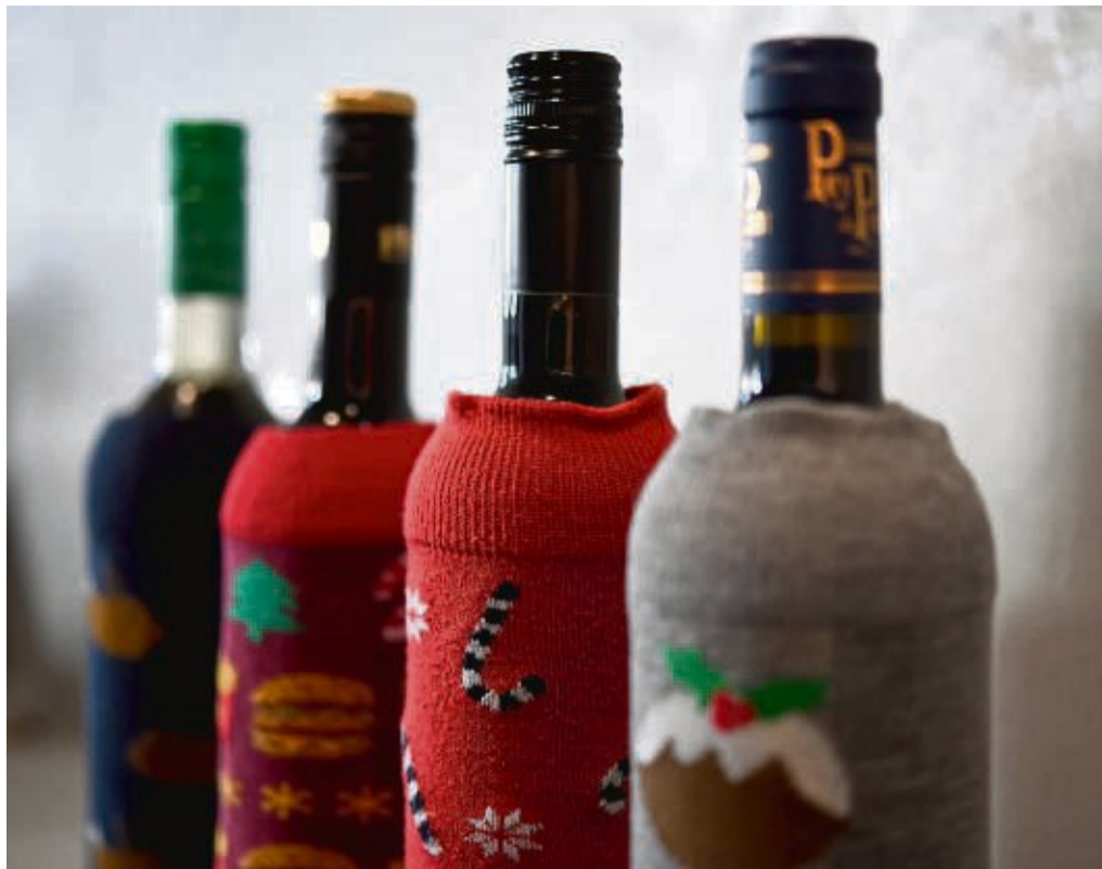
Die Weinflaschen bekommen Socken an: Verdeckte Verkostungen haben ein schönes Überraschungspotenzial für alle Teilnehmer der Weinprobe.

Wenn das Thema steht, kann man die Weine selbst besorgen oder Leute bringen sie entsprechend dem Motto mit. Dann könnte jeder etwas über den Winzer, das Anbaugebiet oder die Rebsorte zum Besten geben. Dabei wird erst verkostet und dann erzählt und nicht umgekehrt. Spannend wird es, wenn die Verkostung verdeckt ist. Dafür werden die Flaschen mit einer Manschette, Folie,