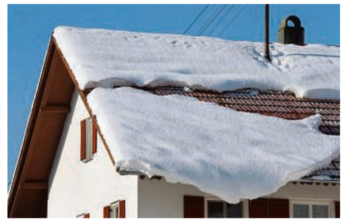
Bei starkem Schneefall sollten Hausbesitzer ihr Dach im Auge behalten und möglicherweise Schnee räumen.