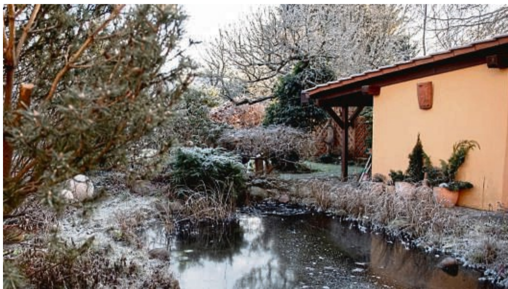
Unberührte Naturbereiche im Garten schaffen Räume für Tiere und Insekten und unterstützen das Wachstum von Wildpflanzen.

„Wer alle Fünfe grade sein und Bereiche im Garten sich natürlich entwickeln lässt, schafft Rückzugsräume und Nahrungsangebot für Tiere, und gibt natürlicherweise vorkommenden Pflanzen die Chance, sich zu verbreiten“, erklärt Verena Jedamczik, Referentin für Umfeldberatung und Garten beim Naturschutzbund Deutschland (NABU). Das gilt auch für die Grünflächen: „Wenn Sie Wildwuchs zulassen und zum Beispiel Rasen in eine Wiese umwandeln, die man