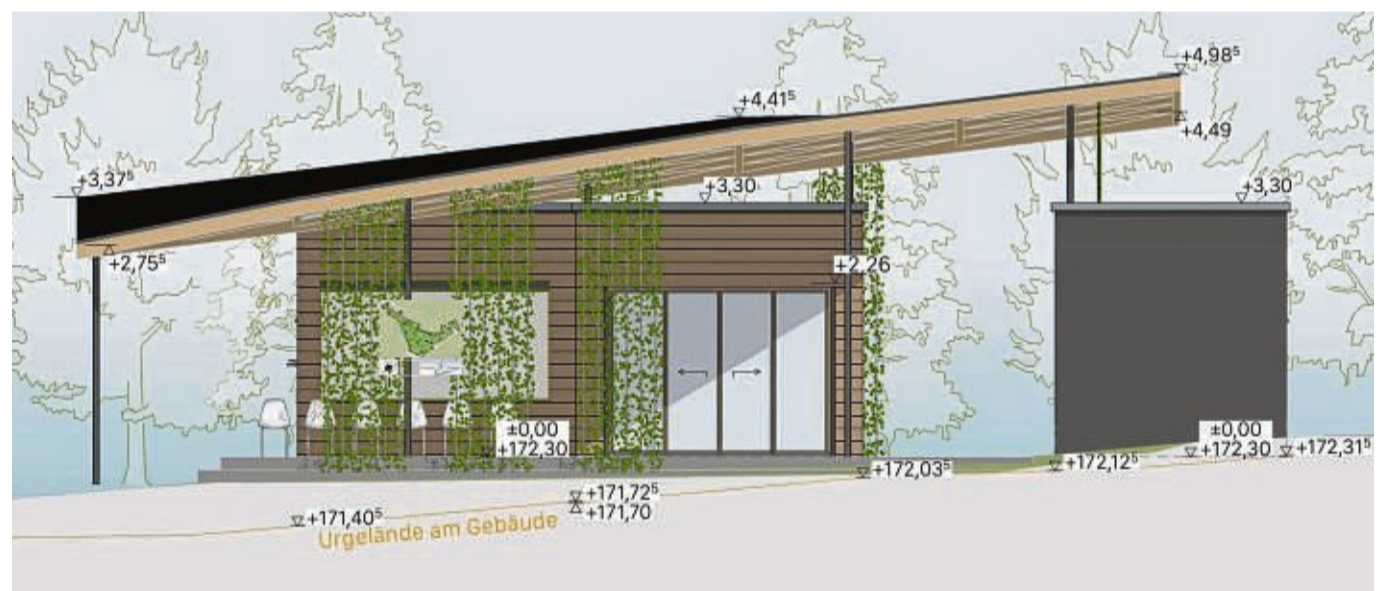
So soll es mal aussehen: In 2024 beginnt der Bau des Botanikhauses. GRAFIK: LUTHER BAUPLANUNG GMBH

Eschwege – Die Errichtung der sogenannten Remise im Botanischen Garten wird konkreter. Der Baustart ist für das Frühjahr 2024 geplant, mit dem Ziel der Fertigstellung im Herbst 2024. Im Gemeindehaus der Neustädter Kirche wurde das Projekt im Detail vorgestellt. Vorsit-