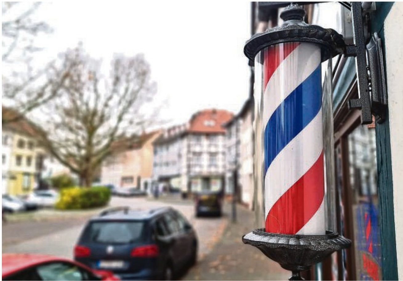
Barbershops sind in den vergangenen Jahren auch in Eschwege wie Pilze aus dem Boden geschossen. Zu erkennen sind sie an den rot-weiß-blauen Barbierpfosten vor der Tür.

Die konzentrierte Aktion von Bereitschaftspolizei, Zoll