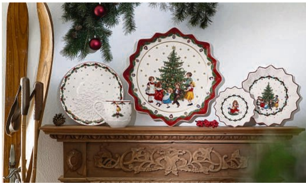
Porzellan-Weihnachsteller - hier von Villeroy&Boch - werden wie zu Omas Zeiten stehend präsentiert.

Die Nostalgiewelle bei den Dekorationstrends zum Advent und Weihnachten erreicht in diesem Jahr ihren Zenit. Nicht mehr die Kindheitserinnerungen der meisten von uns sind im Trend, sondern die aus den frühen Jahrzehnten des 20. Jahrhunderts. Wer davon nichts besitzt, dem bietet sich viel Neues in den Läden, das auf so alt bis antik gemacht ist.