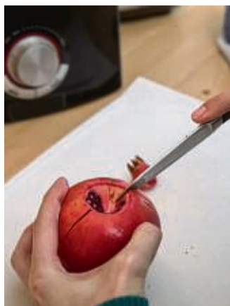
Ran an den Granatapfel: Erst kommt das Messer, dann das Wasserbad.

Als beliebtes Obst im Winter enthalten Granatäpfel viele Ballaststoffe, Kalium, die Vitamine C und K sowie sekundäre Pflanzenstoffe, heben die Ernährungsexperten des BZfE die Vorzüge der äußerlich schrumpelig anmutenden Früchte hervor. Sie kommen vor allem aus Mittelmeerländern wie Spanien