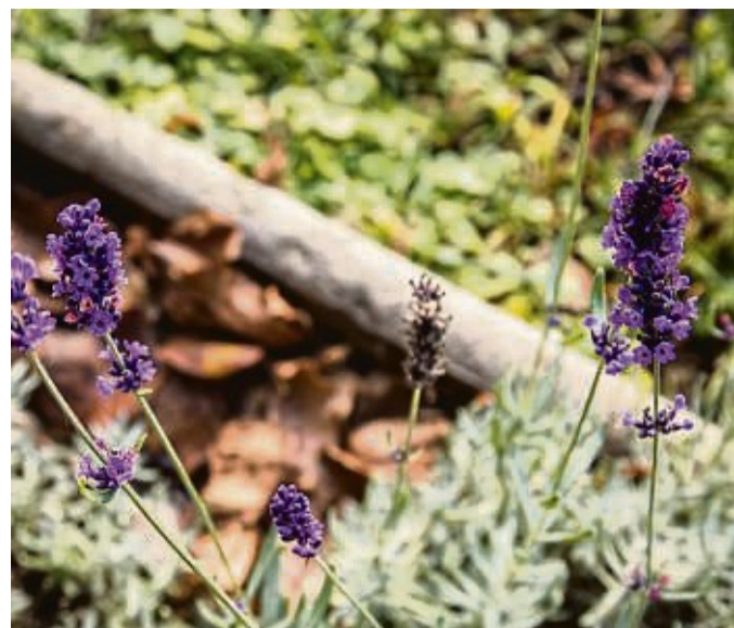
Lavendel ist oft winterfest und versorgt Bienen im Frühling wieder mit Nahrung.

dienen als Kinderstube und Überwinterungsplatz für viele Insekten. Ebenfalls liegen lassen: Laub unter Büschen und in Beeten. „Das Laub zersetzt sich zu Kompost und düngt den Boden. Es schützt die Pflanzen im Winter und bietet Überlebenschancen für viele Tiere“, erklärt Wotke.