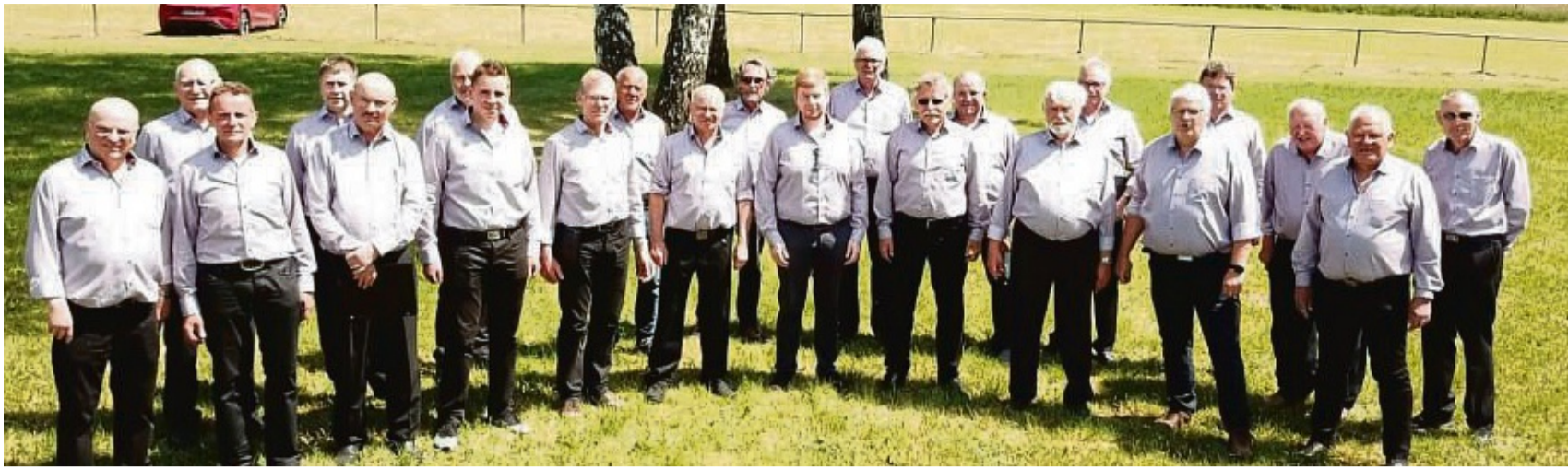
175 Jahre MGV Rosenthal: Die Sänger freuen sich auf das Jubiläumskonzert am Samstag, 9. Dezember, zusammen mit den Rosenthaler Musikanten, die in diesem Jahr ihren 25. Geburtstag feiern.