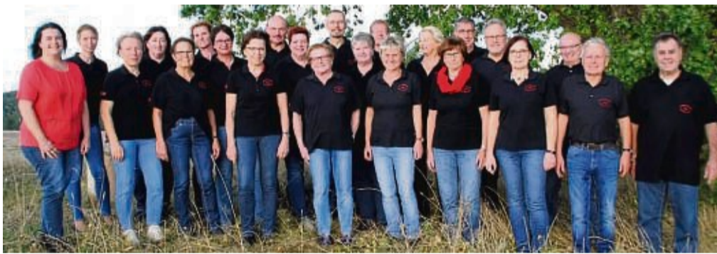
Rose Valley Singers Rosenthal traten 2009 als neue Sparte dem Männergesangverein bei.

te nach seiner Gründung schnell eine rührige Tätigkeit. Er sang auf Geburtstagen, Hochzeiten und anderen Festen. Im Frühjahr 1853 wurde jegliche Vereinstätigkeit verboten, doch im Oktober 1856 machte man einen neuen Anlauf und gründete den „Ilten Singerverein zu Rosenthal“. Als Vereinskleidung wurde eine Chormütze getragen.