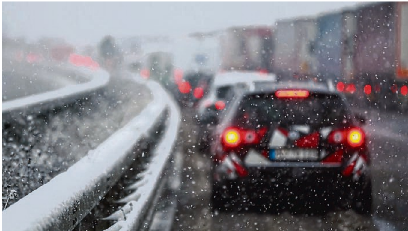
Während der Wintermonate steigt der Energieverbrauch von E-Autos um 20-30 Prozent.