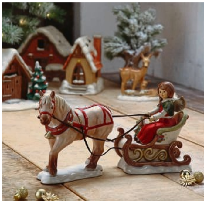
Klassisch idyllisch wirkt diese Deko von Goebel im Stile der Hummel-Figuren.

„Die Motive sind sehr naturalistisch dargestellt“, so Kaiser. „Gerade auch der Weih-