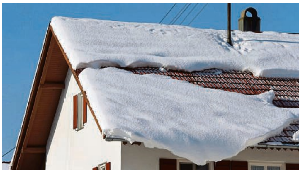
Bei starkem Schneefall sollten Hausbesitzer ihr Dach im Auge behalten und möglicherweise Schnee räumen.