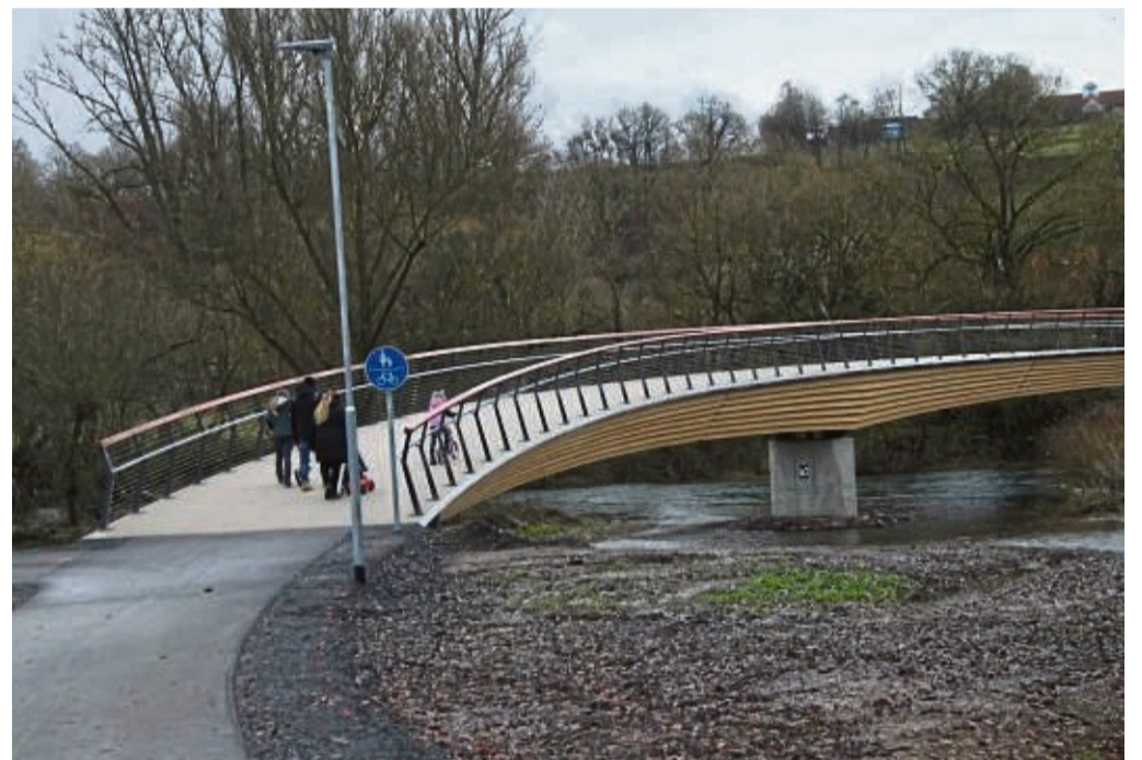
Neue Brücke für Radfahrer und Fußgänger: Die wurde jetzt zwischen Wildpark und Walkemühle installiert.

Das jüngste Projekt in diese Richtung: Erst vor wenigen Tagen wurde die Straße „Am Hain“ zwischen Bahnhofstraße und Hainstraße als „Fahrradstraße“ eingeweiht, dafür war die Straße monatelang ausgebaut worden – durch die Fahrradstraße wird den Radfahrern bei einer Fahrbahnbreite von dreieinhalb Metern nun mehr Raum und vor allem Vorrang vor dem Kraftfahrzeugverkehr gegeben. Die Radler können die Straße weiterhin in beide Richtungen nutzen, mehrere Fahrradfahrer dürfen auch ausdrücklich nebeneinander fahren. Für alle Verkehrsteilnehmer gilt: Höchstgeschwindigkeit 30 Stundenkilometer. „Wir wollen den Fahrradfahrern bewusst mehr Raum geben“, sagte Bürgermeister