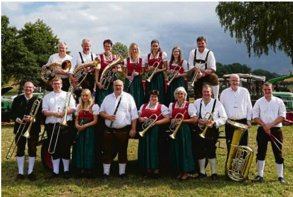
Die Rosenthaler Musikanten sind im Gegensatz zum MGV mit 25 Jahren noch jung. Sie sind beim gemeinsamen Konzert am 9. Dezember ebenfalls mit von der Partie.

Der noch junge Gesangverein „Liederkrantz“ entwickel-