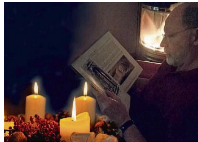
Das Statt-Theater Mengeringhausen stimmt am zweiten Adventswochenende mit einer Lesung auf die weihnachtliche Zeit ein.

Die Lesung findet im Theaterladen Mengeringhausen, Ritterort 1, statt. Der Eintritt ist frei.