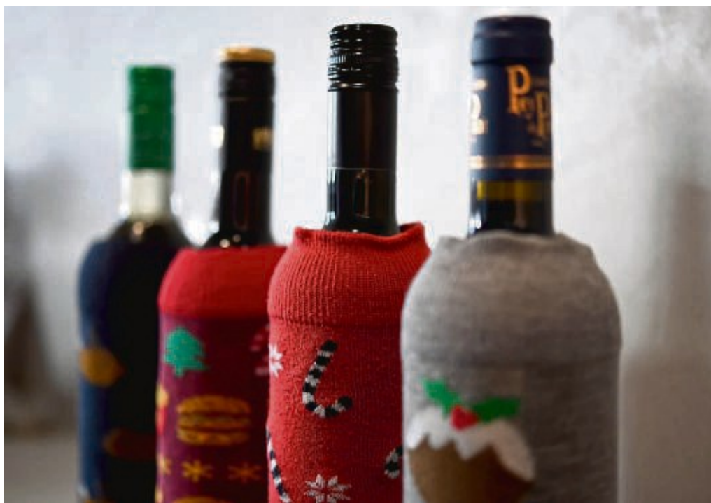
Die Weinflaschen bekommen Socken an: Verdeckte Verkostungen haben ein schönes Überraschungspotenzial für alle Teilnehmer der Weinprobe.

Sehr beliebt sind auch Verkostungen verschiedener Jahrgänge, beispielsweise von einer bestimmten Rebsorte eines Erzeugers von Weinen aus bestimmten Lagen. Dann können die Weine