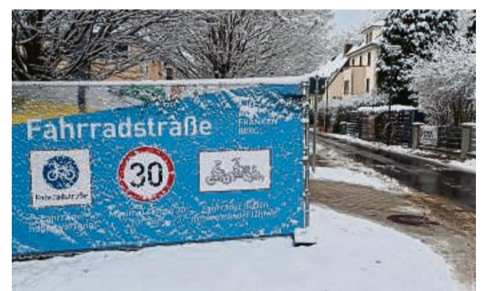
Fahrradstraße: Die wurde jetzt in der Straße „Am Hain“ in Frankenberg zwischen Bahnhofstraße und Hainstraße eröffnet. Dort darf von den Verkehrsteilnehmern nur mit Höchstgeschwindigkeit 30 gefahren werden. „Am Hain“ ist jetzt Anliegerstraße

Die Straße Hengstfurt in Frankenberg war bereits vor einigen Wochen zur Fahrradstraße umgebaut worden. Und auch durch einige neue Brückenbauten wurde der Fahrradverkehr in Frankenberg unlängst wesentlich verbessert: Zwischen