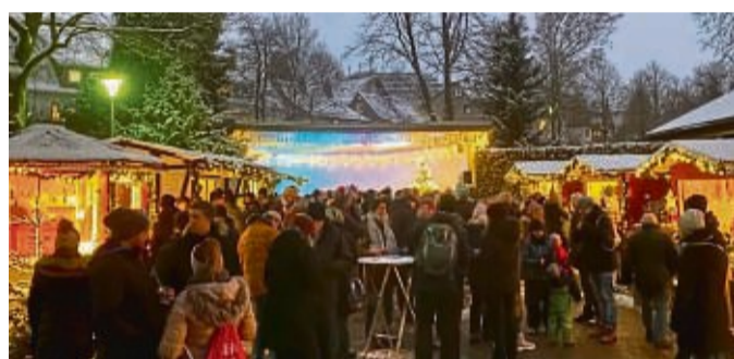
Den Umzug in den Kurgarten sehen die Veranstalter als gelungenen Schritt.

Für das tägliche Gewinnspiel gibt es die Teilnahmekarten nicht mehr im Einzelhandel, sondern direkt im