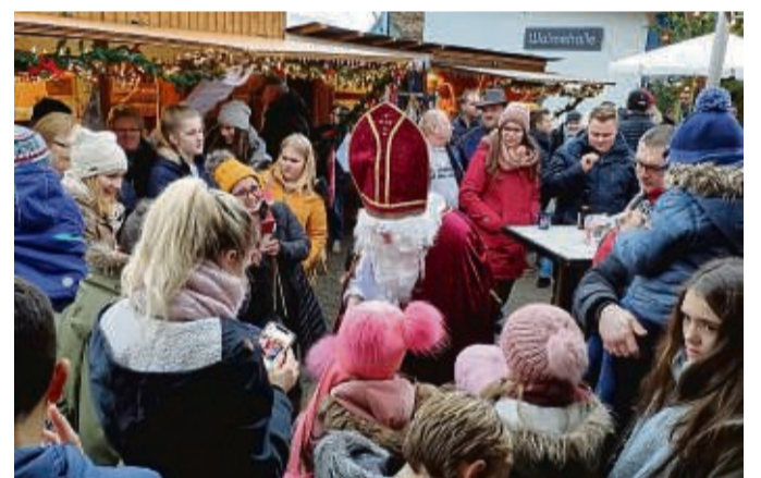
Ein Programm für große und kleine Besucher bietet der Weihnachtsmarkt in Meininghausen.

ken gesorgt. Zudem werden Kaffee und selbst gebackener Kuchen angeboten. Im Laufe des Nachmittags tritt der evangelische Posaunenchor auf und lässt weihnachtliche Musik erklingen. Gegen 16 Uhr kommt der Nikolaus kommt und bringt Geschenke für die kleinen Besucher mit. In der Halle will Stefan Schnell die Besucher mit Weihnachtsmusik unterhalten, Direktvermarkter bieten verschiedene Waren an, eine große Modelleisenbahn kann bestaunt werden. Eine „Märchentante“ will für die klei-