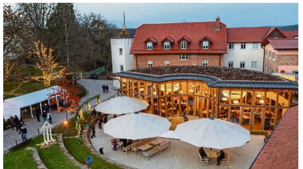
Das Hotel Brunnenhaus Schloss Landau ist wieder Schauplatz des festlichen „Weihnachtszaubers“ mit viel Musik und Kunsthandwerk.

Das Herzstück bleibt der traditionelle Kunsthandwerkermarkt in der Zehntscheune. Hier präsentieren regionale Kunsthandwerker stolz ihre handgefertigten Schätze, von einzigartigem Schmuck bis hin zu kunstvollen Holzarbeiten. Diese authentischen Werke machen