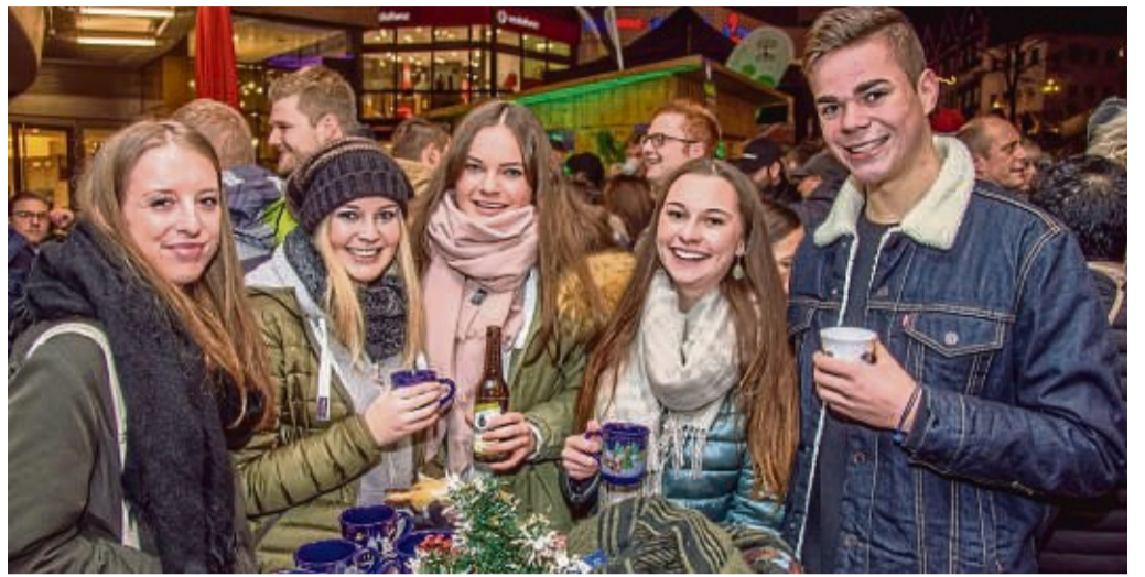
Die „Welcome Home For Christmas Party“ von Network Waldeck-Frankenberg findet am 22. Dezember auf dem Parkplatz an der Kalkmauer statt.

Mehr als 15 verschiedene Standbetreiber bieten ihre Waren an. Neben den verschiedensten kulinarischen Leckereien von Steaks und Würstchen über Bruzzelfleisch, Crêpes, Flammkuchen bis hin zu Ofenkuchen und Waffeln werden auch viele kunsthandwerkliche Produkte zum Verkauf angeboten. Verschiedene Chöre und Orchester sorgen für ein buntes, musikalisches und weihnachtliches Rahmenprogramm auf der Bühne. Am Abend des 22. Dezembers fin-