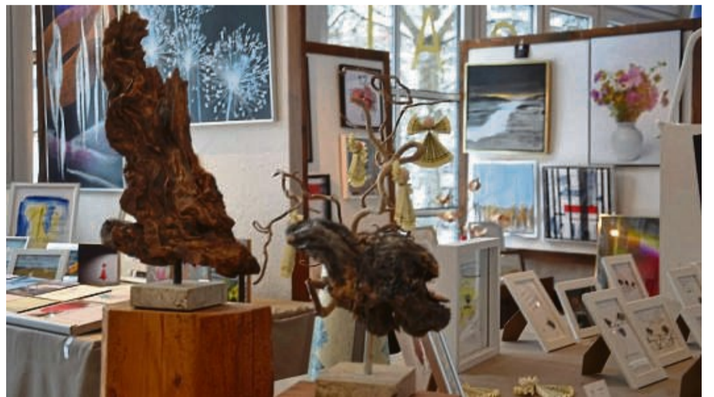
Skulpturen, Malerei und weitere kreative Ideen bietet die Ausstellung „Kunst im Park“, die seit zehn Jahren im Willinger Kurgarten zu sehen ist.