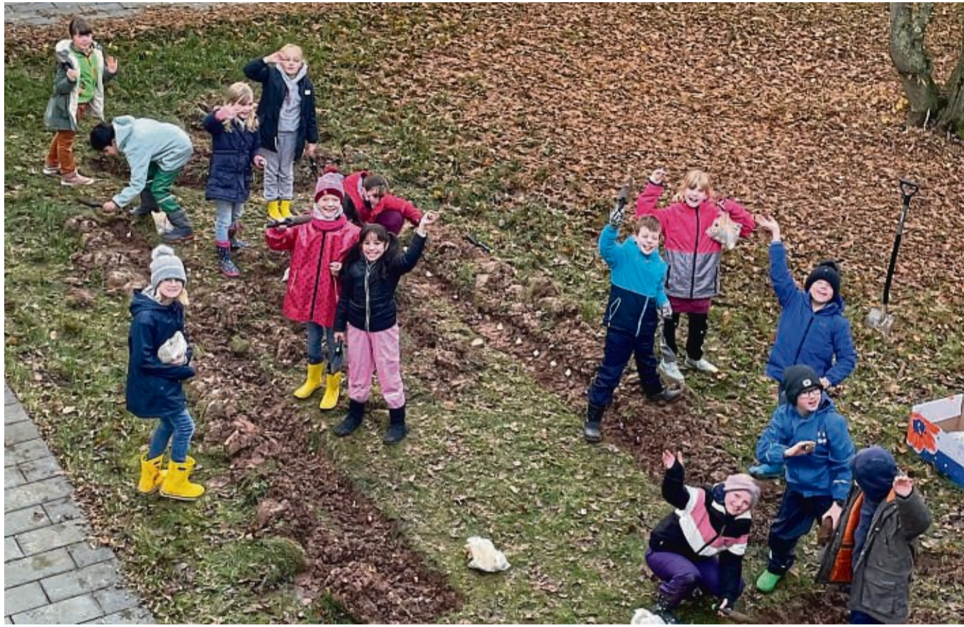
Kleine Gärtner bei der Arbeit: Drittklässler pflanzten 600 Blumenzwiebeln in Form des Schullogos.

Waldeck-Sachsenhausen – Gerade erst ist der Winter mit viel Schnee ins Waldecker Land eingezogen, da liegt über dem Schulzentrum an der Warte schon ein Hauch von Frühling in der Luft. Grundschüler setzten 600 Blumenzwiebeln in die Erde und hoffen nun auf eine farbenprächtige Blüte im neuen Jahr. Mit Fleiß und Ideenreichtum gingen die Grundschüler ans Werk. Lange vor der Aktion wurde gemeinsam überlegt, wo genau und in welcher Form die Blumen im kommenden Frühjahr das Schulgelände verschönern sollen. Ausgestattet mit Gummistiefeln, Schaufeln und 600 Blumenzwiebeln gingen die dritten Klassen nun ans Werk. Bereitgestellt wurden die Zwiebeln von „Bulbs4Kids“ – einer Kampagne, die speziell auf Grundschulen ausgerichtet ist. Ziel ist es, Kinder auf zugängliche, spannende Weise mit der Natur vertraut zu machen. Es wurde gegraben, geschnuddelt, gelacht und über