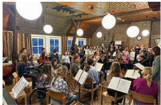
Probenarbeit auf Burg Hessenstein: Das Jugendsinfonieorchester und der Unterstufenchor studieren den Weihnachtstraum von Humperdinck ein.

Dezember, jeweils um 18 Uhr in der Stadthalle Mengershausen statt. Mehr als 200 junge Instrumentalisten, Chorsänger und Solisten der Christian-Rauch-Schule und der Musikschule Bad Arolsen möchten dabei wieder mit festlicher und jazziger Musik einen klangvollen Akzent in der Adventszeit setzen. Das Adventskonzert findet wieder in der Stadtkirche von Rhoden statt. Am Sonntag, 10. Dezember, werden dort ab 16 Uhr Ensembles der CRS Ausschnitte aus dem Mengershäuser Weihnachtsprogramm präsentieren und damit auf das Weihnachtsfest einstimmen. Der Eintritt zum Konzert in Rhoden ist frei. Eintrittskarten für die beiden Weihnachtskonzerte in der Mengershäuser Stadthalle sind ab dem heutigen Mittwoch im Vorverkauf für zehn Euro, ermäßigt fünf Euro, im Sekretariat der Christian-Rauch-Schule (Tel. 05691/2081) erhältlich.