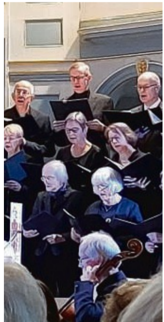
Die Kreiskantorei wirkt bei der Aufführung der „Matthäuspassion“ mit.

Eintrittskarten sind bereits jetzt zum Preis von für 15 bis 25 Euro im Vorverkauf erhältlich. Der Vorverkauf läuft bei der Buchhandlung CoLibri, Prof. Kümmell-Straße, in Korbach und bei der Buchhandlung Kirstein, Bahnhofstraße, in Bad Arolsen.