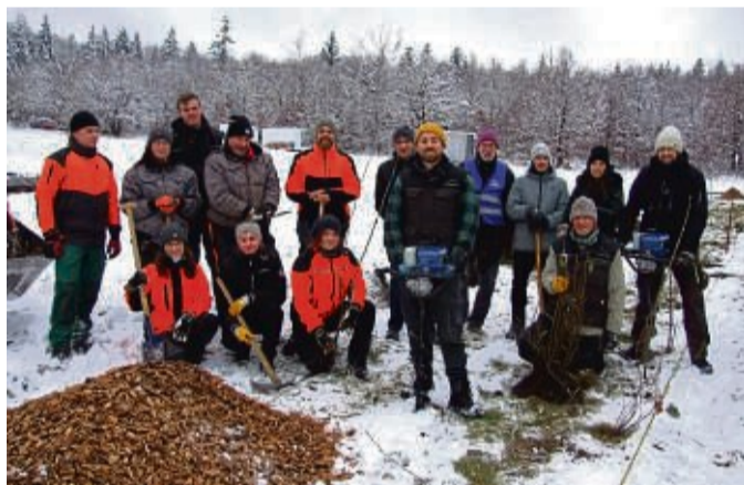
Heimische Sträucher und Bäume sollen Biotope vernetzen und als Windschutz dienen.