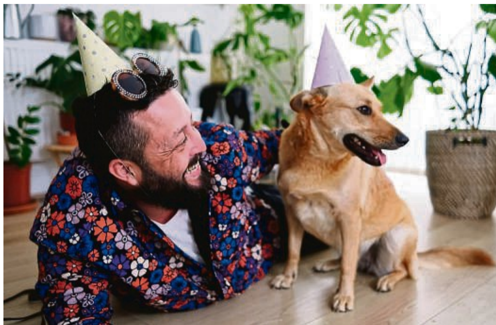
Für Hunde nicht immer ein Grund zu feiern: Silvester. Denn vielen Tieren machen Böller, Raketen und Co. Angst.

Jetzt wird die Intensität der Geräusche und die Geräuschart schrittweise ausgebaut. Dafür bieten sich zum Beispiel ein klappernder Kochlöffel oder ein auf den Teppich fallender Schlüssel an. Klappt das gut, kommt das