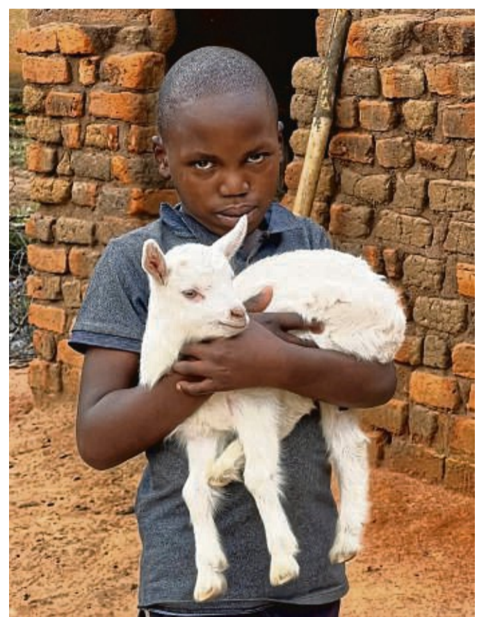
Logos Global Vision ruft wieder zur Weihnachtsspendenaktion „Määähry Christmas“ auf.