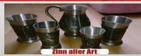
Zinn aller Art

*in Verbindung mit Gold Wir zahlen bis zu 10.000 € für Ihren Pelz!