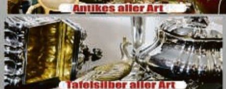
Tafelsilber aller Art

Kostenlose Begutachtung und Bewertung Ihres Schmuckstücks (auch bei Ihnen zu Hause)