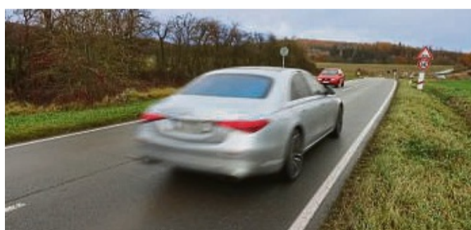
Auf der engen und stark befahrenen Landesstraße ist das Radfahren extrem gefährlich.

7,5 km langer Radweg nicht verwirklichen.“ Allerdings räumte er auch ein, dass es hessenweit an modernen