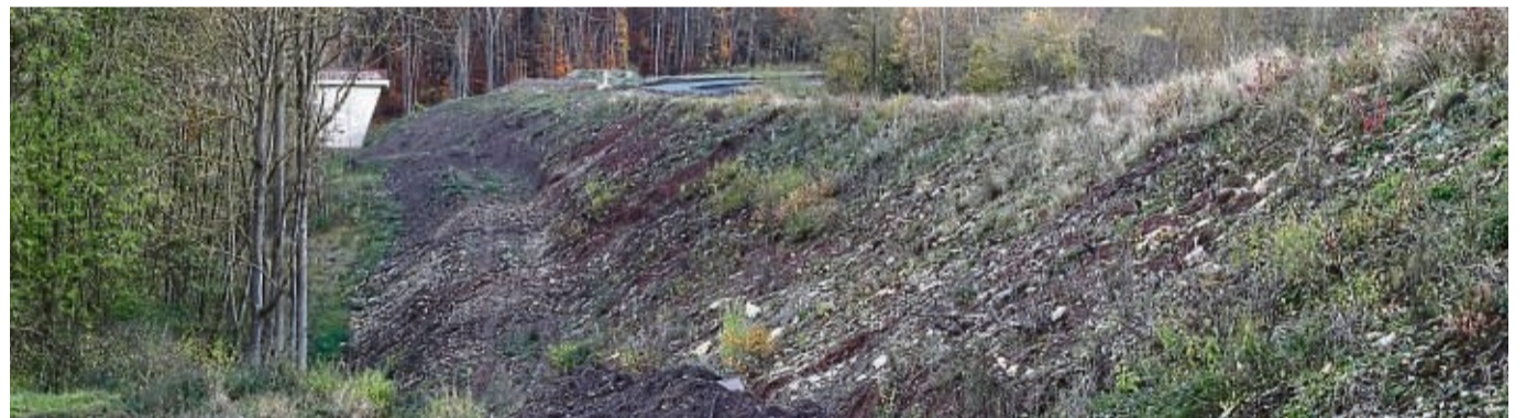
Der zur Entschärfung der Brandkurven aufgeschüttete Straßendamm rechts wird komplett entfernt. Die Fahrbahn ist bereits abgetragen.

Im Bereich der ehemaligen Brandkurven beginnen die ersten Erdarbeiten. Das Regenrückhaltebecken am nördlichen Brückenkopf der Jungfernbachtalbrücke ist bereits sichtbar. Der in den 1980er Jahren erhöhte alte Straßendamm der B 7 wird wieder bis zum Talgrund abgetragen. Seine Bodenmassen werden, soweit sie geeignet sind, in der Baustelle wieder eingebaut.