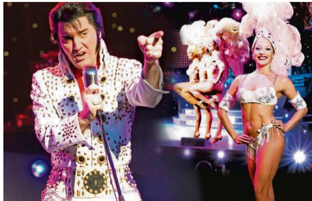
10 Jahre „ELVIS – Das Musical“ on Tour: Der Musical-Erfolg geht 2024 auf große Jubiläums-Tournee.