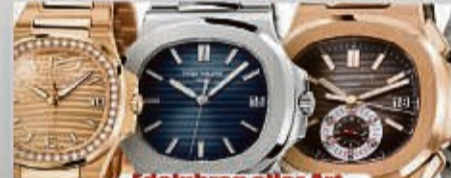
Edeluhren aller Art

Ihre Vorteile: ✓ kostenlose Beratung ✓ kostenlose Wertschätzung ✓ transparente Abwicklung ✓ Bargeld sofort