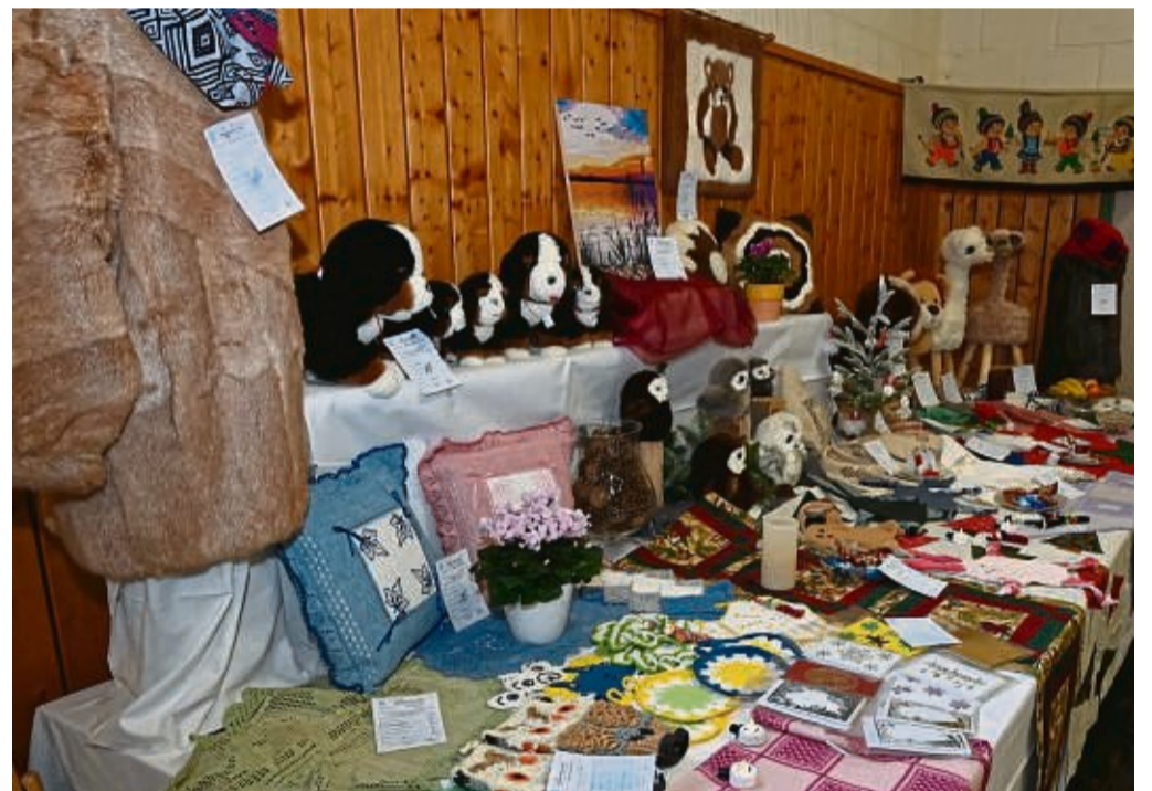
Auch im Wettstreit: Kreatives und Handarbeiten.

los vier Tiere gezeigt. Pro Tier ist eine Höchstpunktzahl von 100 Punkten möglich.