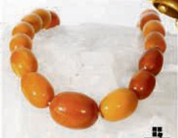
Bernstein aller Art