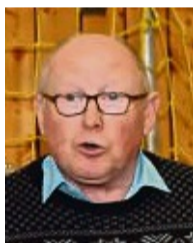
Robert Gante Kreisverband