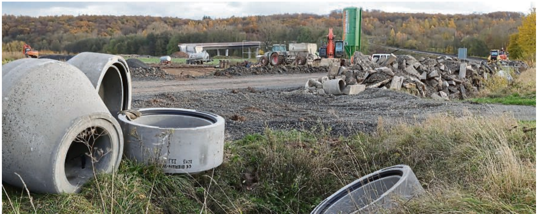
Gelände im Umbruch: Die alte B 7 südlich Caldens wurde abgetragen, der Bordsteinschutt gesammelt. Links wird die neue Zu- und Abfahrt Süd vorbereitet. Noch fehlt die Auffahrt zur neuen Brücke (hinten).

Zuletzt sind die Wirtschaftswege und Zufahrten für die Bauarbeiten ertüchtigt oder neu angelegt worden. Die Wege dienen auch der Zufahrt zum Wasserwerk Calden, die während der Bau-