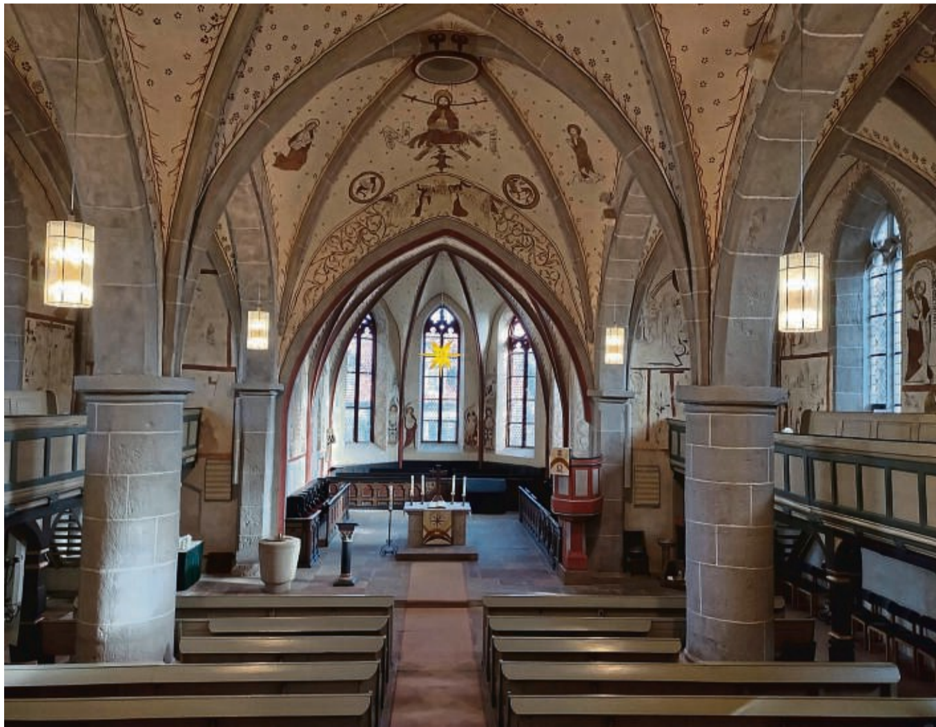
Einige Programmpunkte im kommenden Jahr finden in der Zierenberger Kirche statt. Zum Beispiel eine Midsummer-Gospelnight im Juni.