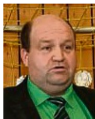
Jörn Meimbresse Verein Deisel