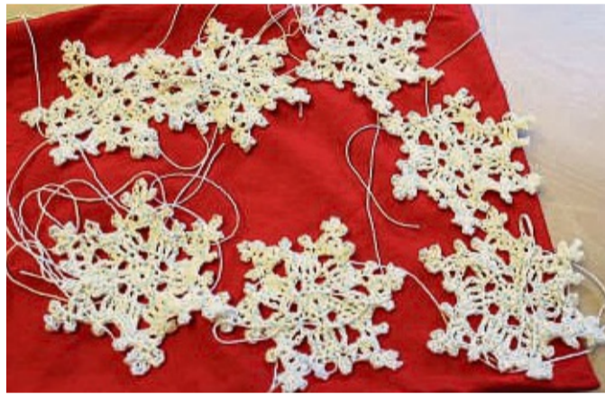
Für Weihnachten häkelt Angelika Schwedes weiße Deckchen in Sternform.

Aber alle Frauen in der Gruppe sind überzeugt davon, dass die gemeinsamen Aktivitäten sie körperlich und geistig fit halten und einer Vereinsamung entgegenwirken.