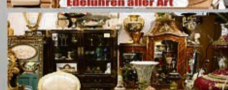
Antikes aller Art