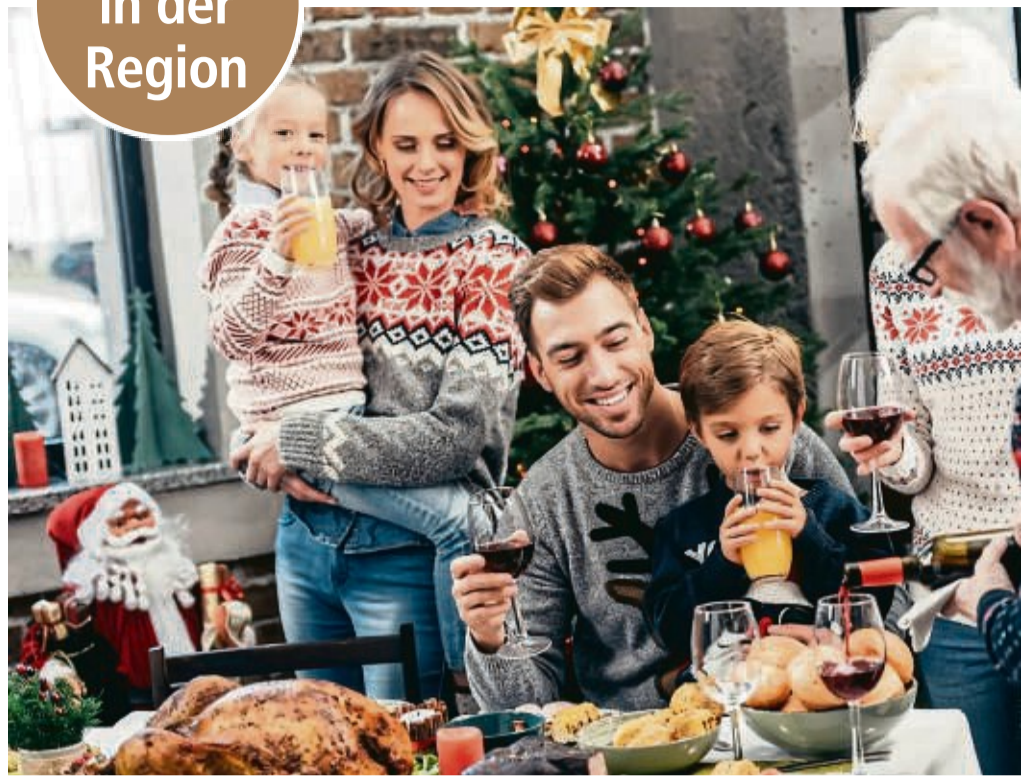
Weihnachten ist eine Zeit des Zusammenseins, eine besinnliche Zeit voller Genuss.