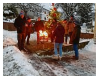
Festlich geschmückt ist der Weihnachtsbaum der Stammtischgemeinschaft in Epteroode.

Gespendet wurde der Baum in diesem Jahr durch Familie Nickel. Die Initiatoren danken dafür.