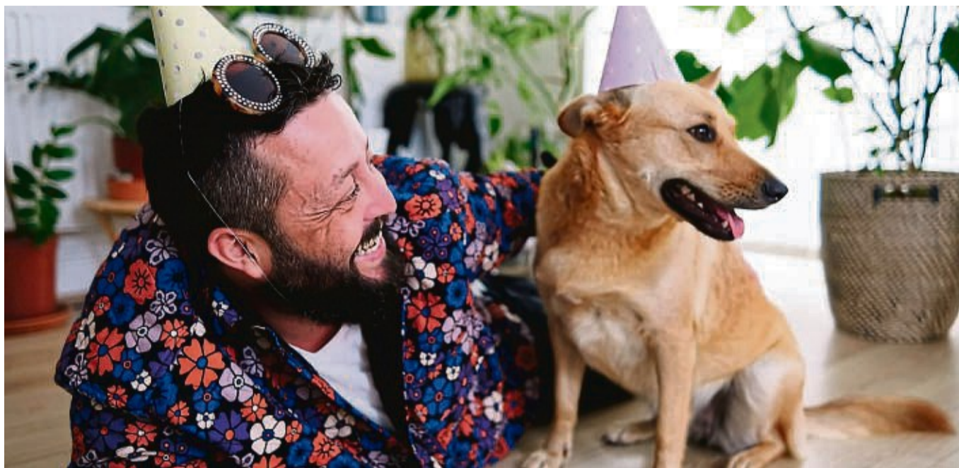
Für Hunde nicht immer ein Grund zu feiern: Silvester. Denn vielen Tieren machen Böller, Raketen und Co. Angst.

„Böllerangst ist eine Form der Geräuschangst“, erklärt Nitzschner. Der Hund sollte deshalb erst mal lernen, dass ungewohnte und laute Geräusche nicht furchteinflößend sind. Wie geht das? Das Prinzip ist simpel: „Wir gewöhnen den Hund nach und nach an Geräusche und gestalten das besonders angenehm, zum Beispiel durch