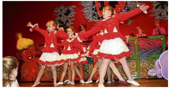
Auch die Funkenmariechen vom Escheröder Carnevals Verein – hier ein Bild aus dem Jahr 2020 – müssen jetzt sparsam mit Glitzer umgehen.