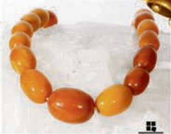
Bernstein aller Art