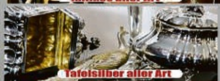
Tafelsilber aller Art

Kostenlose Begutachtung und Bewertung Ihres Schmuckstücks (auch bei Ihnen zu Hause)