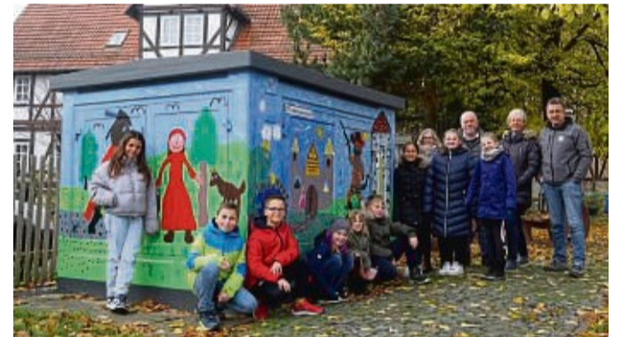
Die jungen Künstler der Grundschule Uschlag gestalteten das Trafohäuschen des Energieunternehmens EAM.

Verschenken Sie Lesefreude zur Weihnachtszeit!