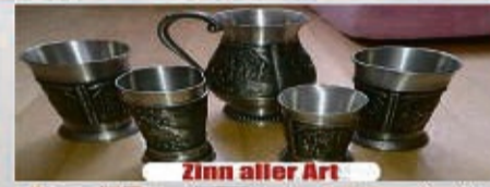
Zinn aller Art

*in Verbindung mit Gold Wir zahlen bis zu 10.000 € für Ihren Pelz!