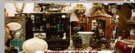
Antikes aller Art