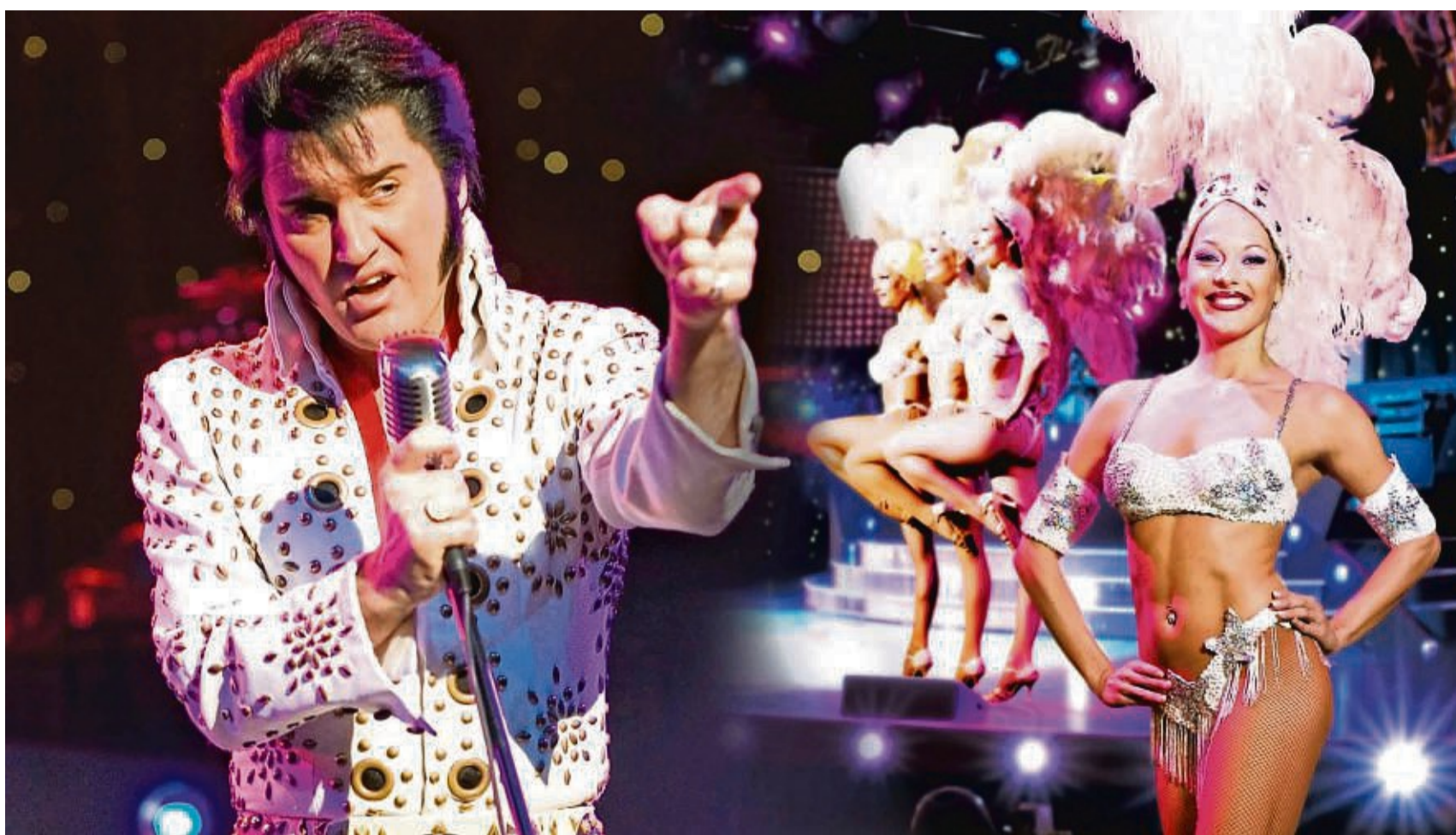
10 Jahre „ELVIS – Das Musical“ on Tour: Der Musical-Erfolg geht 2024 auf große Jubiläums-Tournee.

Das zweieinhalbstündige Live-Spektakel bringt die Magie rund um die Rock'n'Roll-Ikone zurück auf die Bühne