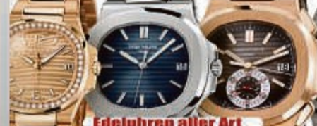
Edeluhren aller Art

Ihre Vorteile: ✓ kostenlose Beratung ✓ kostenlose Wertschätzung ✓ transparente Abwicklung ✓ Bargeld sofort