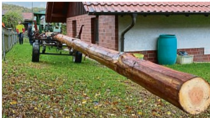
Aus dem umliegenden Wald wurde in Wiershausen bereits ein Maibaum ausgesucht und bearbeitet.

Feuerwehr und Traktorfreunde wollen Brauch in Wiershausen wiederbeleben