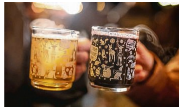
Don't drink and drive: Wer mit Alkohol feiern will, organisiert sich besser schon vorher eine sichere Heimfahrt.

beim zweiten Mal 1000 Euro und beim dritten Mal 1500 Euro fällig. Dazu kommen drei Monate Fahrverbot sowie zwei Punkte. Dieser Grenzwert könne schon nach einem zweiten Glühwein erreicht werden, so der TÜV Thüringen. Ab 1,1 Promille im Blut gilt man als absolut fahruntüchtig und begeht damit eine Straftat, wenn man fährt. Dann drohen drei Punkte, der Entzug der Fahrerlaubnis sowie Geld- oder Gefängnisstrafen. Schon ab dem vierten Glühwein könne dieser Wert erreicht sein. Für Fahranfänger in der Probezeit und alle unter 21 Jahren gilt laut Bußgeldkatalog sogar die Null-Promillegrenze. Wer gegen sie verstößt, muss unter anderem mit 250 Euro Bußgeld und einem Punkt in Flensburg rechnen. Betrunken Fahrrad fahren - auch keine gute Idee Auch auf dem Fahrrad riskiert man in alkoholisiertem Zustand seinen Führerschein, informiert der Allgemeine Deutsche Fahrrad-Club. Zwar liegt die Grenze zur absoluten Fahruntüchtigkeit und damit zum Straftatbestand erst bei 1,6 Promille. Aber schon darunter können Radler bei Ausfallerscheinungen angeklagt werden. Wer mit Alkohol feiern will, macht sich am besten schon vorher Gedanken über eine sichere Heimfahrt - etwa mit öffentlichen Verkehrsmitteln oder einem Taxi. Bei Fahrgemeinschaften sollte man verabreden, wer nüchtern bleibt und sich hinter Steuer setzt.