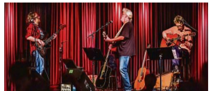
„Folk nach dem Fest“ in Oberellenbach: Unser Archivfoto zeigt Shiregreen im Buchcafé.

Die Tenne in Oberellenbach bietet mit Bullerjan und Feuerschale die gesungene kultige Atmosphäre, und das UDO-Team sorgt für Getränke und kleine Snacks. Der Eintritt kostet im Vorverkauf 13 Euro, Plätze können per Mail an info@shiregreen.de oder telefonisch unter 01 57/34 36 63 27 oder 01 76/32 73 12 36 reserviert werden. Die Tickets kosten an der Abendkasse dann 15 Euro.