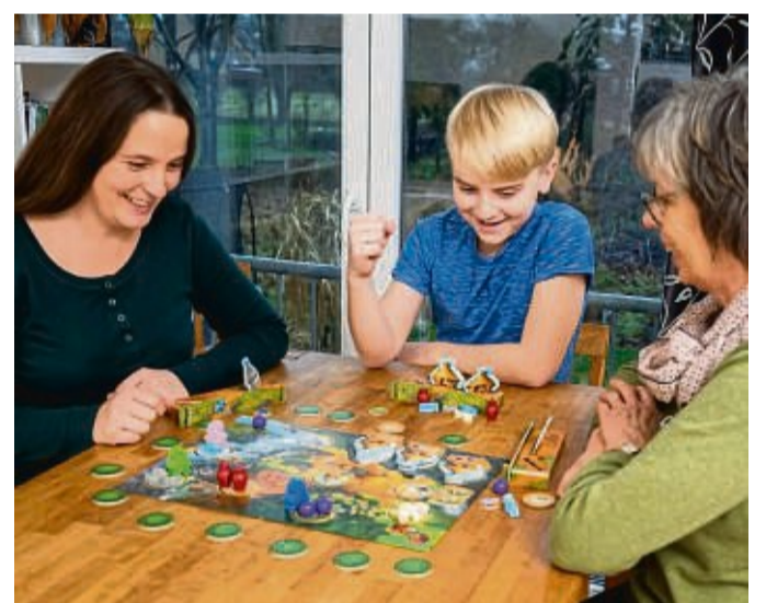
enerationenübergreifendes Gaming: Brettspiele bringen verschiedene Altersgruppen zusammen.