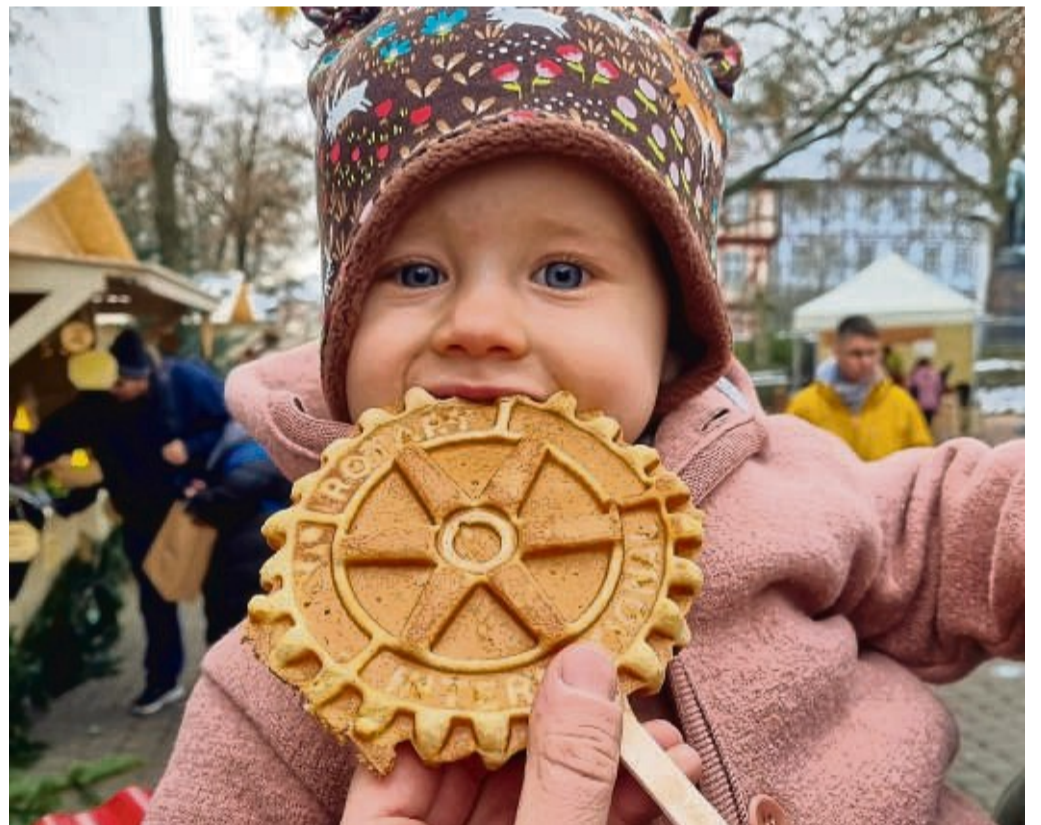
Süße Waffeln für süßen Fratz: Auch die Kleinsten haben Freude an der leckeren Spendenaktion.