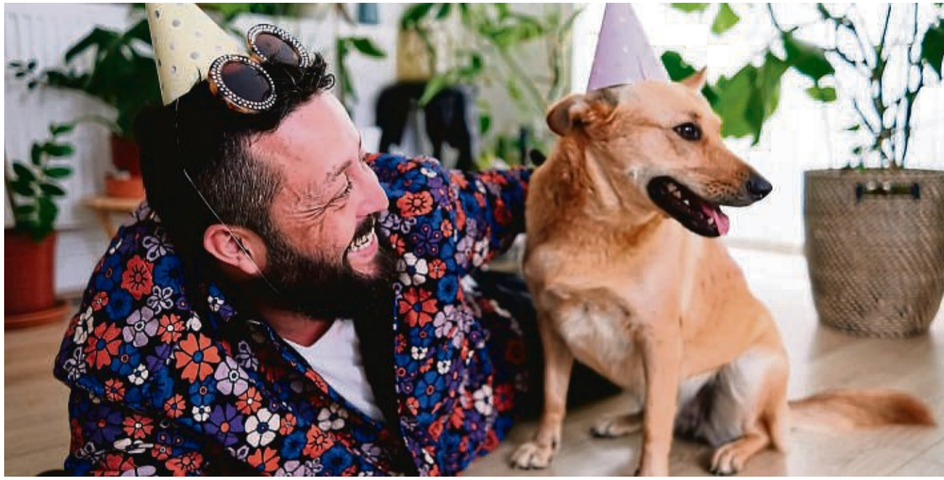
Für Hunde nicht immer ein Grund zu feiern: Silvester. Denn vielen Tieren machen Böller, Raketen und Co. Angst.