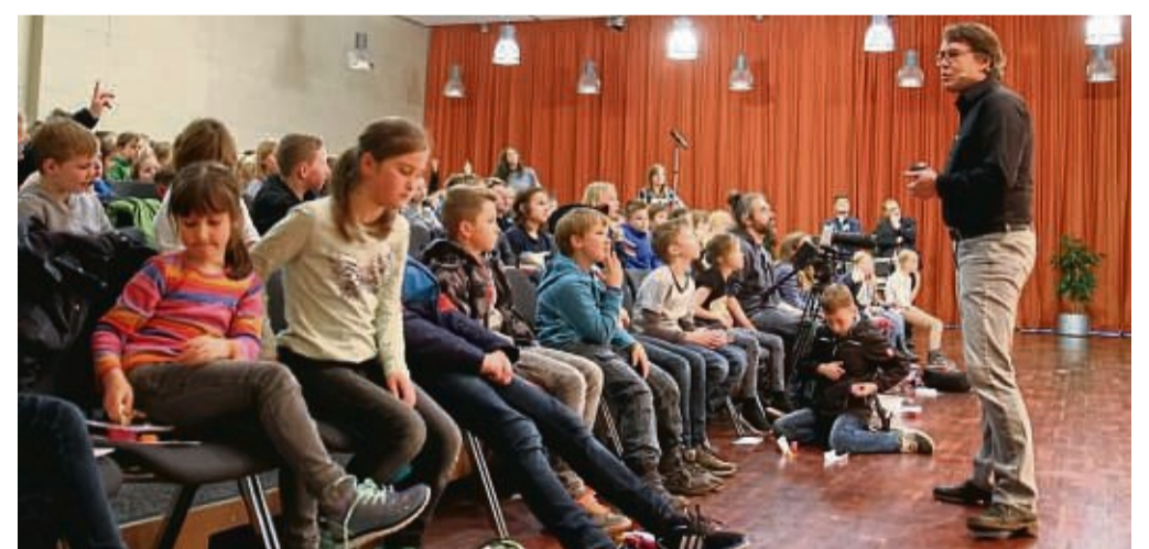
Studieren in der Stadthalle: Die Kinder-Uni war von 2007 bis 2018 ein fester Bestandteil des Bildungsangebotes in der Region. Am 25. Januar gibt es wieder eine Vorlesung.

Korbach - Die Kinder-Uni des Kommunalen ServiceVerbundes Eisenberg (KSVE) war von 2007 bis 2018 ein fester Bestandteil des Bildungsange- botes in der Region. Mit mehr als 30 Vorlesungen und über 10000 verkauften Eintritts- karten war die Vorlesungsrei- he für Kinder im Alter zwi- schen acht und zwölf Jahren ein echtes Erfolgsmodell.