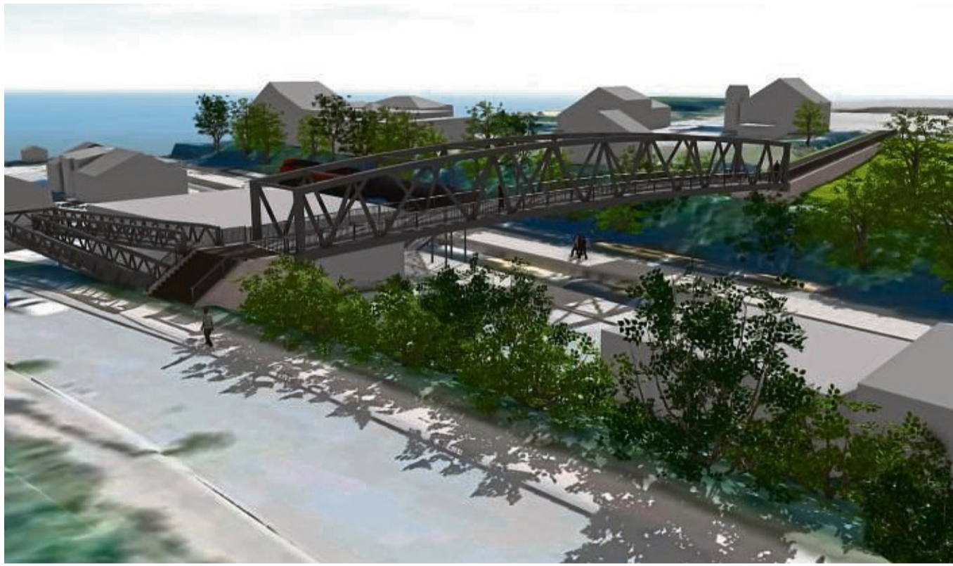
Nach mehreren Kostensteigerungen ist die Brücke am Willinger Bahnhof vorerst gestoppt.

„Die Gemeinde hat kein überdimensioniertes Bauwerk geplant, sondern die für den verfolgten Zweck günstigste Lösung“, unterstreicht Trachte. Ein spezialisiertes Fachbüro legt dar, dass bei der Traglast der DIN-Norm für Menschenansammlungen gefolgt wurde. Zudem