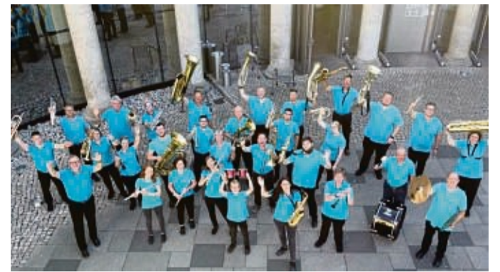
Konzert am dritten Advent: Die Friedrichsteiner Schlossbergmusikanten spielen Weihnachtsklassiker und Stücke aus Popmusik und Musicals in der Lukaskirche.