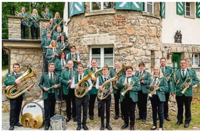
Die Schützenblaskapelle Willingen gibt am 28. Dezember ihr Jahresabschlusskonzert.

Im zweiten Teil des Konzertes werden die Blasmusikfreunde mit den schönsten Polkas verwöhnt und es gibt einen Ausblick wo „Unsere Reise“ der Schützenblaskapelle hingeht. Die Moderati-