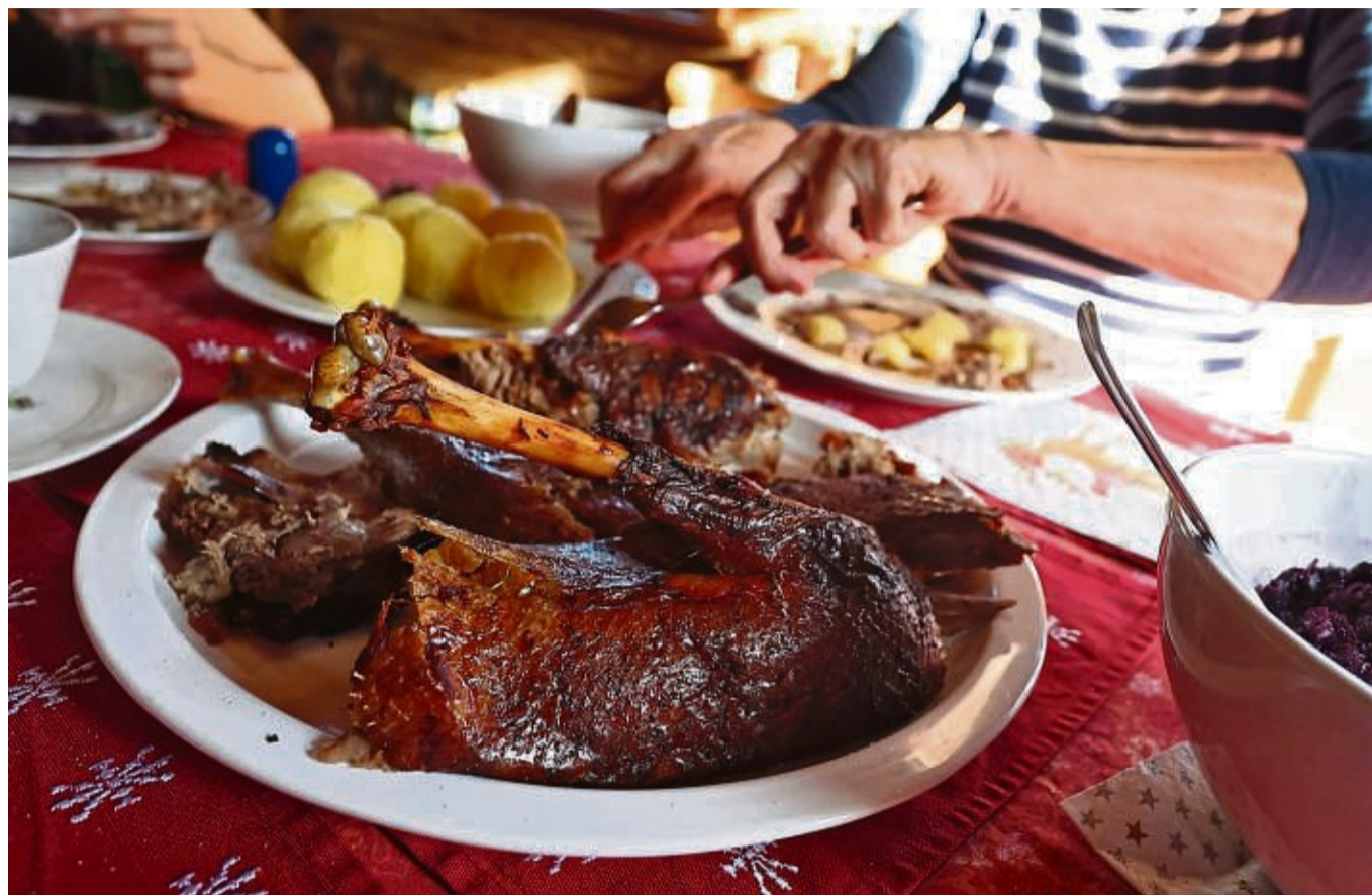
Eine knusprige Weihnachtsgans gehört für viele auf den Festtagstisch - am besten, wenn sie ohne schnelle Mast von nur 10 Wochen gemästet wurde, sondern sechs Monate Zeit auf einer Weide verbracht hatte.