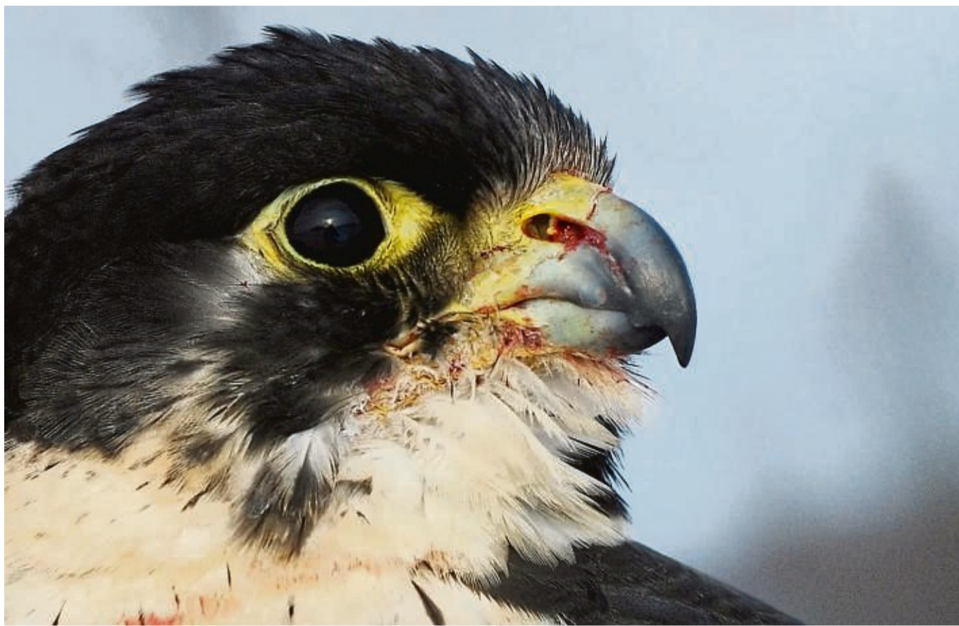
Pfeilschneller Jäger: ein europäischer Wanderfalcke (Falco peregrinus).