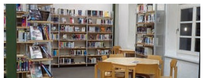
In einem neuen Look: Der erste Stock der Korbacher Stadtbücherei wurde modernisiert. Morgen öffnet sie wieder.

Deshalb war die Bücherei am 20. November geschlossen worden. Inzwischen sind alle Bücher wieder zurück und in