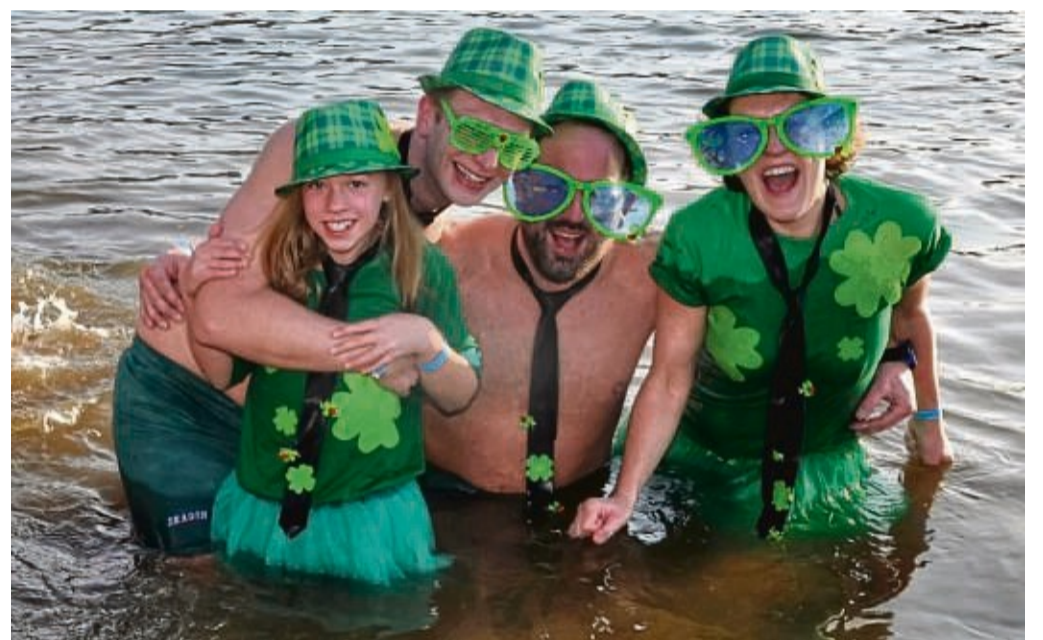
Gaudi am Neujahrstag: Bunt kostümiert nehmen wagemutige Neujahrsschwimmer ein erfrischendes Bad im Edersee.