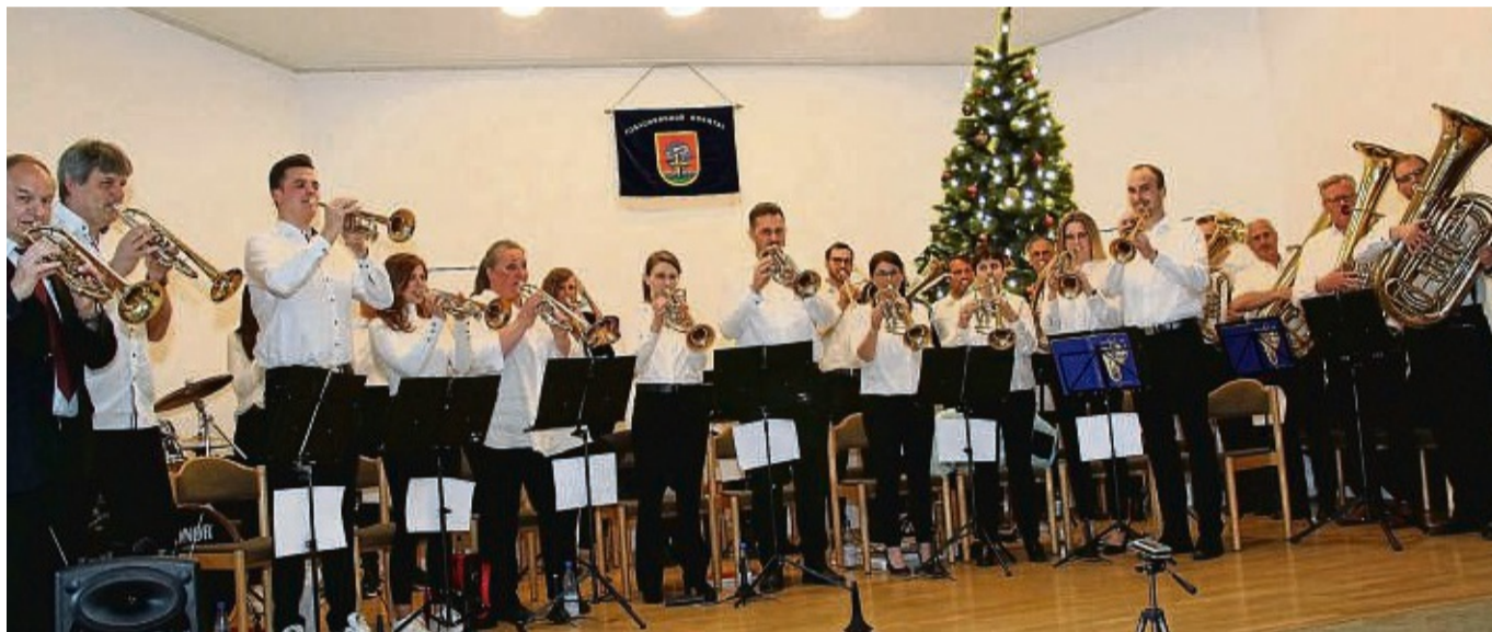
Alljährlich im Advent lädt der Posaunenchor Edertal zu seinem traditionellen vorweihnachtlichen Konzert ein.