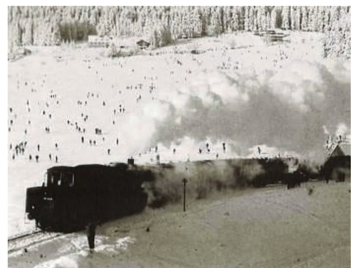
Noch kein Lift, aber Skibetrieb: Der Ritzhagen in früherer Zeit zierte das Titelblatt des Kalenders.

Der DIN-A3-Kalender ist zum Preis von 19,90 Euro im Rathaus und im Besucherzentrum, im REWE-Markt, im „AmbienTee“, der Postfiliale oder direkt beim Heimat-Kultur-Geschichtsverein erhältlich.