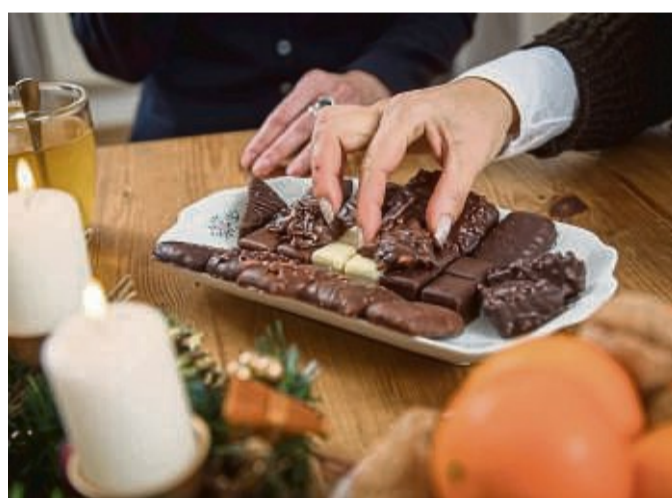
Nimm' zwei? In der Adventszeit verlocken uns die vielen Leckereien zum übermäßigen Naschen.

Wer Plätzchen oder Stollen selbst backt, hat in der Hand,