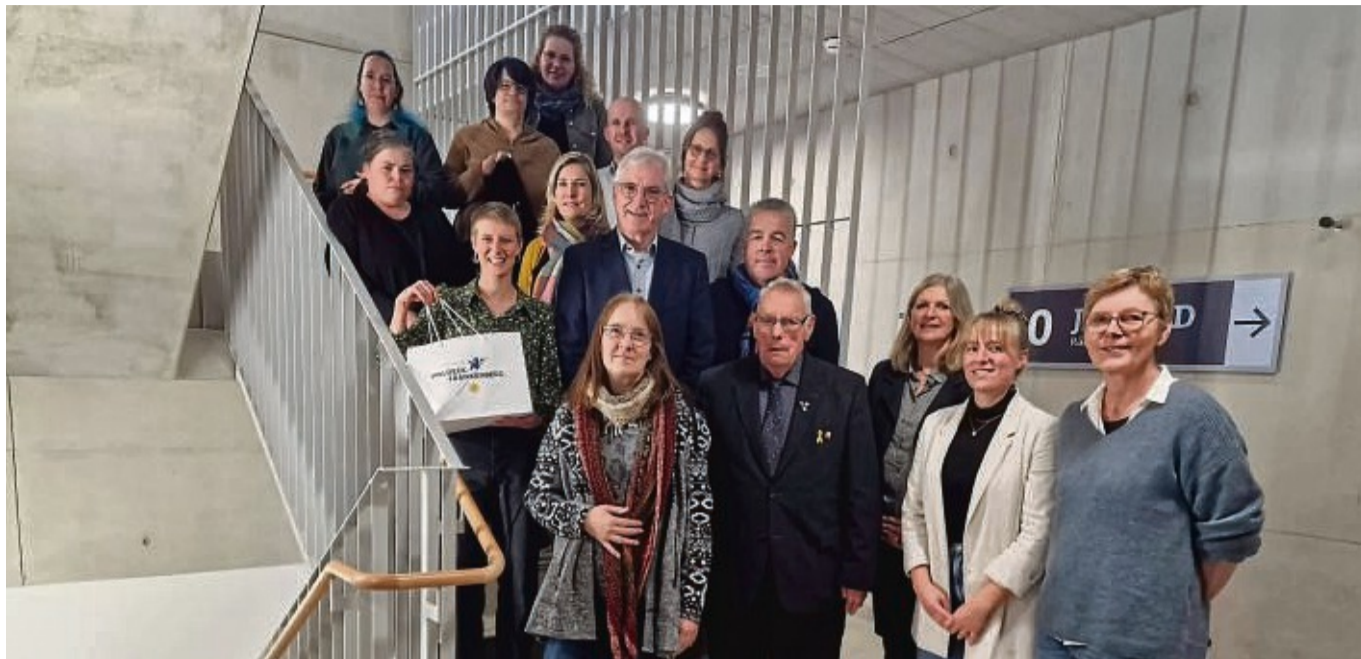
Der Landkreis hat eine Fotoaktion durchgeführt, um auf das Thema Barrierefreiheit aufmerksam zu machen. Die Prämierung fand in der Kreisverwaltung statt.

„Wir haben die Erfahrung gemacht, dass es hier gar