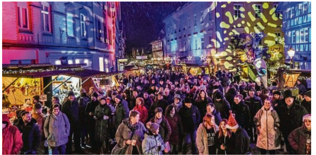
Mit besonderer Lichttechnik wird der Marktplatz zum Weihnachtsmarkt bunt und weihnachtlich erleuchtet. Der Arbeitskreis Open Flair bringt hier seine Erfahrung ein.

Am Sonntag spielen hier Ten Sing oder die Bückeberger. Für 16.30 Uhr ist wieder die Aktion „Eschwege