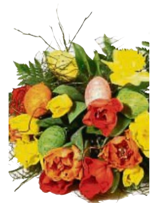
Allen Geburtstagskindern: Herzlichen Glückwunsch.