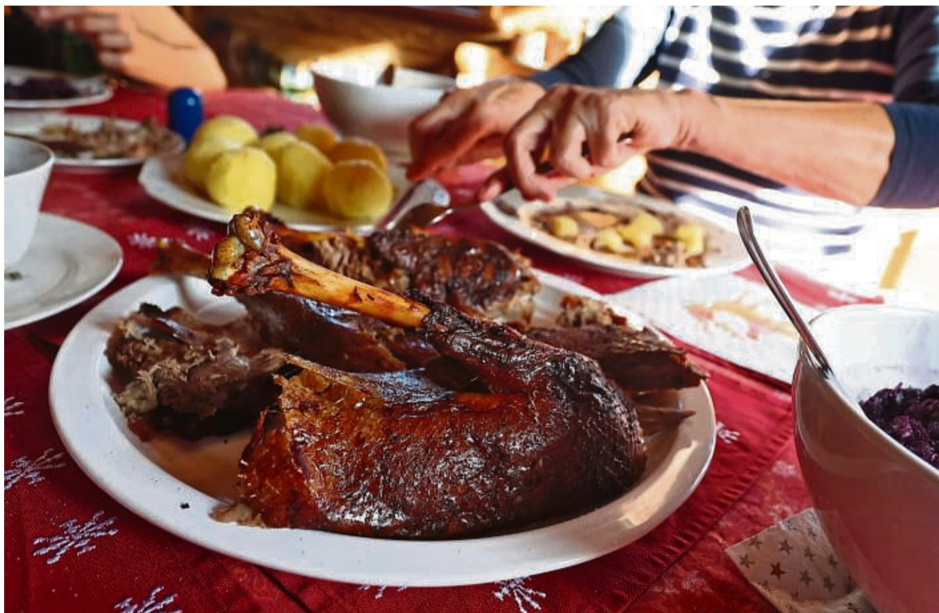
Eine knusprige Weihnachtsgans gehört für viele auf den Festtagstisch - am besten, wenn sie ohne schnelle Mast von nur 10 Wochen gemästet wurde, sondern sechs Monate Zeit auf einer Weide verbracht hatte.