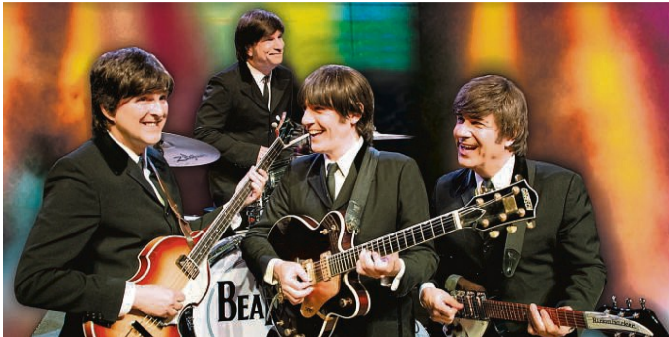
All you need - Das Beatles Musical ist am 4. Februar zu Gast in der Stadthalle Kassel.

Mit weltweit schätzungsweise mehr als einer Milliarde verkauften Tonträgern, den meisten Nr.-1-Alben sowie dem erfolgreichsten Komponisten-Duo Lennon/McCartney der Pop-Geschichte zählen die Beatles zweifellos zu den größten Bands aller Zeiten. Die musikalische Biografie erzählt in zwei Akten die bedeutendsten Stationen der vier Jungs aus Liverpool auf ihrem Weg zum Weltruhm: Von den ersten Auftritten im Hamburger Star-Club bis hin zu ihrem letzten gemeinsamen und weltberühmten Konzert auf dem Dach der Plattenfirma Apple Records in London. „all you need is love! - Das Beatles-Musical“ präsentiert mit über 30 Hits alle unsterblichen Lie-