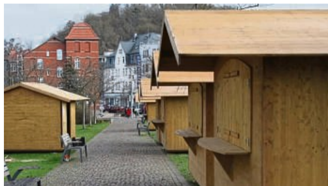
Für den Adventsmarkt im Kloostergarten am Wochenende in Frankenberg stehen die Holzbuden schon im Landratsgarten an der Bahnhofstraße.