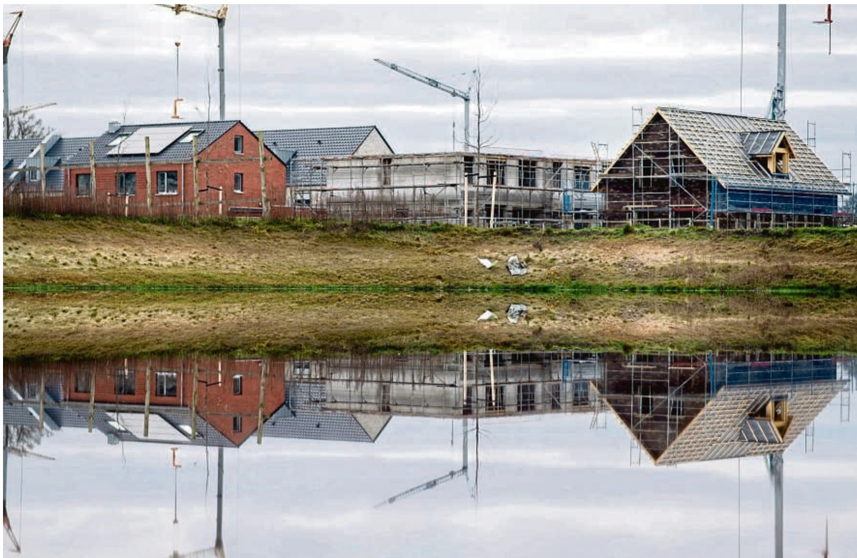
Starkregen und versiegelte Flächen bedeuten Überflutungsgefahr. Hier sorgt ein Entwässerungsgraben dafür, dass Wasser abfließen kann, doch auch Hausbesitzer selbst sollten in Risikogebieten Maßnahmen ergreifen.

Dann wird es unter ungünstigen Umständen für