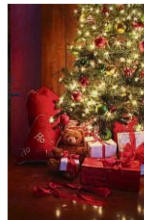
Im Innenbereich sind der Kreativität keine Grenzen gesetzt.

Um das weihnachtliche Funkeln auf Uhrzeiten zu beschränken, in denen es wirklich gebraucht wird, kann eine Zeitschaltuhr helfen.