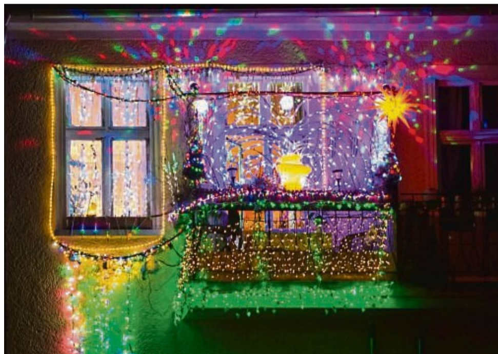
Nicht immer jedermanns Geschmack: Solange die Erlaubnis des Vermieters vorliegt und von der Deko keine Gefahr ausgeht, ist vieles möglich.

Wer plant, Weihnachtsschmuck an der Außenseite der Fenster oder der Hausfassade anzubringen, für den Bohrungen notwendig