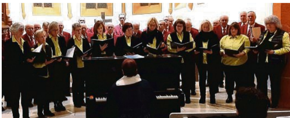
Frauenchor mit dem Männerchor Concordia-Liedertafel im Hintergrund.