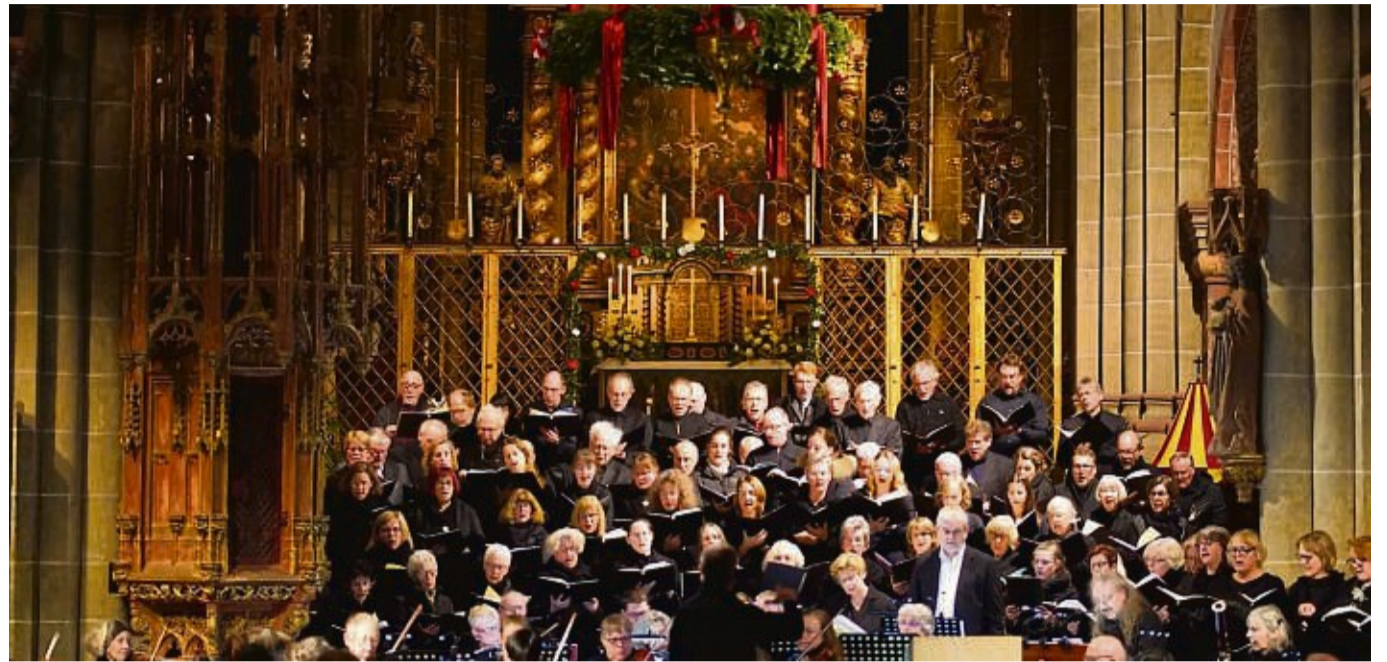
Harmonische Einheit und emotionale Intensität: Die Mitglieder des Domchores St. Peter und der Kreiskantorei Wolfhagen verzauberten ihr Publikum beim Adventskonzert im Fritzlarer Dom.