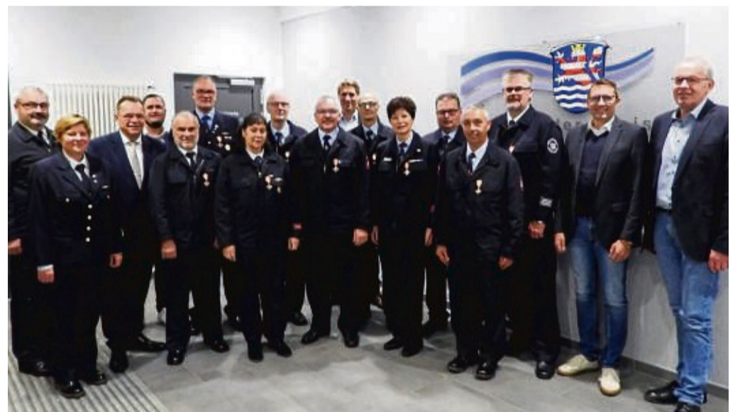
Ehrenamtlich im Einsatz: Feuerwehrfrauen und Feuerwehrmänner aus Borken, Wabern, Homberg und Jesberg wurden für langjährigen aktiven Dienst ausgezeichnet.