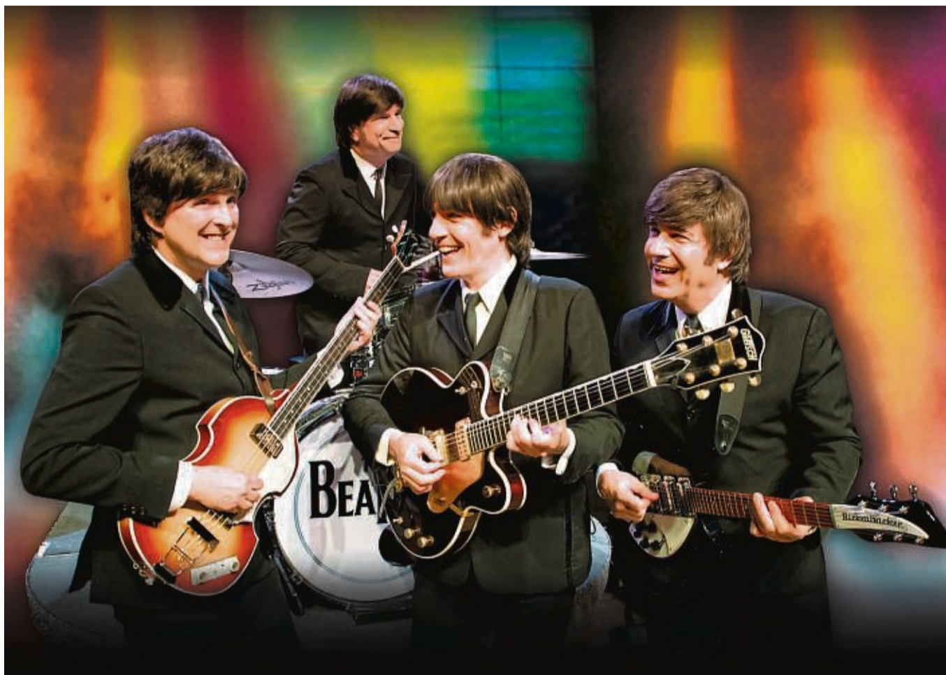
All you need - Das Beatles Musical ist am 4. Februar zu Gast in der Stadthalle Kassel.

Mit weltweit schätzungsweise mehr als einer Milliarde verkauften Tonträgern, den meisten Nr.-1-Alben sowie dem erfolgreichsten Komponisten-Duo Lennon/McCartney der Pop-Geschichte zählen die Beatles zweifellos zu den größten Bands aller Zeiten. Die musikalische Biografie erzählt in zwei Akten die bedeutendsten Stationen der vier Jungs aus Liverpool auf ihrem Weg zum Weltruhm: Von den ersten Auftritten im Hamburger Star-Club bis hin zu ihrem letzten gemeinsamen und weltberühmten Konzert auf dem Dach der Plattenfirma Apple Records in London. „all you need is love!“ - Das Beatles-Musical“ präsentiert mit über 30 Hits alle unsterblichen Lieder der Fab Four live, bringt den Zauber der Vergangenheit zurück in die Gegenwart