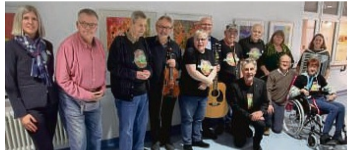
Die Farbentänzer zeigen im Krankenhaus Gesundbrunnen neue Bilder.

Die Ausstellung kann bis zum 15. Februar auf den Fluren des Evangelischen Krankenhauses Gesundbrunnen auch von Besuchern bestaunt werden. tty