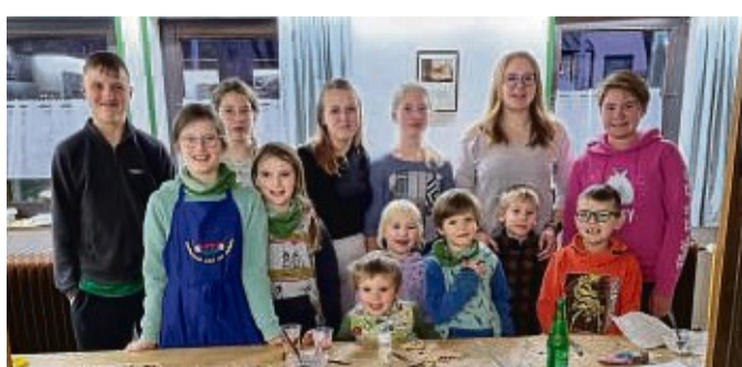
Gemeinsames Backen: Die Kinder und Jugendlichen des Musikzuges aus Grebenstein haben gemeinsam Plätzchen gebacken.

Mit verschiedenen Förmchen vom Schlepper über Bagger und Lama bis hin zum Engel haben die Kinder viele