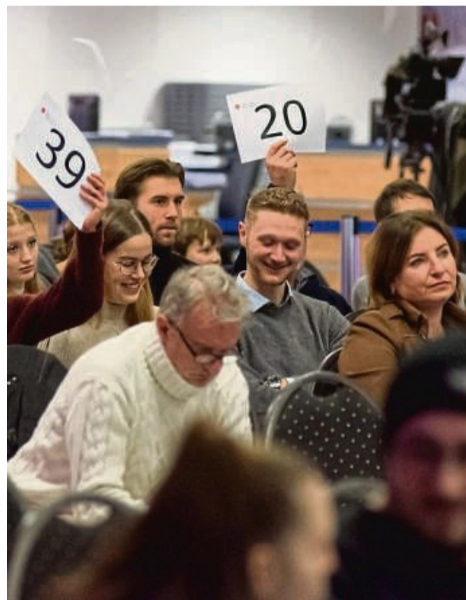
Einige Angebote, wie etwa Flugreisen waren unter den Bietern durchaus umkämpft.

Melsungen bekannt ist, hatten die Organisatoren einen ebenso engagierten wie unterhaltsamen Auktionator gewonnen, der den Bietern mit viel Fingerspitzengefühl für das Mögliche immer noch den einen oder anderen Euro für den guten Zweck entlockte. Besonders beliebt bei den Bietern: natürlich Flugreisen ab Calden.