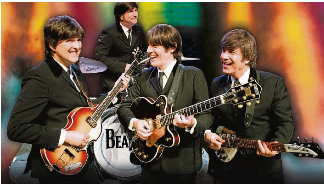
All you need - Das Beatles Musical ist am 4. Februar zu Gast in der Stadthalle Kassel.

Mit weltweit schätzungsweise mehr als einer Milliarde verkauften Tonträgern, den meisten Nr.-1-Alben sowie dem erfolgreichsten Komponisten-Duo Lennon/McCartney der Pop-Geschichte zählen die Beatles zweifelsfrei zu den größten Bands aller Zeiten. Die musikalische Biografie erzählt in zwei Akten die bedeutendsten Stationen der vier Jungs aus Liverpool auf ihrem Weg zum Weltruhm: Von den ersten Auftritten im Hamburger Star-Club bis hin zu ihrem letzten gemeinsamen und weltberühmten Konzert auf dem Dach der Plattenfirma Apple Records in London. „all you need is love! - Das Beatles-