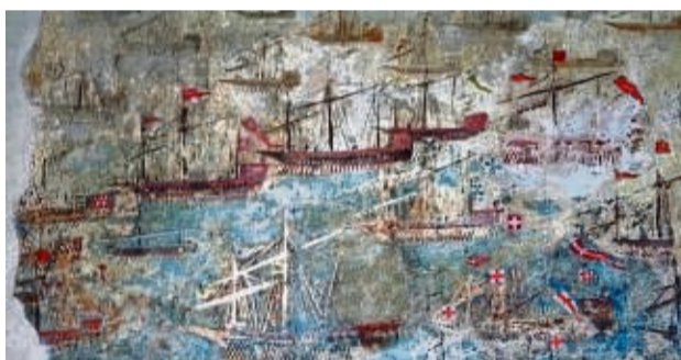
Fresko: Ausschnitt aus der Seeschlacht bei Lepanto 1571 im Lepanto-Saal des Stadtschlusses.

dert vor den griechischen Inseln oder die Architekturelemente sind gelungen in die Modernisierung des Raumes eingebunden. Mit einer neuen die Akustik verbessernden Decke wurde die Höhe des Raumes auf ein zur Grundfläche passendes Maß reduziert. Mit einer großen Projektionswand, LED Beleuchtung und moderner Technik ausgestattet eignet er sich hervorragend für Veranstaltungen. red