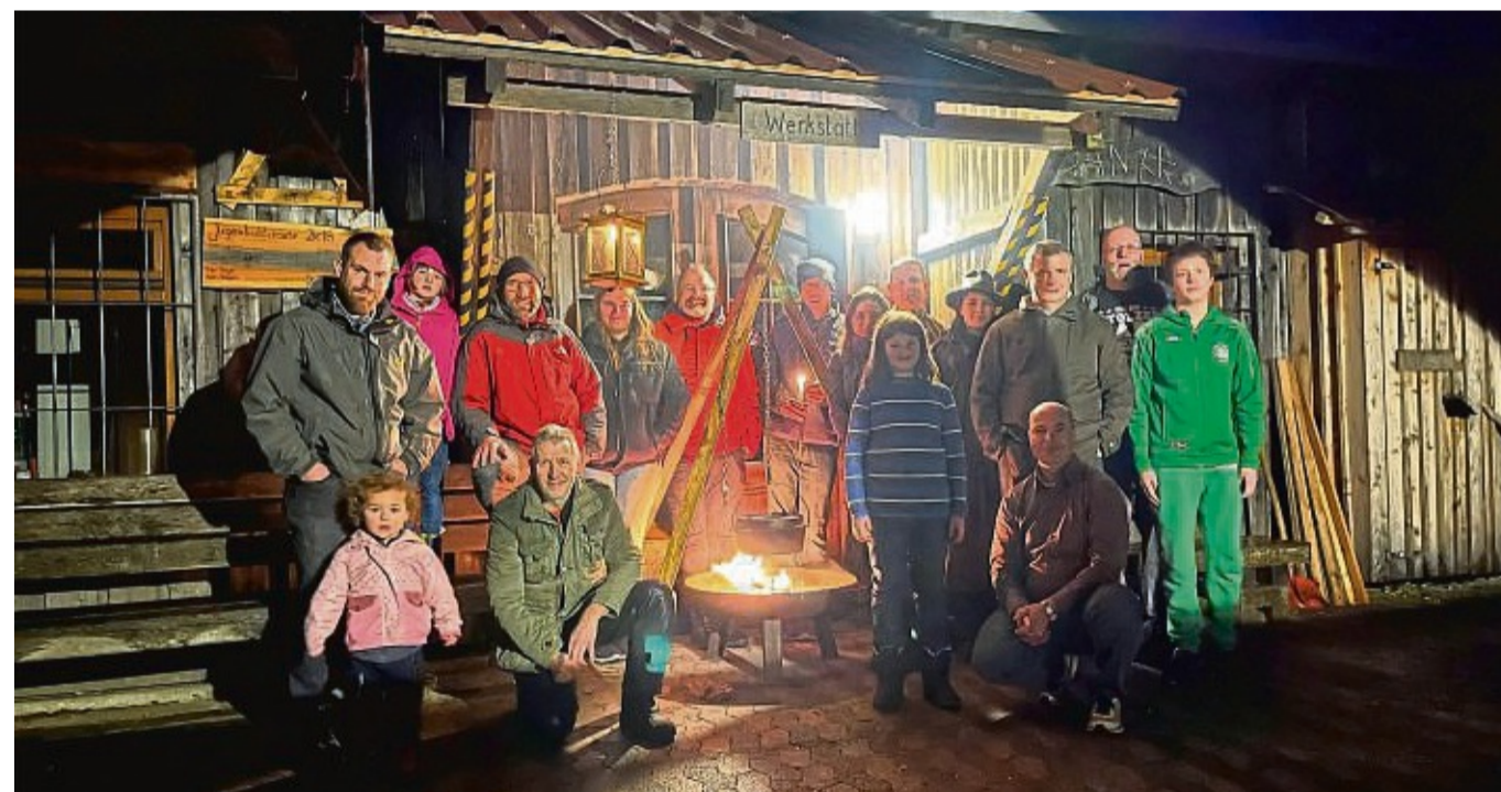
Ein Wochenende, um die Vater-Kind-Beziehung im Alltag zu fördern: Der Besuch im Waldpädagogikzentrum Haus Steinberg hat Tradition.