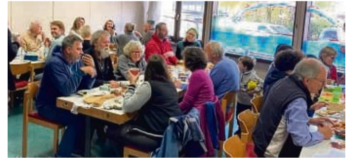
Kulturinitiative offenes und solidarisches Gertenbach (KiosG): Das dritte Mit-Bring-Frühstück wurde wieder als voller Erfolg gesehen.

2022 mehrere Veranstaltungen organisiert hat. Einmal pro Woche findet ein gemeinsamer Mittagstisch für Berufstätige im Dorf statt. Die Kulturinitiative ist eine Gruppe von derzeit 50 Gertenbachern, die einen lebendigen Austausch im Dorf anstoßen möchte. Mit Angeboten von der Spielrunde über Frühstück bis zur politischen Lesung wollen sie Begegnungen schaffen. Kontakt: E-Mail an kultur_in_gertenbach@web.de