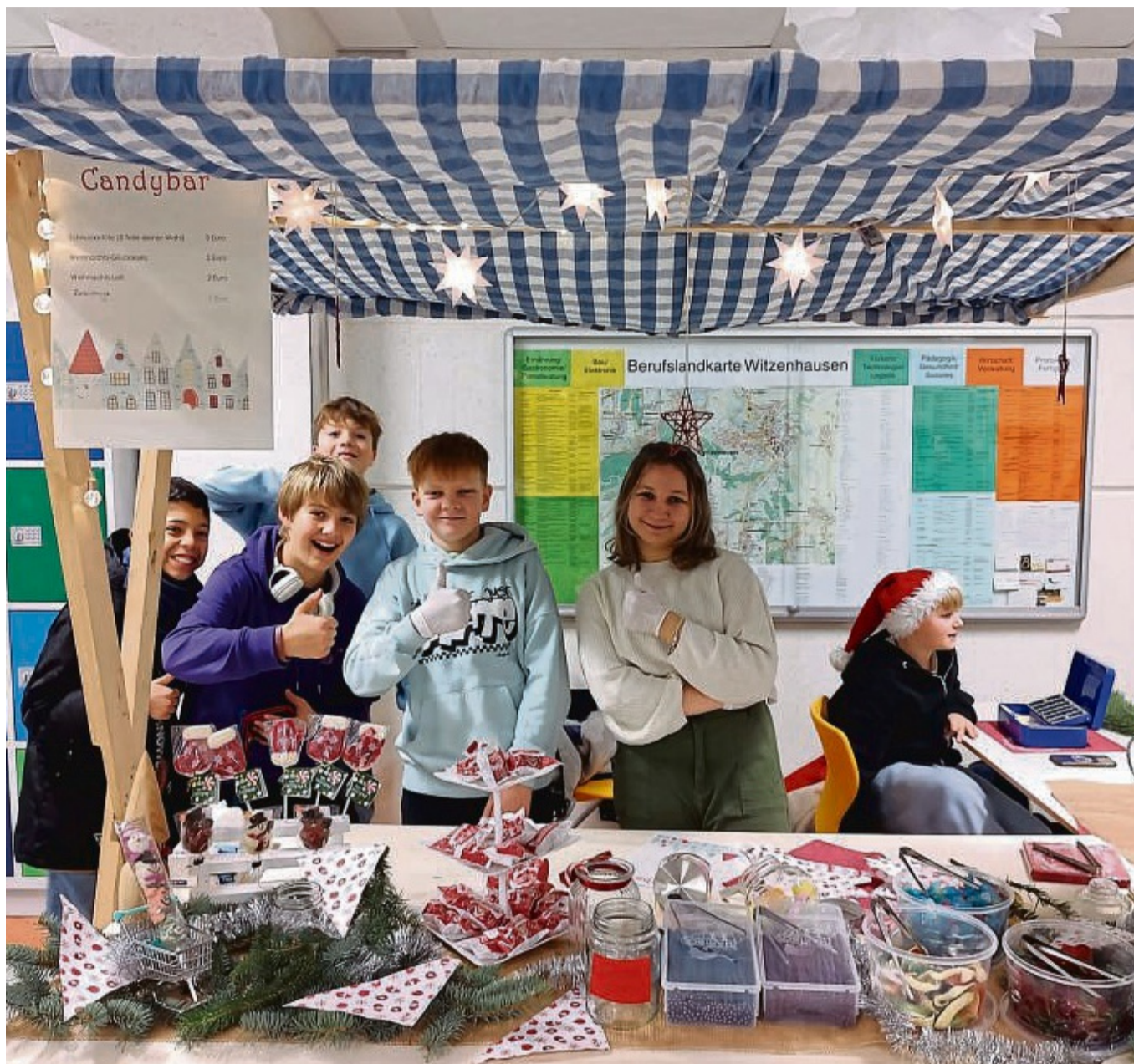
Süße Köstlichkeiten an der Candybar: Vorweihnachtsstimmung gab es am ersten Dezember an der Johannisberg-Schule in Witzenhausen als nach langer Corona-Pause wieder ein Adventsbasar stattfand.