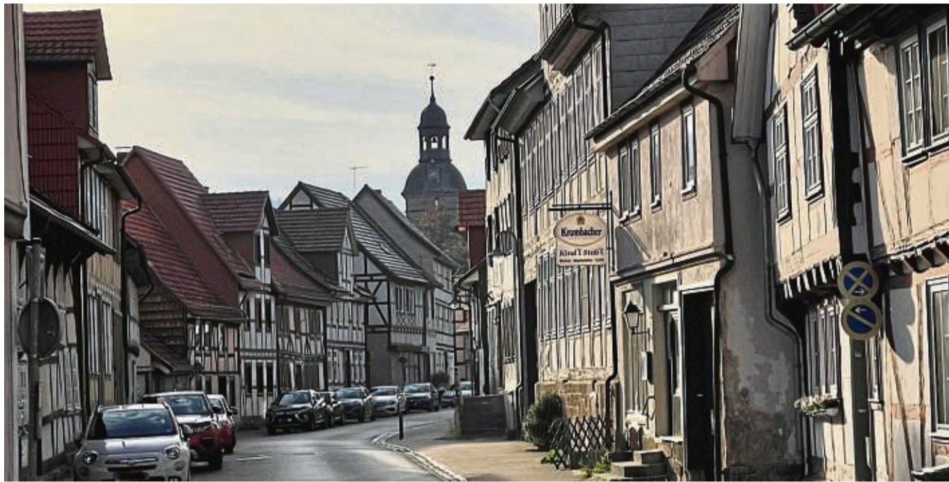
Fachwerk ist in der Region ein Pfund. Nicht nur in den Innenstädten gibt es imposante Gebäude. Unser Bild zeigt die Rathausstraße in Hedemünden.

Bei den Beratungsterminen vor Ort soll es auch um diese Themen gehen. „Wir wollen die Angst nehmen, mit den zuständigen Behörden Kon-