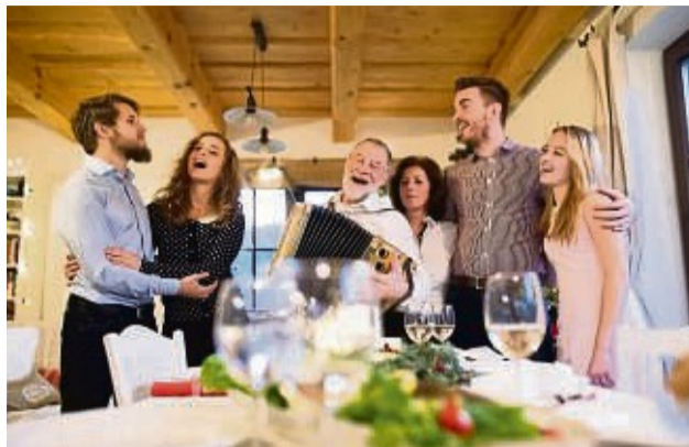
Ein Familienmitglied legt mit einem Lied los und die anderen stimmen mit ein. So lässt sich eine Tradition etablieren.

Es ist für den Anfang wichtig, die richtigen Lieder auszusuchen. Das sind Lieder, die auch ohne musikalische Begleitung funktionieren. Kinder mögen es besonders gerne, wenn sich Teile des Liedes häufig wiederholen. Oder auch so fröhliche Ruffieder, wie etwa „Es schneit, es schneit, kommt alle aus dem Haus“, bei denen man den Text schnell auswendig lernen kann, sind gut geeignet.