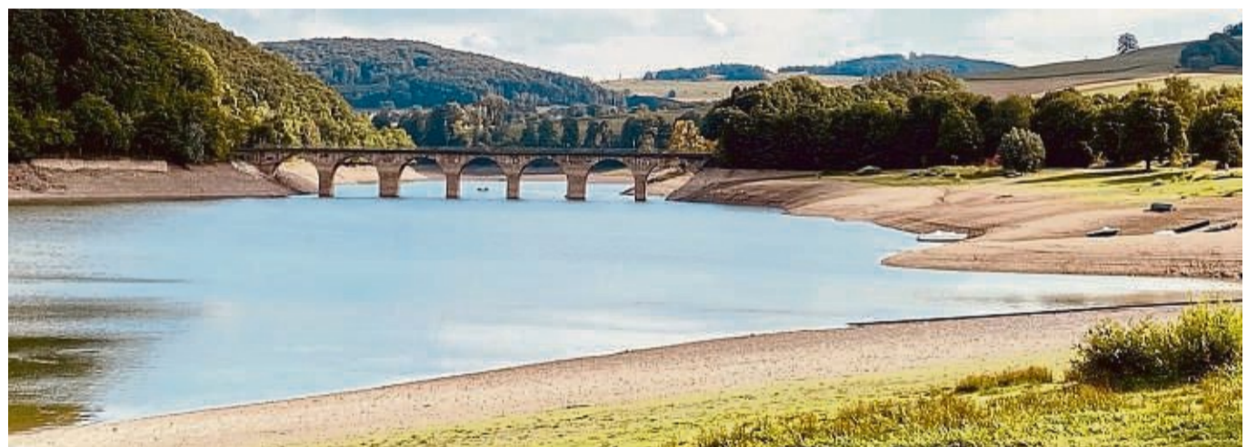
Geleerter Diemelsee: Zeiten mit langer Hitze und Dürre nehmen eher zu. Die Gemeinde will mit einer Gefahrenabwehrverordnung den Wasserverbrauch in Notzeiten einschränken.