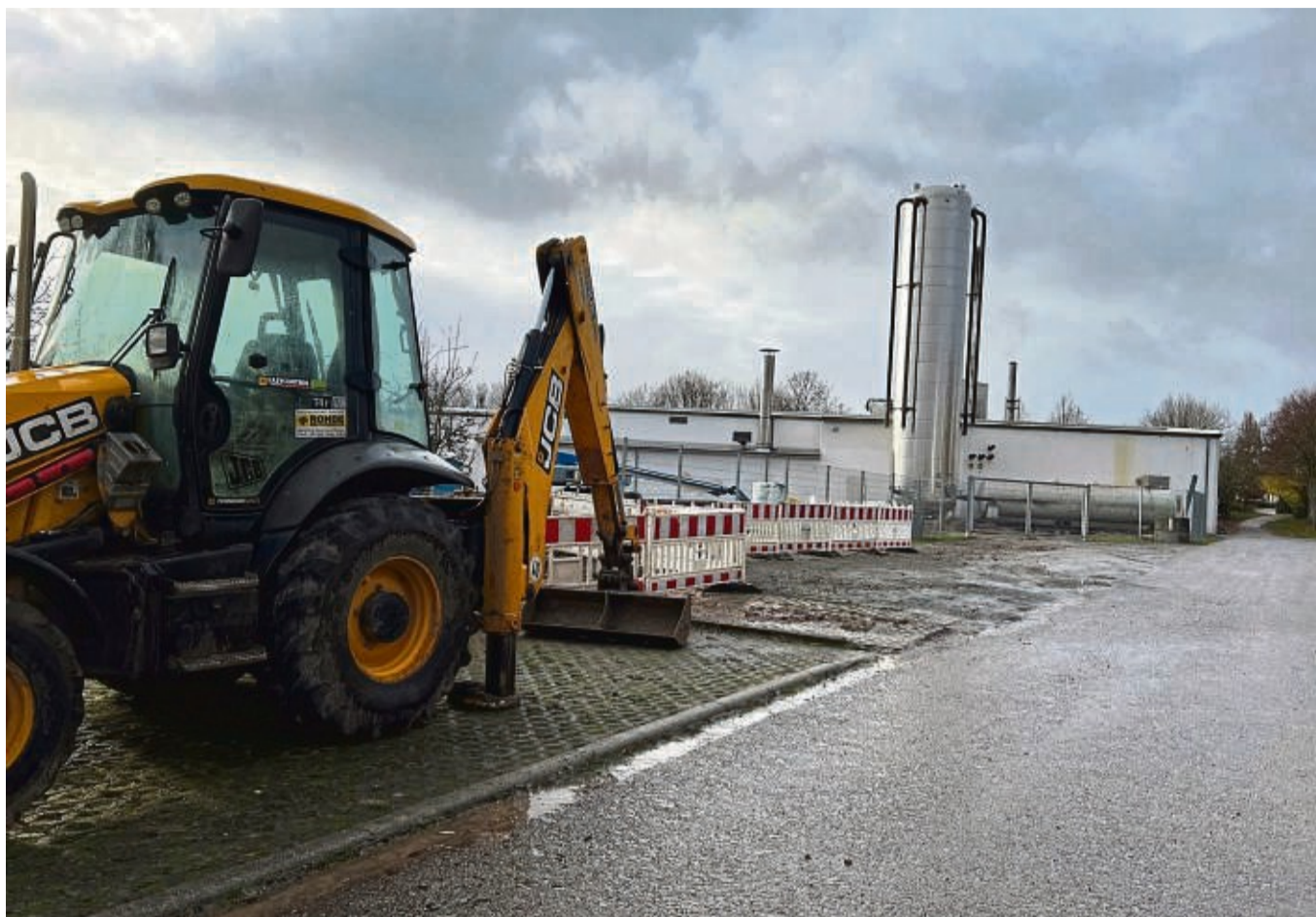
Am Holzheizkraftwerk am Birkenweg ist ein 18 Meter hoher Pufferspeicher mit 103 Kubikmetern Fassungsvermögen aufgestellt worden. Der Puffer soll dabei helfen, Nachfragespitzen auszugleichen.

Doch die Investitionspläne der BAN sind damit noch lange nicht erschöpft. Auf dem Gelände wurde jetzt ein 18 Meter hoher Pufferspeicher mit 103 Kubikmeter Volumen aufgestellt. Zudem sollen ein zusätzliches Blockheizkraftwerk und eine Photovoltaikanlage installiert werden. Das Blockheizkraftwerk wird Erdgas verbrennen, Wärme und Strom produzieren. Der Strom und der Ertrag der Photovoltaikanlage sollen einen Großteil des