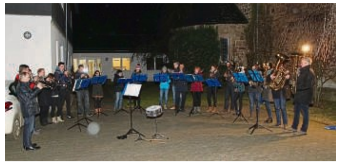
Der Posaunenchor Edertal lädt am Heiligen Abend zum Christkindwiegen ein.

Alljährlich finden sich dort Hunderte von Menschen aus Edertal und den Nachbarorten ein, um an diesem besonderen Abend nach hektik, üppigem Essen und Beschereung Abstand von allem Trubel zu gewinnen. Viele singen mit oder hören einfach nur andächtig zu, um gemeinsam mit anderen oder ganz still je-