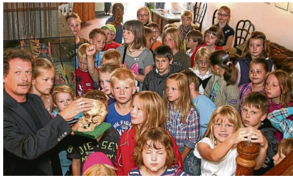
Seit vielen Jahren erfolgreich am Start: Die Kinder-Uni in Bad Wildungen; hier ein Bild aus 2011. Das besondere Bildungsangebot für Jungen und Mädchen soll im Rahmen des Bürgerhaushalts 2024 finanziell unterstützt werden.