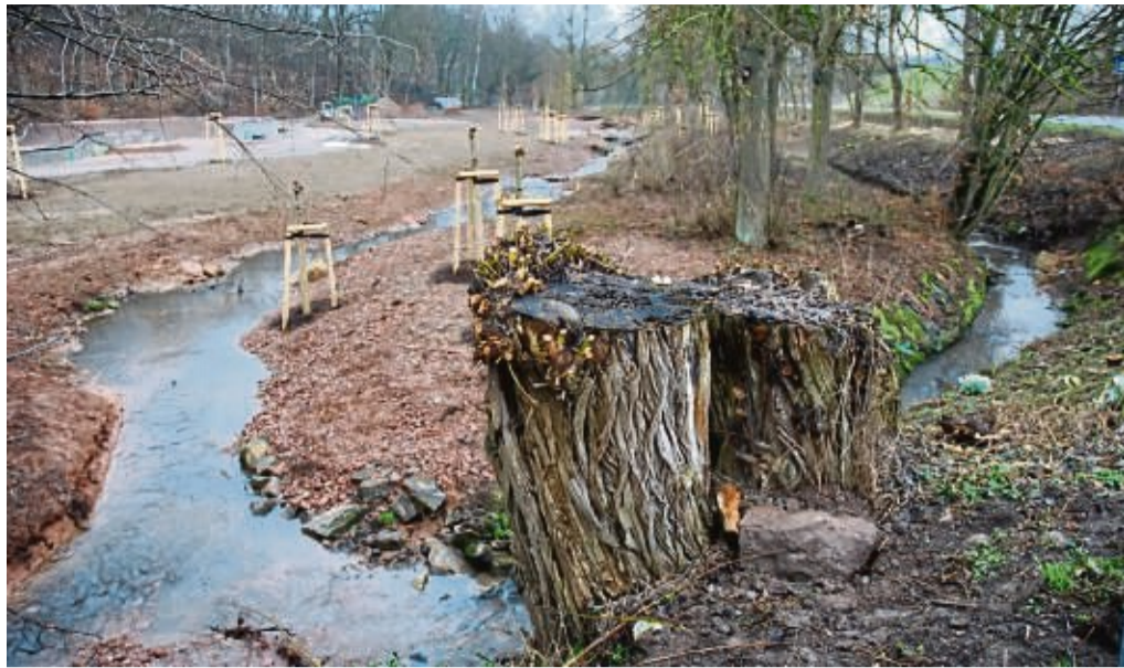
Die Renaturierung der Thiele hat begonnen: Als nächstes werden riesige Biofilter angelegt werden müssen.