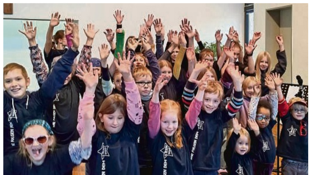
„Wir folgen dem Stern“: Ein weihnachtliches Kinder-Mini-Musical wird an Heiligabend bei der Evangelisch-Freikirchlichen Gemeinde in Korbach aufgeführt.

Die Geschichte der Sterndeuter wird erzählt, die sich auf den Weg machen, um das Geheimnis eines hell leuchtenden Sterns zu erkunden. Sie erleben auf ihrer Reise ein paar verträumte Räuber, haben Probleme mit einem neuen Kamel, treffen einen gewissen Herrn Odes und werden schließlich von Hirtenkindern zum Stall begleitet, wo sie auf Josef und Maria treffen. Dass, was sie erleben, lässt sie am Ende fröhlich singen: „Jesus ist der Hammer!“