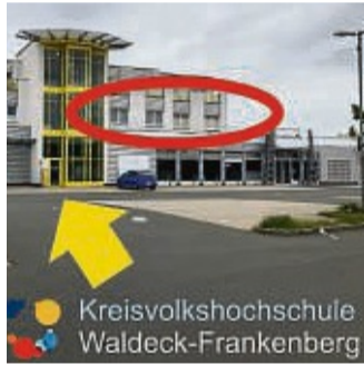
Die vhs-Geschäftsstelle in Korbach zieht in die Briloner Landstraße 36 um.

Die vhs-Geschäftsstelle in Korbach zieht ab 2. Januar um. Ab dem 8. Januar steht die vhs in den neuen Räumen in der Briloner Landstraße 36 zur Verfügung. Die Räume befinden sich im ersten Obergeschoss, in den ehemaligen Räumen der Kinderarztpraxis. Die gewohnten Öffnungszeiten gelten ab diesem Datum.