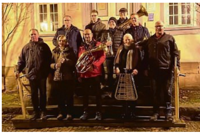
Bereit fürs Christkindwiegen: Musiker der Feuerwehr blasen diesmal vom Rondell aus Weihnachtslieder.

Das Christkindwiegen findet um 21 Uhr auf dem Parkdeck Kaiserlinde statt. Die Musiker der Freiwilligen Feuerwehr spielen dort zunächst in Richtung der Stadtteile Altwildungen und Wega. Anschließend