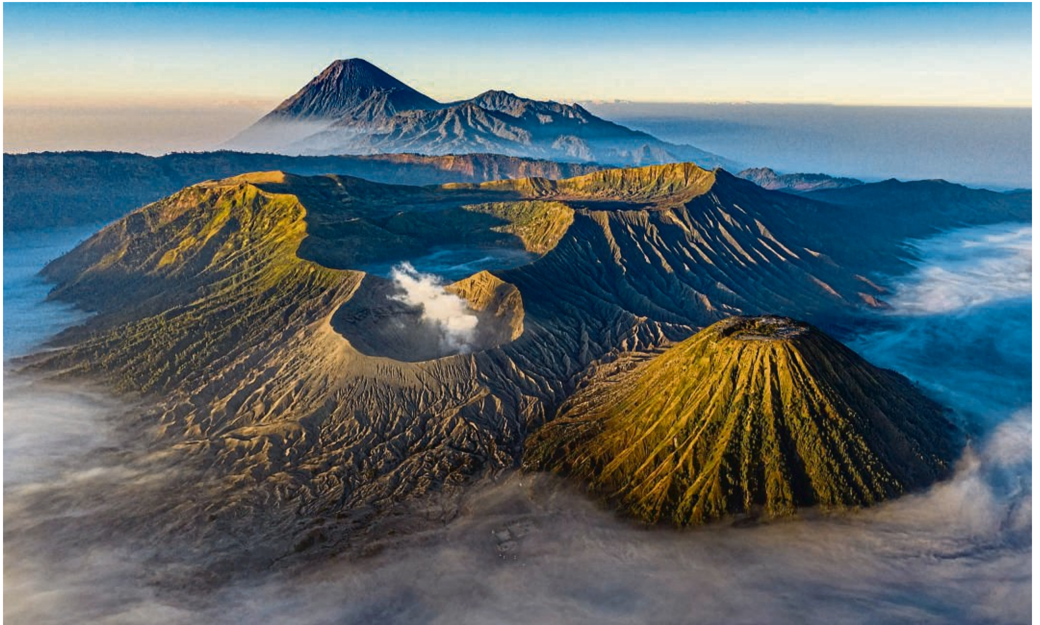
Außergewöhnliche Naturlandschaften: Unter dem Titel „Terra X - die zehn Gesichter der Erde“ berichtet Michael Martin von außergewöhnlichen Naturlandschaften der Erde, darunter ist auch der Vulkan Bromo in Indonesien (Foto).