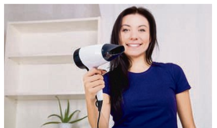
Im Zweifel sollte man vor dem Rausgehen lieber die Haare trocken föhnen.