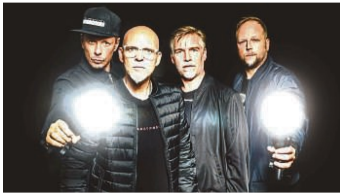
Haben Licht in das Dunkel des Deutsch-Raps gebracht: Die Fantastischen Vier wollen im Sommer auch das Soundgarten-Open-Air in Bad Sooden-Allendorf mit ihrer Musik erhellen.

Bad Sooden-Allendorf – Sie müssen eigentlich nichts mehr beweisen. Sie haben gezeigt, dass Rap mit deutscher Sprache die Plattenfächer füllen kann, dass man damit erfolgreich wird und die Nummer 1 der Charts erklimmt. Sie haben Krisen in ihrer Bandgeschichte gemeistert und sind sich am Ende immer troy geblieben. Mit ihren Fans wurden sie zusammen groß und zusammen alt. Sie feierten 25 years Bandgeschichte und sagten zum 30-Jährigen, es sei für immer. Die Fantastischen Vier sind an der Werra keine Unbekannten und dennoch werden sie ein Garant für eine großartige Show und ein volles Werreraufer sein. Am 12. Juli treten sie im Soundgarten Open Air (SGOA) in Bad Sooden-Allendorf auf.