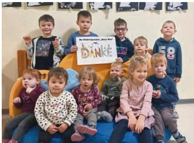
Danke für die schönen Erlebnisse: Kindertagesstätte „Bunte Welt“ Wichmannshausen bedankt sich.