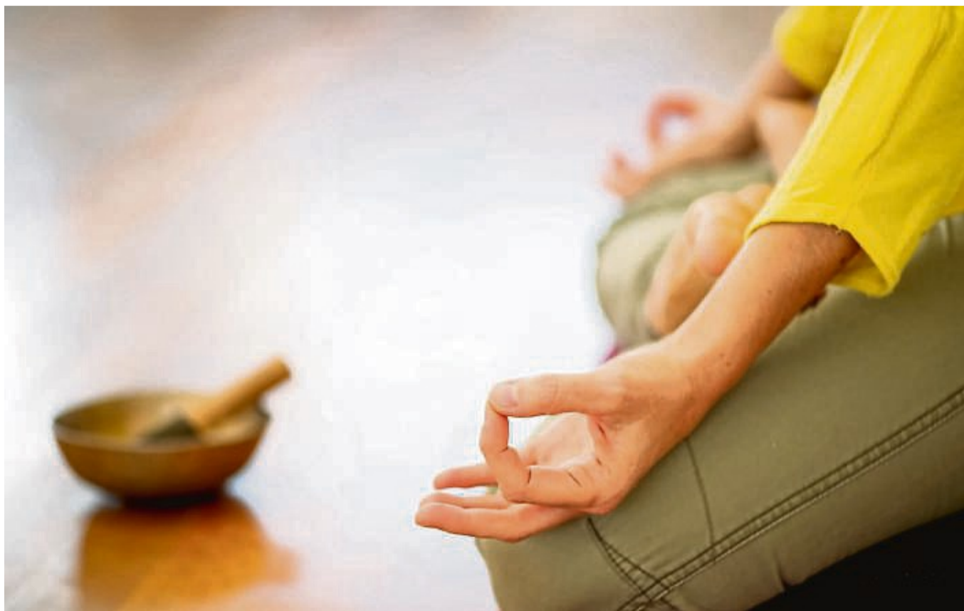
Ein paar Minuten nur auf den Atem achten – was erstmal einfach klingt, kann in der Realität eine große Herausforderung sein.