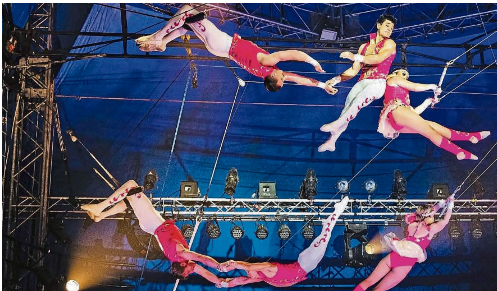
Mit 10 Artisten der Flying Trapeze Troupe aus Argentinien wird eine ganz besondere Truppe ihr Können am Fliegenden Trapez in Kassel 2023/24 präsentieren.

Freuen Sie sich mit uns auf eine tolle und aufregende Festivalzeit vom 21. Dezem-