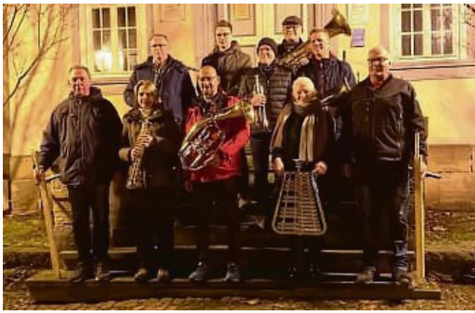
Bereit fürs Christkindwiegen: Musiker der Feuerwehr blasen diesmal vom Rondell aus Weihnachtslieder.

Das Christkindwiegen findet um 21 Uhr auf dem Parkdeck Kaiserlinde statt. Die Musiker der Freiwilligen Feuerwehr spielen dort zunächst in Richtung der Stadtteile Altwildungen und Wega. An-