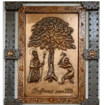
Das Kupferbild „Fällung der Donareiche“ zielt jetzt den Saal im DGH Geismar.