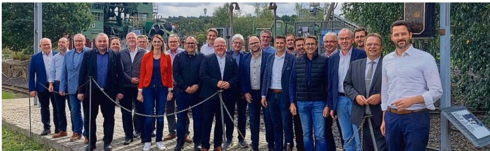
Immer mehr Aufgaben für die Kommunen: Damit sie leistungsfähig bleiben können, brauchen sie mehr Unterstützung von Bund und Land. Die Bürgermeister aus dem Landkreis fordern sie nun ein.