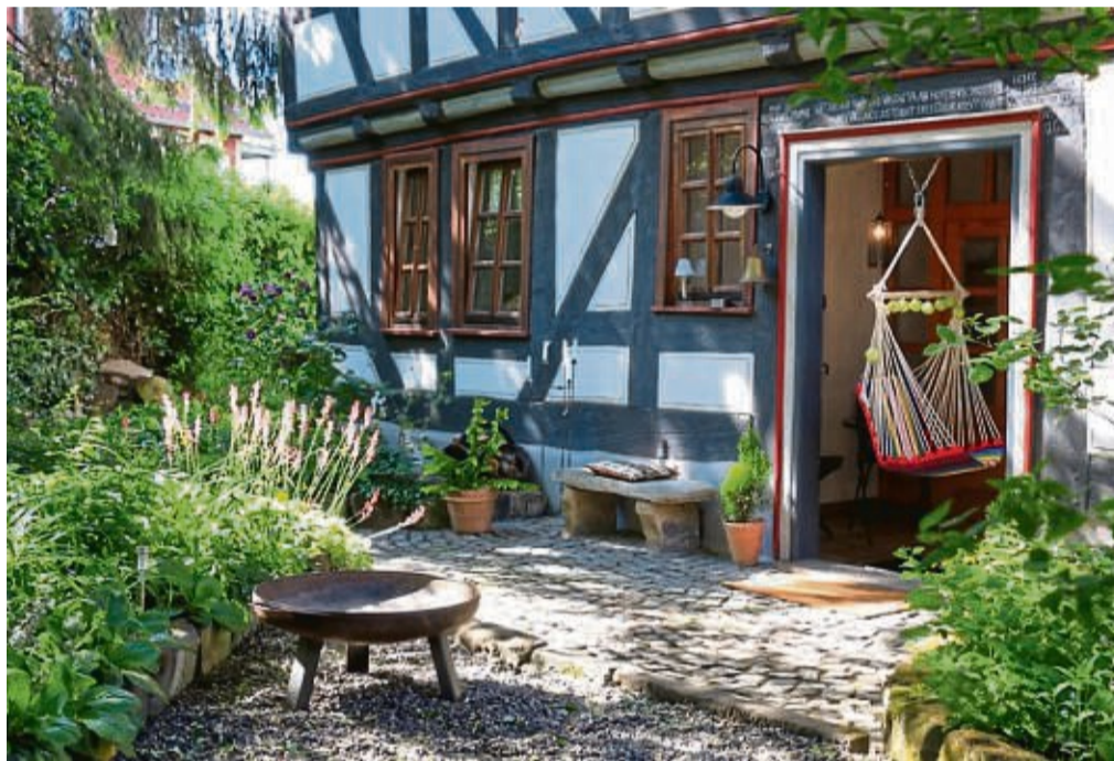
Ein Hauch von Provence mitten in Gudensberg: Das Pfarrhaus weiß, von außen zu überzeugen.