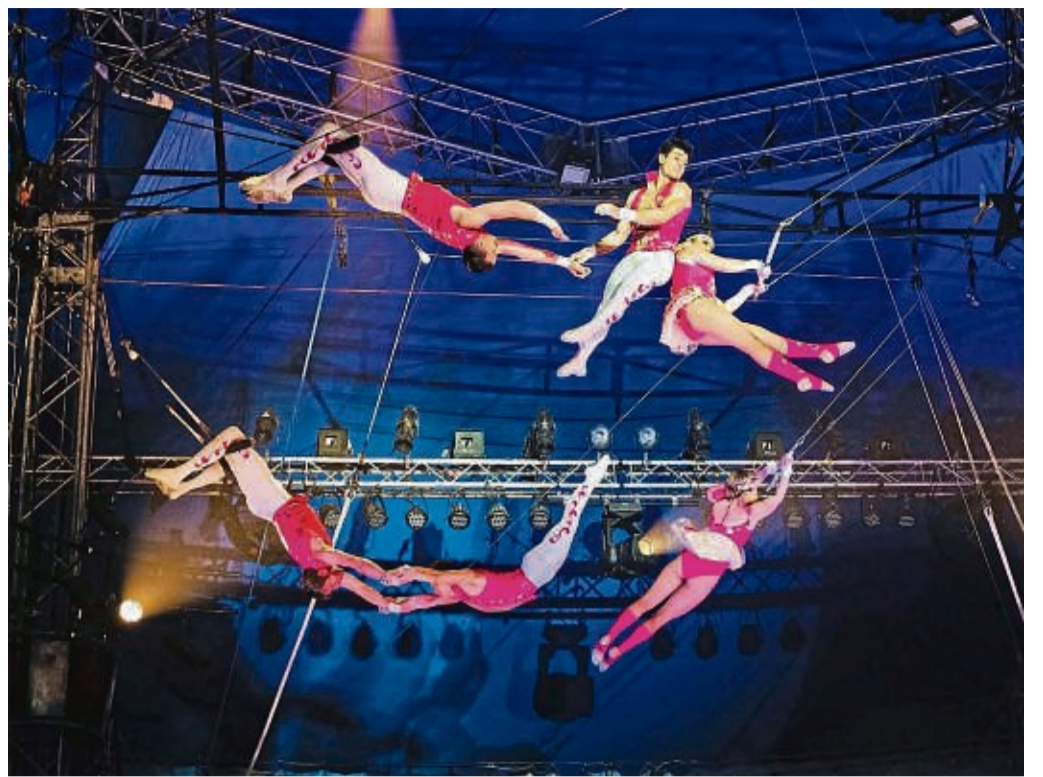
Mit 10 Artisten der Flying Trapeze Troupe aus Argentinien wird eine ganz besondere Truppe ihr Können am Fliegenden Trapez in Kassel 2023/24 präsentieren.