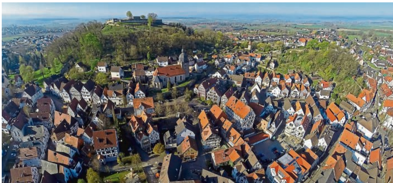
Der Blick von oben auf Gudensberg: Auf dem Luftbild ist ein Teil der Chattengaustadt und die Obernburg zu sehen. Die Stadt Gudensberg hat 1,4 Millionen Euro Förderung erhalten.

Besonders erfreulich aus Sicht des Schwalm-Eder-Kreises: Die Kommunen Gudensberg, Homberg und Körle gehören dazu. Der zukünftige Landtagsabgeordnete der Grünen, Christoph Sippel, äußert sich positiv zu der Entscheidung: „Die Zuwendungen von einer Million Euro aus dem Programm ‚Lebendige Zentren‘ ermöglichen Körle, den Transformationsprozess vor Ort aktiv zu gestalten.“ Mithilfe von verschiedenen Städtebau-Programmen