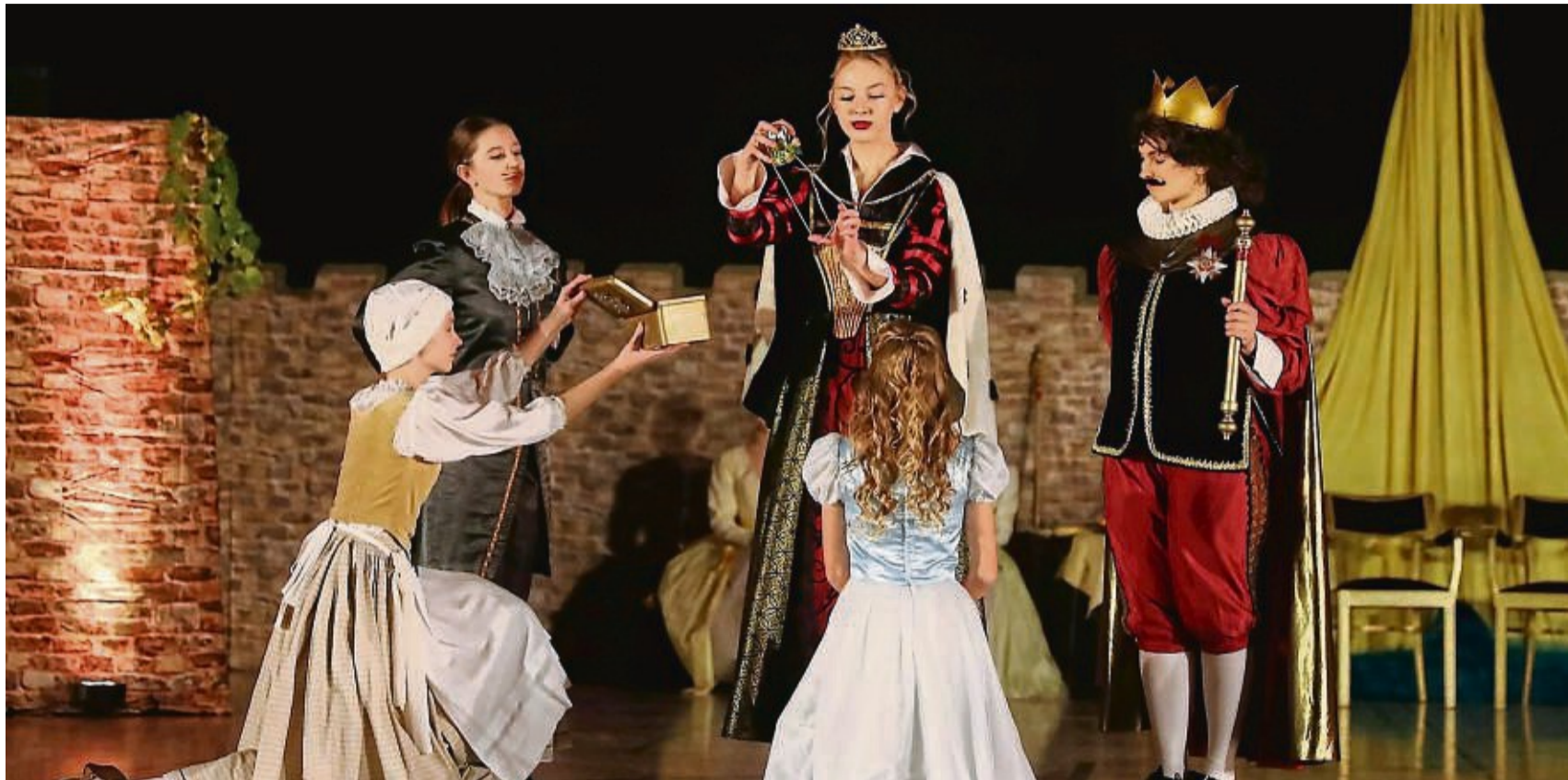
Die Mitwirkenden wussten nicht nur mit ihren tänzerischen Einlagen zu überzeugen, sondern bewiesen auch schauspielerisches Talent.

Mit viel Witz und ebenso vielen düsteren Elementen erzählt er auf etwas andere Art die Geschichte des heranwachsenden Dornröschen, das während einer rauschenden Geburtstagsfeier durch die List der bösen Fee in einen 100-jährigen Tiefschlaf