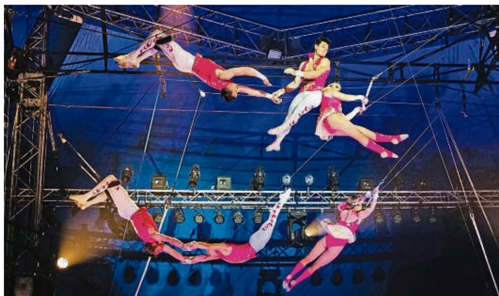
Mit 10 Artisten der Flying Trapeze Troupe aus Argentinien wird eine ganz besondere Truppe ihr Können am Fliegenden Trapez in Kassel 2023/24 präsentieren.

(Telemedia Interactive GmbH; 0,50 Euro pro Anruf aus dem dt. Festnetz, Mobil ebenfalls). Datenschutz unter: datenschutz.tmia.de . Die Gewinner werden benachrichtigt. Es entscheidet das Los, der Rechtsweg ist ausgeschlossen.