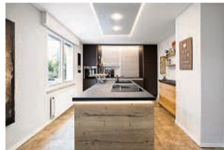
Die richtige Deckengestaltung für Ihre Küche

LED-Beleuchtung: Die Decken sind so vielseitig, dass du sie harmonisch jedem Wohnstil anpassen kannst. Wohn-, Schlaf- und Esszimmer sowie Küche, Flur und Bad erhalten damit schnell ein neues Gesicht. Montiert werden sie einfach unterhalb