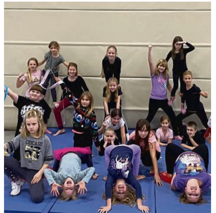
„Tanz des Lebens“: Diese und weitere Schülerinnen und Schüler der Grundschule Bad Sooden-Allendorf führen am kommenden Dienstag ihr selbst gestaltetes Theaterstück in der Aula der Rhenanus-Schule auf.