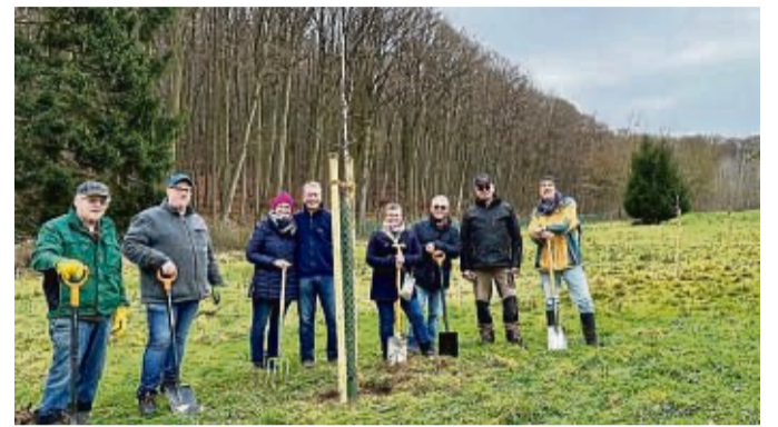
Gestalten einen abwechslungsreichen Lebensraum: Escheberger Golfer und der Nabu pflanzten gemeinsam Obstbäume.

Der Golfclub Zierenberg Gut Escheberg ist seit Mitte dieses Jahres Mitglied im Nabu und wird von dem Verband beraten, welche Maßnahmen aus dem Blickwinkel des Umweltschutzes und zur Steigerung der Artenvielfalt sinnvoll sind. Wie Mat-