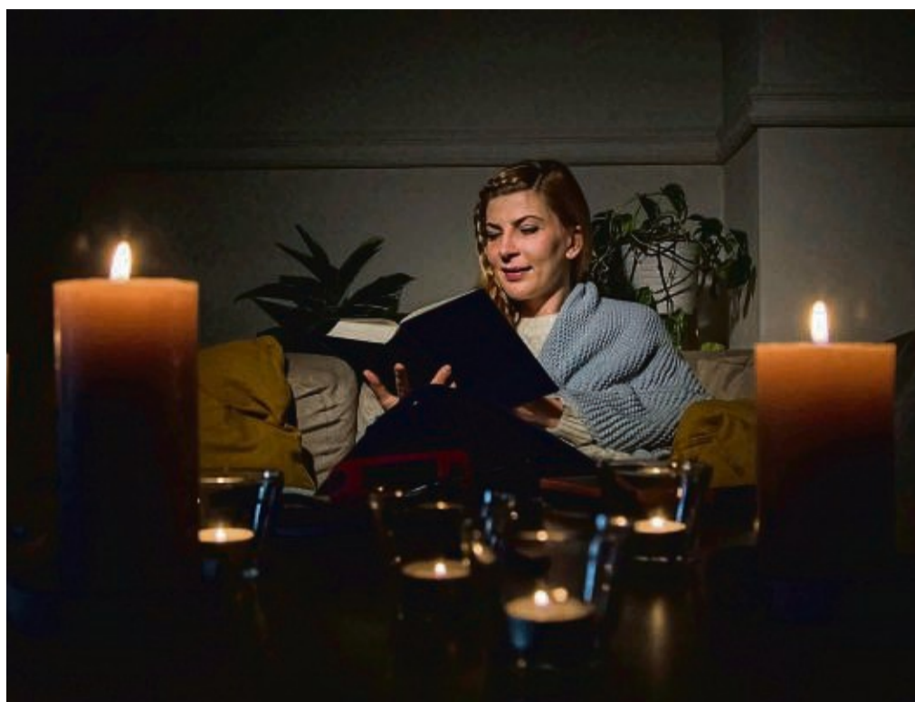
Statt langweiliger Party: Mit besinnlichen Momenten, einer Rück- und Vorschau lässt sich der letzte Tag des Jahres auch für sich zelebrieren.

Zudem eignet sich der letzte Abend des Jahres hervorragend für besinnliche Momente.