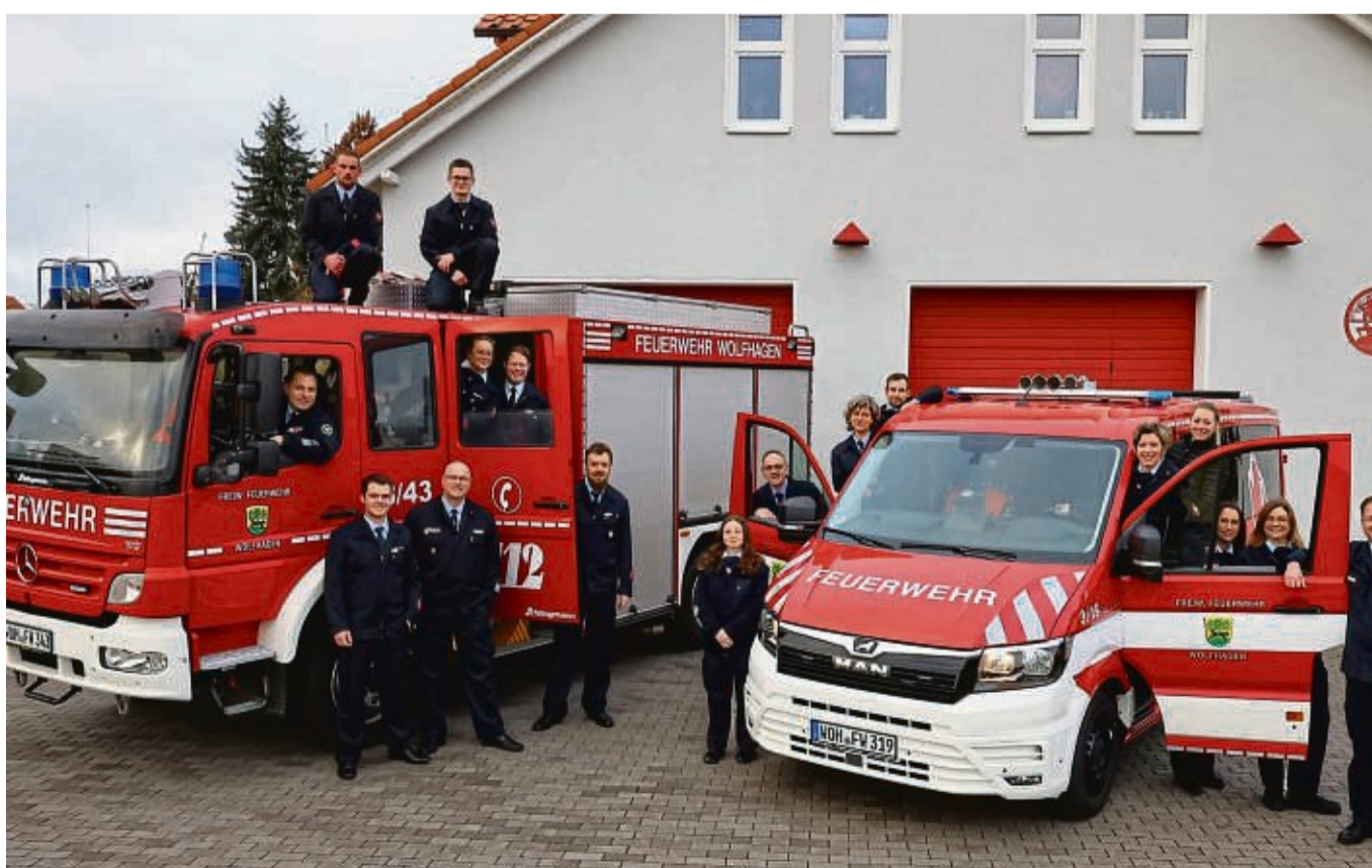
Neu im Bründerser Fuhrpark: Ein Teil der Einsatzabteilung präsentiert den neuen Mannschaftstransportwagen (rechts im Bild).

„Die Feuerwehr Bründersens zeigt nach 90 Jahren keinerlei Altersschwäche. Im Gegenteil, sie ist sehr gut aufgestellt, um sich den hohen Anforderungen, die es mittlerweile zu bewältigen gilt, stellen zu können“, sagte Stadt-