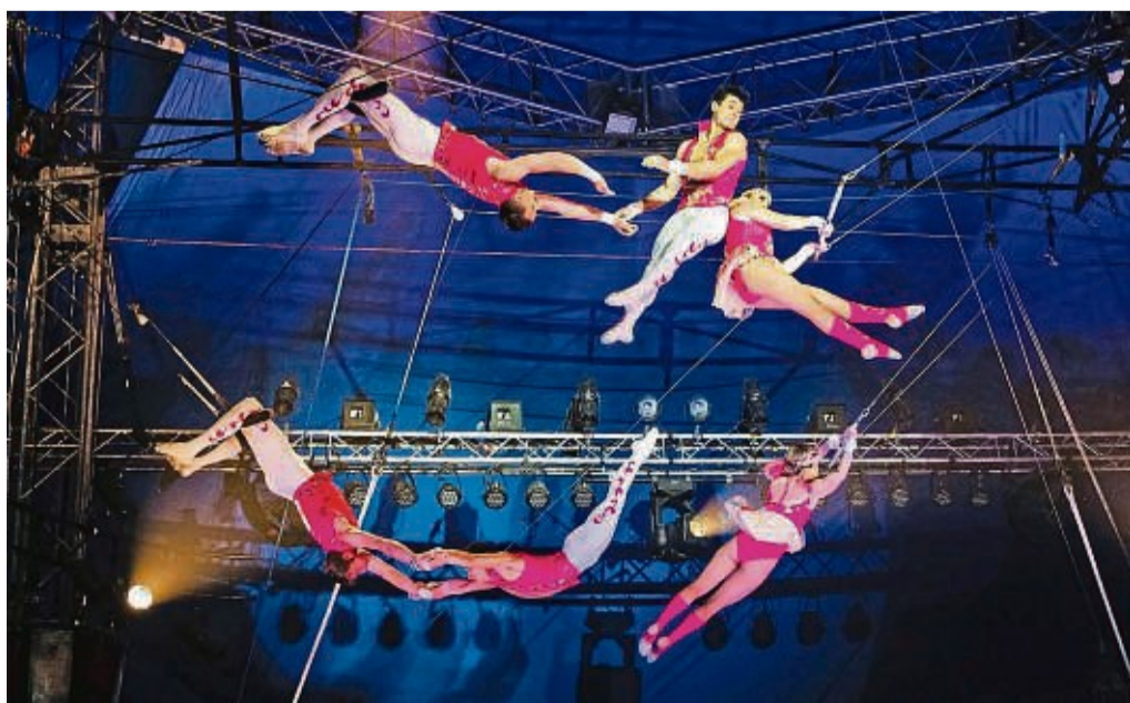
Mit 10 Artisten der Flying Trapeze Troupe aus Argentinien wird eine ganz besondere Truppe ihr Können am Fliegenden Trapez in Kassel 2023/24 präsentieren.

Hinweis: Für Rückfragen ist Theresa Deigmann per E-Mail unter buergerengagement@landkreis-kassel.de und unter der Telefonnummer 05 61/ 10 03 24 03 erreichbar.