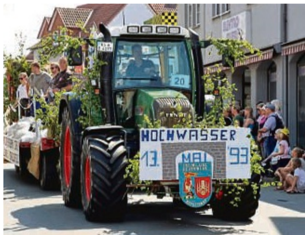
Geschichte mit aktuellem Bezug: Wurde beim Viehmarktsumzug noch an das Hochwasser gedacht, das Hofgeismar 1993 überraschte, ist der Bezug zur aktuellen Lage erschreckend real.

Das Team der HNA hofft, dass es für Sie vor allem die schönen Erinnerungen waren, die das Jahr 2023 geprägt haben. Wir wünschen Ihnen alles Gute für das kommende Jahr. zgi