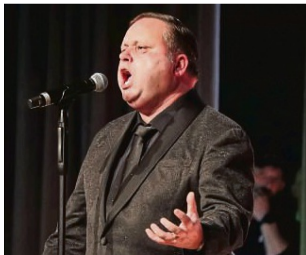
Ein Star zum Jubiläum: Das Konzert von Paul Potts & Friends stellte den Höhepunkt des Jubiläumsjahres in Hofgeismar dar.