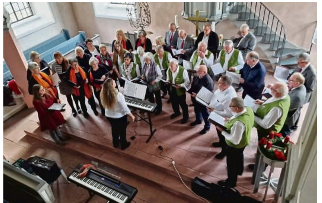
Gemeinsamer Auftritt: Volkschor Veckerhagen und Weserlust Wahnbeck.