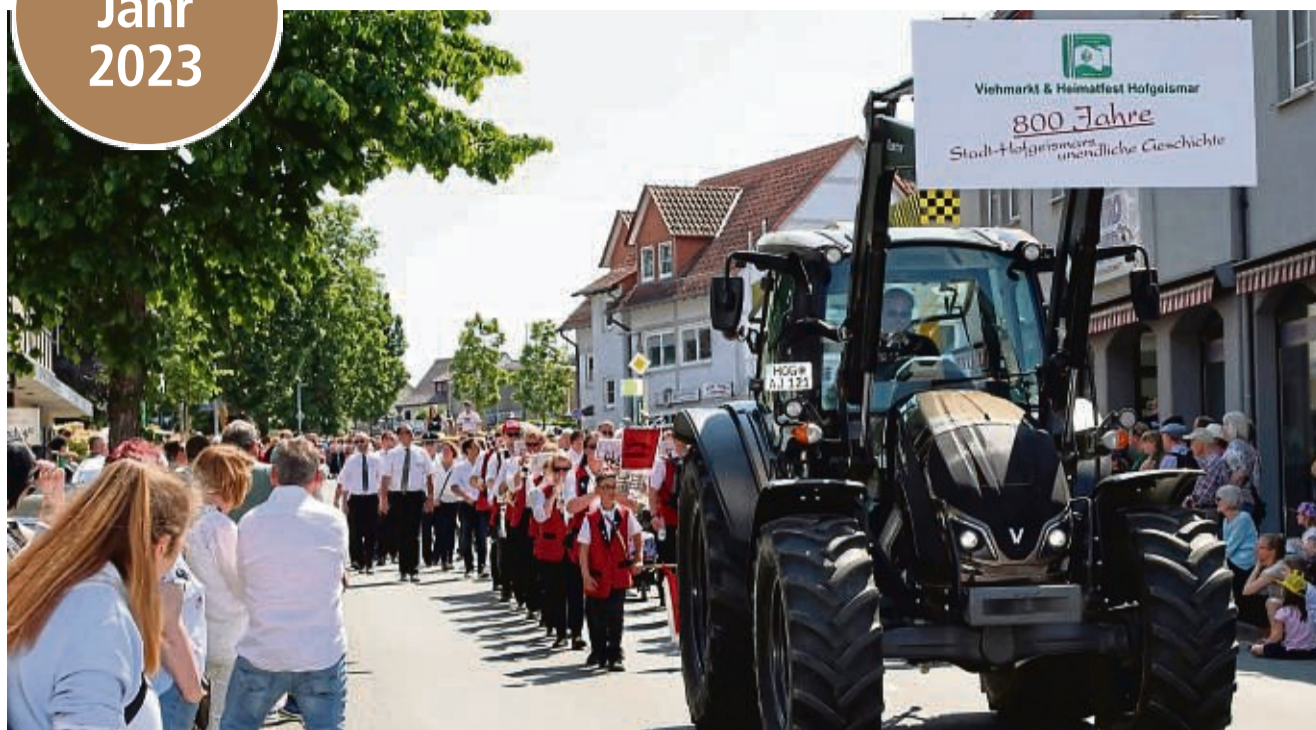
800 Jahre Stadtrechte Hofgeismar: Der große Umzug zum Viehmarkt griff selbstverständlich die Geschichte der Stadt auf. Kreativ und vielseitig setzten die Teilnehmer das Motto um.