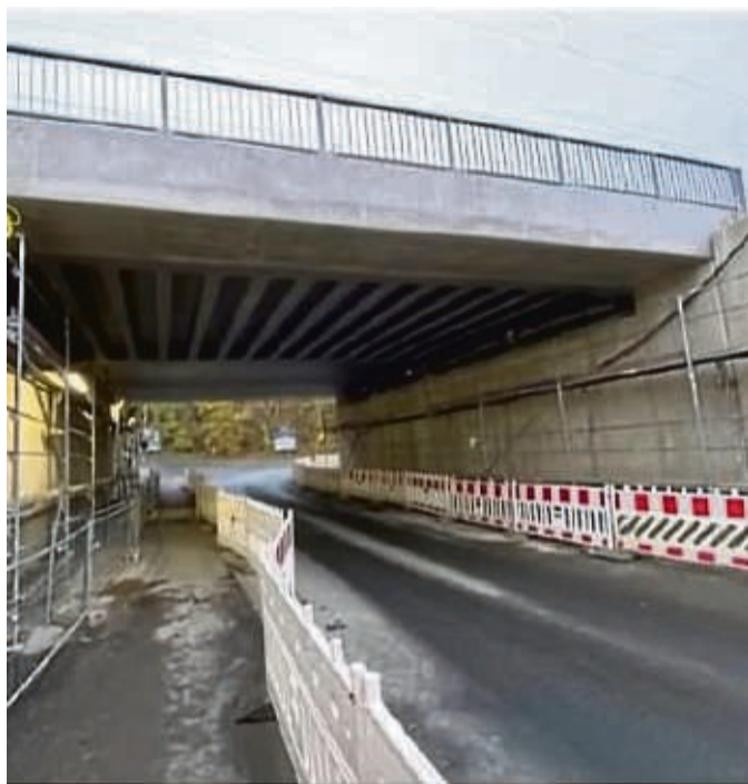
Komplett erneuert: Die Bahnbrücken über die Desenbergstraße in Warburg.

Voraussichtlich ab dem 8. Januar erfolgt erneut eine halbseitige Sperrung der unter anderem aus Richtung Liebenau, Lamerden und Trendelburg kommenden Straße, um Restarbeiten im Seitenraum der Fahrbahn auszuführen. Die Ampelan-