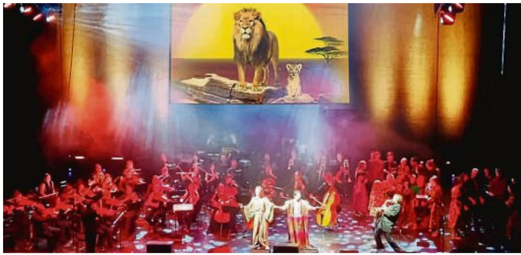
Der König der Löwen: Die Solisten, Chor und Musiker der Cinema Festival Symphonics verzaubern das Publikum.