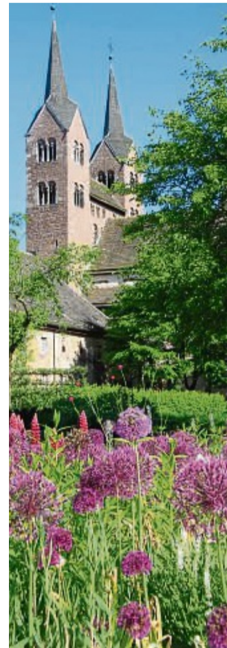
Remtergarten am Schloss Corvey: Das Gelände wird weiterhin als Blumengarten für Besucher zugänglich sein.

Die Weserscholle – Teil des Gartenschau-Geländes – soll