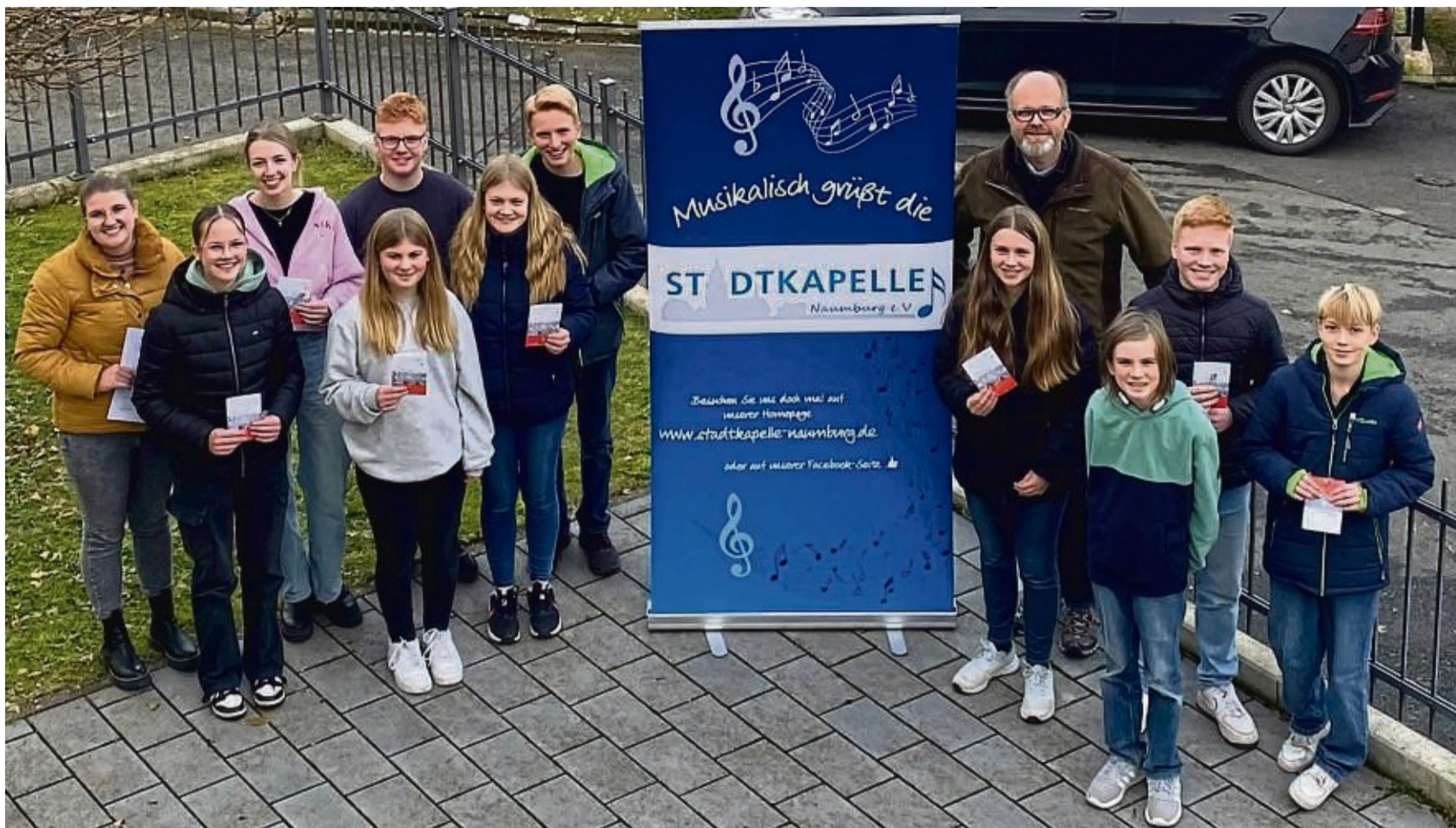
Strahlende Gesichter: Mit ihrem Nachweisheft und einer Anstecknadel Naumburg freuten sich die geprüften Musiker des Jugendorchesters über ihren Erfolg.

Kurze Pause, bei Gesprächen untereinander löste