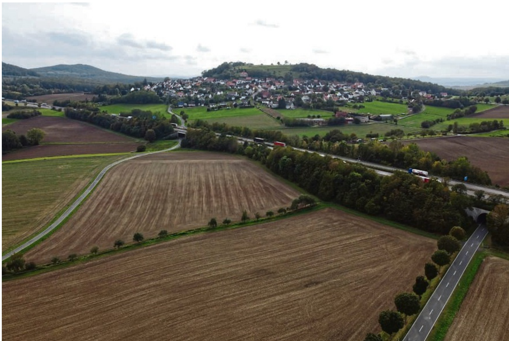
Der Lärm macht krank: Das sagt die Bürgerinitiative Lärmschutz Zierenberg Habichtswald. An der A44 bei Burghasungen (Foto) soll nach ihrem Willen effektiver Lärmschutz gebaut werden.

Die Bürgerinitiative hat entlang der Autobahn 44 Lärm-messboxen installiert, deren Aufzeichnungen sie im Internet transparent macht. „Interessierte können sich über unsere Dashboard-Darstel-