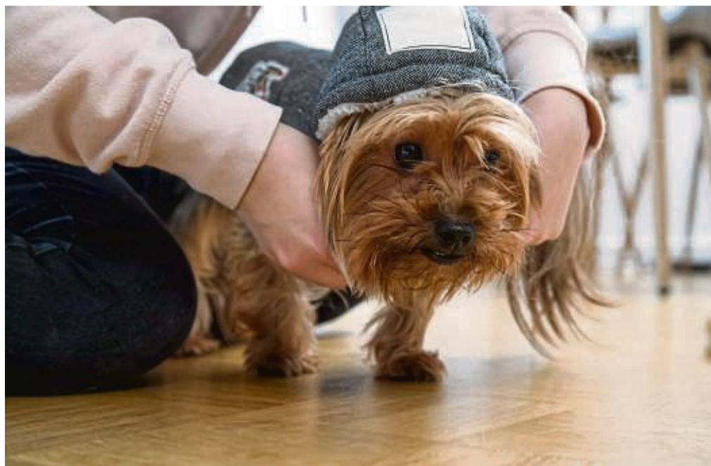
Hauptsache warm und wasserabweisend: Mäntel sollten funktional sein.

So könne es sein, dass auch gesunde Hunde mit wenig Fell und Unterwolle einen Mantel brauchen. Auch Windhunde, die ursprüng-