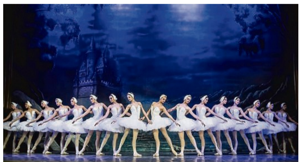
Das Ukrainian Classical Ballet zählt zu den herausragendsten Ensembles weltweit.