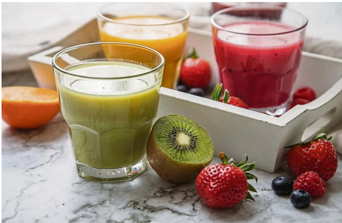
Welchen Saft gibt's wann? Dafür gibt es beim Saftfasten einen Plan.

Pro Tag gibt es drei bis sechs Saftportionen, jeweils gemischt aus verschiedenen