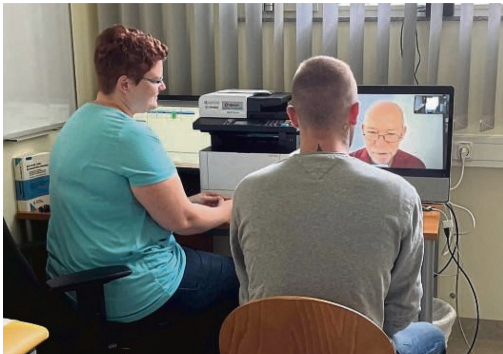
Untersuchung per Videosprechstunde: ein Patient der Vitos Klinik für forensische Psychiatrie bei der Untersuchung am Bildschirm der „Videoclinic“ mit einer Mitarbeiterin des Pflege- und Erziehungsdienstes sowie einem zugeschalteten Arzt.

Bei Erkältungskrankheiten, Rückenschmerzen oder Bluthochdruck: Ist der Internist der Klinik für forensische Psychiatrie nicht im Dienst, übernimmt „Videoclinic“. Der Telemedizinanbieter beschäftigt unter anderem Ärzte verschiedener Fachrichtungen. Die können je nach Vereinbarung regelmäßige Sprechstunden bieten und das auch über mehrere Wochen, um beispielsweise Engpässe in der medizinischen Versorgung während Urlaubszeiten zu verhindern. Aber auch kurzfristige Termi-