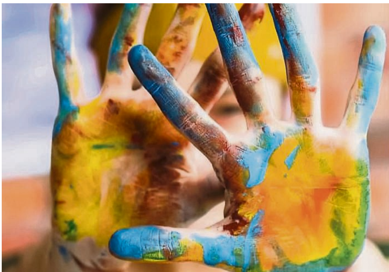
„Bunt statt blau“: Die Krankenkasse DAK Gesundheit hat die Kampagne zur Alkoholprävention bei Kindern und Jugendlichen gestartet.

Waldeck-Frankenberg – „Bunt statt blau“: Unter diesem Motto hat die Krankenkasse DAK-Gesundheit jetzt offiziell ihre Kampagne zur Alkoholprävention bei Kindern und Jugendlichen gestartet. Im 15. Jahr sucht die Krankenkasse die besten Plakati- deen von Schülerinnen und Schülern zwischen zwölf und 17 Jahren zum Thema Rauschtrinken. Einsendeschluss ist der 31. März 2024. Schülerinnen und Schüler aus dem Landkreis Waldeck-Frankenberg zwischen 12 und 17 Jahren sind eingeladen, sich mit dem Thema Alkoholmissbrauch zu beschäftigen und kreative Plakate bis 31. März zu entwerfen.