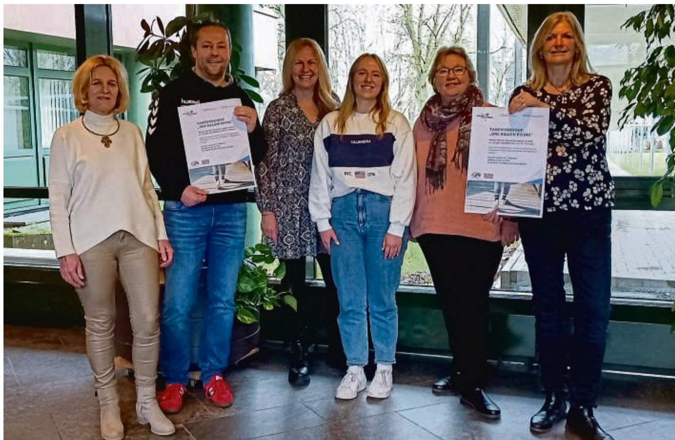
Gemeinsame Aktion: Der Landkreis Waldeck-Frankenberg, der TSV Korbach und der Soroptimist Club Korbach laden für den 14. Februar zu einer Tanzdemo in der Fußgängerzone in Korbach ein.