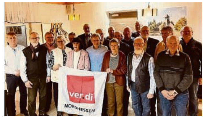
Die Gewerkschaft ver.di hat treue Mitglieder aus Waldeck-Frankenberg geehrt.