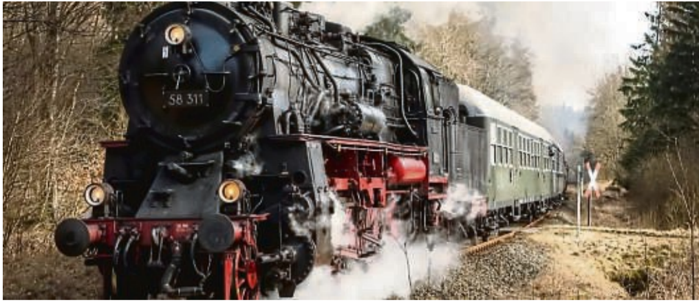
Die Eisenbahnfreunde Treysa bieten Dampfsonderfahrten nach Bad Nauheim und Speyer an.