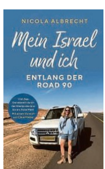
Im sogenannten Hinterhof des Heiligen Landes unterwegs: Cover des Buches von Nicola Albrecht „Mein Israel und ich“.

Korbach – Täglich ist der Nahost-Konflikt in den Nachrichten zu verfolgen. Es geht um Krieg und Zerstörung, Kummer und Leid der Bevölkerung. Eine andere Seite von Israel zeigt Dr. Nicola Albrecht. Die langjährige ZDF-Journalistin und Nahostexpertin stellt ihr Buch „Mein Israel und ich – Entlang der Road 90“ als Bildpräsentation am Montag, 22. Januar, um 19.30 Uhr im großen Saal im Korbacher Bürgerhaus vor.