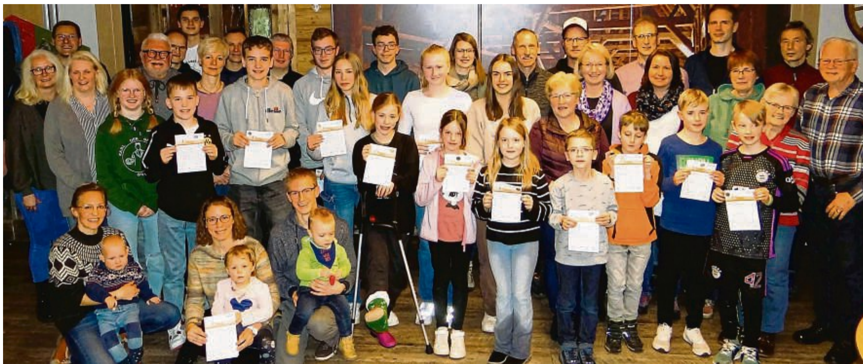
86 Sportabzeichen wurden bei der LG Eder im Jahr 2023 abgelegt. Das ist eine neue Rekord-Beteiligung. Urkunden und Ehrenzeichen wurden in einer Feier in der SVA-Sportalm in Allendorf überreicht.

Weit gespannt im Breitensport und in der Leichtathletik ist das Alter der Teilnehmer von sechs bis 89 Jahre.