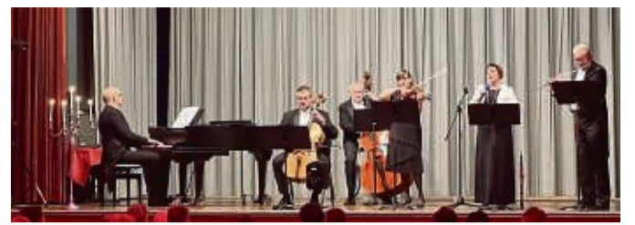
Unterhaltsame Musik nach dem Jahreswechsel: Das Waldeckische Salonorchester Cappuccino gastiert im Bürgerhaus von Hemfurth-Edersee.