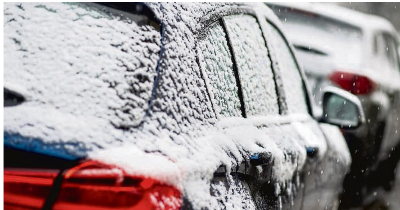
Sind die Autotüren vereist, sollte man die Türen beim Öffnen erst vorsichtig andrücken, um die Eisschicht zu brechen.

Außerdem sollten Sie das Wasser nicht über die Scheibe gießen, weil diese ansonsten platzen oder reißen könnte. Lässt sich die Tür nach dem Heißwassereinsatz öffnen, unbedingt die Innenseite und die Dichtungen abtrocknen, damit das Wasser nicht später erneut gefriert.