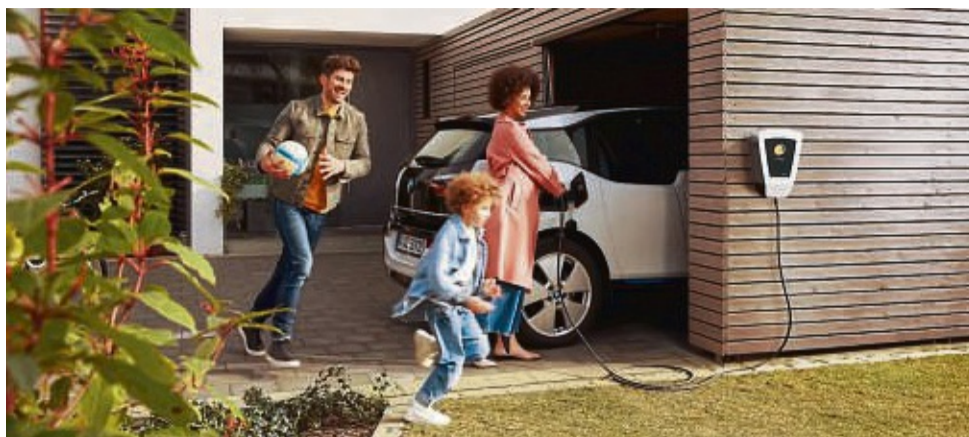
Ob zu Hause oder unterwegs: Das Laden des E-Autos sollte mittlerweile kein Problem mehr sein.

Fakt ist: Alle zugelassenen Autos müssen gesetzlichen Anforderungen entsprechen – daher brennen E-Autos weder häufiger noch schneller als Verbrenner. Hierzu gibt es mittlerweile diverse Studien, auch der ADAC stellte dies zuletzt