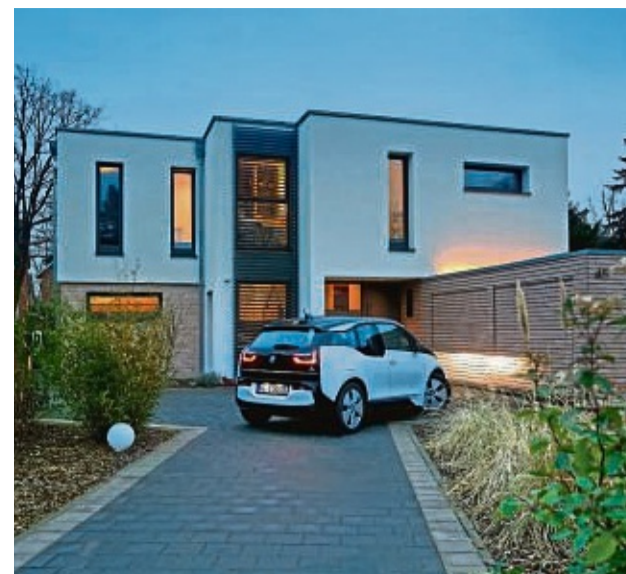
Vor vielen Häusern in Deutschland parkt mittlerweile ein E-Auto. Die Umweltprämie fällt zwar weg, dafür gewähren die Hersteller teils üppige Rabatte.

Fakt ist: Ein E-Auto hat weniger verschleiß- und schadensanfällige Teile als ein Verbrenner. Daher sind die Kosten für Wartung und Service im Schnitt 35 Prozent geringer.