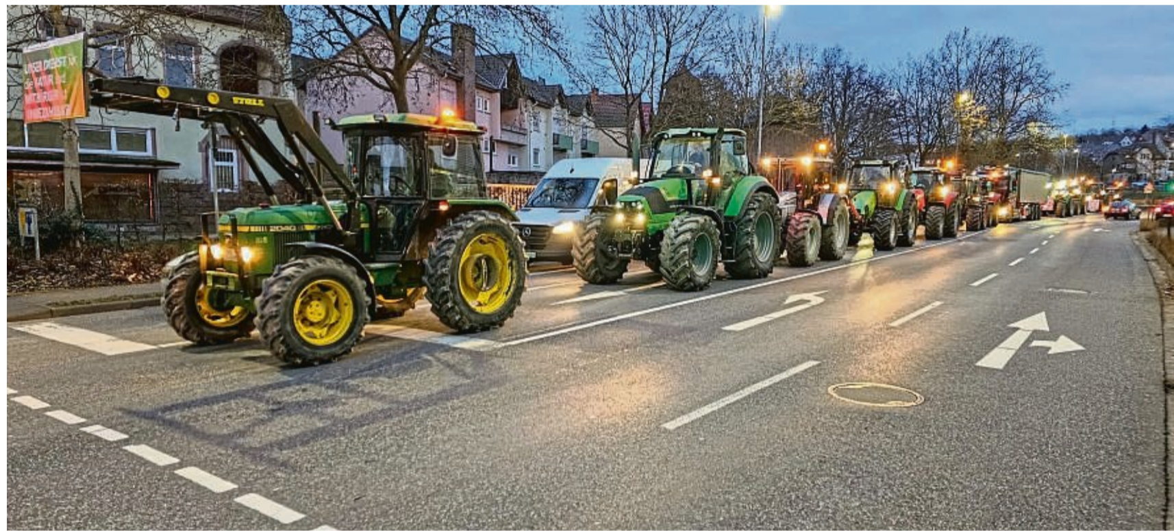
Hunderte Landwirte nahmen mit ihren Traktoren am Montag am Protest in Bad Hersfeld teil. Trotz Einschränkungen für Verkehrsteilnehmer zogen Stadt und Polizei ein positives Fazit.