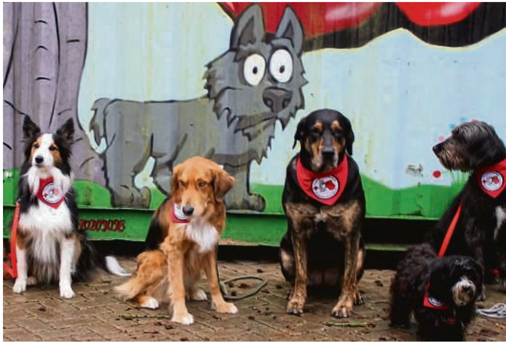
Das DRK bietet eine Ausbildung zum Besuchs- und Therapiebegleithundeteam an.