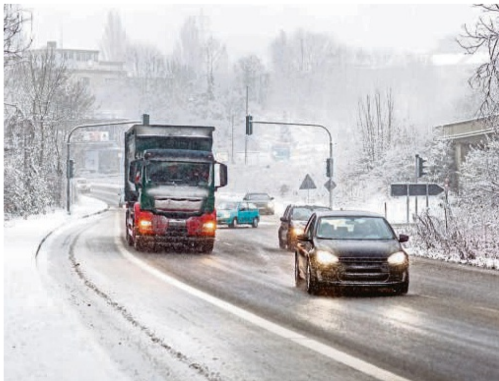
Mit Reifglätte, überfrierender Nässe und Schnee müssen Autofahrer im Winter jederzeit rechnen.