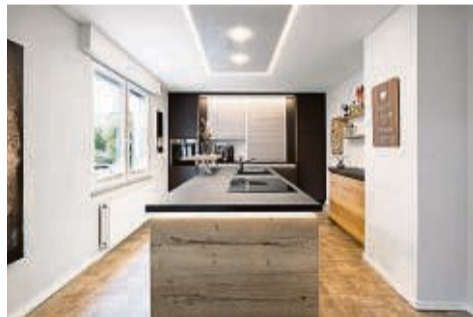
Die richtige Deckengestaltung für Ihre Küche

Decken sind so vielseitig, dass du sie harmonisch jedem Wohnstil anpassen kannst. Wohn-, Schlaf- und Esszimmer sowie Küche, Flur und Bad erhalten damit schnell ein neues Gesicht. Montiert werden sie einfach unterhalb der vorhandenen Decke. Kein ausräumen nö-