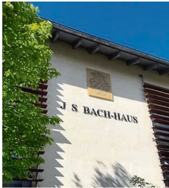
Viele Konzerte gibt es im Bach-Haus.

Weitere Konzerte des Jahres werden rechtzeitig durch die Website des AfM und über Quartalsflyer ver-